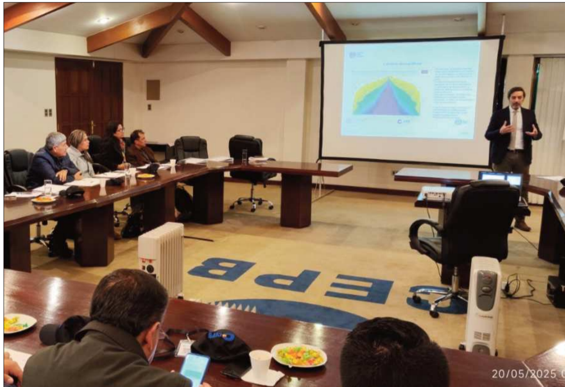
POSICIÓN. Una junta de los empresarios privados de Bolivia en una de sus sedes a nivel nacional.

EMERGENCIA El pronunciamiento también cuestiona la falta de compromiso con el interés nacional y alerta que los efectos económicos no se limitarán al periodo de bloqueos, sino que se extenderán durante meses e incluso años, impactando en el empleo, ingresos de familias y la inversión.