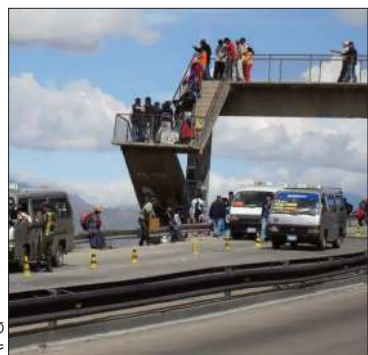
Vehículos transitan en autopista.

El sector expresó su desacuerdo con las posturas de la COB