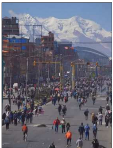
Uno de los bloqueos en El Alto.