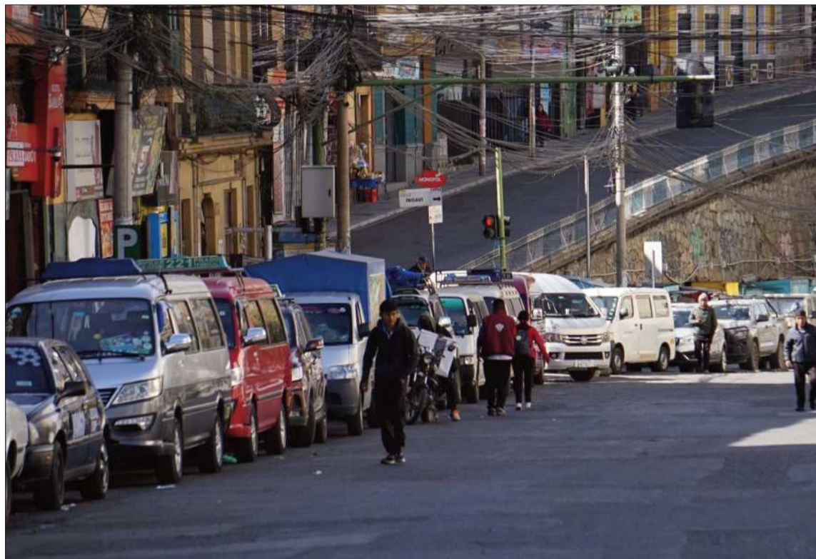
DEMANDA. Las colas en La Paz en busca de combustibles por parte de los conductores no cesan.

que dedican varios días a conseguir combustible y apenas cuentan con tiempo para trabajar. La situación también repercute en los usuarios, que enfrentan mayores tiempos de espera y dificultades para encontrar transporte.