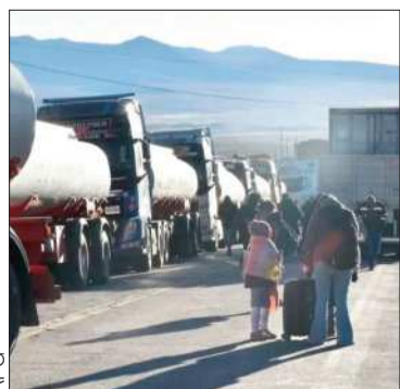
Cisternas en un bloqueo.

El mandatario defendió su gestión en medio de conflicto y la crisis del país