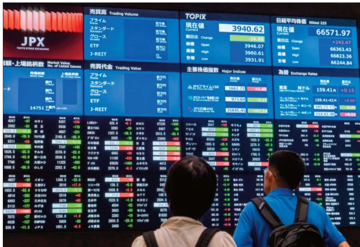
INDICE. El mercado internacional reaccionó a la falta de avances en el diálogo entre ambas naciones.

"Las conversaciones continúan, a un ritmo rápido, con la República Islámica de Irán", dijo Trump en su cuenta de Truth Social. La expectativa estaba en que se llegara a un acuerdo antes del fin de la semana pasada. Pero esa perspectiva parece alejarse, así como la esperanza de un regreso