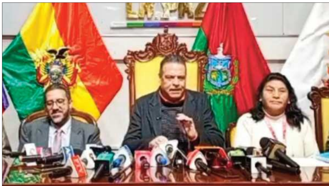
INFORME. El gobernador de La Paz, Luis Revilla, junto a su equipo en conferencia de prensa.

Bloqueos. Este martes se cumplen 33 días de bloqueos de carreteras