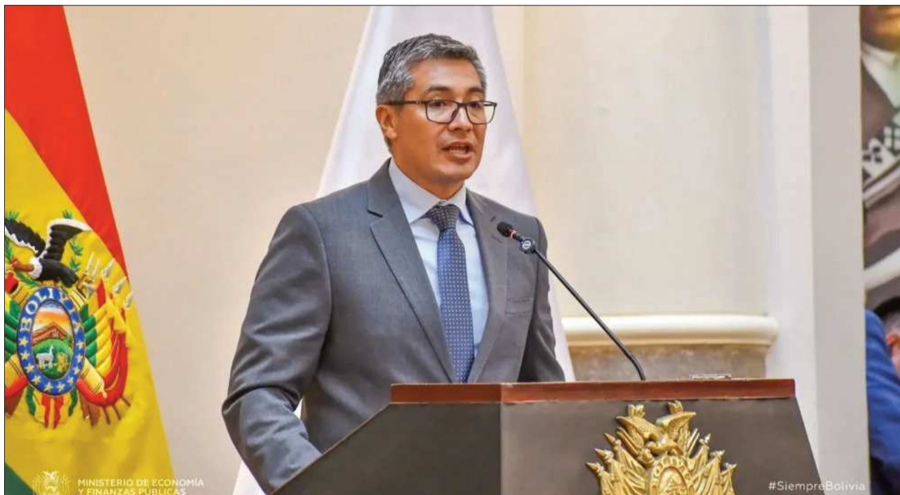
MIN. DE ECONOMÍA