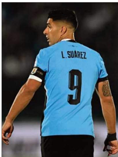
El delantero uruguayo Luis Suárez.

El duelo alteño se jugará desde las 15.00 por la fecha 10.