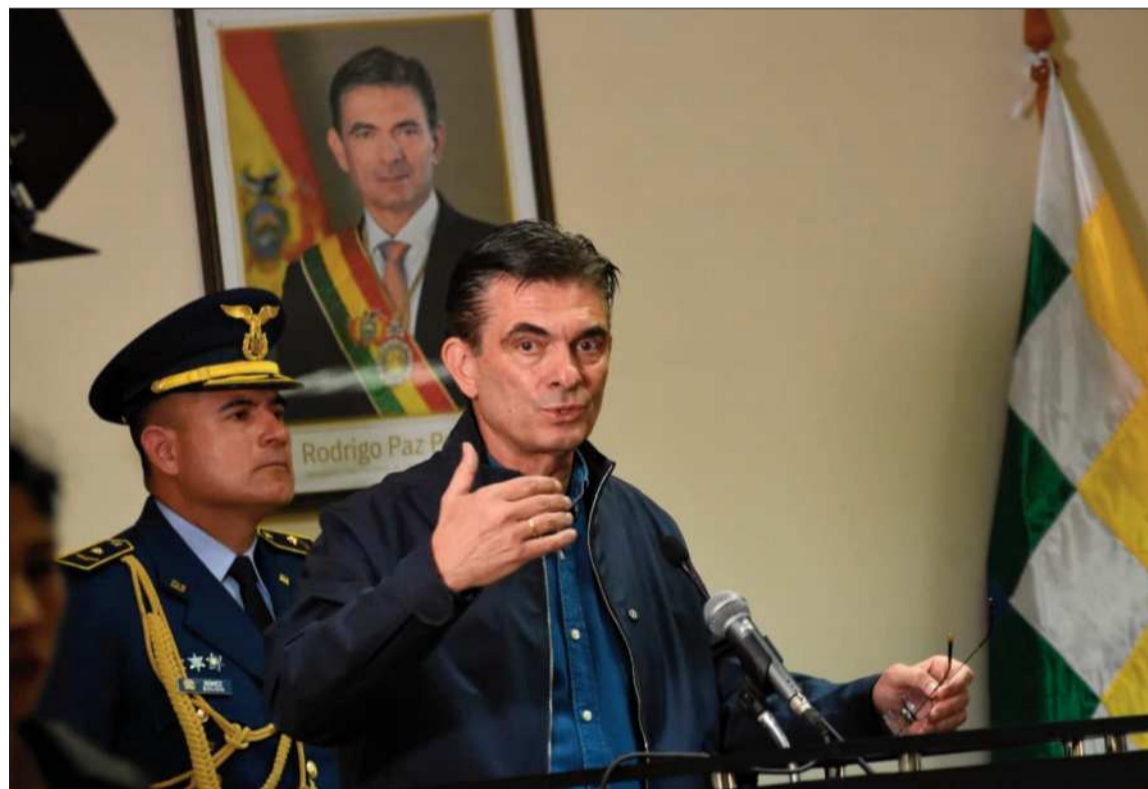
MANDATARIO. El presidente Rodrigo Paz en el acto de lanzamiento de la Ley de Alivio Tributario.