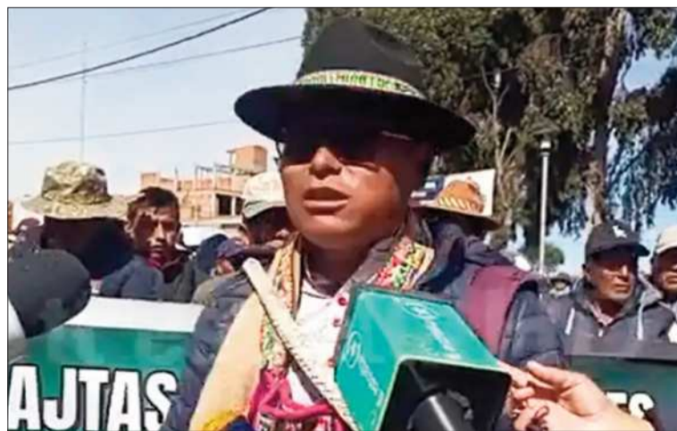
Campesinos de La Paz lanzaron una amenaza a la sede de gobierno.

Un dirigente campesino cuestionó a la FFAA sobre su rol en desbloques