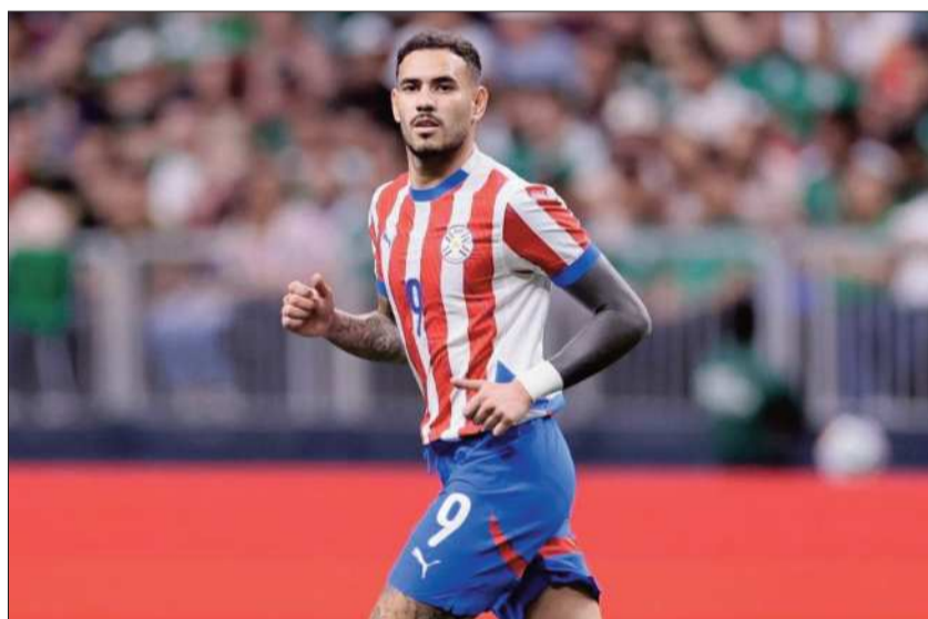
ALBIRROJOS. Uno de los jugadores paraguayos en la etapa de eliminatoria.