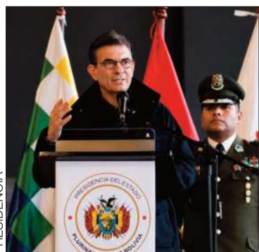
El presidente Rodrigo Paz Pereira.

El mandatario volvió a desmentir la privatización de las empresas estatales