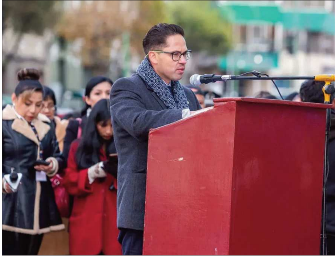
ADVERTENCIA. El presidente de la CNI, Gonzalo Morales, participa de la iza de la bandera de La Paz.

Reiteró que el sector industrial apuesta por el diálogo como mecanismo para resolver el conflicto y