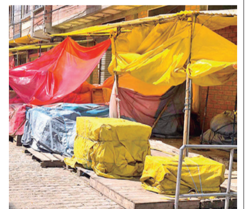
Mercados desabastecidos en la ciudad de La Paz.