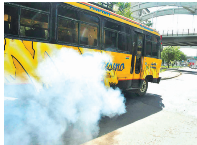
El parque automotor agrava la contaminación. CARLOS LÓPEZ

acumulada durante al menos dos días", explicó.