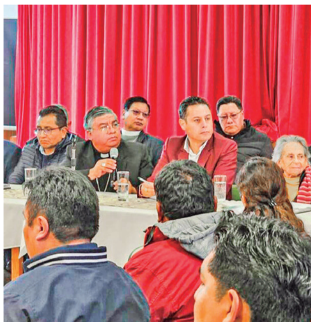
La última sesión de Comisión del Diálogo. MIN PUBLICO

La asistencia de la central sindical nacional al encuentro pacificador es dudosa puesto que el ampliado que ayer debía de-