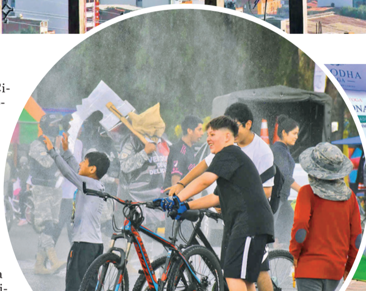
Niños y jóvenes disfrutaron el Día del Peatón. JOSÉ ROCHA

"Las nueve horas de restricción vehicular ayudan a disminuir la contaminación