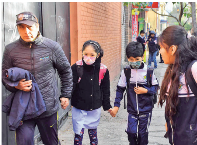
La población vulnerable se protege en invierno.

Dato. El Día del Peatón se realiza en los municipios de Cercado y Sacaba con actividades recreativas y restricción vehicular de 9:00 a 18:00, mientras la Red MoniCA advierte incremento de contaminación por el invierno