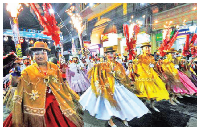
La festividad del Gran Poder, en La Paz.

Zaratti señaló que los bloqueos obligaron a pos-