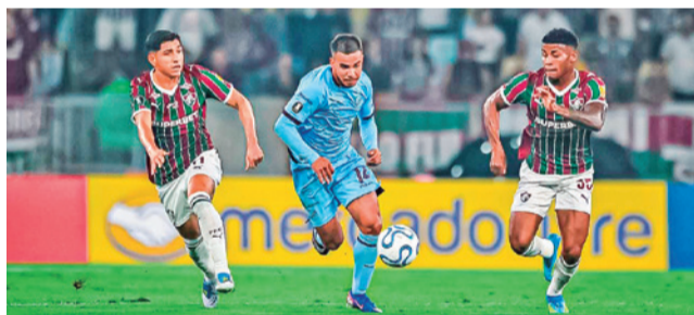
Escena del partido Fluminense Vs. Bolívar.