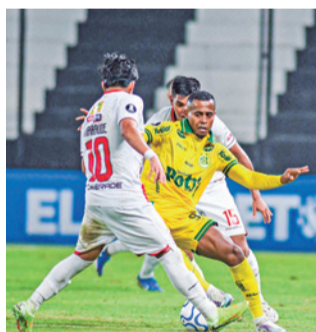
Always Ready ante Mirassol. RRSS