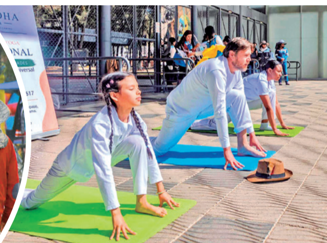
Ciudadanos realizan actividades al aire libre.