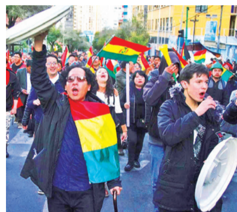
Una marcha contra los bloqueos en la sede de Gobierno. AHORA EL PUEBLO