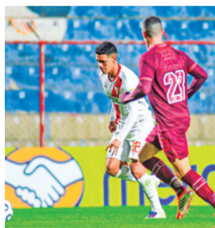
Lanús Vs. Always Ready en acción.

Always Ready fue peor, rivalizó contra el ecuatoriano Liga Deportiva Universitaria de Quito, el brasileño Mirassol y el argentino Lanús. Ganó un cotejo y perdió cinco; solo sumó tres unidades.