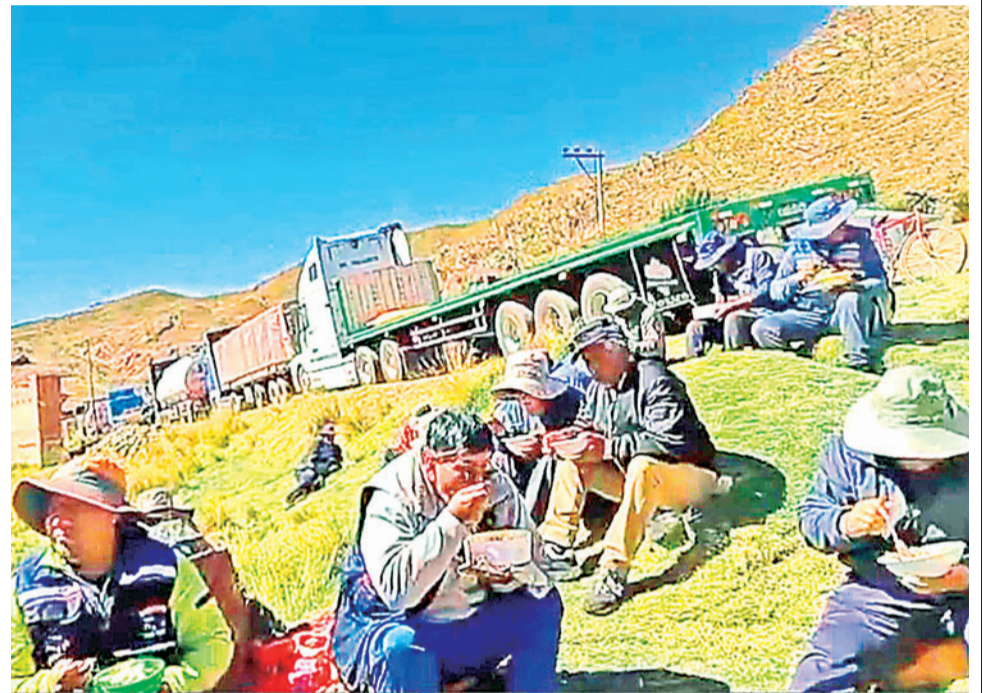
Los perjuicios que ocasionó el cerco a la ciudad de La Paz. CDTC

La fundación Unir insta a diferenciar las informaciones falsas que pueden avivar los conflictos