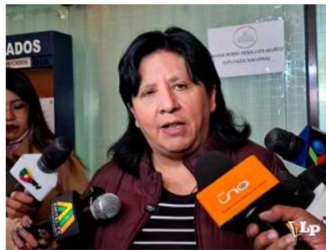
La diputada Bilbao pidió mejorar el control en las cárceles

La diputada criticó que esta situación persista desde hace años y exigió al Ministerio de Gobierno y al Régimen Penitenciario que implementen controles más estrictos. Además, sugirió una reglamentación para evitar la circulación de elementos