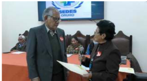
Sedes Oruro certificó a 23 instituciones como ambientes 100% libres de humo de tabaco