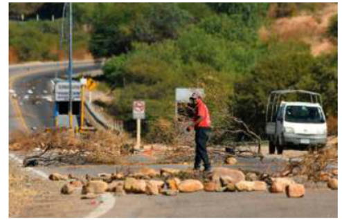
Bolivia cierra mayo con 94 puntos de bloqueos en el territorio nacional

Finalmente, defendió la legitimidad del mandato del Presidente Rodrigo Paz recordando que fue elegido con 54,61% de los votos: más de 3,3 millones de electores. En este sentido, pidió respeto al orden democrático y llamó a evitar cualquier escenario confrontacional.