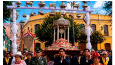
La procesión de la Sagrada Custodia con la Hostia Divina solo se realiza en cuatro ciudades del mundo, incluyendo en Potosí