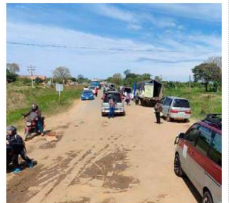
El objetivo es reinstalar una mesa de diálogo este lunes 1 de junio a las 19:00 horas