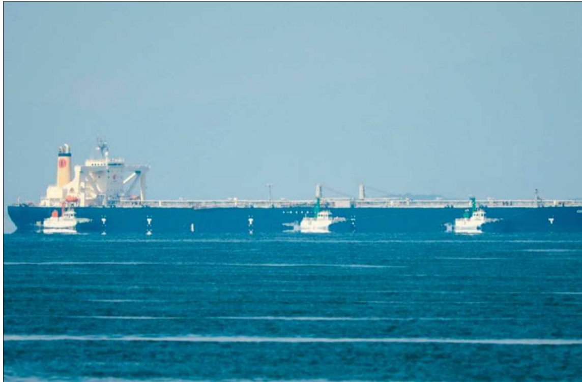
CONFLICTO. Desde el inicio de la guerra entre Irán y EEUU el paso por el estrecho está cerrado.

En su comunicado, las cuatro instituciones recordaron que “si bien la economía mundial sigue mostrando resistencia, los efectos del conflicto afectan de manera desproporcionada a los países más vulnerables”, debido al aumento de los precios del petróleo y de los fertilizantes. Durante las reuniones del FMI y del BM, a me-