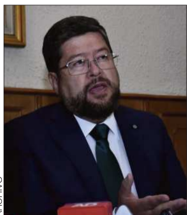
El político Samuel Doria Medina.

El empresario sostuvo que las medidas empiezan a debilitarse en La Paz