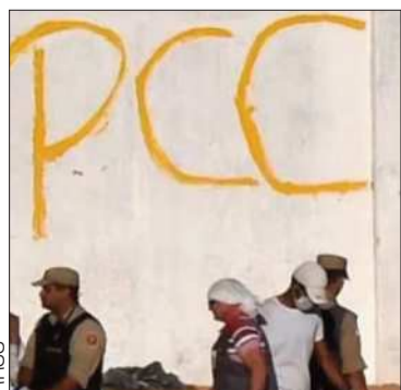
Paredes pintadas por el PCC.