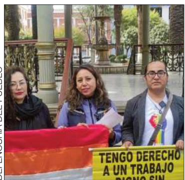
Miembros del colectivo LGBTIQ+.

El 73% de las denuncias por vulneraciones son a personas trans