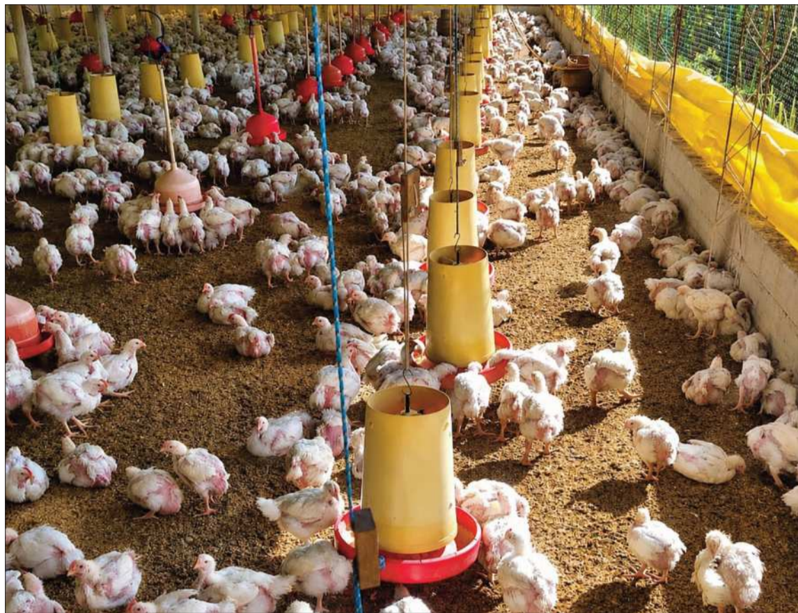
PRODUCCIÓN. Una granja de pollos en el municipio de Pocona en el departamento de Cochabamba.

Morales reveló que hace ocho días se solicitó formalmente al ministro de Gobierno la apertura de un corredor humanitario para