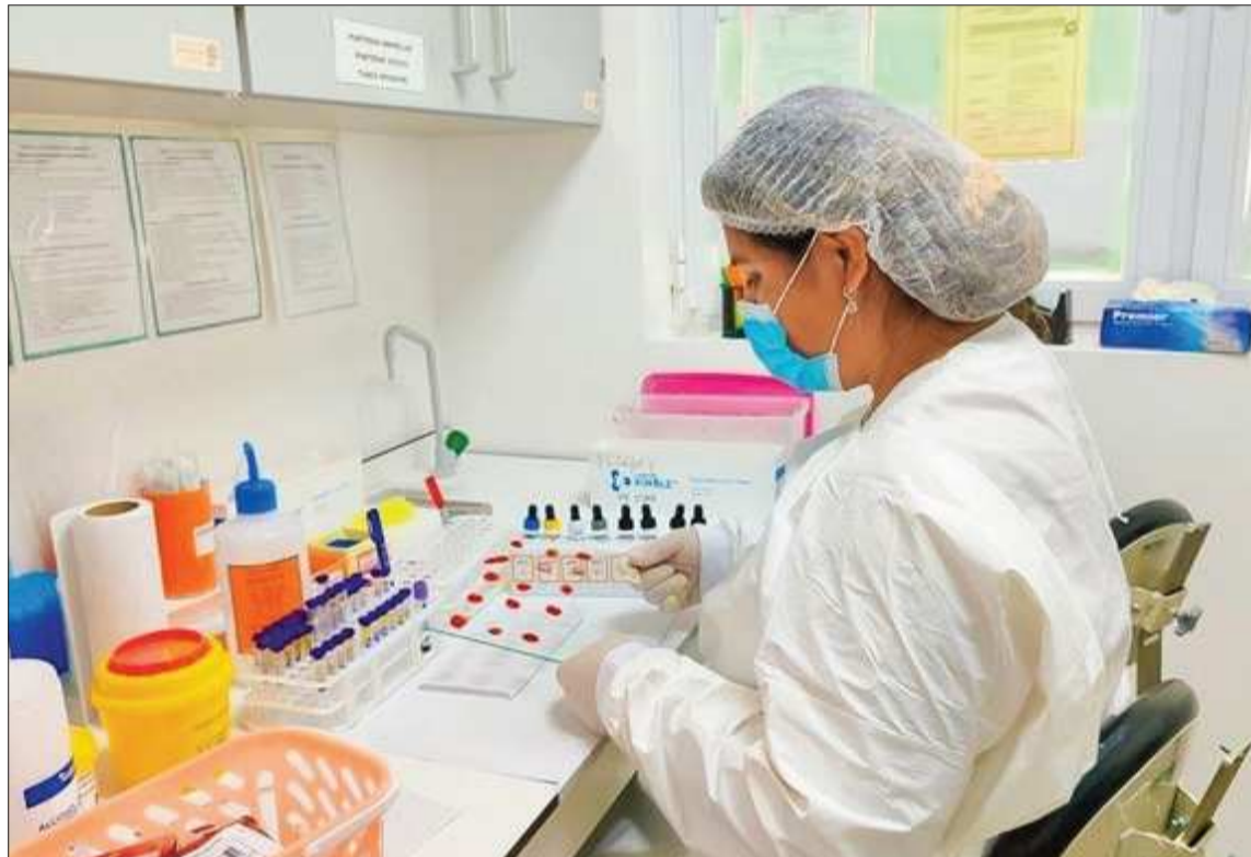
BANCOS. Los centros son encargados de extraer, procesar y almacenar sangre y sus componentes.

Finalmente recomendaron a la población a realizar donacio-