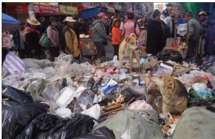
BASURA. Por los bloqueos se formaron varios promontorios.

funcionaria. Sobre los conflictos con los pobladores que bloqueaban las rutas principales, la autoridad señaló que el panorama fue complejo, pero se resolvió de forma pacífica. “Ha sido algo conflictivo, pero con el diálogo pudimos solucionarlo. Nos colaboraron los compañeros de los distritos y logramos concientizarnos de que este servicio debe ser continuo.