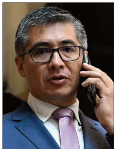
El ministro José Gabriel Espinoza.

La autoridad explicó que la reglamentación se encuentra en etapa final