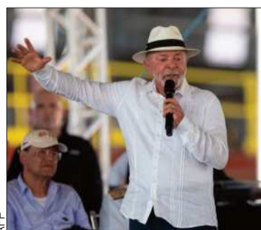
El presidente expresó su molestia.

El mandatario rechaza la declaratoria de EEUU contra el PCC y el CV