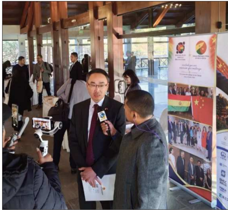
CHINA. El embajador de China en Bolivia, Wang Liang, en el foro.

Los representantes de las empresas participantes expresaron que aprovecharán el foro como una oportunidad para acelerar la coordinación de proyectos y promover la materialización de más resultados de cooperación mutuamente beneficiosa.