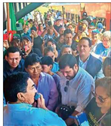
La inauguración del servicio.

El tren volvió a retomar sus operaciones en la región chiquitana