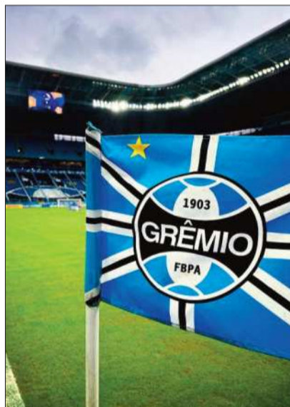
El escudo de Gremio en su estadio.

en caso de superar a Gremio, en octavos de final jugará frente al poderoso São Paulo Futebol Clube.