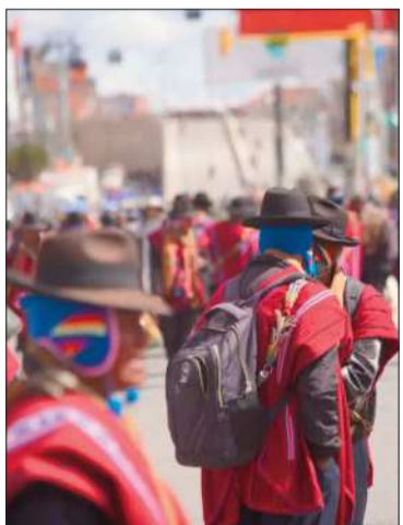
Los campesinos se movilizan.

Sectores condicionaron su asistencia a la anulación de capturas