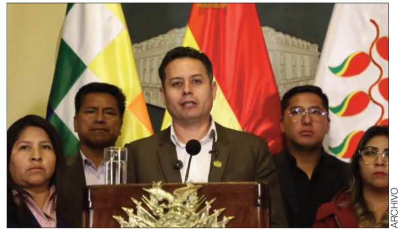
DIÁLOGO. El vicepresidente Edmand Lara brinda una conferencia.

Advirtió que, si no hay decisiones y acciones inmediatas desde el gobierno, la quinta semana de conflicto puede abrirse con un país más golpeado, menor paciencia social y una crisis política cada vez más difícil de contener.