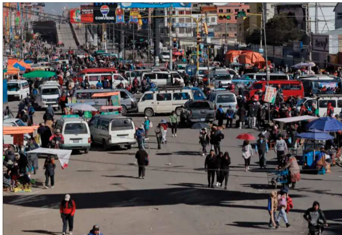
CONFLICTO. Un punto de bloque instalado en un distrito de la ciudad de El Alto.

La tensión se profundiza cuando hoy se cumplen 30 días de movilizaciones en distintos puntos del país. En las últimas jornadas, varios sectores endurecieron su discurso y condicionaron cualquier negociación al tratamiento de sus deman-