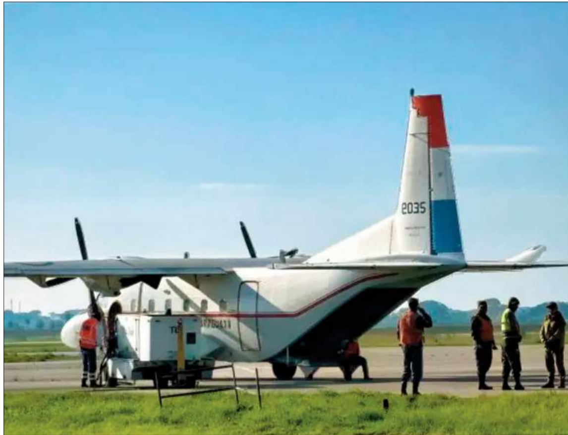
SOLIDARIDAD. El avión paraguayo que trasladó toneladas de ayuda humanitaria a Bolivia.

Días después, Perú envió cuatro toneladas de alimentos de primera necesidad, mientras Brasil anunció ayuda humanitaria tras una conversación entre los