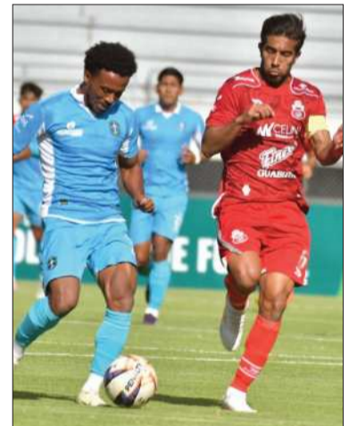
Acción del San Antonio-Guabirá.