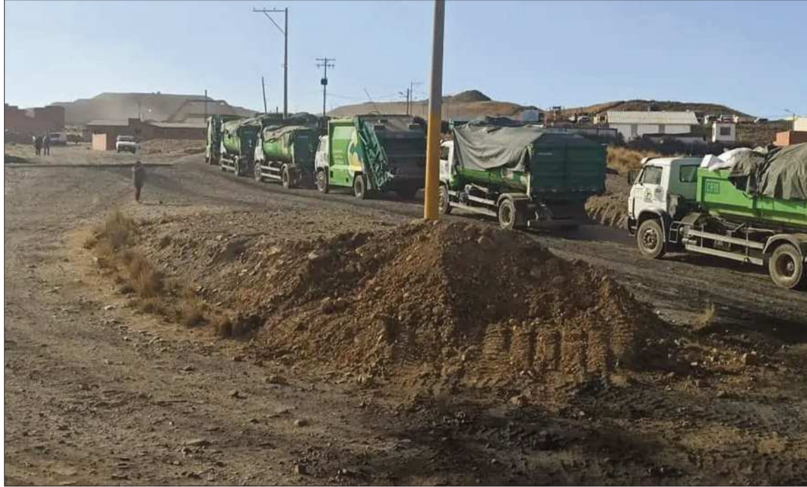
TRABAJO. Los camiones recolectores nuevamente ingresaron al botadero municipal.

“Ya estamos con todas las vías disponibles en el punto del relleno sanitario. Por ello, hemos activado el recojo de forma nocturna. Se está trabajando en cada distrito para disminuir la acumulación de basura en las calles”, explicó la