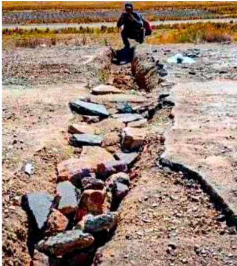
La ABC informó que el sector afectado se localiza pasando el municipio de Laja, a la altura del Puente Pallina

Esta acción provocó que la carretera quedara totalmente intransitable, generando perjuicios a transportistas, productores y comerciantes. Personal técnico de la ABC verificó los daños en el lugar y registró lo sucedido para sustentar la denuncia ante las instancias competentes. La ABC coordinará acciones necesarias para restablecer las condiciones de circulación en el sector afectado a la brevedad posible.