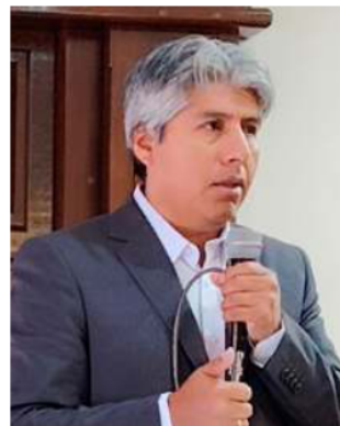
Edgar Sánchez, gobernador de Oruro

Los movilizadados demandan a ambas autoridades abandonar la pasividad institucional. Exigen asumir una postura firme en defensa del orden constitucional y la estabilidad