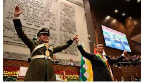
El Presidente Rodrigo Paz y el vicepresidente Edmand Lara en su posesión

El diputado Santiago Ticona expresó su preocupación por el hecho de que, mientras el vicepresidente convocó al diálogo junto a la Iglesia Católica y otras instituciones, el Presidente adoptó una postura más dura. Paz advirtió que el tiempo para dialogar se acaba y mencionó tener recursos constitucionales a su disposición.