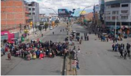
Un bloqueo en la ciudad de El Alto