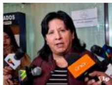
La diputada Bilbao pidió garantías para todos los paceños

"Necesitamos poner autoridad y el Ejecutivo