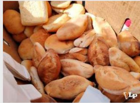
Según Herrera, el sector panificador trabaja al 70% o menos por los bloqueos

“Estamos trabajando al 70 por ciento o incluso menos. La harina que an-