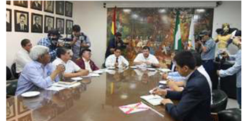
Los cívicos exigieron la aprehensión de Evo Morales, estado de excepción sectorizado, entre otras medidas

ponsables de las protestas que asuman el resarcimiento económico por los daños al aparato productivo, argumentando que las pérdidas afectan se-