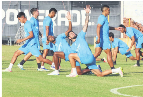
La academia necesita lavarse la cara luego de su eliminación de la Sudamericana

portancia. Los movimientos realizados durante la semana reflejan la intención de Florentín de implementar una nueva idea futbolística, distinta a la utilizada por el equipo a lo largo de la temporada.