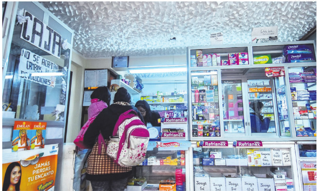
La disponibilidad de algunos medicamentos se ha visto afectada porque los bloqueos causan problemas de abastecimiento y distribución

Guillermina conoce bien esa realidad. Aunque es diabética, asegura que controla gran parte de su enfermedad con remedios naturales. Lo que realmente pesa sobre la economía familiar son