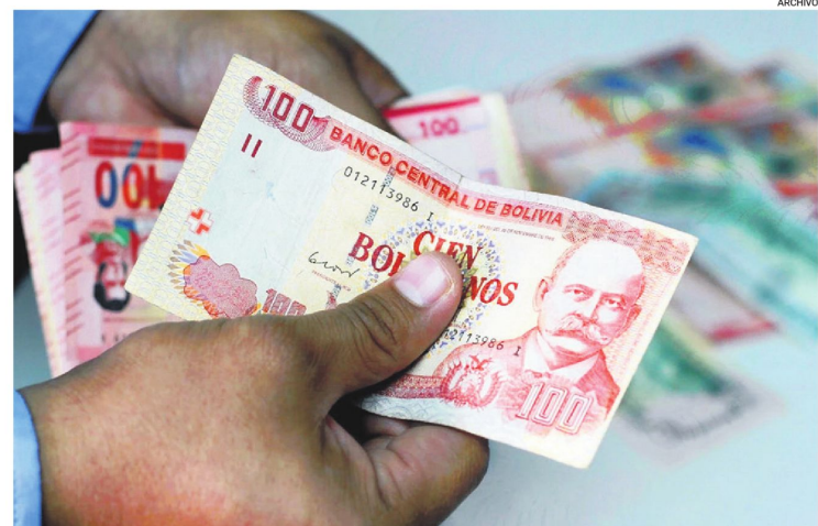
Los microcréditos lideran la cartera del sistema financiero, seguidos por créditos empresariales.

La actual crisis dejó en evidencia que el problema no es únicamente coyuntural, sino que responde a limitaciones históricas que dificultan garantizar la continuidad productiva.