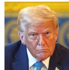
El mandatario estadounidense

Salvo una sorpresa mañana en las urnas, ninguno de ellos aparece en las encuestas para ganar en primera vuelta.