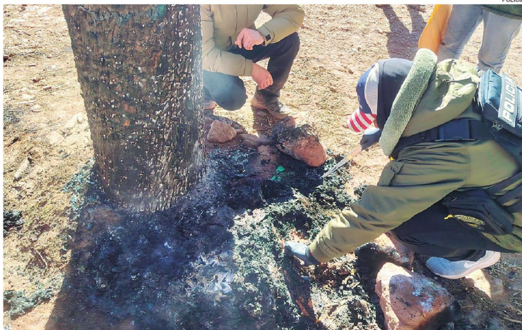
Policías de Potosí recolectan evidencia del lugar donde se produjo el linchamiento en Pocoata.

El fiscal departamental Gonzalo Aparicio informó que se abrió una investigación por asesinato y que ya se realizan actos investigativos