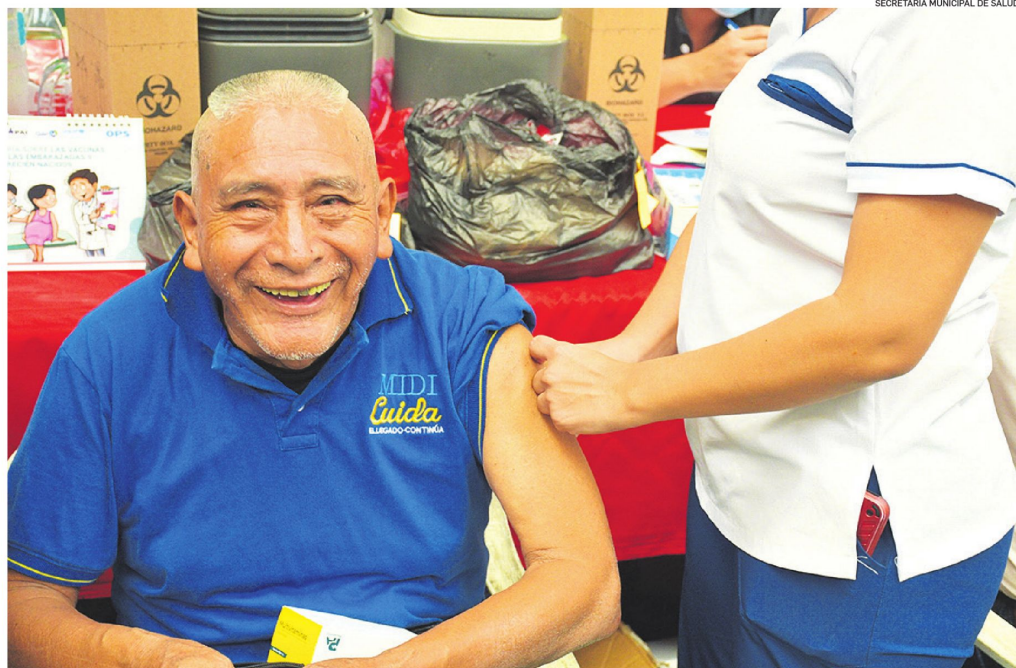
Personal de salud del municipio de Santa Cruz inmuniza a una persona de la tercera edad durante la campaña en la Villa Primero de Mayo.

Los mayores de 60 años, personas con enfermedades crónicas, niñas y niños menores de cinco años es la población más vulnerable que debe vacunarse.