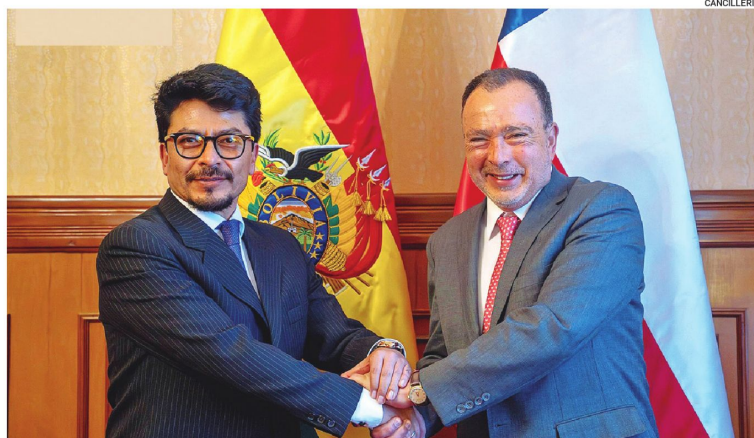
El canciller Fernando Aramayo recibió a Velasco el jueves 28 de mayo en una reunión de despedida

Uno de los hitos más importantes de este período fue la reciente visita a Bolivia del canciller chileno, Francisco Pérez Mackenna. El viaje incluyó un simbólico encuentro con su homólogo boliviano, Fernando Aramayo, en la frontera de Chungará-Tambo