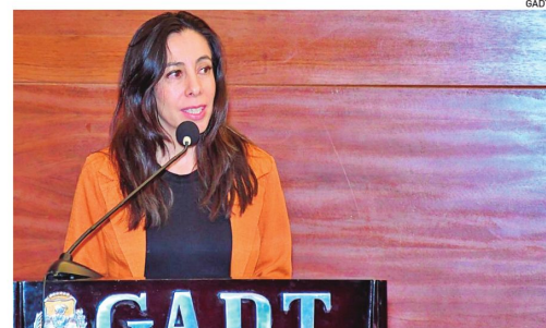
La gobernadora de Tarija anticipó los nuevos desafíos de las regiones

Los gobernadores de los nueve departamentos se reunirán el 18 de junio en Tarija para validar el plan