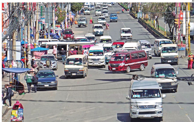
Así luce la avenida Montes en La Paz, una arteria estratégica de ingreso al centro de la ciudad

Mientras los dirigentes deliberan, la situación en las calles co-