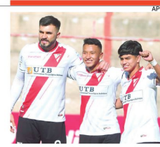
El equipo de la banda roja superó al plantel de ABB en Villa Ingenio