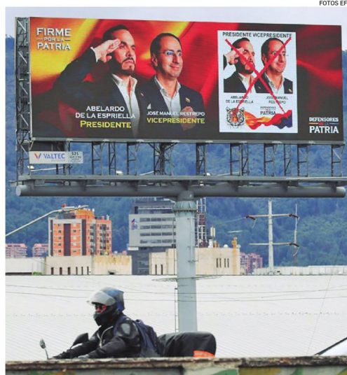
Publicidad de un candidato presidencial en las afueras de Bogotá

"El material electoral ya está en todos los municipios de Colombia (...) no tenemos ninguna novedad que indique la necesidad de trasladar alguna mesa o puesto de votación durante la jornada de mañana", manifestó el registrador nacional, Hernán Penagos.