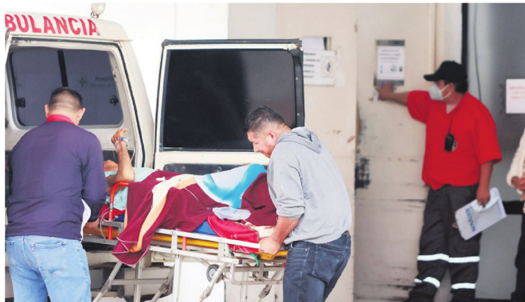
La interrupción en la distribución de medicamentos genera preocupación en hospitales y centros de salud