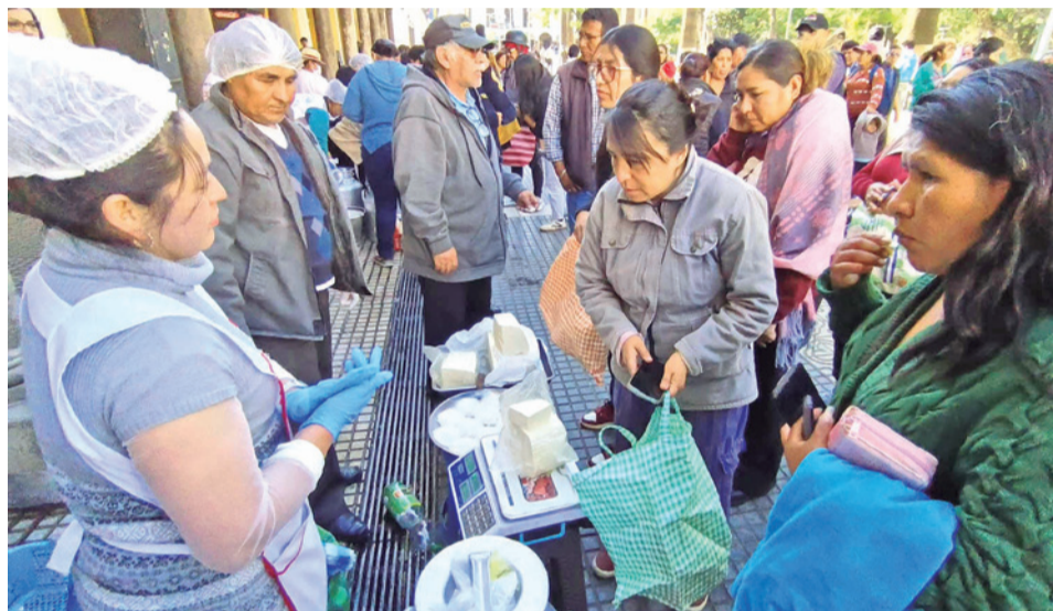
La venta de lácteos y derivados en la plaza principal.

De acuerdo con el Reporte Técnico de Afectación Económica por Bloqueos en Cochabamba, elaborado por la Unidad de Análisis Económico (UAE) y el Observatorio Económico Empresarial (OEE) de la FEPC, la conflictividad vial pasó de una perturbación operativa a un choque económico de alcance sistémico, con impacto directo sobre producción, transporte, comercio, servi-