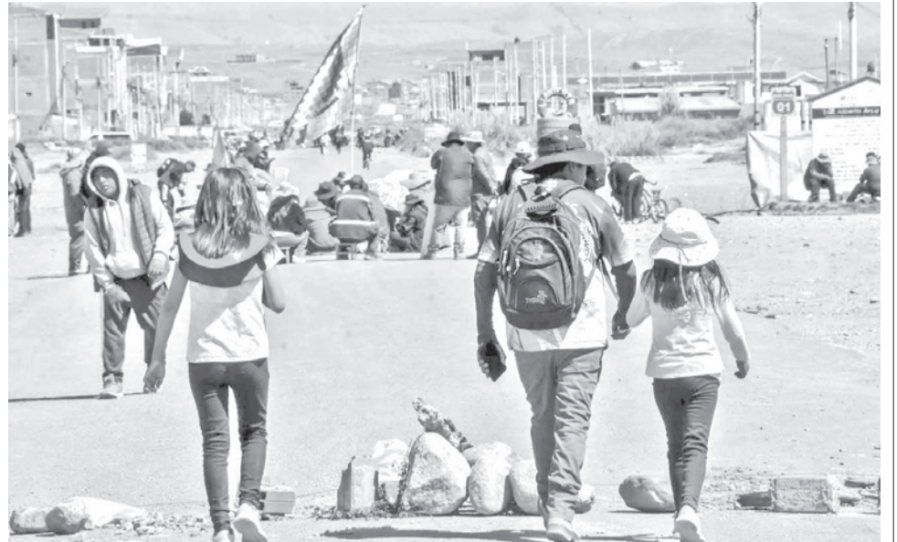
Seguidores del expresidente Evo Morales bloquean carreteras en la zona del trópico.