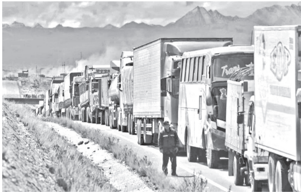
Una fila de camiones de carga internacional atrapados en los bloqueos. MARKA REGISTRADA

El ministro también alertó sobre el fuerte impacto en el sector turístico, donde —según indicó— se están registrando cancelaciones de re-