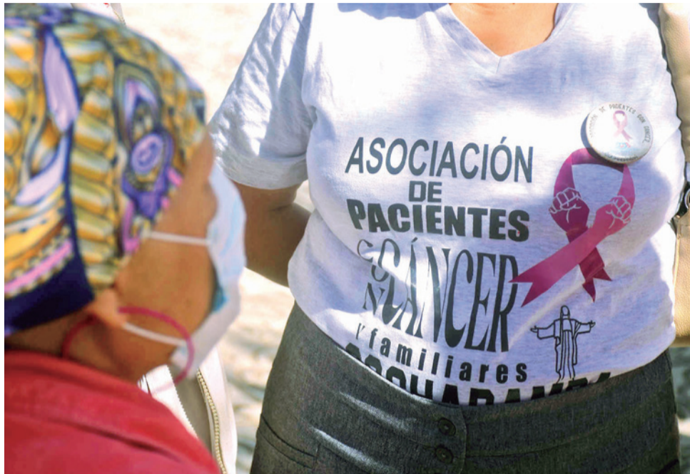
Pacientes que luchan contra el cáncer en Cochabamba (archivo).