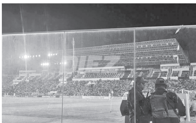
La iluminación en el estadio Tahuichi Aguilera. EL DEBER

ción explicaron que el Servicio Departamental de Deportes de Santa Cruz solicitaron el cambio de horario, ya que durante el cotejo de la Copa Libertadores animado por Bolívar e Independiente Rivadavia hubo problemas con las nuevas luminarias.