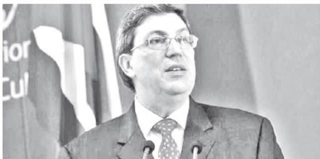
El canciller de Cuba, Bruno Rodríguez.

Ayuda. El jefe de la diplomacia cubana se manifestó ante el Grupo de Amigos de la Gobernanza Global