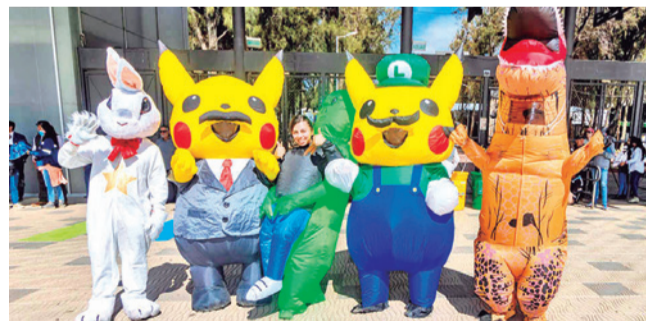
El lanzamiento del Día del Peatón y Ciclista. GAMC

Razones. La Alcaldía de Quillacollo manifestó que la ley es sólo para Cercado y que sus actividades serán normales