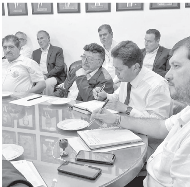
Reunión de representantes cívicos en Santa Cruz, ayer.

Entre otras conclusiones aprobadas están: Respeto a la