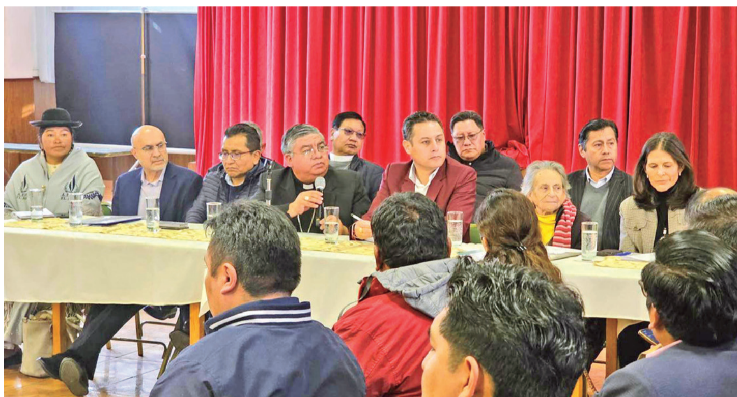
Asistentes al encuentro convocado por la Vicepresidencia en la sede definida por la Conferencia Episcopal en el seminario San Jerónimo, ayer.