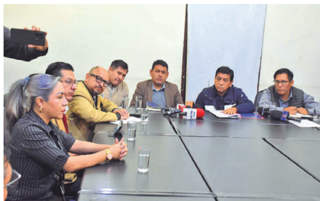
La reunión en la Gobernación con el transporte.