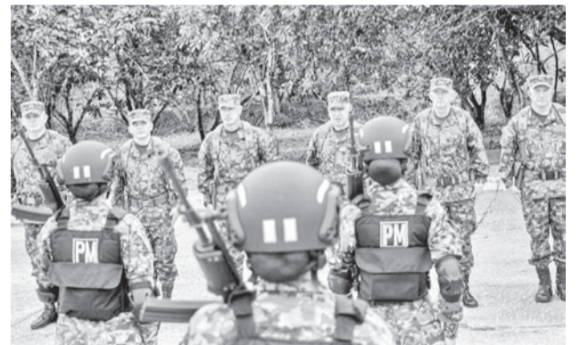
Ejército colombiano en Guaviare.

“Se activó una ruta social comunitaria que permitirá el transporte de los cuerpos