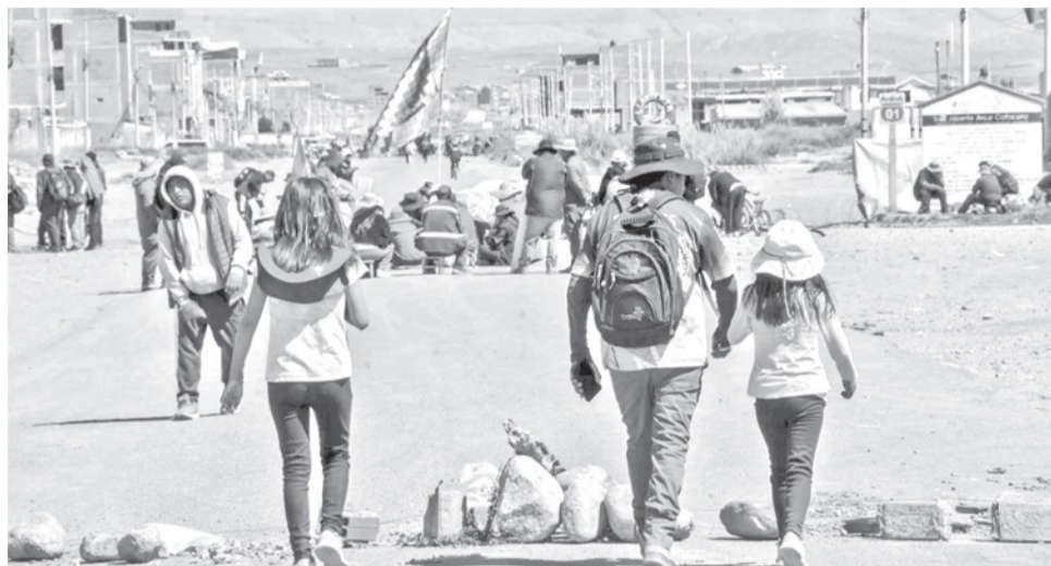
Organizaciones sociales bloquean una vía en la ciudad de la Paz. MARKA REGISTRADA

Con sirenas encendidas y la consigna: "basta de bloqueos, respeto a la vida y a la salud", médicos, trabajadores en salud y ambulancias recorrieron este jueves el centro de La Paz para exigir una pausa humanitaria de cinco días que permita el ingreso de oxígeno medicinal, medicamentos y alimentos a los hospitales afectados por casi un mes de bloqueos. La movilización de los "mandiles blancos", encabezada por el Colegio Médico de La Paz y el Consejo Departamental de Salud partió en el Hospital de Clínicas de Miraflores y avanzó hacia el centro.