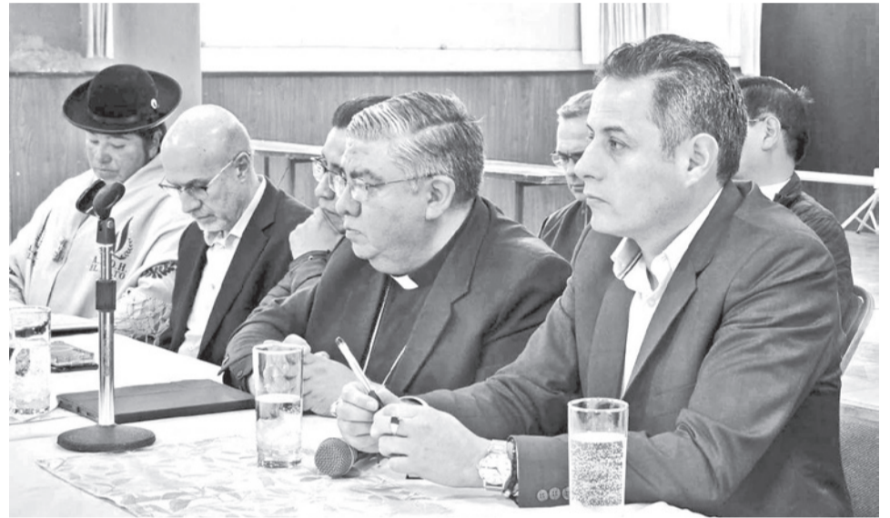
Participantes de la mesa de diálogo convocada por la Vicepresidencia, ayer.

La COB y los Túpac Katari son los principales sectores movilizados que hace más de tres semanas realizan marchas y bloqueos que afectan principalmente al departamento de La Paz.