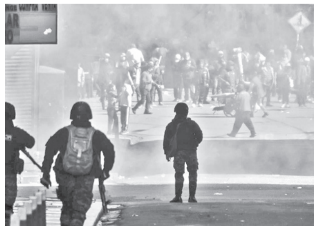
Enfrentamientos entre policías y marchistas. MARKA REGISTRADA

Enfatizó que toda actuación de las fuerzas de seguridad debe ajustarse estrictamente al derecho internacional de los derechos humanos. Todo uso