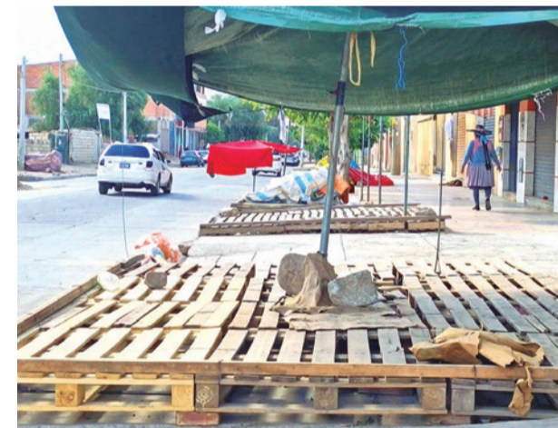
El mercado de frutas de la zona sur vacío.

En tanto, que los pobladores de la sede de Gobierno denunciaron que no cuentan con los recursos para cubrir el costo de las verduras, como tres cebollas en Bs 10 o dos zanahorias en Bs 7.