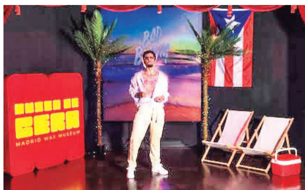
Figura de Bad Bunny ya se exhibe en el Museo de Cera de Madrid