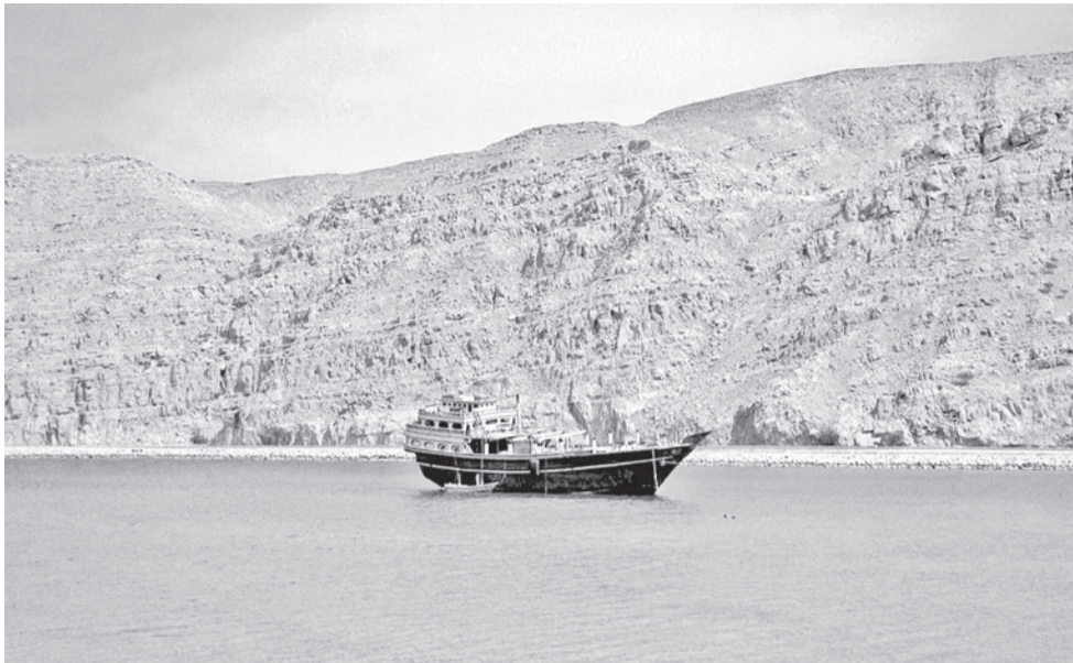
Un barco de madera varado en mitad de una de las enseñas que jalonan el paisaje de acantilados de roca de la península de Musandam, en Omán.