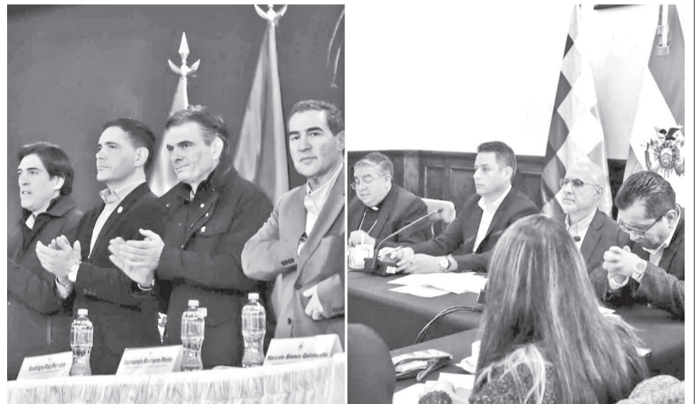
Reunión del Consejo Económico y Social. Comisión de Diálogo de la Vicepresidencia.