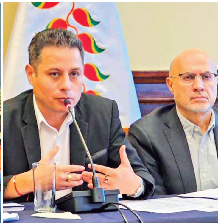
El presidente Rodrigo Paz convoca a dirigentes al diálogo. El vicepresidente Edmand Lara en la mesa con autoridades y sectores.