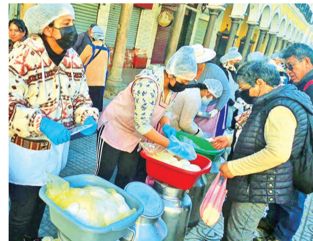
Venta de lácteos en la plaza 14 de Septiembre. DANIEL JAMES

Otros alimentos que han reducido su oferta son las frutas, como la papaya y el plátano. La papa y verduras se encuentran, pero a precios elevados.