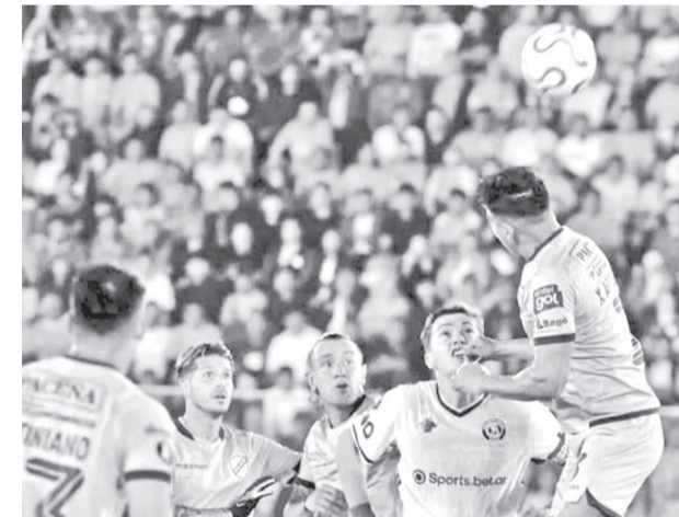
Bolívar frente a Independiente Rivadavia.