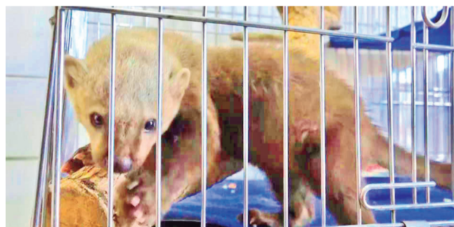
La cría de oso melero rescatada por Pofoma. GANZMC

Sanción. La Dirección de Medio Ambiente recordó que la tenencia de animales silvestres está sancionada por ley