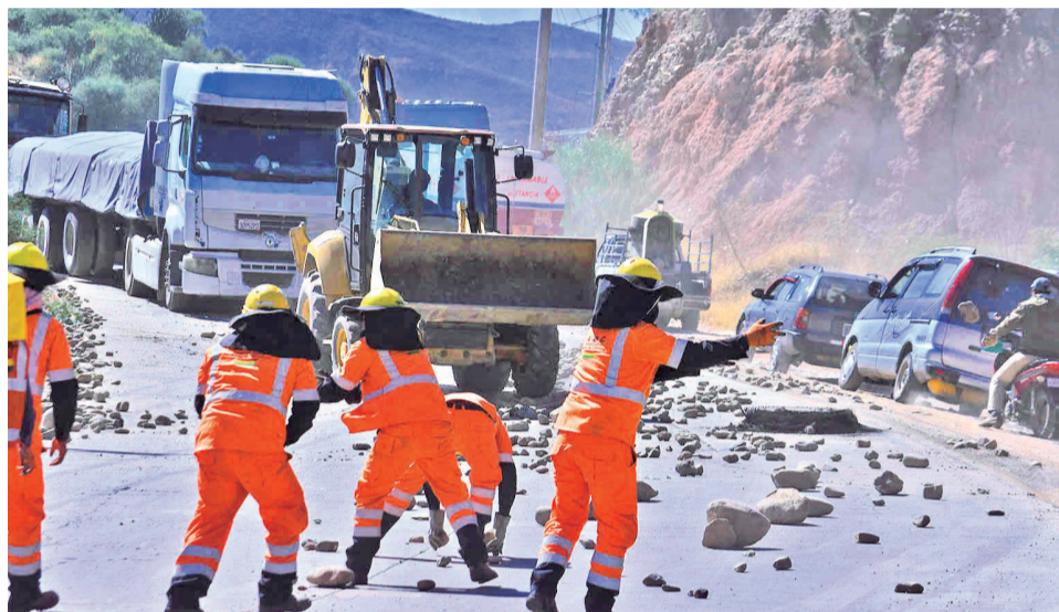
Personal de la ABC desbloquea Parotani, el lunes.