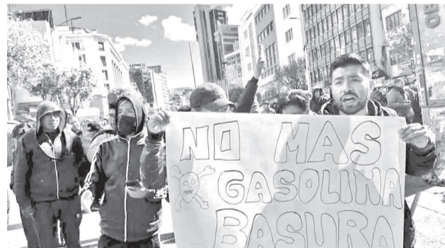
Bloqueo de los choferes en la ciudad de La Paz, ayer.

Agregó que las autoridades evaluarán posibles medidas relacionadas con su situación migratoria.