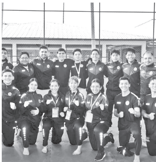
El equipo nacional en Brasil. FEBOKA

El Gimnasio Municipal Engenheiro Maurício Soares Bittencourt albergará el torneo.