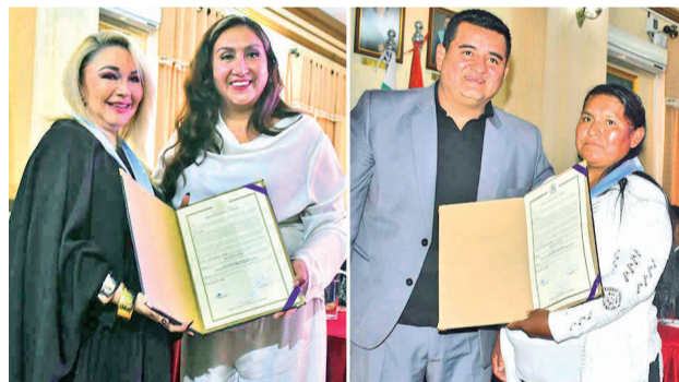
La distinción de las madres en el Concejo. DANIEL JAMES

“Los niños que reciben leche materna tienen una recuperación mucho más rápida que aquellos que consumen leche artificial. Este proyecto ayudará a salvar vidas y mejorar la recuperación de los bebés prematuros” de todo el departamento, afirmó Pardo.