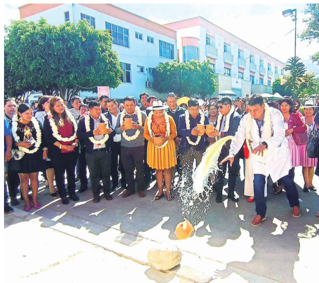
El acto de inauguración del banco, ayer.