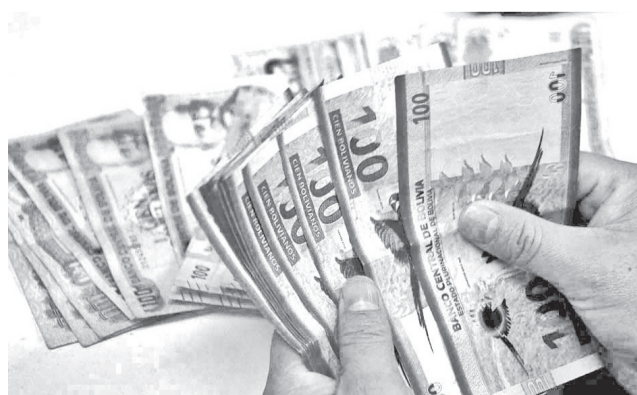
La moneda boliviana para el pago de impuestos. C. LÓPEZ

La norma contempla la condonación de deudas tributarias y multas por delitos y contravenciones tributa-