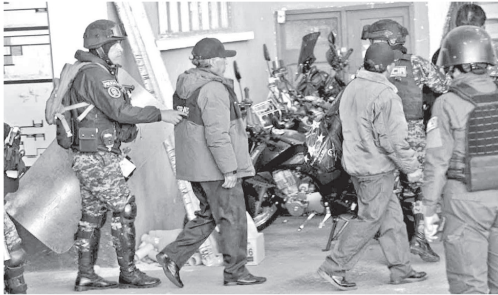
Uno de los manifestantes en la ciudad de La Paz detenido por policías.

Muchas de las mujeres piden la renuncia del presidente Rodrigo Paz y protestaban vestidas de negro, representando el luto en sus hogares que afecta directamente el bienestar de sus familias.