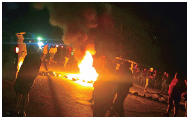
El apagón en una región del trópico de Cochabamba. RKC

“Se registra apagón de energía eléctrica en todo el trópico de Cochabamba (desde) las 19:50 (...) Se alerta a todo el trópico de Cochabamba ante cualquier movimiento inusual que pueda acontecer”, indica uno de los men-