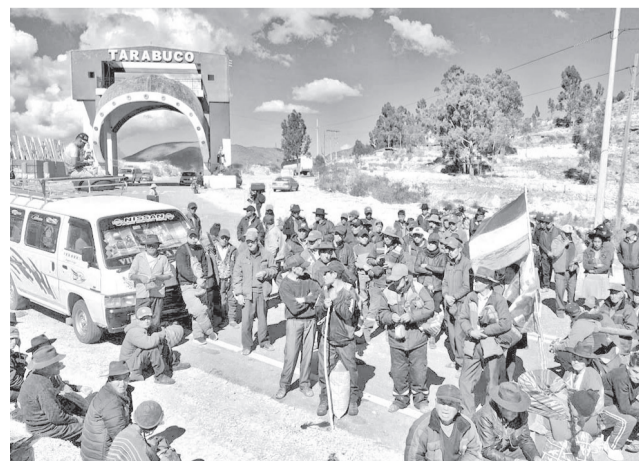
Organizaciones campesinas bloquean el centro paceño. RKC

"El presidente ha promulgado la abrogación de la ley, el estado de excepción es un instrumento más que la Constitu-