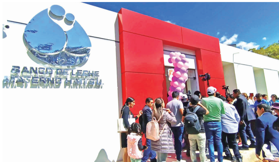
La inauguración del primer Banco de Leche Humana del país.