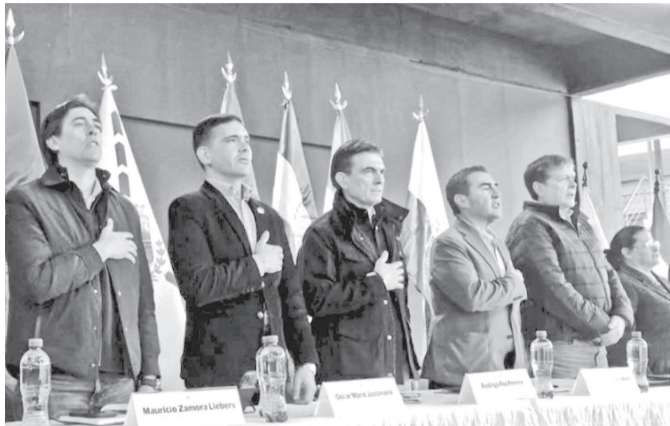
El presidente Rodrigo Paz junto a sus ministros.

Por otro lado, en noviembre del año pasado, Paz anun-