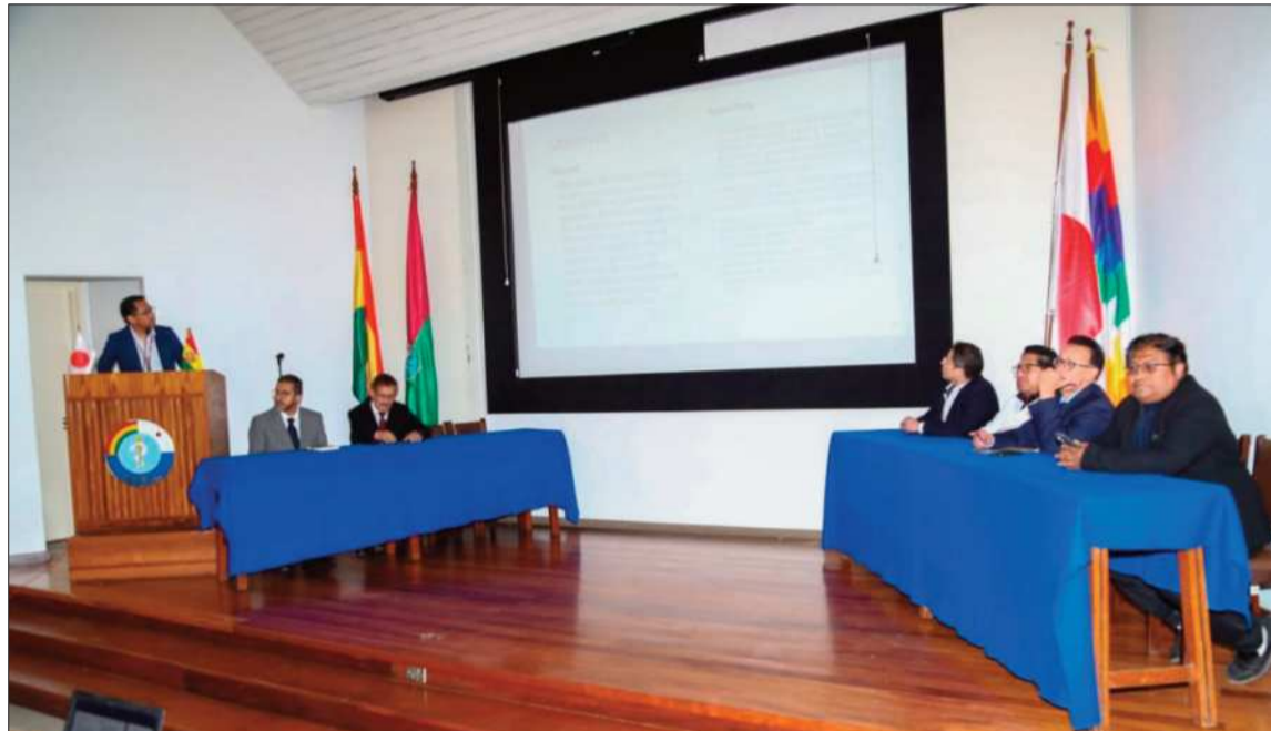
REUNIÓN. Representantes de instituciones instalaron el COED ante la falta de insumos médicos por bloqueos.

Para mitigar la falta de insumos básicos, las autoridades gestionan la activación prioritaria de un corredor humanitario que permita el traslado terrestre de oxígeno medicinal. Así mismo, se coordinó el establecimiento de un puente aéreo para asegurar la