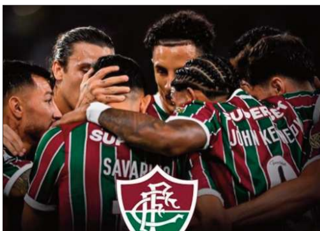
RÍO DE JANEIRO. Los jugadores de Fluminense celebran.

Mientras que más temprano, en el estadio Juan Domingo Perón, Racing Club derrotó 2-0 a Independiente Petrolero por la Sudamericana.