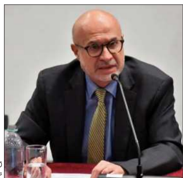
El Ministro José Luis Lupo.

Lupo adelantó que cualquier decisión estará enmarcada en la CPE