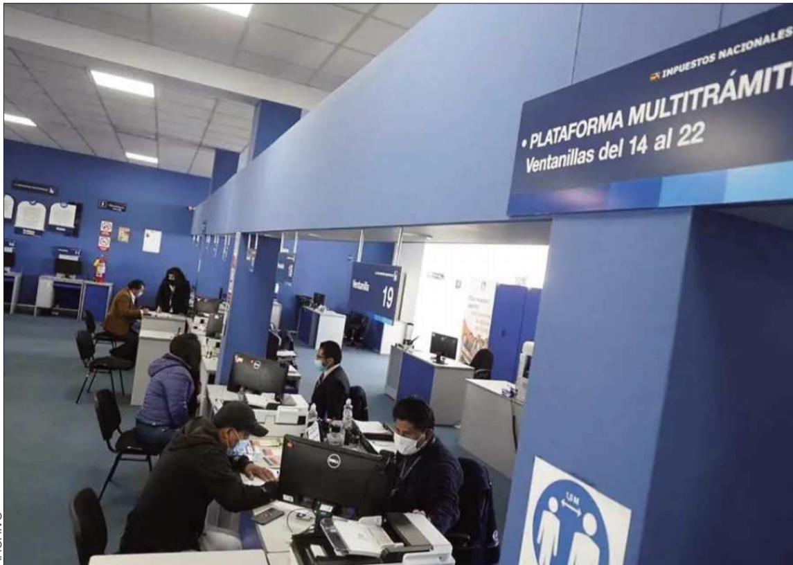
ARCHIVO MEDIDA. Una oficina del Sistema de Impuestos Nacionales en la ciudad de La Paz.