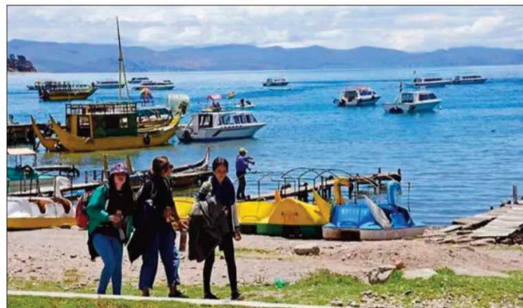
BLOQUEO. Hay pocos turistas en el Lago Titicaca, en La Paz.