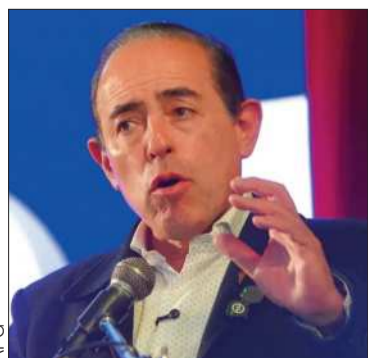
El alcalde durante el evento.

El alcalde pide garantizar el abastecimiento e impulsar el diálogo