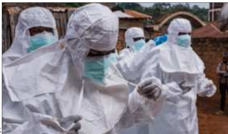
EPIDEMIA. Médicos se protegen ante la propagación del ébola.

Marco Rubio habló en un consejo de ministros en la Casa Blanca