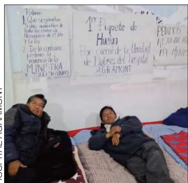
Pacientes en huelga de hambre.

El Ministerio de Salud suspendió un convenio con el Hospital Agramont