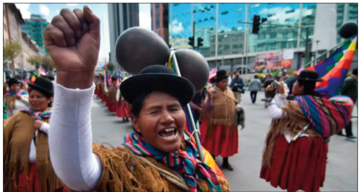
MARCHA. Mujeres protestaron en el centro de La Paz.

La COB impulsó las movilizaciones y los bloqueos que generaron desabastecimiento de alimentos, medicamentos y combustibles desde hace más de 20 días en las ciudades de La Paz y EL Alto, principalmente.