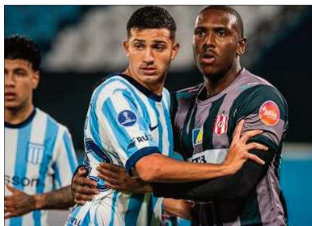
AVELLANEDA. En Racing lograron un triunfo de consuelo