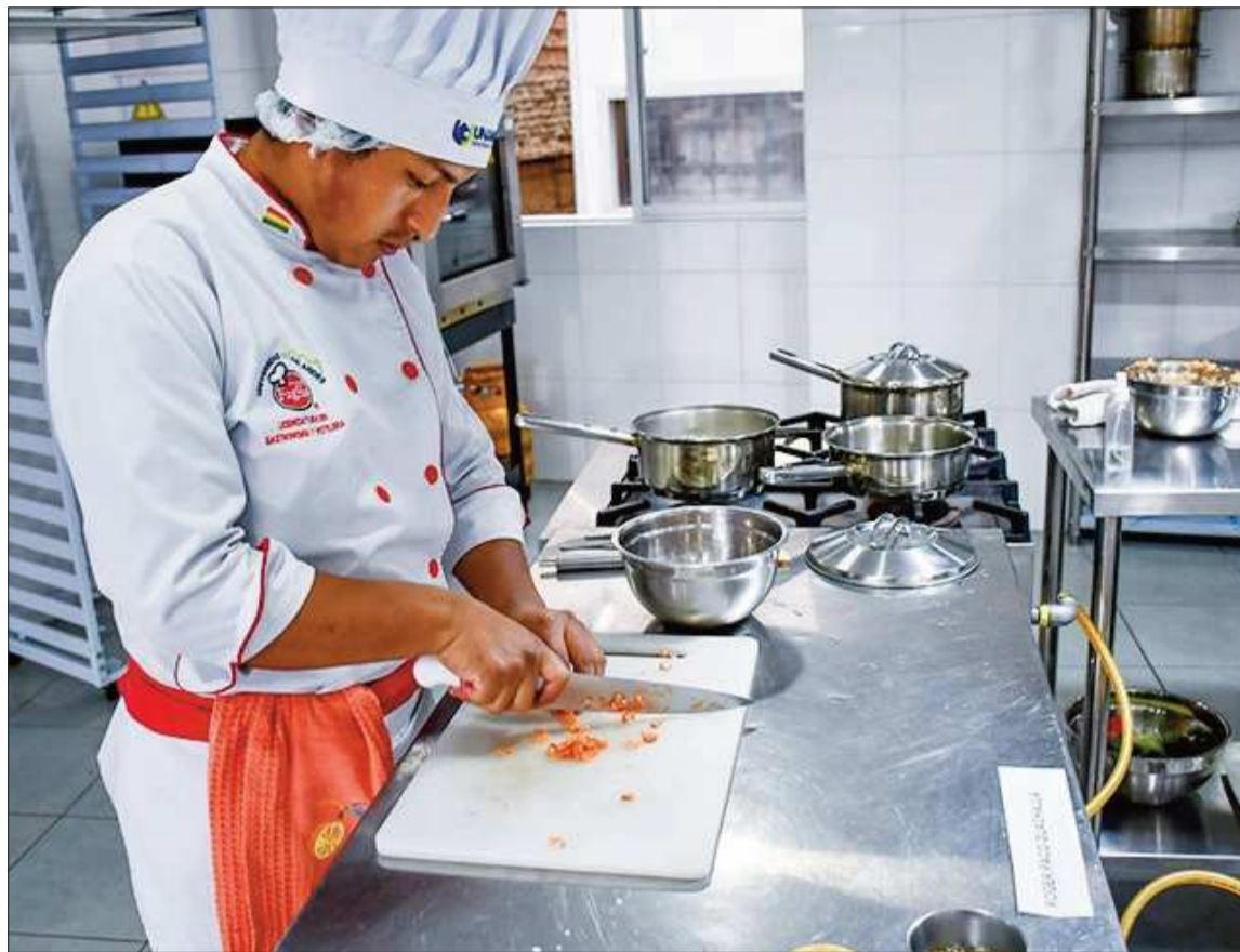
COCINA. Un joven cocinero de gastronomía trabaja concentrado en una cocina.

“Pedimos cambios regulatorios que nos permitan acceder a mejoras fiscales. También vamos a pedir