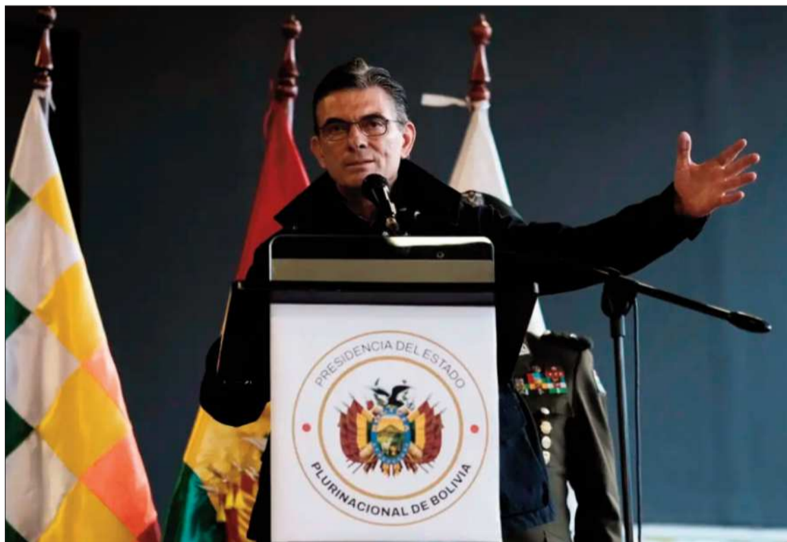
MANDATARIO. El presidente Rodrigo Paz en el cierre del Consejo Económico y Social, en La Paz.

Paz defendió la legitimidad de su mandato y cuestionó que algunos sectores intenten definir la continuidad presidencial mediante presión social. "No puedes botar