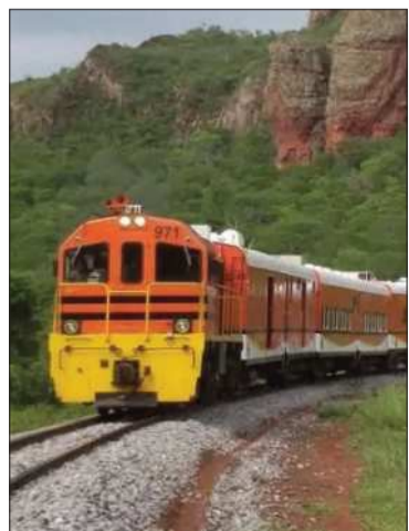
Un tren de la Ferroviaria Oriental.

La reactivación del servicio es resultado de un trabajo coordinado