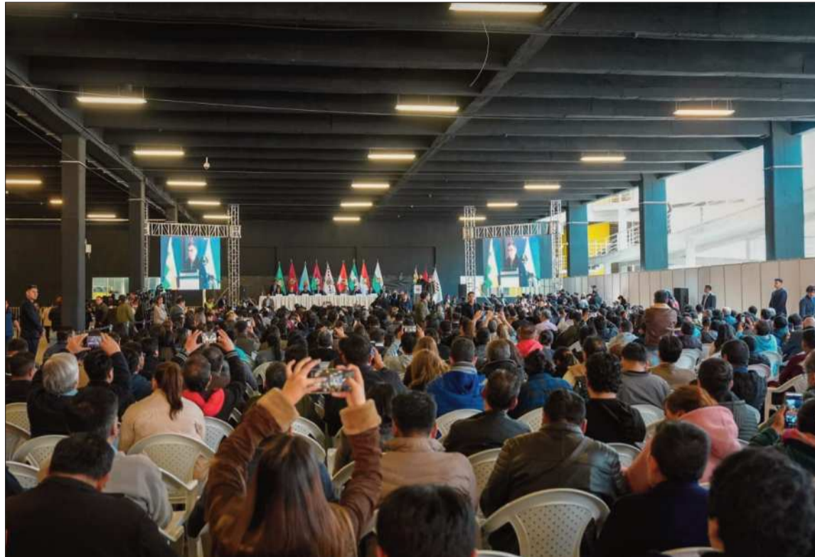
ENCUENTRO. El presidente Rodrigo Paz dirige el encuentro del Consejo Económico y Social en La Paz.

La autoridad defendió el encuentro como una respuesta a la desinformación que circula en redes sociales y aseguró que el objetivo es establecer mecanismos