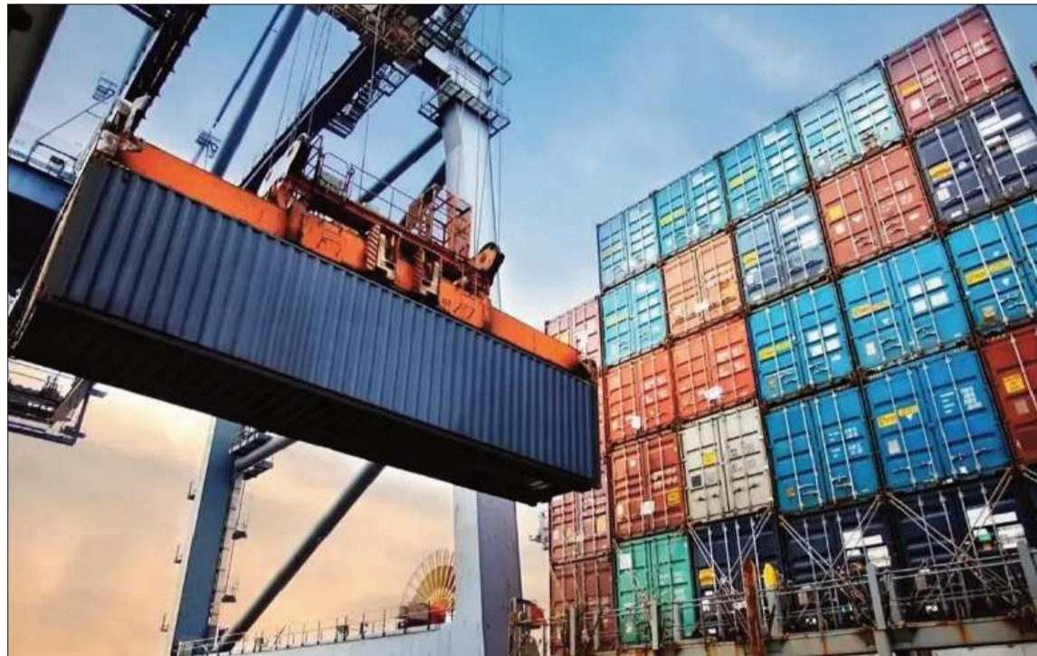
PÉRDIDAS. Las exportaciones del país sufren deterioros debido a los conflictos sociales.

Asimismo, otros departamentos también registran importantes pérdidas económicas. Oruro reporta una afectación de $us