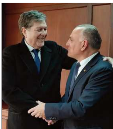
MIN. DE HIDROCARBUROS Autoridades de Alemania y Bolivia.

La cooperación destina $us 80 MM en una matriz energética sostenible