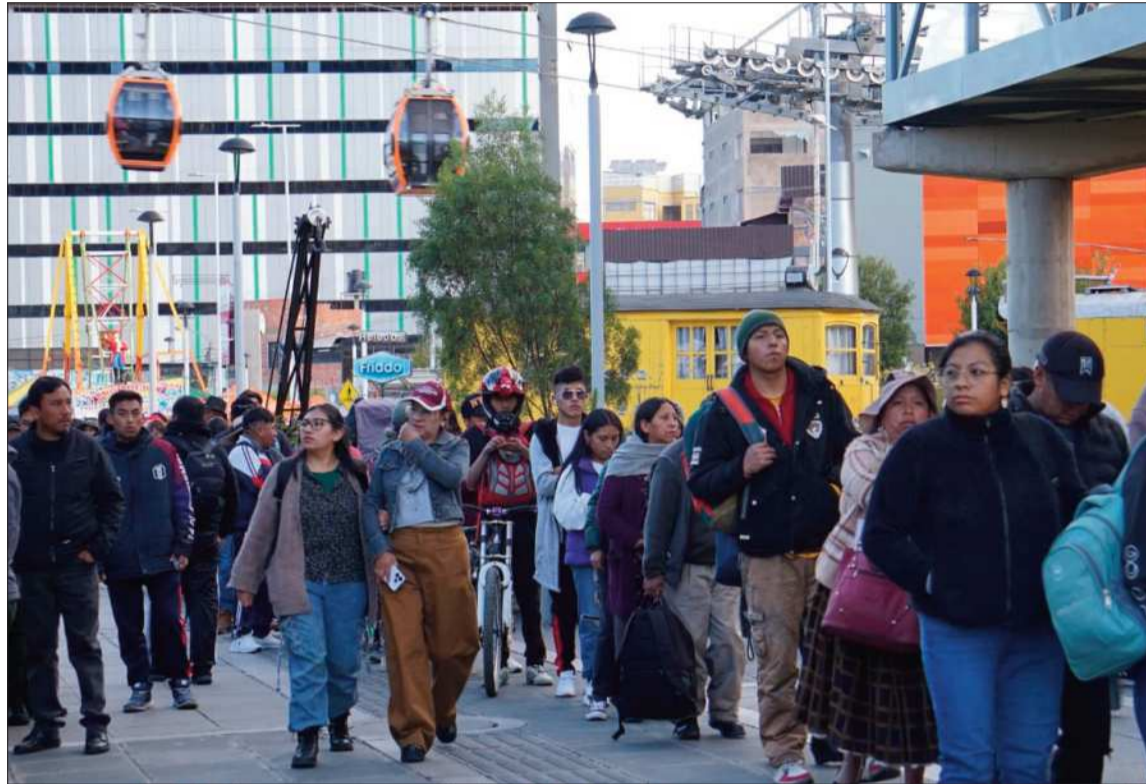
SERVICIO. Desde temprano la población hace cola en las estaciones del transporte por cable.

Pero además reclaman por el suministro de carburantes, que se ha visto afectada debido a las protestas de campesinos y la Central Obrera Boliviana (COB), y el incremento de los precios de los productos de la canasta familiar. El secretario ejecutivo de la Federa-