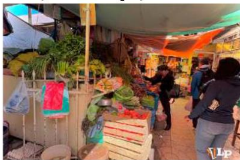
Productos de la canasta familiar comienza a escasear

Quispe atribuyó la situación al cierre de rutas principales y a las dificultades en los caminos alternos utilizados para el ingreso de alimentos como carne, pollo y verduras.