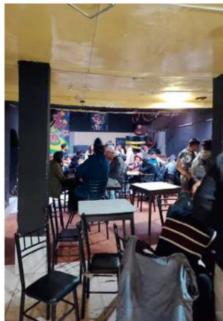
Discoteca fue intervenida por la Unidad de Defensa al Consumidor /UDC

Desde Defensa al Consumidor se anunció que estos controles continuarán en diferentes zonas de Oruro para detectar actividades clandestinas y verificar el cumplimiento de las disposiciones municipales vigentes.