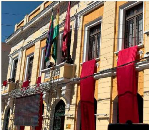
Alcaldía analiza situación del personal y descarta despidos masivos

Afirmó que, por el momento, no se ejecuta ningún recorte de funcionarios. Sostuvo que la principal instrucción de la nueva administración municipal es evitar una "masacre