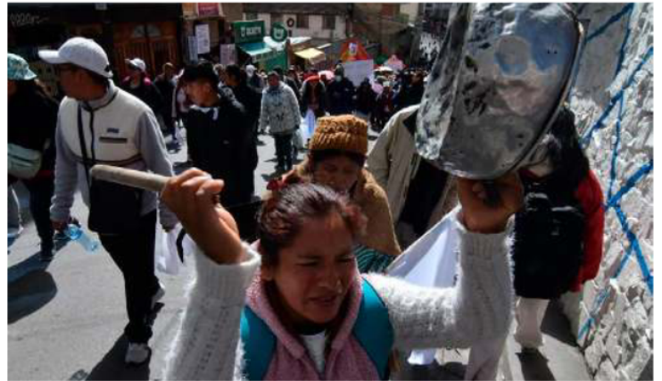
La Paz y otros departamentos sufren falta de alimentos, medicamentos y otros insumos debido a los bloqueos

Arispe lamentó que los bloqueadores ignoren el sufrimiento de la población, que cada vez muestra más su molestia y exige libertad para trabajar. Ayer, los gremiales realizaron una marcha portando banderas blancas para manifestar su descontento. "Ya es momento de que todos en unidad, precautelando sobre todo el bienestar de los niños que son los que más sufren cuando uno lle-