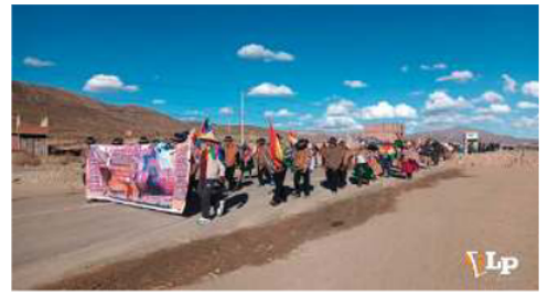
La marcha salió el sábado de sus hogares y este jueves ingresarán a la ciudad

Además, cuestionó las políticas tributarias y denunció que mientras algunos grandes empresarios habrían recibido condonaciones, pequeños productores enfrentan nuevas cargas impositivas. El dirigente confirmó que la movilización respalda a sectores como la Central Obrera Boliviana (COB) y otras organizaciones sociales movilizadas en La Paz. "Estamos siendo solidarios con los hermanos paceños que