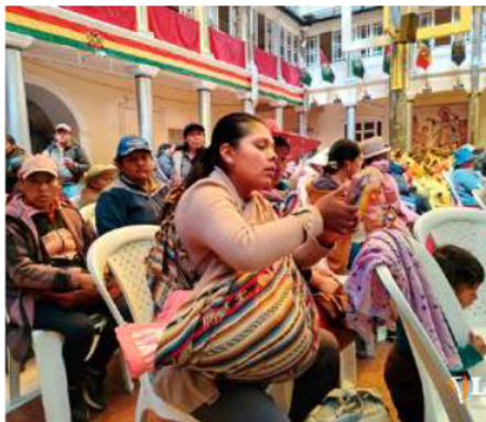
Acto de festejo a mamás de centros de madres de Unidos en Acción