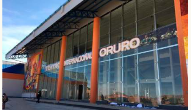
Se pretende realizar un plan de mantenimiento al Teatro Internacional

La auditoría permitirá evaluar el estado real del escenario y prio-