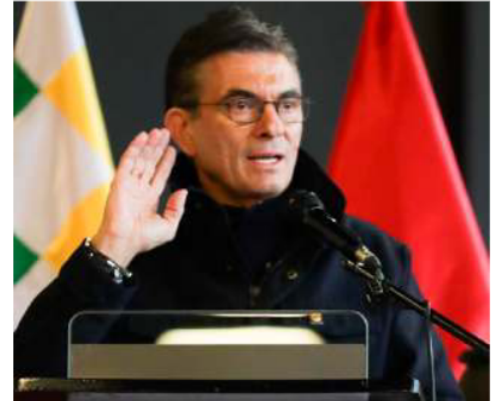
El Presidente Rodrigo Paz en su discurso de cierre del Consejo Económico Social

Asimismo, desestimó las solicitudes de renuncia promovidas en las movilizaciones señalando que “no puedes botar a presidentes porque se te da la gana. El voto se respeta y la Constitución también”. Los reportes de prensa mencionaron que sobre el dirigente Argollo pesa una orden de aprehensión emitida por las autoridades