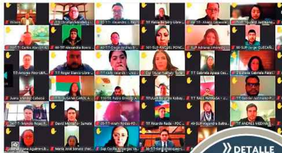
DATO. En caso de abrogación, Paz puede promulgarla de inmediato.

Por la mañana, el pleno camaral aplicó el mecanismo de dispensación de trá-