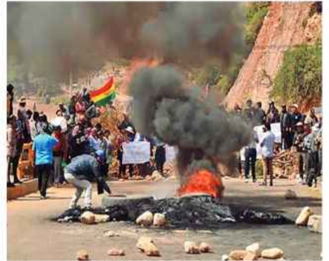
DATO: Bloqueadores resisten a las operaciones de desbloqueo.

El instrumento judicial también delimita el derecho a la protesta y aclara que la modalidad de "bloqueo absoluto" no cuenta con protección constitucional, debido a que vulnera los derechos fundamentales de la población, como la salud, el libre tránsito y la vida y anuncia procesos penales ordinarios a los infractores.