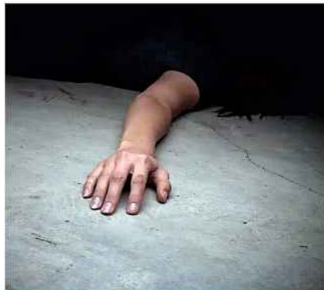
SEGURIDAD. La imagen solo es referencial.

El fin de semana reciente, una joven de 21 años fue asesinada en Santa Cruz de la Sierra tras ser acuchillada también. El principal sospechoso es quien era su pareja.