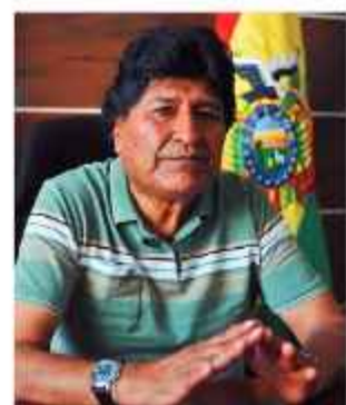
EXPRESIDENTE. Evo Morales.

El presidente Rodrigo Paz ratificó que el exmandatario Evo Morales será detenido y puesto a disposición de las autoridades judiciales en el transcurso de su gestión.