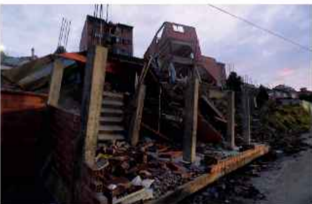
VISITA. El Alcalde estuvo en la zona paceña de riesgo.