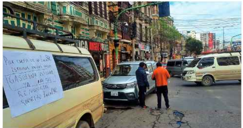
MANIFESTACIÓN. Anuncian el bloqueo de las 'mil esquinas'.