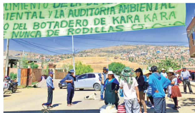
Un bloqueo en el botadero de K'ara K'ara. DANIEL JAMES

Veizaga precisó que, debido a la distancia de las unidades educativas y a la carencia de acceso a la tecnología, en parte de los colegios no se pudo aplicar la modalidad de clases a distancia.