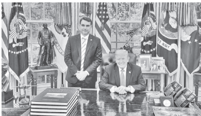
Flávio Bolsonaro (izq.) junto a Donald Trump.

Visita. La reunión fue impulsada por Eduardo Bolsonaro e intermediarios vinculados al secretario de Estado Marco