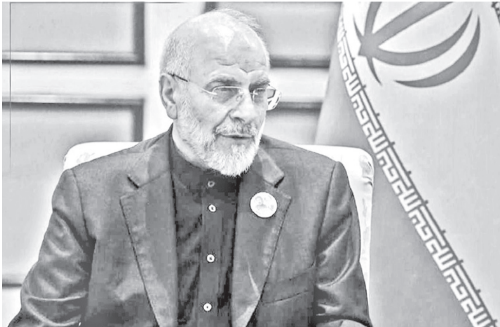
Mohammed Bagher Ghalibaf, principal negociador de Teherán.