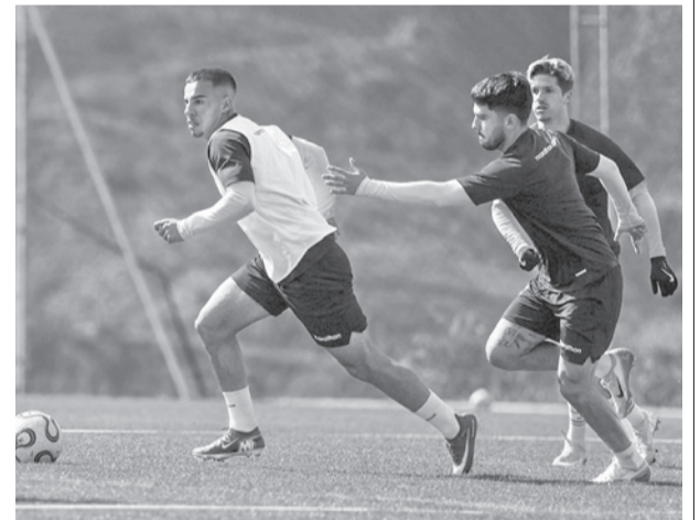
Bolívar se prepara enfrentar a Independiente.