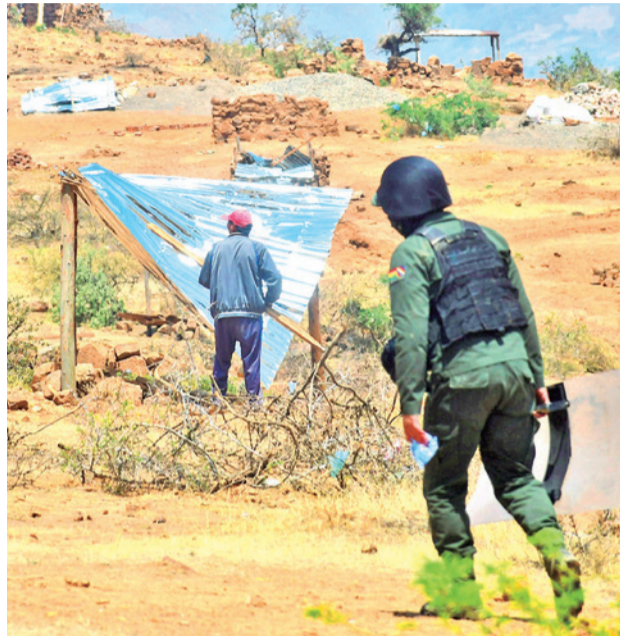
Un desalojo de tierras en Cochabamba.