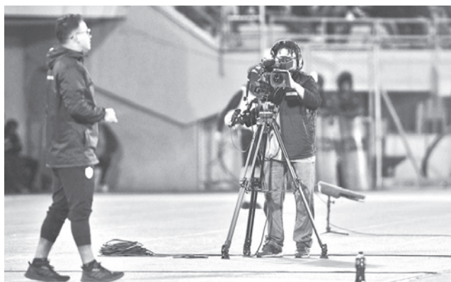
Equipos para la transmisión de los partidos. DANIEL JAMES

“Para este miércoles, el Gobierno Nacional hizo una invitación para dialogar, habrá que esperar los resultados de la reunión para saber cómo se desenvuelve la situación en el país y con base en eso tomar