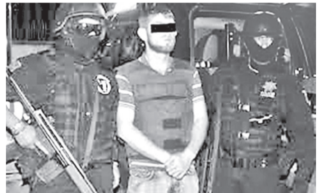
El sobrino del “Chapo” cayó en Nogales.

En un comunicado posterior, la SSPC detalló que el detenido está acusado de ser un “operador logístico de un grupo delictivo encargado de la producción y distribución de drogas sintéticas hacia Estados Unidos y Costa Rica”.