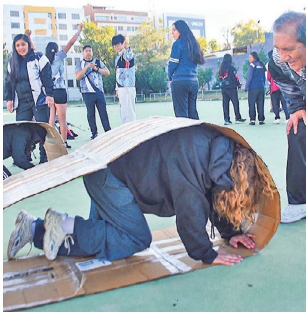
Gobernación lanza el Día del Peatón. HERNAN ANDIA

“Van a haber diferentes actividades acá en el complejo Capriles, de todo en realidad, todas las disciplinas deportivas. Invitamos a que puedan formar parte de las activida-