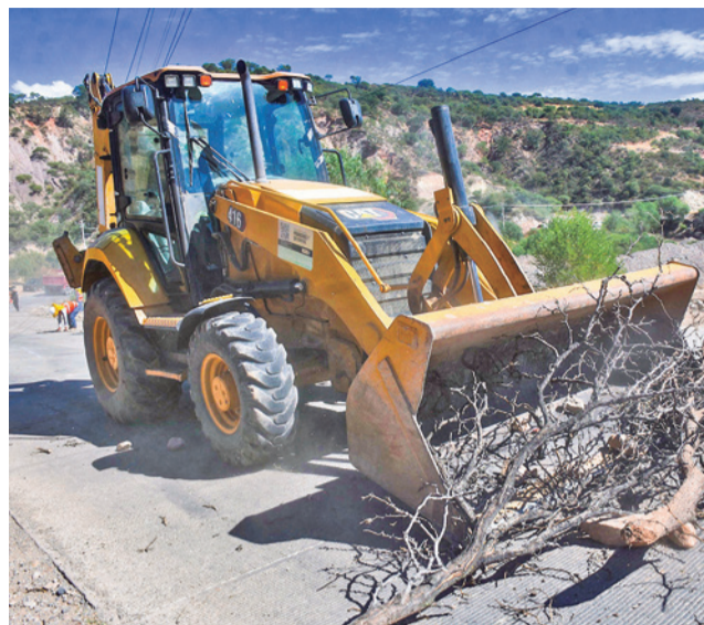
El desbloqueo en la ruta a Parotani.