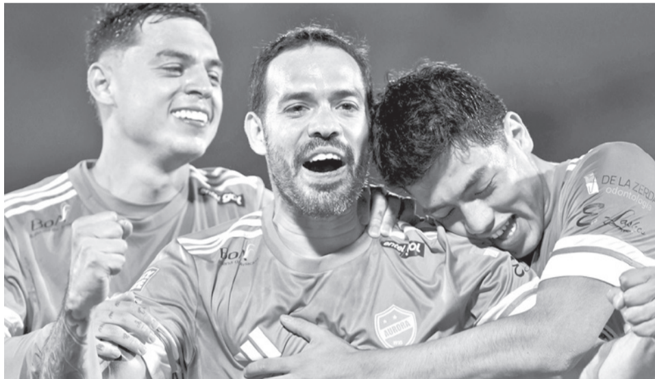
El Club Aurora también conocido como el Equipo del Pueblo.