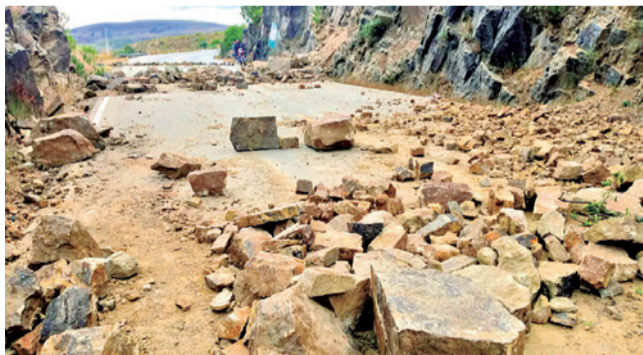
Los bloqueos que afectan clases presenciales. RRS5

Riesgo. La Dirección de Educación denunció que existen audios en los que amenazan a los maestros