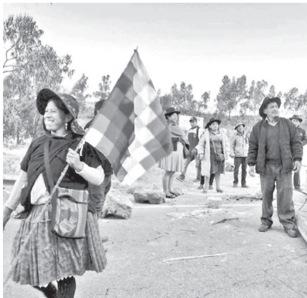
Bloqueos en Chuquisaca impiden tránsito hacia Sucre.

Las pensiones, alojamientos, puestos de comida y tien-