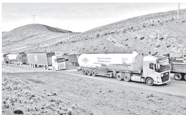
Cisternas retenidas en los bloqueos en el país. RRSS

A través de un comunicado oficial, la estatal petrolera señaló que, ante esta situación, se implementaron