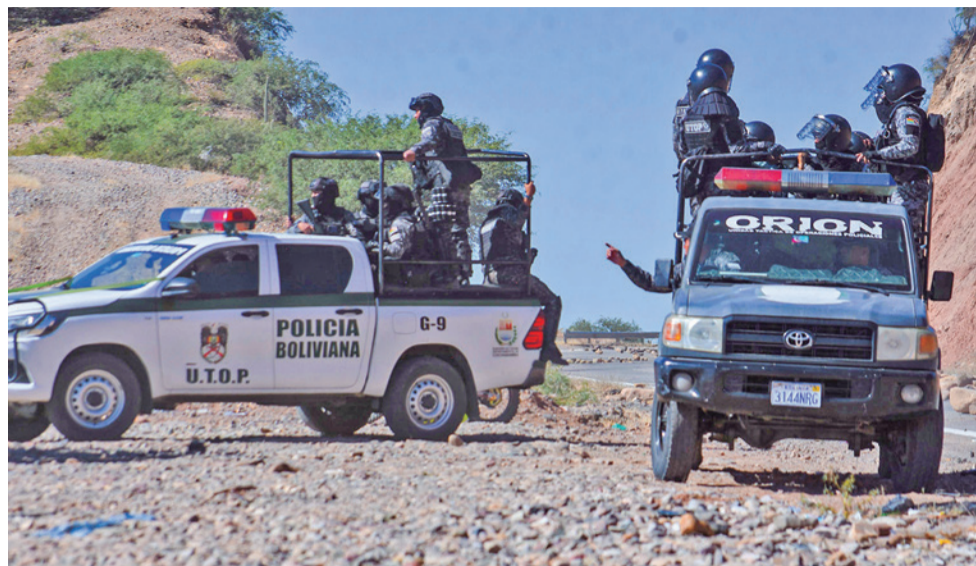
Policias con apoyo de militares despejaron la vía en Parotani, ayer.