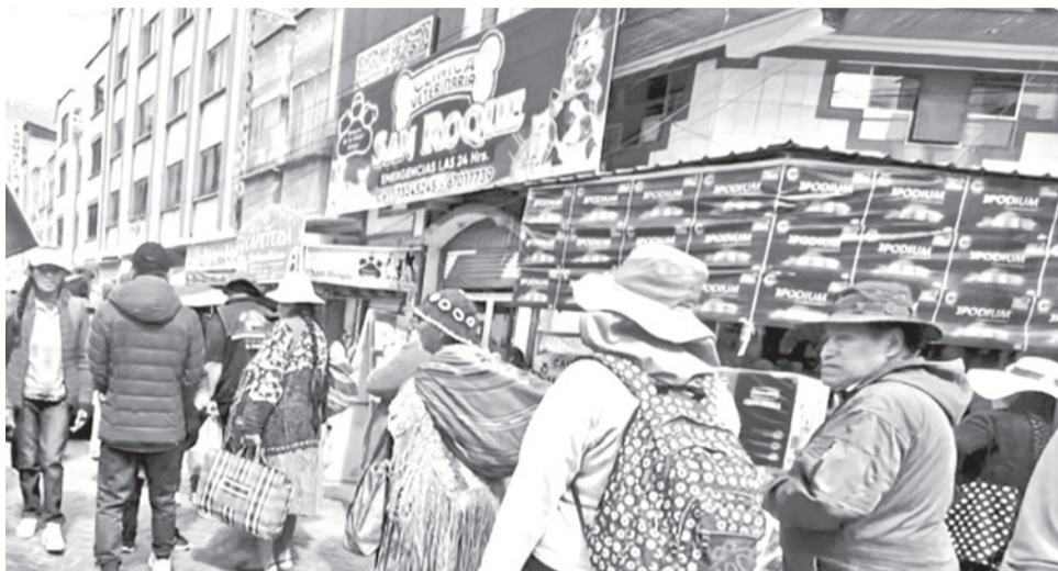
En la ciudad de La Paz los ciudadanos hacen filas para comprar alimentos.

“La dirigencia no tiene que asistir a ninguna invitación”, ordenan.