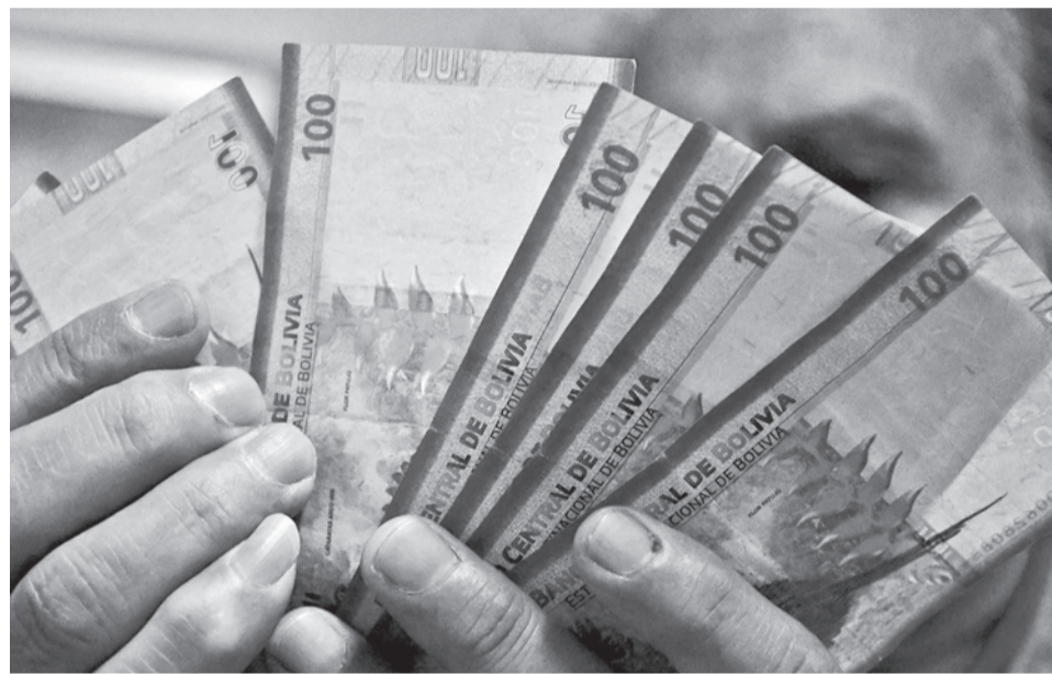
Billetes en bolivianos, que se usa para el pago de impuestos. CARLOS LÓPEZ

La autoridad detalló que, con esa norma, serán condonados los tributos de carácter nacional como el Impuesto al Valor Agregado (IVA), el Impuesto sobre las Utilidades de las Empresas (IUE) y el Impuesto a las Transacciones (IT), entre otros recaudados por Impuestos Nacionales. “Aquí entran también