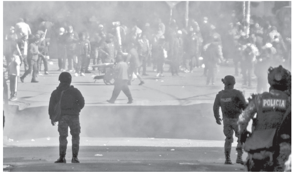
Enfrentamientos en la ciudad de La Paz entre policías y sectores movilizadados.