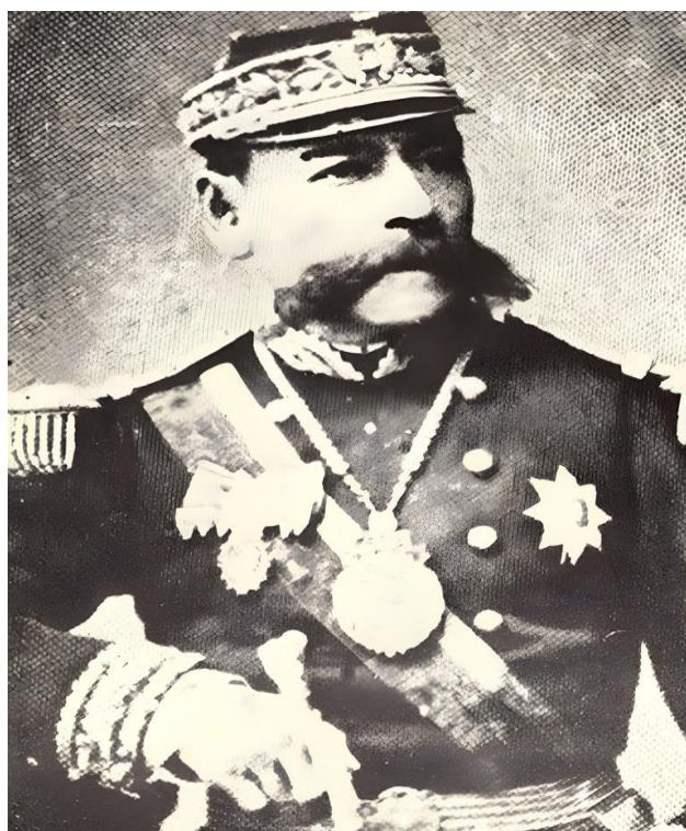
General Narciso Campero Leyes (1813–1896)

La victoria chilena se logró luego de que el regimiento de Atacama escalara inadvertidamente la ladera de Guaneros, que se consideraba un flanco seguro por los defensores, realizando la ofensiva desde la retaguardia de las líneas peruanas.