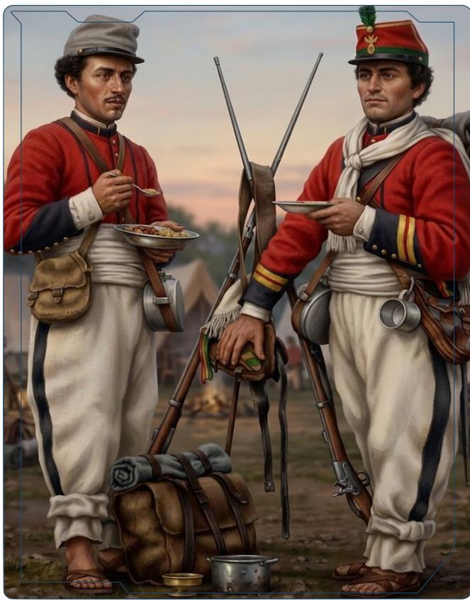
CORONEL ILDEFONSO MURGUÍA ANZE COMANDANTE DEL BATALLÓN 1º DE LÍNEA (COLORADOS) 1876