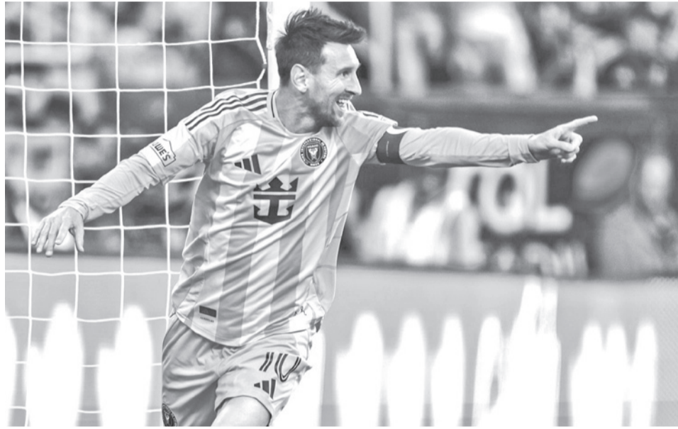
El astro argentino Lionell Messi. INTER MIAMI CF

partidos completos, se retiró caminando de la cancha del Inter en el minuto 73 y enfiló directamente al vestuario después de que se llevara la mano al muslo izquierdo.