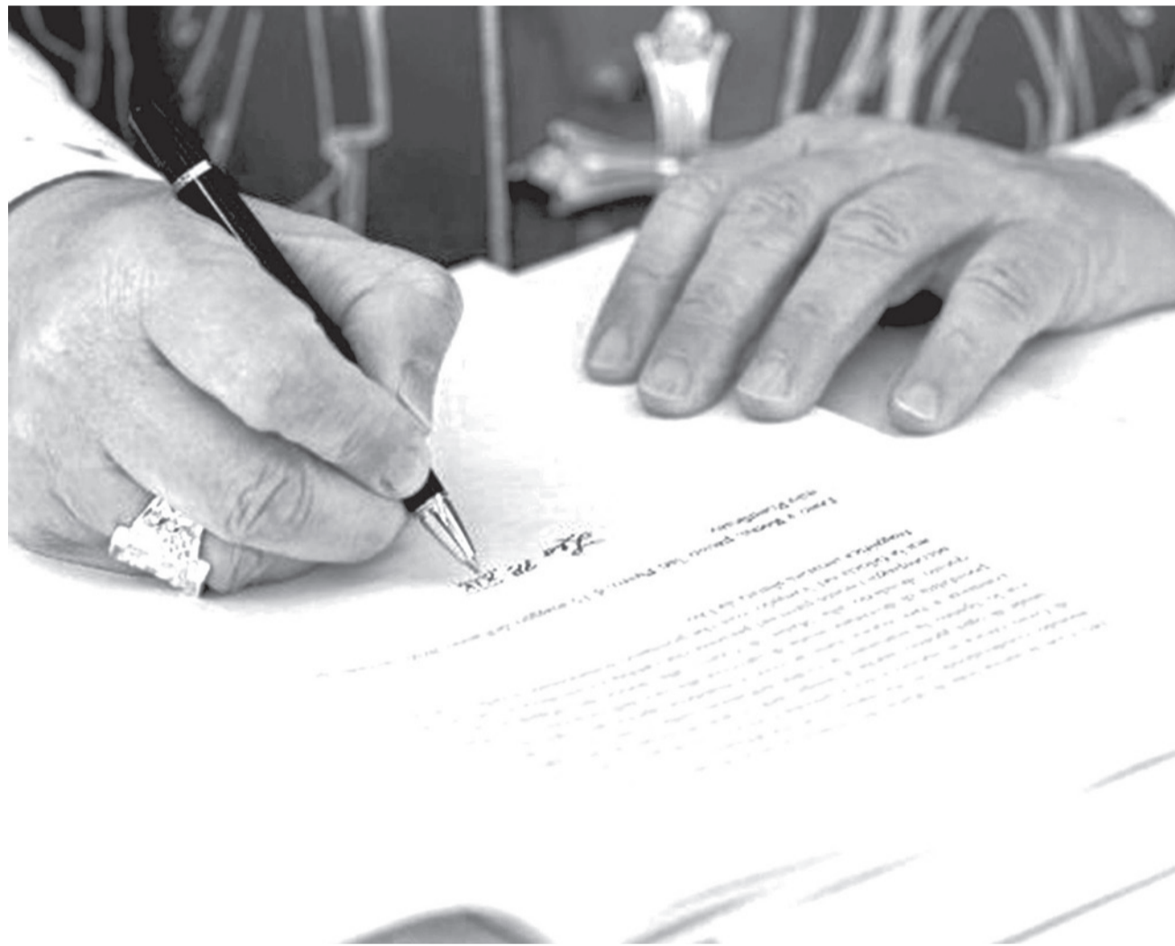
El papa León XIV en la firma de la Carta Encíclica Magnífica Humanitas.

Mensaje. Alerta de los peligros de las nuevas tecnologías y del control de una élite que “corre el riesgo de conducirnos hacia nuevas atrocidades”