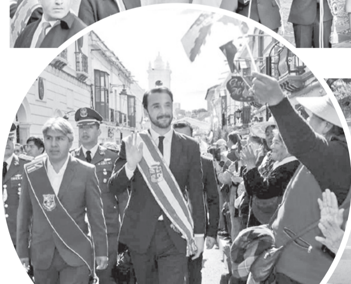
El gobernador de Santa Cruz, en Sucre, ayer.