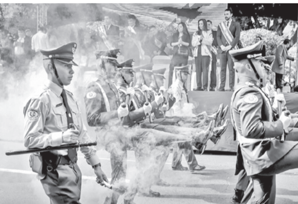
Policías en el desfile en la capita, ayer.

sintieron falta de atención por parte del Estado. “Si el presidente tiene que decir disculpas por no tener el tiempo, el momento para atender, lo hago. Porque el mayor orgullo de un servidor público es atender”, expresó.