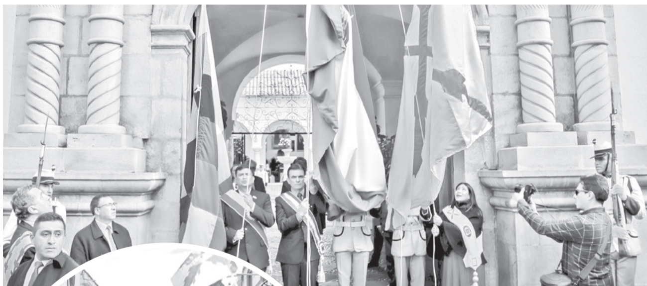
Autoridades en la iza de las banderas. GOBERNACION CHUQUISACA

Reconciliación. Los actos por el Primer Grito Libertario en América Latina estuvieron marcados por evocaciones a la historia que dio lugar al nacimiento de Bolivia y sus retos futuros como país