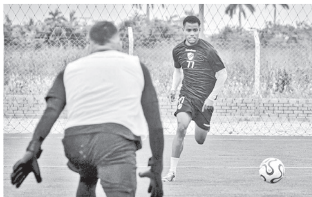
Bolívar enfrentará a Independiente Rivadavia. CLUB BOLIVAR

El encuentro se trasladó de sede, de La Paz a Santa Cruz, debido a los conflictos sociales en el país, que tienen su epicentro en la Sede de Gobierno. En Santa Cruz