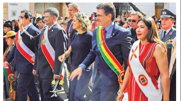
Autoridades en actos de aniversario en Sucre. VXCXV

Por su parte, el gobernador Luis Ayllón afirmó que “las regiones no podemos seguir impuestas por políticas que se definen entre cuatro paredes”. Y agregó que ahora las que definen la historia son las regiones, entre “organizaciones y autoridades”.