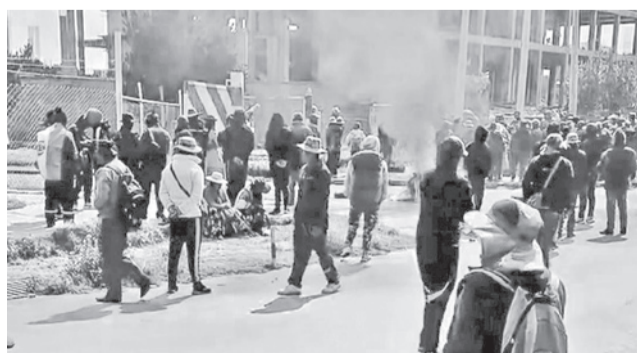
El bloqueo en el ingreso al aeropuerto de El Alto. RADIO ALTERNATIVA

“En este momento, la circulación tanto de ingreso como de salida se encuentra fuertemente restringida debi-