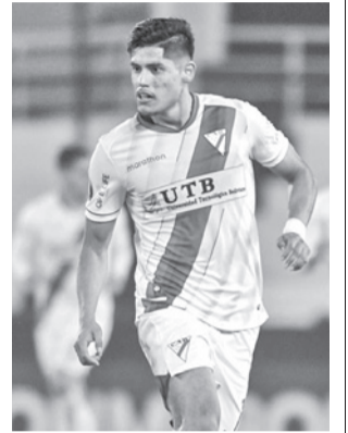
Always Ready se prepara para el partido. CLUB ALWAYS READY

Debido a los malos resultados, el campeón nacional se eliminó con anticipación de la Copa Libertadores, porque ya no puede avanzar a los octavos de final al haber quedado fuera del al-