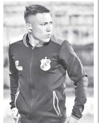
Nacional Potosí está aislado. CLUB NAL POTOSI

El dirigente añadió que es más que imposible pensar en trasladarse, otra vez, en un vuelo charter debido al gasto que les genera y que no está dentro de la planificación. Mencionó que su preocupación está en la seguidilla de