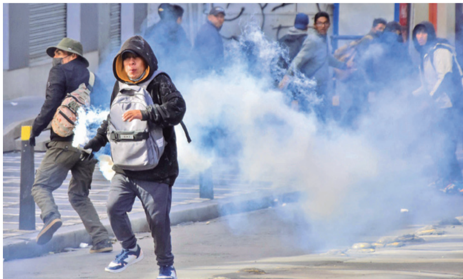
Enfrentamientos en La Paz entre policías y manifestantes, ayer.

Los movilizados cercaron los puntos de ingreso a la plaza Murillo, que estaba custodiada por cordones de seguridad armados de la Policía Boliviana. Hasta las 14:00, esta movilización, que parecía que no tendría enfrentamientos, derivó en violencia cuando un grupo intentó rebasar uno de los cordones en la calle Ayacucho.