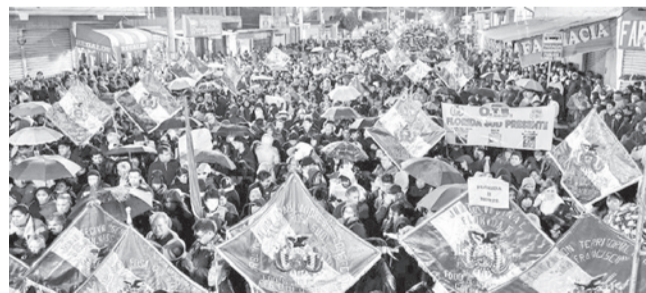
El cabildo realizado en Colcapirhua, el sábado.

Declaratoria. El municipio del valle bajo se declaró en estado de emergencia debido al bloqueo en el botadero y la planta