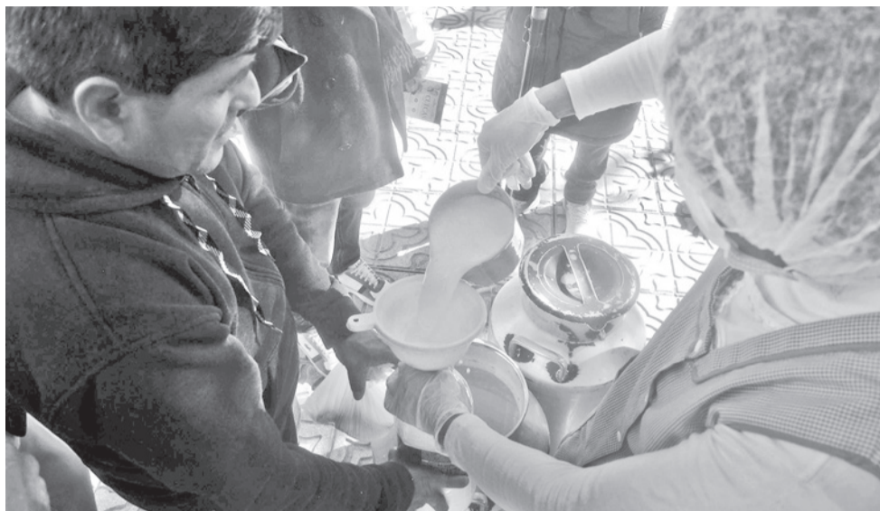
Lecheros rematan su producto en la plaza 14 de Septiembre.