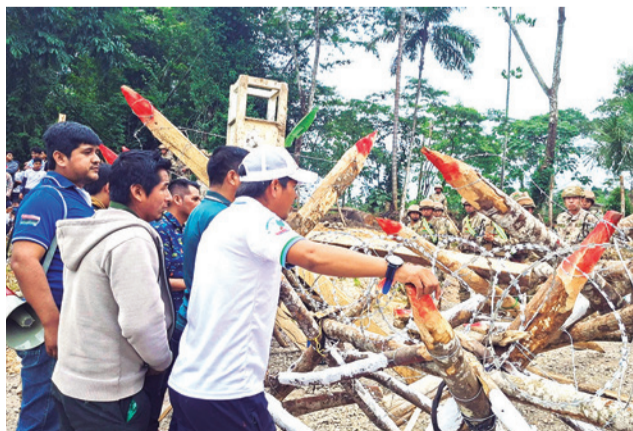
Un grupo de cocaleros del trópico en el cuartel militar de la Novena División en Villa Tunari. RKC

Los representantes cocaleros realizaron esta inspección en presencia de jefes militares y advirtieron que no permitirán la aplicación de un eventual estado de excepción sectorizado que es pedido por algunos sec-