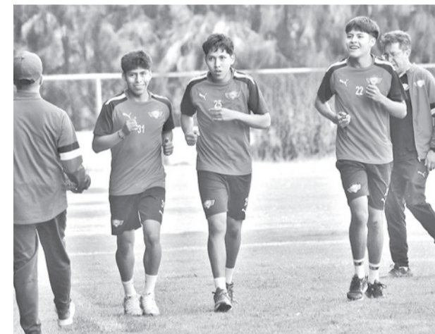
Wilstermann juega hoy en el Capriles.