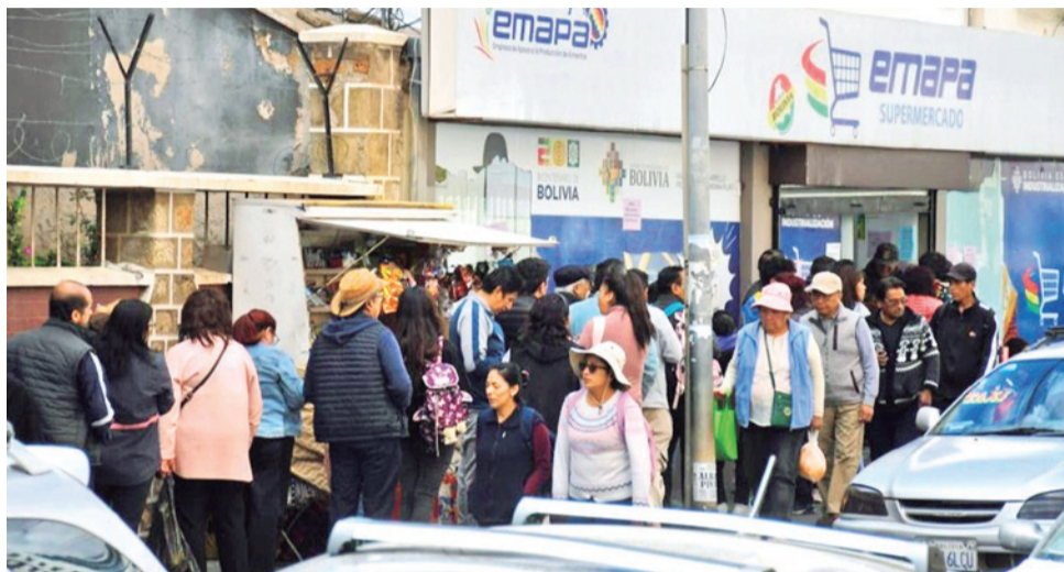
Ciudadanos en La Paz hacen filas para comprar alimentos en Emapa. PALENQUE TV

Desde la ciudad de El Alto, los vecinos avanzan también a pie hasta sus fuentes de trabajo debido al bloqueo de la autopista y de la avenida Naciones Unidas. A diferencia de otros días, el sector de Río Seco, donde estaba el núcleo de la protesta, muestra que hay mayor circulación de transporte.