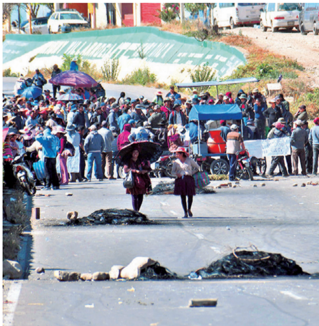
El bloqueo en Huayllani, en Sacaba.