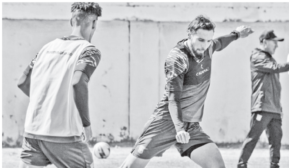
Jugadores de The Strongest durante un entrenamiento.

The Strongest es local para la organización y recaudación del partido. Un clásico es un partido en el cual un club puede tener una importante recaudación por la venta de entradas, pero la asistencia masiva de hinchas este domingo al estadio Hernando