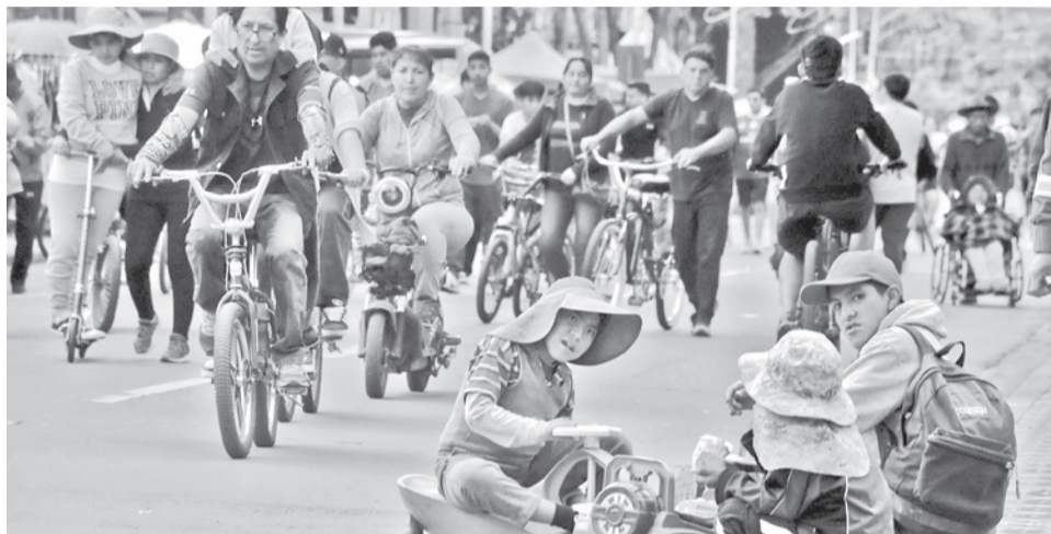
Una jornada dedicada al Día del Peatón y Ciclista en Cochabamba. JOSE ROCHA

El Día del Peatón y el Ciclista es una jornada donde las calles se llenan de vida, deporte y alegría.