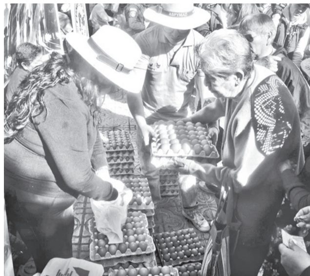
La venta de maples de huevo en la plaza.