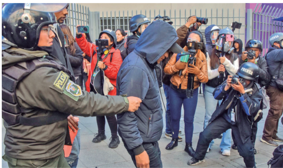
Policías detienen a manifestantes, ayer en La Paz.