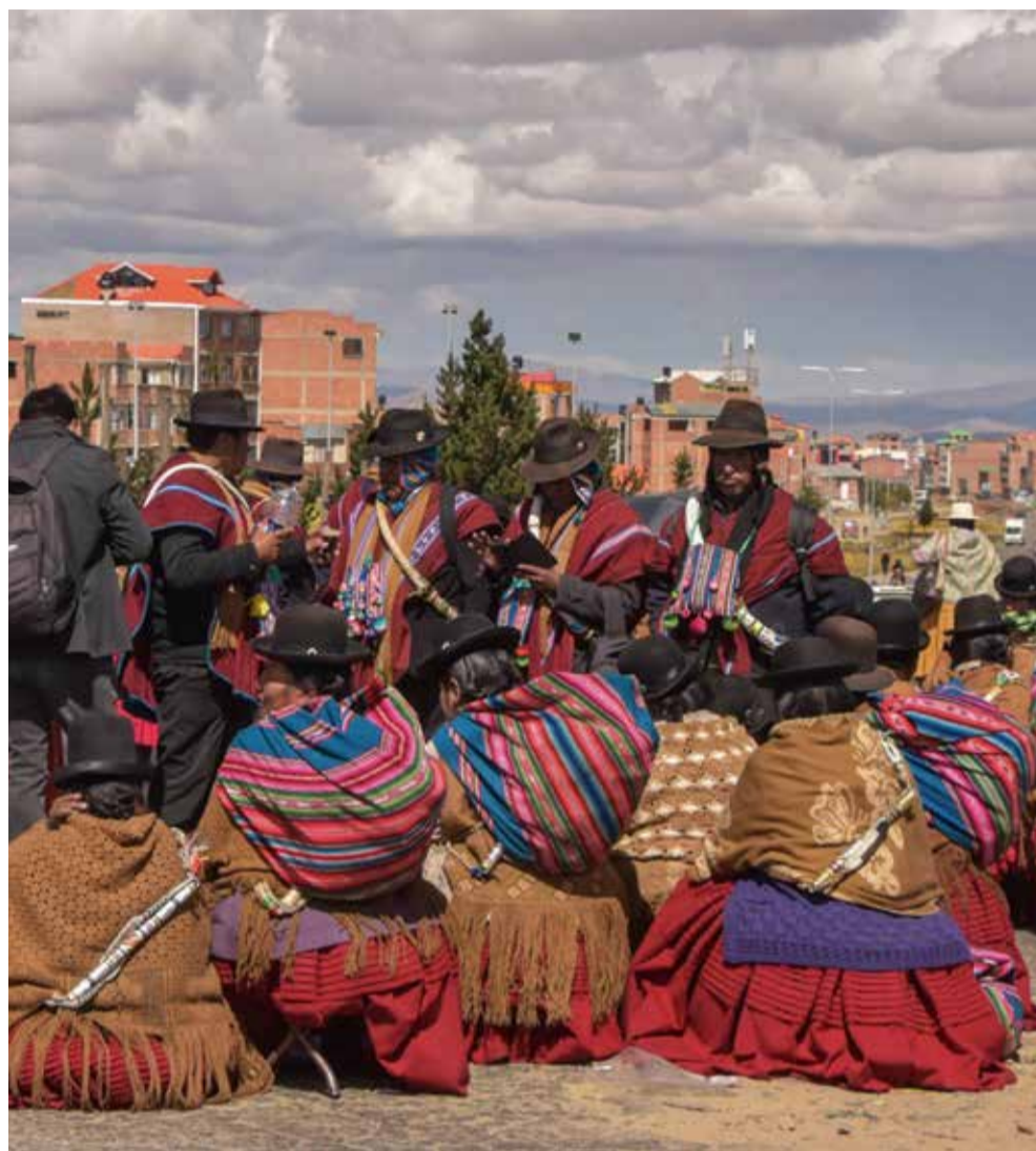
Campesinos de La Paz movilizados por sus demandas.