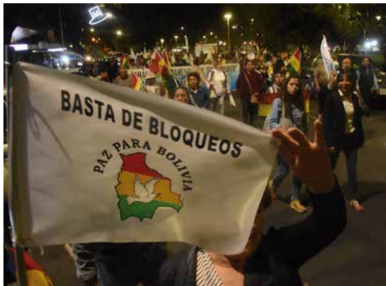
Organizaciones en Cochabamba marchan pidiendo pacificación.