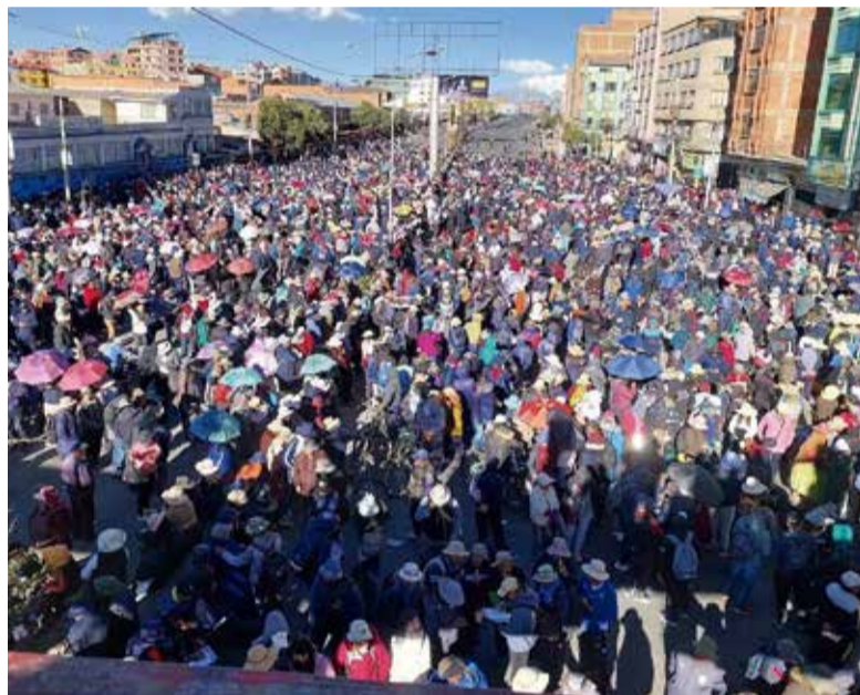
Marcha de sectores sociales que demandan atención en La Paz.

El Gobierno sostiene que Bolivia necesita reformas urgentes para enfrentar la caída de reservas, la crisis fiscal y el agotamiento del modelo económico anterior.