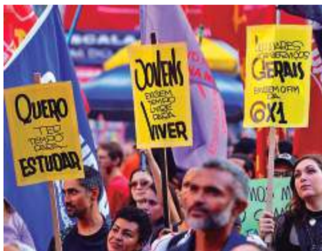
MOVILIZACIÓN. Trabajadores brasileños se movilizan para reducir la carga laboral semanal.

Después de un período de 12 meses, la carga horaria