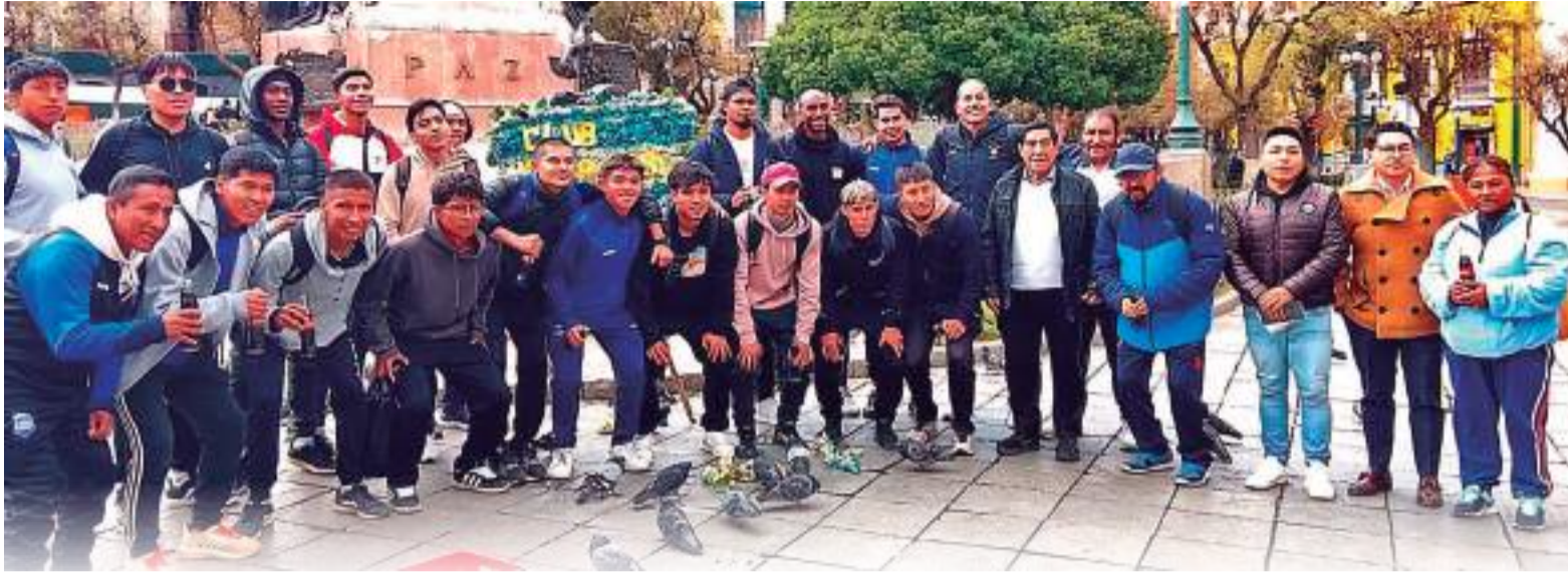
PLANTEL. Jugadores, cuerpo técnico, dirigentes e invitados de Hiska Nacional ayer en el aniversario.