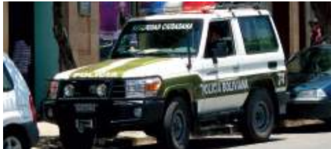
INVESTIGACION. La Policía investiga este caso.

El hallazgo se produjo gracias a la alerta de los comunarios de la zona, quienes observaron el cadáver en una zona de muy difícil acceso topográfico. Efectivos de Bomberos y de la Fuerza Especial de Lucha Contra la Violencia (FELCV)