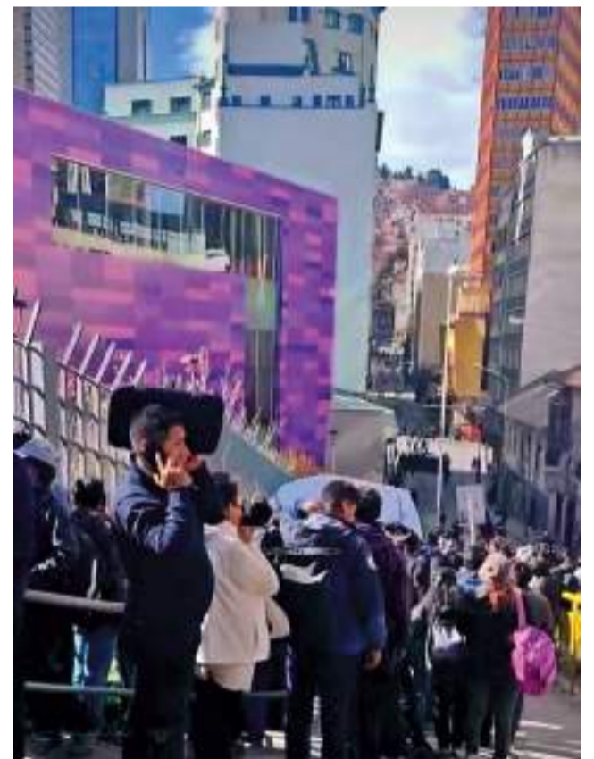
FILA. Personas esperan por su turno para abordar el teleférico.