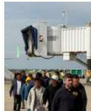
SALIDA. Los bolivianos expulsados el domingo 24.

A su llegada a la terminal aérea cruceña, los 23 fueron escoltados por agentes de la Policía.