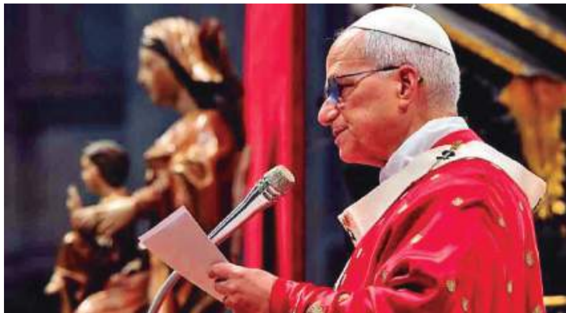
MENSAJE. El Papa emitió su primera encíclica desde que asumió el Pontificado.

Garantías para que no se vuelva a poner en análisis el proyecto de reconversión de la tierra, no privatización de empresas públicas, aunque sea precisa su reconducción, resarcimiento inmediato y sin obstáculos a los transportistas afectados por la gasolina de pésima calidad que importó Yacimientos y un razonable incremento de sueldos y salarios deben ser la base que admita el Ejecutivo para reencauzar la actual situación y que vuelva la paz social que todos los bolivianos anhelan. De lo contrario, sobrevendrá un descalabro.