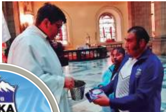
ACTO. Dirigentes del plantel paceño en la misa y la ofrenda floral.

"Felices porque cumplimos 108 años, esta es una gran ins-