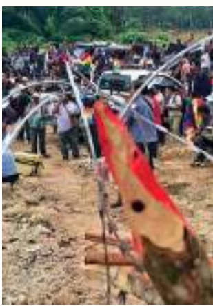
DATO. Cierran el paso a la Novena División del Ejército.