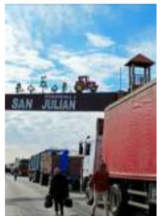
DATO. San Julián cumple hoy 13 días de bloqueo.

Ante la escalada del conflicto y el peligro de enfrentamientos civiles en las carreteras, los comités cívicos de Bolivia extendieron una invitación formal al Jefe del Estado para sostener una reunión nacional de emergencia este jueves en la capital cruceña. En la cita, plantearán declarar un estado de excepción sectorizado.