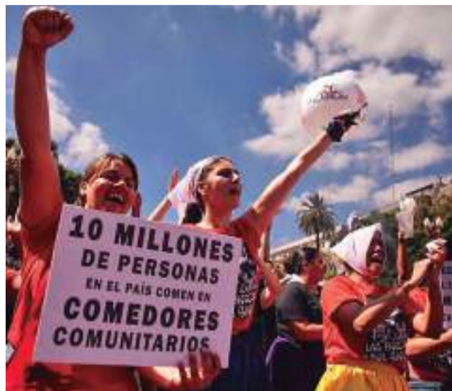
PROTESTA. Manifestantes argentinos contra el Gobierno.

El Fondo Monetario Internacional reclama al Gobierno argentino profundizar los recortes presupuestarios más del 6 por ciento para cumplir la meta que le exige el organismo crediticio, acorde con un nuevo informe de una institución independiente.