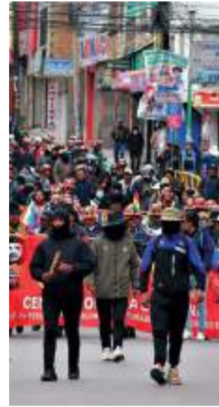
COLUMNA. La movilización de ayer.

llegó con palos y petardos hasta los tres anillos de seguridad instalados en inmediaciones de la plaza Murillo y la Vicepresidencia. La Policía intervino con agentes químicos. Hubo choques violentos. Una cantidad indeterminada de personas fue arrestada cerca del teleférico Morado, por participar de la movilización. La Policía los sindicó de enfrentar con piedras y palos a los uniformados. Sin embargo, algunas vendedoras del sector reclamaron porque se trataba de gente que solo transitaba.