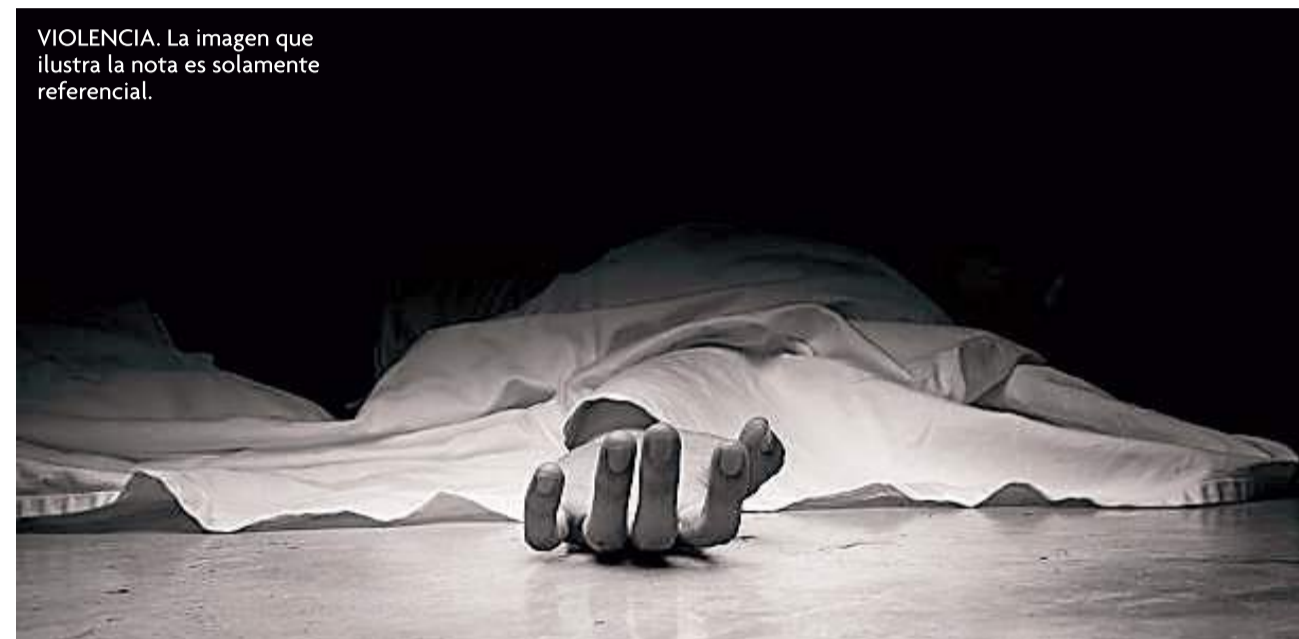
VIOLENCIA. La imagen que ilustra la nota es solamente referencial.

Con el transcurrir del tiempo y los efectos del alcohol, el agresor comenzó a exigir la devolución inmediata del dine-