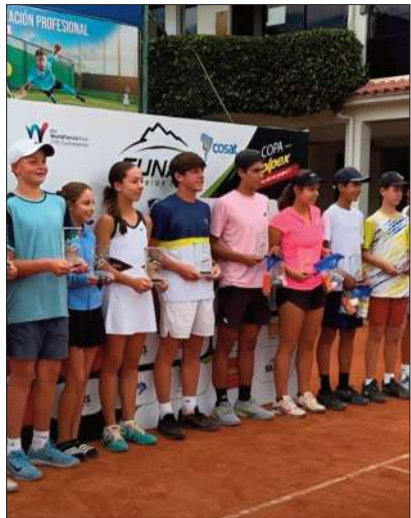
Algunos de los tenistas premiados.