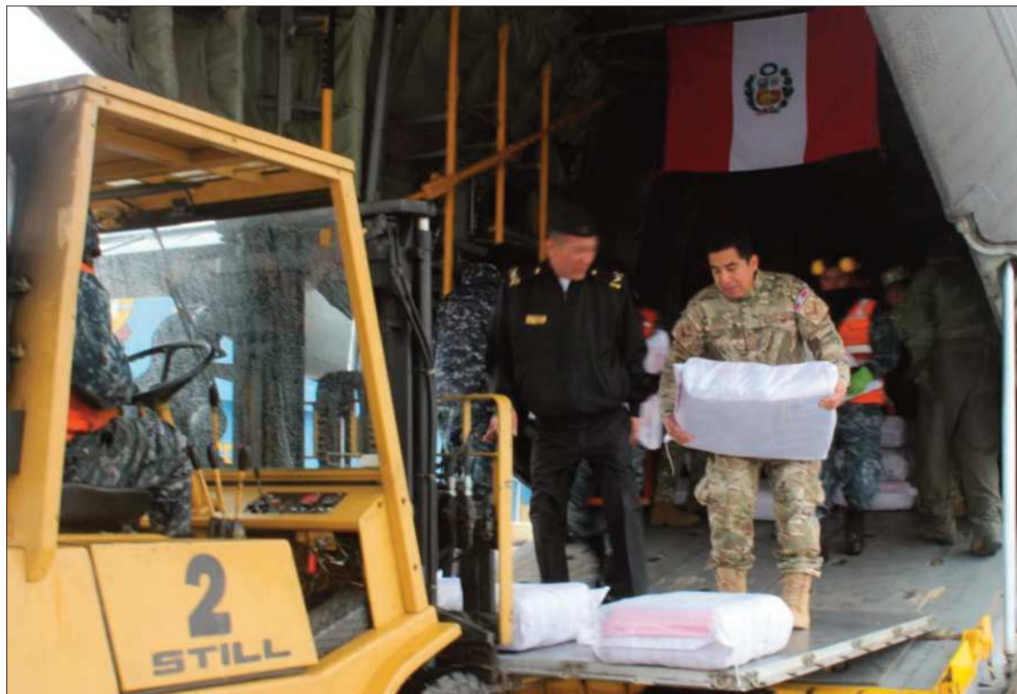
APOYO. Personal de la Fuerza Aérea de Perú realiza el descarga de la donación alimentaria.