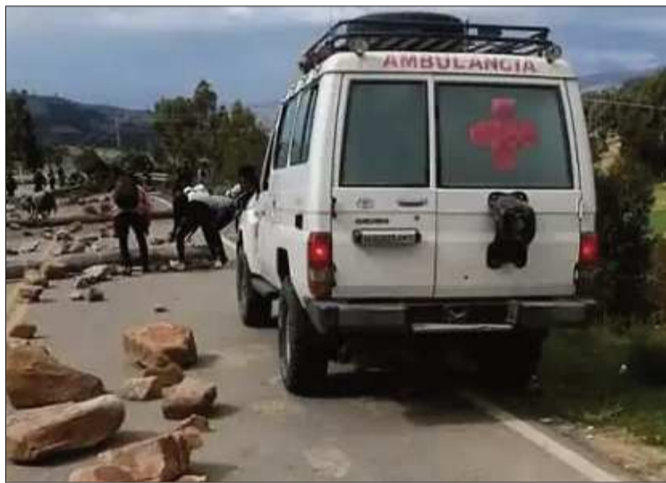
CONFLICTO. En algunos bloqueos no dejan pasar ambulancias.

La organización instruyó permitir el paso “inmediato y sin restricción” de ambulancias, brigadas