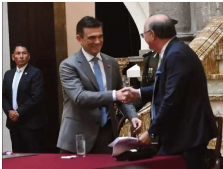
ENCUENTRO. El presidente Rodrigo Paz junto a Ilan Goldfajn, titular del BID.

"La estabilidad y el desarrollo de Bolivia son importantes para su gente y para la región. Desde el