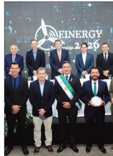
Presentación del evento ferial.

La jornada concluyó con la sistematización de propuestas técnicas provenientes de los distintos sectores participantes, estableciendo una hoja de ruta orientada a la reactivación económica, la generación de oportunidades y el fortalecimiento del aparato productivo regional.