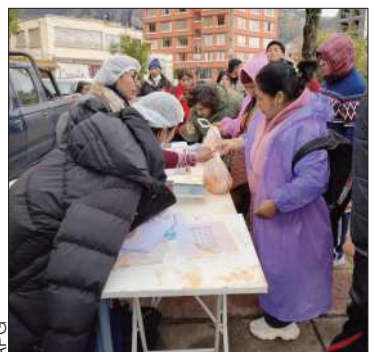
Comercialización de carne de pollo.

Se reiteró que mantiene habilitadas sus sucursales en la urbe paceña