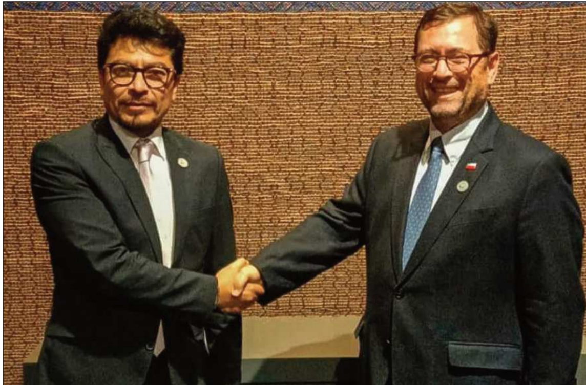
REUNIÓN. Los cancilleres Fernando Aramayo y Francisco Pérez Mackenna, en un encuentro en La Paz.

Pérez Mackenna señaló que “la delincuencia organizada transnacional es una de las principales amenazas para la estabilidad, el desarrollo de los países y la seguridad de las personas”, junto con agregar que “debido a su naturaleza transfronteriza, los esfuerzos de los países de manera individual son insuficientes y deben complementarse con mayor cooperación política y técnica, interoperabilidad institucional e intercambio oportuno de información. La clave es la unidad”.