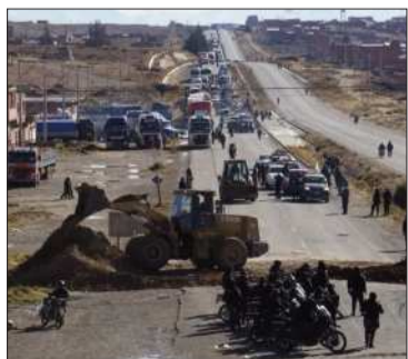
Desbloqueo en ruta La Paz-Oruro.

El caso fue abierto por el delito de homicidio tras la muerte de un comunario