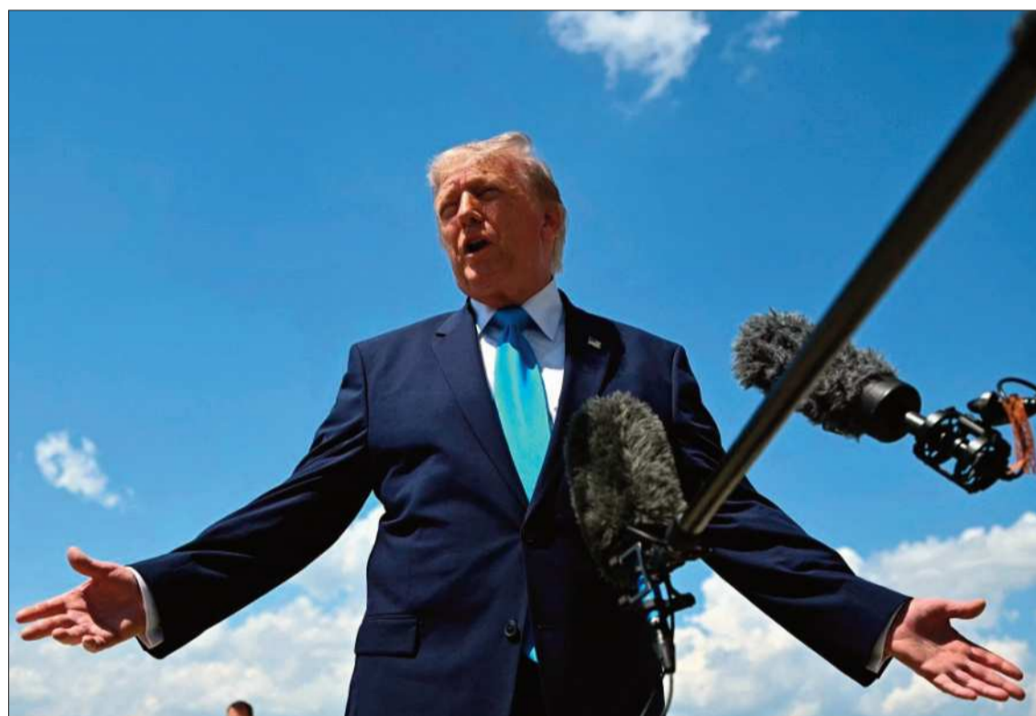
CAUTELA. El mandatario estadounidense Donald Trump brinda una conferencia de prensa.

“Ambas partes deben tomarse su tiempo y hacerlo muy bien”, escribió Trump en la misma publicación en Truth Social, al tiempo que arremetió contra el acuerdo nuclear de 2015 que el expresidente Barack Obama pactó con Irán y otras potencias occidentales que permitió el enriquecimiento