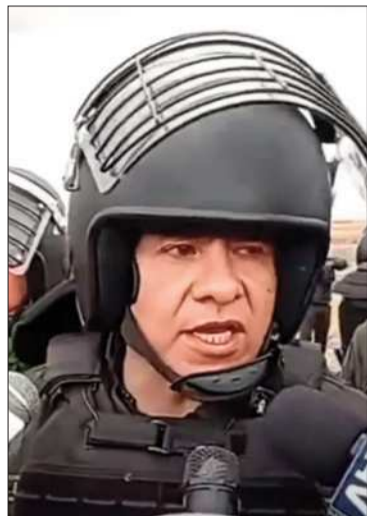
El comandante de Oruro.

Policías fueron atacado en el despeje de vías en ese departamento