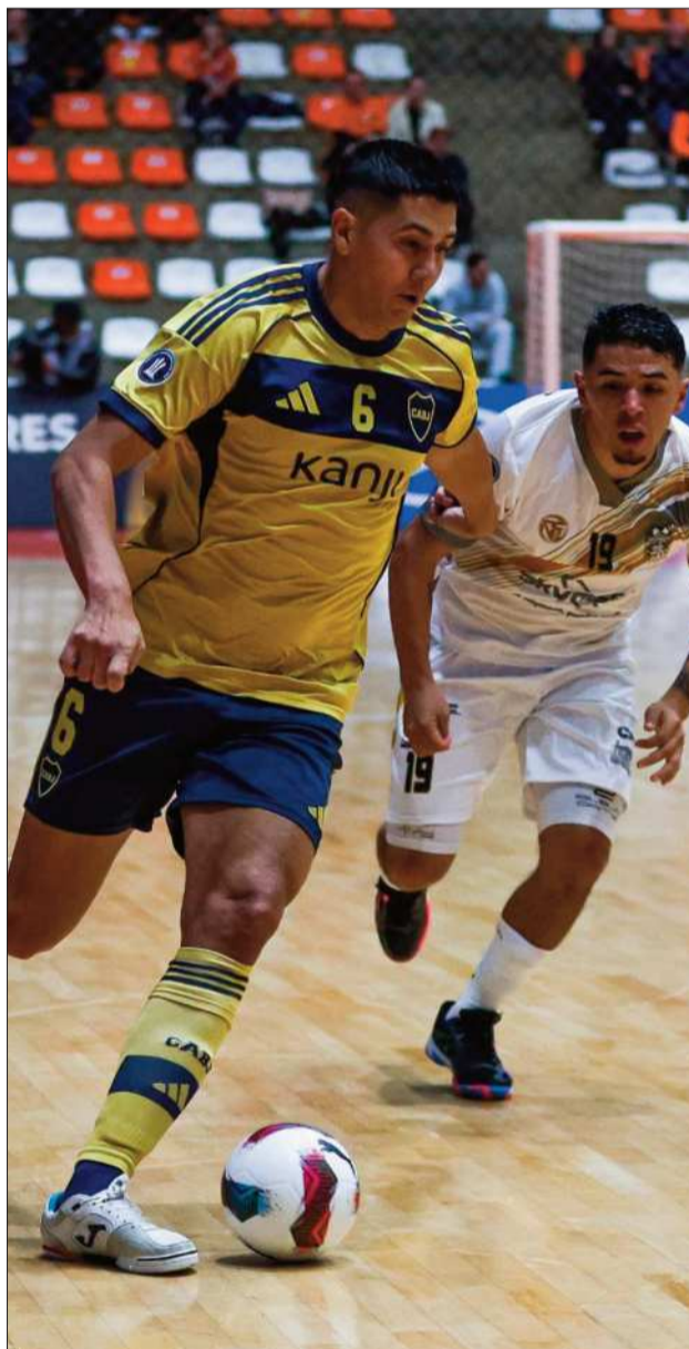
INCIDENCIAS. Una acción del partido de Fantasmas.