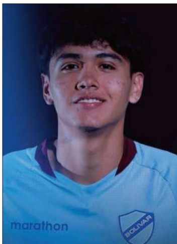
Un prejuvenil Sub-17 de Bolívar.

El partido se disputó en Medellín, donde el conjunto 'Millonario' mostró superioridad desde el inicio y resolvió el compromiso durante el primer tiempo.