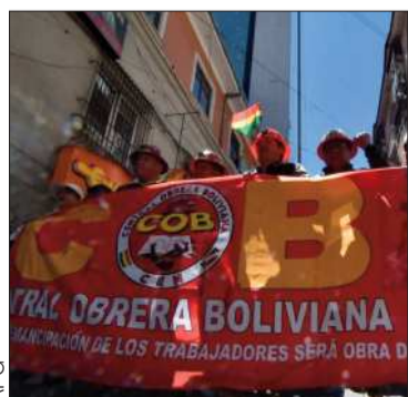
Una marcha de la COB en La Paz.

La decisión fue asumida en un ampliado del ente matriz el sábado