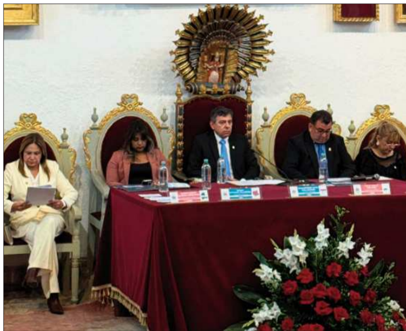
SUCRE. El pleno camaral del Senado sesionó en la capital del Estado.

Aprobada la propuesta de norma en la Cámara Alta, ahora el debate se trasladará a Diputados.