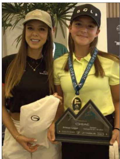
Dos distinguidas del certamen.