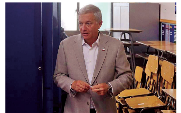
IMPOPULAR. José Antonio Kast, presidente de Chile.