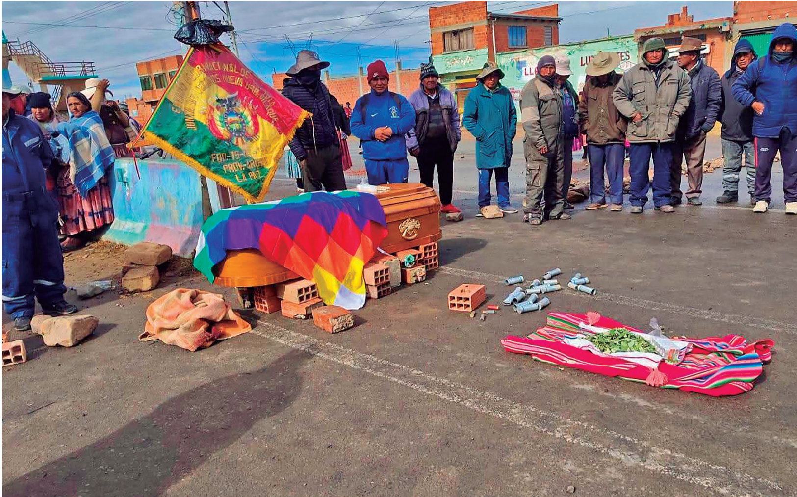
LUTO. Los habitantes de Copata velaron al hombre que falleció en los enfrentamientos del pasado sábado, en la carretera que une La Paz con Oruro.