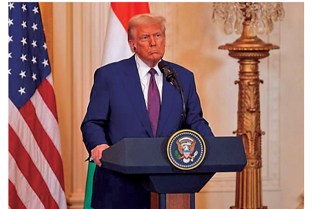
MANDATARIO. Donald Trump, presidente de EE. UU.