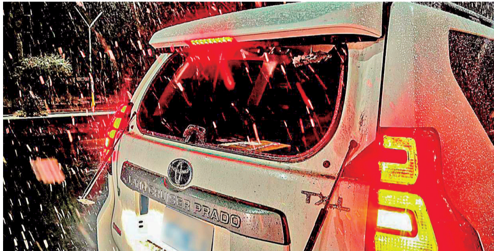
PELIGRO. La vagoneta del Ministerio de Obras Públicas con el parabrisas quebrado.

“La prolongación de este conflicto amenaza con el desabastecimiento total de alimentos en todo el territorio nacional. Ante el evidente fracaso del corredor humanitario, el Gobierno no cuenta con otra alternativa que decretar de manera inmediata estado de excepción sectorizado, apoyado en la Constitución Política del Estado”, sostuvo el cívico mientras daba lectura al comunicado del organismo cívico cruceño.