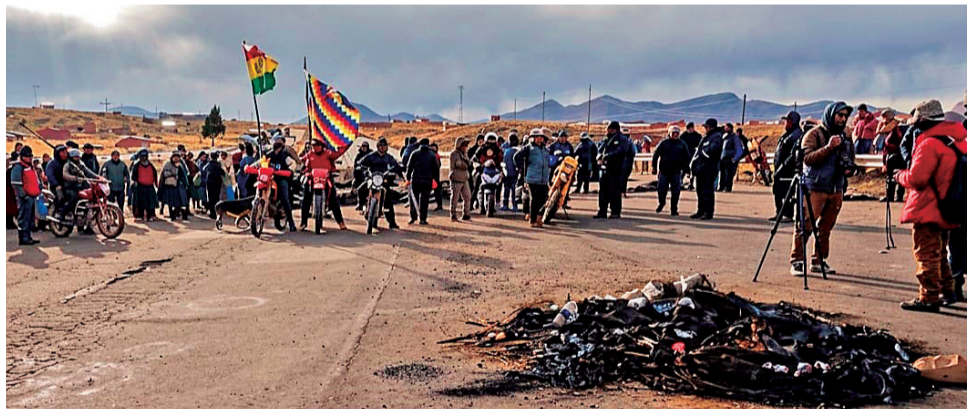
CARRETERA. Ni bien pasaron la Policía y las Fuerzas Armadas, volvió el cierre de la vía.