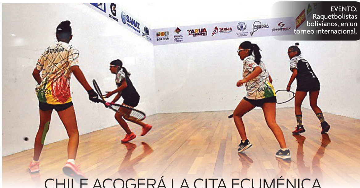
EVENTO. Raquetbolistas bolivianos, en un torneo internacional.

“Nuestro objetivo, en principio era el Mundial Open, pero lamentablemente los dirigentes no contamos con respaldo económico, por lo que Chile será sede”, agregó.