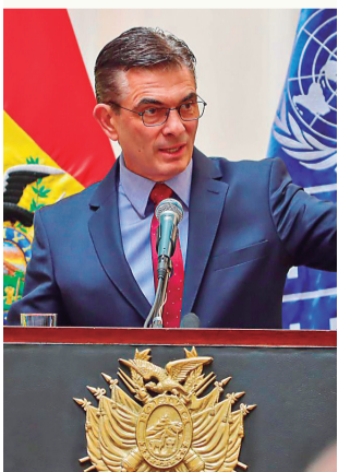
ARGENTINA. El Presidente habló para un medio.

Con relación al Corredor humanitario sostuvo que hay personas que insisten con el bloqueo y que sus demandas devienen desde hace 20 años, pero también hay gente que ya no quiere perder el tiempo y trabajar. “Hay un grupo de gente que quiere trabajar y salir adelante, por eso ellos se organizan para salir a desbloquear, por lo que el problema no es general sino son en algunos tramos de La Paz”, aseguró el Primer Mandatario.