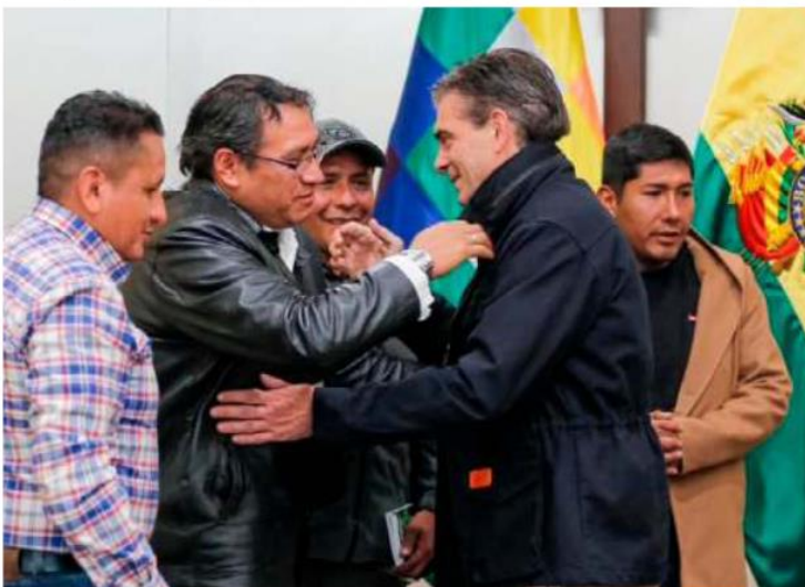
El Presidente Rodrigo Paz lidera la reunión con la dirigencia de Adepcoca en la Casa Grande del Pueblo

Como señal de voluntad para avanzar en esta agenda conjunta, Choque confirmó que Adepcoca asistirá formalmente al Consejo Económico y Social convocado por el Gobierno central para el miércoles 27 de mayo en la sede del Gobierno. Este paso es considerado un acuerdo estratégico del Ejecutivo en su intento por aglutinar a los principales actores sociales y productivos del país, buscando estructurar respuestas a la coyuntura actual y mitigar conflictos en las calles.