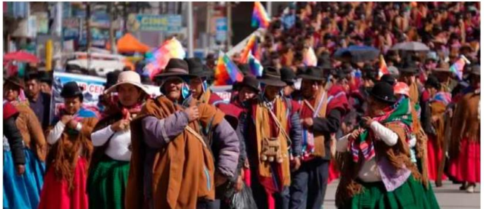
Los campesinos de La Paz y la COB lideran las protestas en Bolivia

"El Comité Ejecutivo Nacional de la gloriosa y revolucionaria Confederación Sindical Única de Trabajadores Campesinos de Bolivia (...) instruye masificar el bloqueo nacional de caminos hasta que renuncia el presidente", cita textualmente el documento resolutivo de la dirigencia campesina. A esta postura política y de movilización se ha sumado la Central Obrera Boliviana (COB), sector que respal-