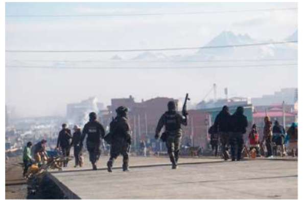
Autoridades de Gobierno realizaron un operativo conjunto entre la Policía Nacional y Fuerzas Armadas

Tras recibir una negativa rotunda por parte de los comunarios y ser atacados con piedras