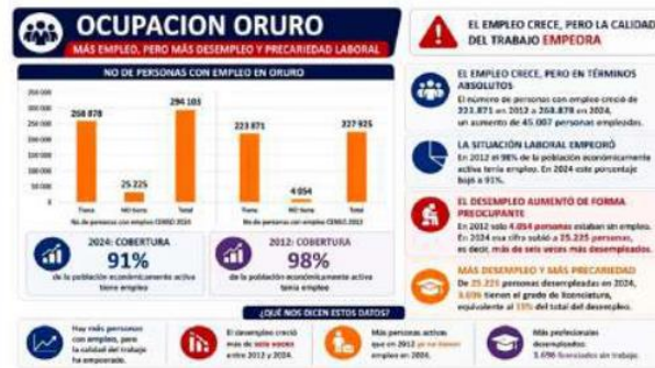
Cuadro estadístico elaborado por la Secretaría Departamental de Planificación del Desarrollo /GADOR

Estos datos muestran que el número de personas con empleo creció de 223.871 en 2012 a 268.878 en 2024, lo que representa un aumento absoluto de 45.007 empleos; sin embargo, el porcentaje de la población económicamente activa con trabajo disminuyó del 98% al 91%. Además, el incremento del desempleo fue significativo, ya que pasó