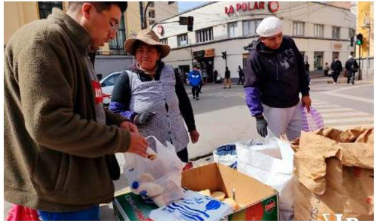
Unidos en Acción retira venta de pan de la plaza 10 de Febrero y se reubica / LA PATRIA

El asambleísta expresó: "Desde mi percepción comparto que hay que hacer un trabajo más