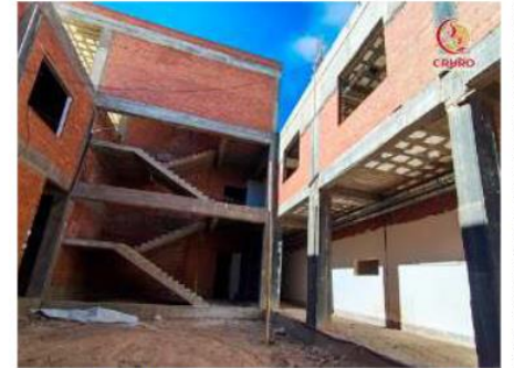
El alcalde realizó la inspección a la construcción este sábado