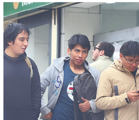
La población joven percibe pocas oportunidades en medio de la crisis

Para ella, incluso el salario mínimo de Bs 3.300 quedó lejos de lo que realmente están ofreciendo algunas empresas. "Ahora están pagando dos mil quinientos, dos mil cuatrocientos, así nomás", explica.