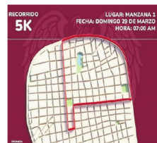
El afiche del evento

A través de un instructivo oficial, la Dirección Departamental de Educación también recomendó reforzar las medidas de bioseguridad dentro de las aulas, promover el uso de abrigo adecuado y aplicar controles preventivos en coordinación con las comisiones de salud de cada establecimiento educativo.