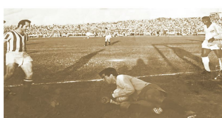
Estadio lleno y Ladislao Jiménez controla el balón ante la mirada de Pelé.