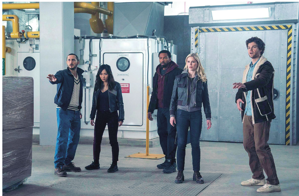
En el último tramo de la temporada se ha notado la falta de acierto a la hora de repartir los diferentes giros y puntos de avance de trama