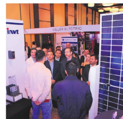
El evento será en Expocruz.

tivas, la necesidad de diversificar la matriz energética y el desafío del agotamiento progresivo del gas natural. En ese contexto, Finergy buscará generar propuestas y soluciones. La feria es organizada por la Sociedad de Ingenieros de Bolivia y el Colegio de Ingenieros Eléctricos y Electrónicos.