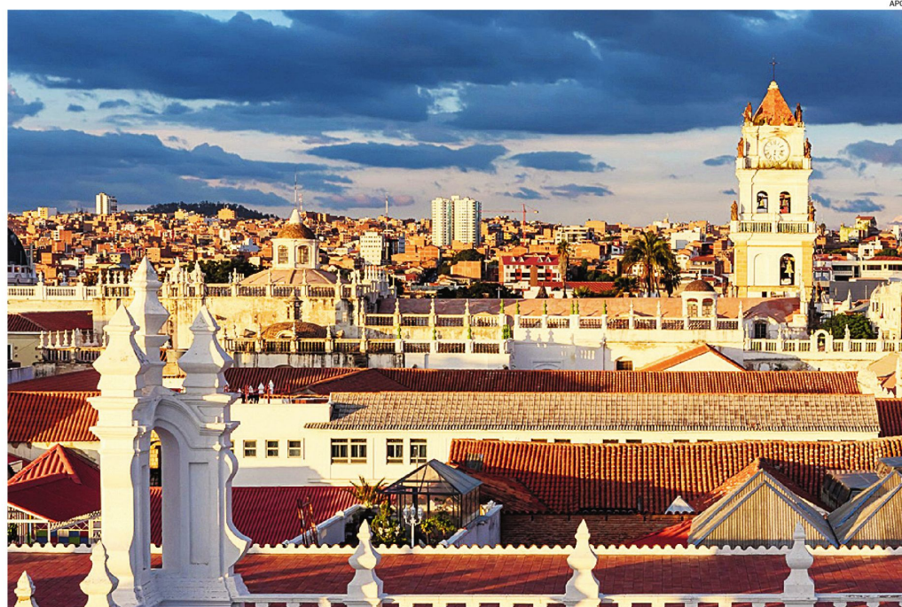
La imagen muestra la riqueza arquitectónica que tiene la ciudad de Sucre, capital de Bolivia.

En la segunda quincena de julio, la ciudad de Sucre será la sede de la 'Semana de la Sostenibilidad de los Premios Verdes, Capítulo Bolivia', una plataforma que impulsa el desarrollo sostenible con el respaldo del Estado boliviano y el sector privado.