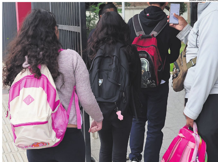
El Servicio de Educación determinó iniciar el horario de invierno debido a las bajas temperaturas.

Alcócer explicó que el inicio del horario de invierno no será uniforme en todas las regiones. Precisó que las direcciones distritales podrán solicitar la aplicación anticipada de la medida mediante informes coordinados