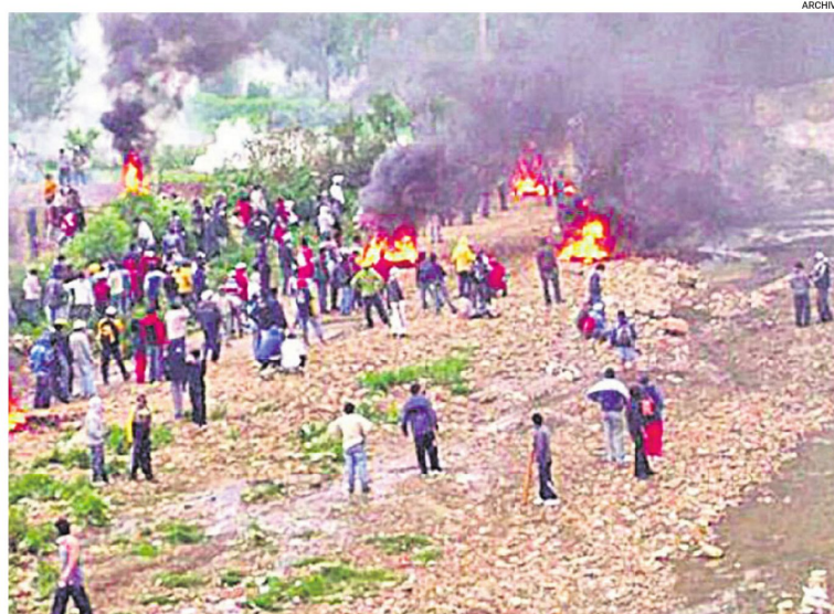
La muerte de universitarios en La Calancha en 2007 precedió al arrodillamiento de indígenas en la plaza

Este 24 de mayo se cumplen dieciséis años de la puesta en vigencia de la Ley Contra el Racismo y Toda Forma de Discriminación. Los discursos y acciones discriminatoras reflataron en los últimos días, por los violentos bloqueos en varios puntos del país