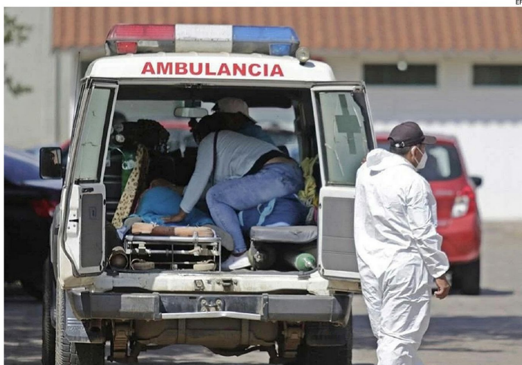
Cuatro personas han muerto por no recibir auxilio médico oportuno debido a los bloqueos de rutas

“ Los manifestantes tienen derecho a la protesta pacífica; no es aceptable la violencia ”