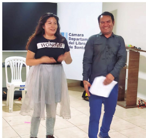
Últimos ensayos para las actividades en el pabellón infantil de la FIL

Por eso, el pabellón infantil tiene para los días del evento al menos ocho cuentos programados junto a actividades lúdicas que resaltan los derechos humanos.