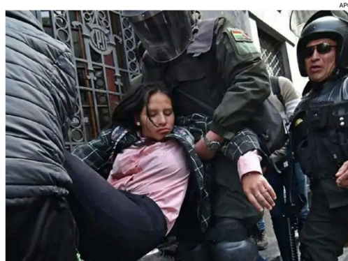
Una periodista es atendida tras ataques de grupos movilizadores

RSF advirtió que la violencia provino tanto de manifestantes como de fuerzas del orden, además de grupos vinculados a cooperativas mineras.