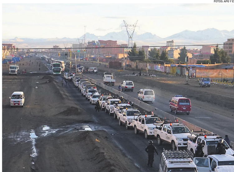
La caravana abrió paso en las zonas bloqueadas, pero la movilización se reanudó casi de inmediato

Aunque el corredor logró abrir temporalmente algunos tramos de la carretera, los bloqueos fueron reinstalados apenas pasaba la caravana oficial. En la Ceja