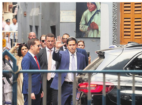
El secretario de Estado de Estados Unidos, Marco Rubio, en India.

Según el portavoz, las partes buscan actualmente acordar un