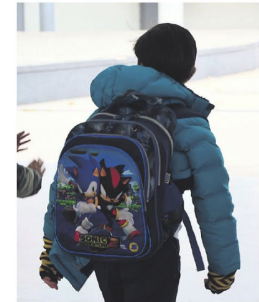
Se anuncia frío más intenso

cibe menos de Bs 2.500 al mes. Analistas plantean reformas legales para contratar y para abrir emprendimientos. A4-5