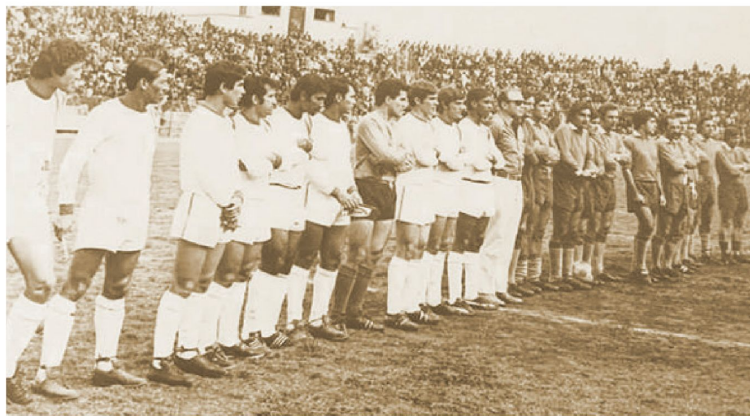
Oriente Petrolero jugó con Independiente de Avellaneda. El amistoso ante el equipo argentino se disputó en la ciudad de La Paz.