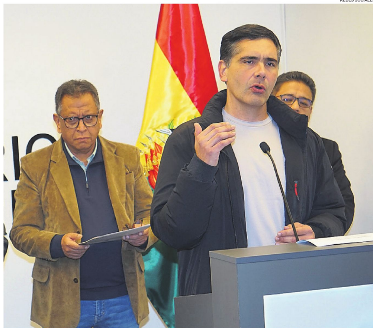
Los ministros lanzaron la invitación para el diálogo y para la agenda del Consejo Económico y Social

La autoridad también informó que el pasado viernes el Gobierno sostuvo una reunión de aproximadamente cinco horas con la