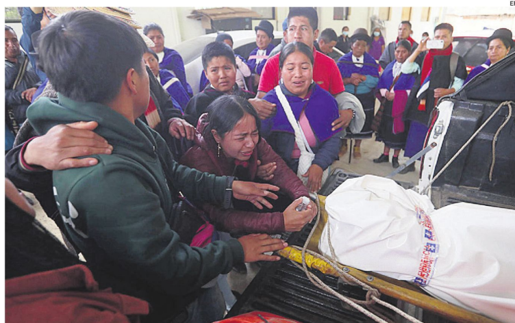
Indígenas de la comunidad Misak lloran un fallecido en el municipio de Silvia.

Por su parte, las autoridades indígenas nasa aseguran que