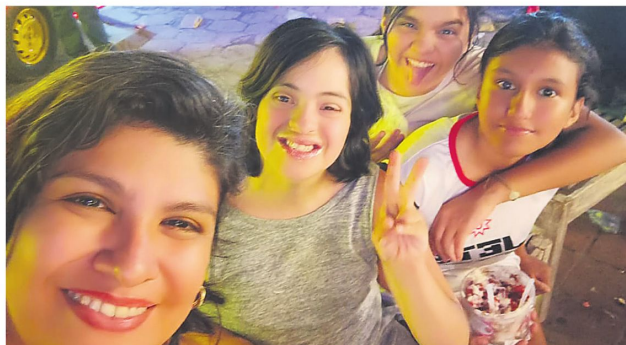
Momentos familiares que han quedado plasmados en retratos que atesora. Son recuerdos imborrables para toda la familia