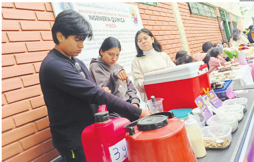
Ante la falta de oportunidades laborales concretas, varios jóvenes optan por emprender en un mercado laboral cada vez más limitado y competitivo

Según el Censo 2024, la población entre 15 y 24 años representa más del 18% de la población total.