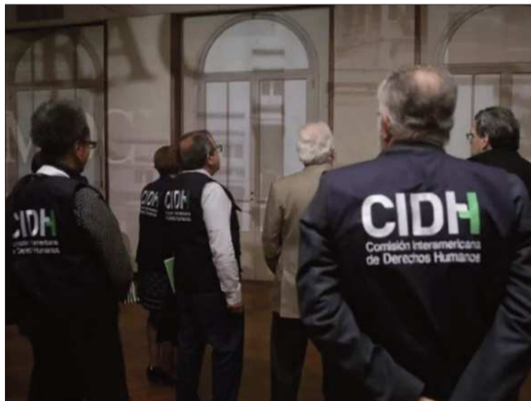
ENTIDAD. Una delegación del organismo internacional.

En su cuenta de X, el organismo lamentó la muerte de tres personas que no habrían recibido aten-