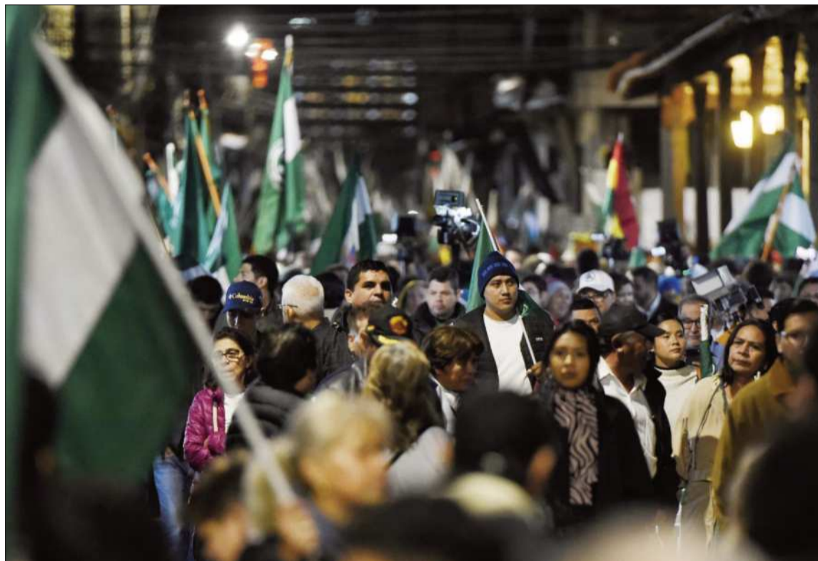
PROTESTA. La Marcha por la Democracia inundó las calles del centro de Santa Cruz de la Sierra.

“El Gobierno tiene una responsabilidad constitucional con todo el país. Tiene que garantizarnos poder trabajar, producir y salir