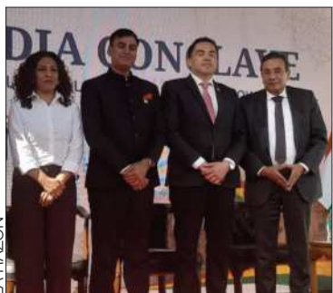
Asistentes al India Conclave.

FEPLP y Cadinpaz piden alianzas integrales y profundizar vínculos