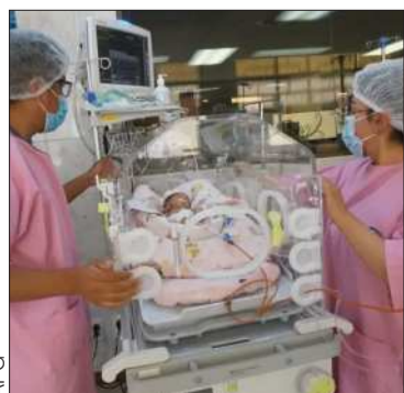
Bebé prematuro en incubadora.

La situación de los hospitales se agrava debido a los bloqueos