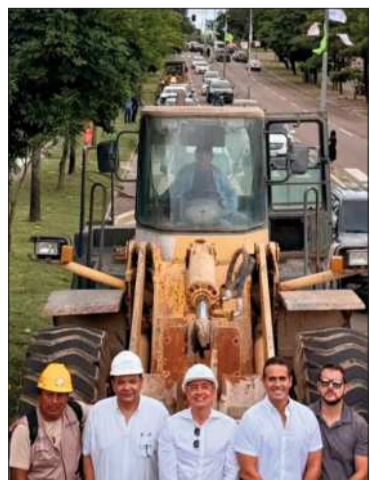
Constructoras se movilizaron.

Cadecocruz pidió al Gobierno actuar en el marco de la Constitución