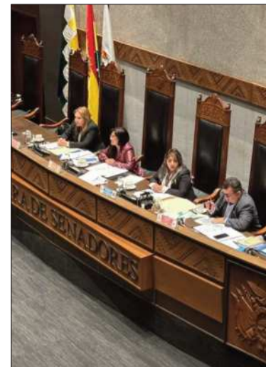
Sesión de la Cámara de Senadores

El Senado también pidió el miércoles detener los hechos de violencia registrados en el país, específicamente en La Paz.