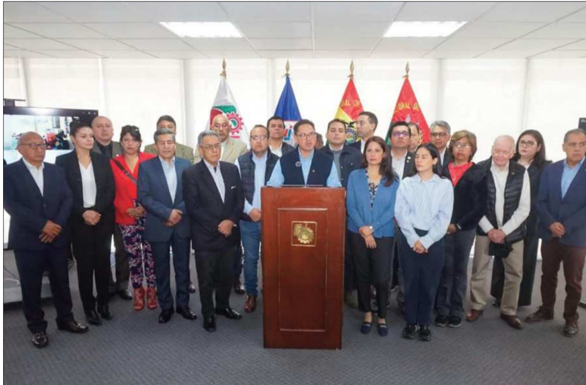
PRONUNCIAMIENTO. Conferencia de prensa conjunta de representantes del sector industrial.

El sector lechero añadió una paradoja dolorosa: productores del altiplano, impedidos de trans-