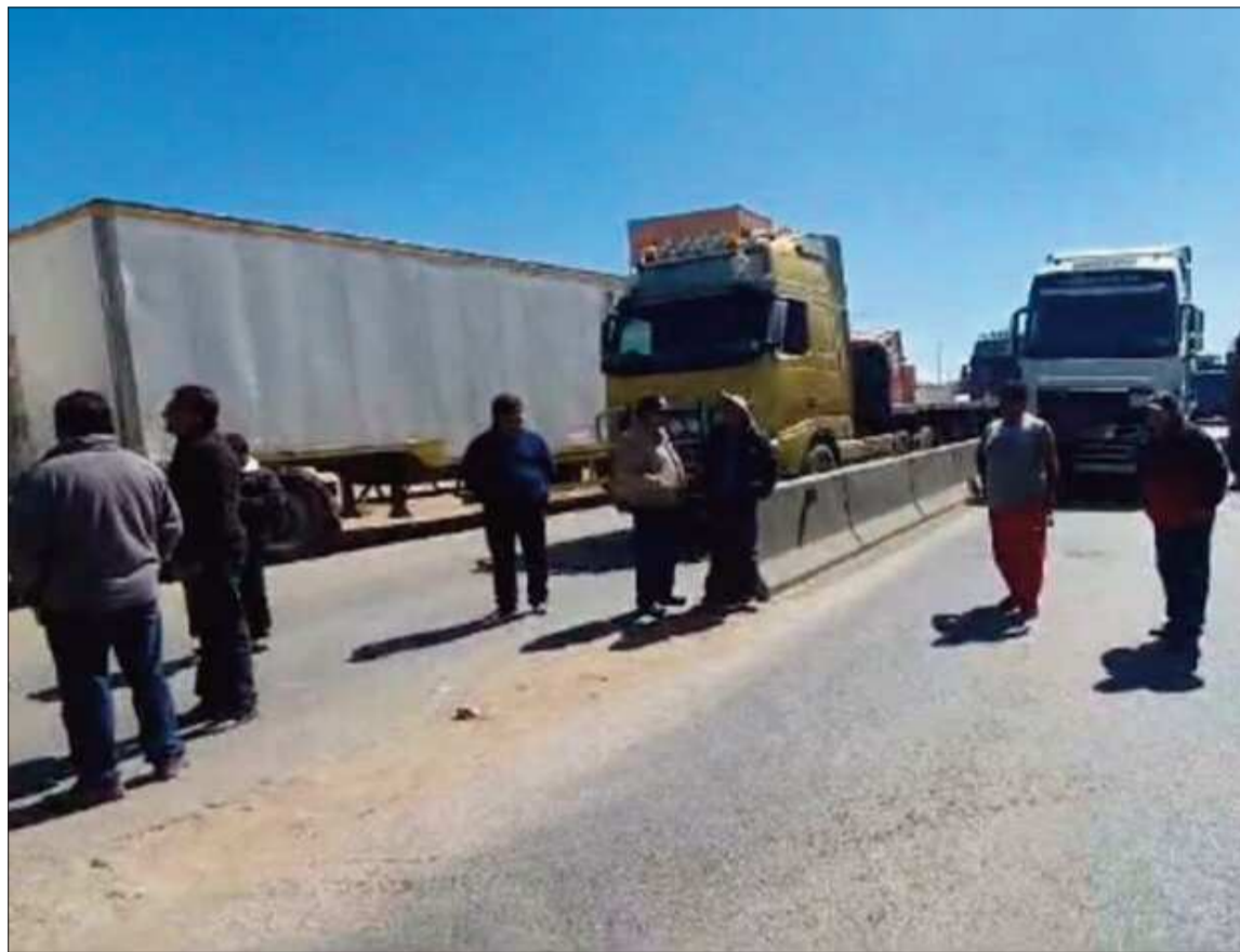
MEDIDA. El transporte pesado en un punto de bloqueo en el departamento de Oruro.

El dirigente puso en números lo que significa cada día de paralización para un transportista: en condiciones normales, un chofer de carga pesada realiza aproximadamente un viaje por semana a cualquier punto del país, lo que le genera una ganancia de entre Bs 5.000 y Bs 6.000. Tres semanas de bloqueo representan, para cada