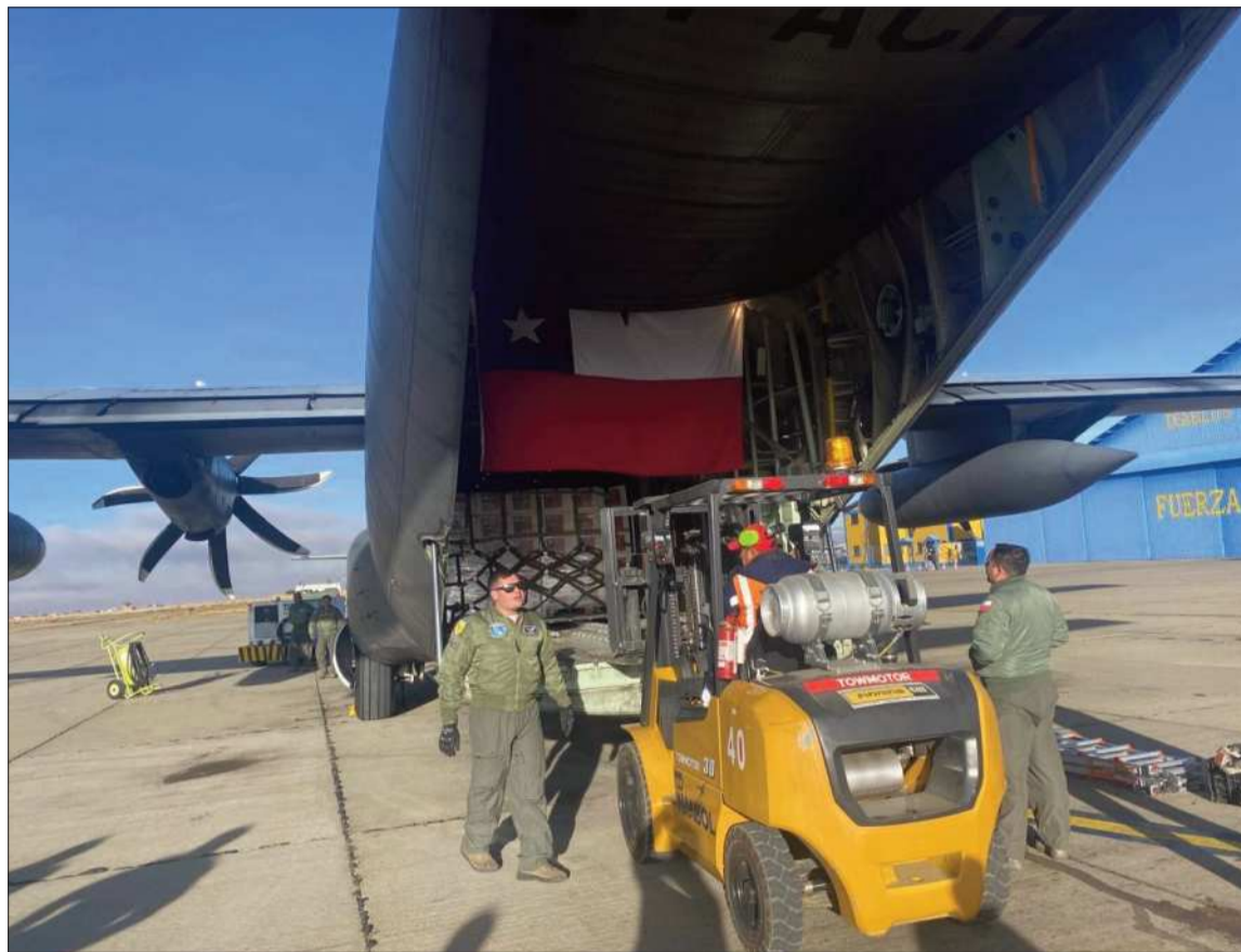
PROCESO. Personal de la Fuerza Aérea de Chile realizan el desembarque de los alimentos.