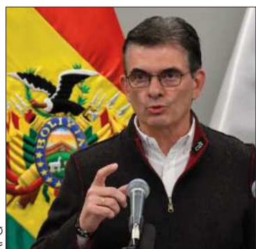
El presidente Rodrigo Paz.

Hoy se cumplen 22 días de la movilización que bloquea varias regiones