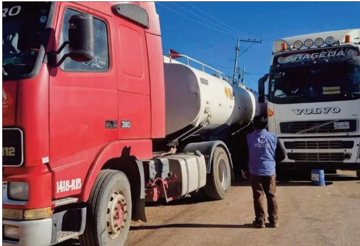
BLOQUEOS. Decenas de camiones con alimentos y oxígeno medicinal están varados en las carreteras.

Asimismo, explicó que tras una coordinación interinstitucional con autoridades de Gobierno y la intervención de la Cruz Roja en los puntos de bloqueo, en las últimas horas logró asegurar el abastecimiento de oxígeno necesario para los próximos días.