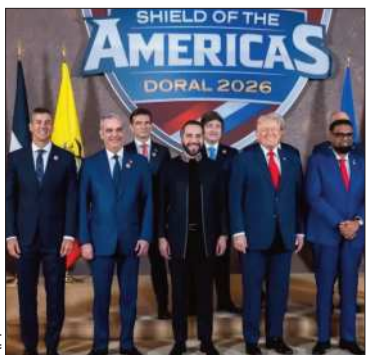
Países del Escudo de las Américas

El bloque ratificó su compromiso con defensa de la institucionalidad