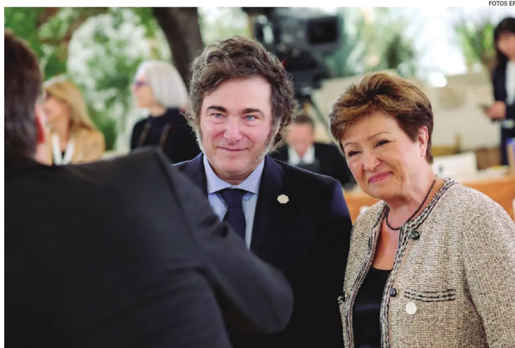
Foto de archivo del presidente argentino Javier Milei con la directora del FMI, Kristalina Georgieva.

El texto explica que, aunque no se alcanzó la meta de acumulación de reservas internacionales netas para finales del pasado diciembre, “se cumplieron la mayo-