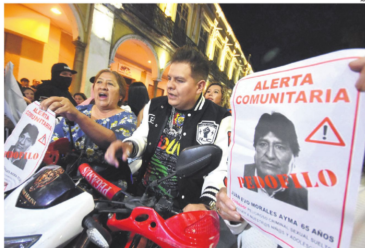
Miembros de la "Resistencia Juvenil Cochala" durante la marcha en la capital valluna.

Anoche, durante los discursos tras la Marcha por la Democracia en Santa Cruz, los cívicos demandaron el desbloqueo mediante la fuerza pública en este municipio de la provincia Nuflo de Chávez e incluso pusieron plazo: el martes se realizará un gran cabildo en la Chiquitania, donde se tomarán determinaciones sobre un posible desbloqueo ciudadano.