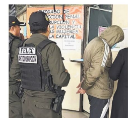
Fue enviado a la cárcel

Por otro lado, también hubo otra audiencia de una persona que fue encontrada vendiendo cargos en el Gobierno Municipal. Fue enviado por 180 días con detención preventiva.