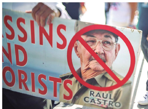
Cubanos celebran en Miami la imputación contra Raúl Castro.

“Cada movimiento de una unidad militar es una sincronización precisa entre transporte terrestre, marítimo y aéreo. Nuestra misión es que nuestros militares lleguen a tiempo a cumplir su misión, con