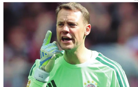
El portero alemán es una leyenda y fue convocado por su selección para la Copa.

La selección de Congo, que vuelve a un Mundial después de 52 años, tiene previsto disputar dos amistosos antes de debutar con Portugal y Dinamarca./EFE