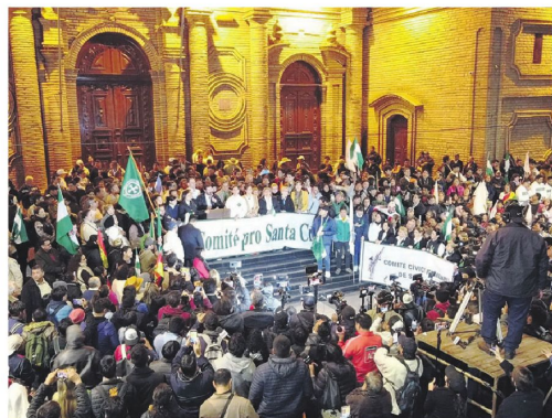
El mitin en la plaza principal estuvo marcado por discursos duros.

El mensaje conectó con una narrativa histórica del movimiento cívico cruceño: que la crisis actual no solo es consecuencia de la conflictividad social, sino también del agotamiento de un modelo de poder excesivamente concentrado en La Paz.