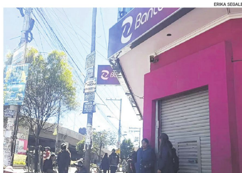
Las agencias bancarias operan a puertas cerradas en El Alto

Varias agencias bancarias, de La Paz y El Alto operan a puertas cerradas con ingresos restringidos bajo controles de seguridad. Aunque muchos servicios digitales continúan funcionando, cientos de personas que dependen de trámites presenciales enfrentan dificultades para retirar dinero, realizar depósitos, cobrar cheques o cumplir pagos.