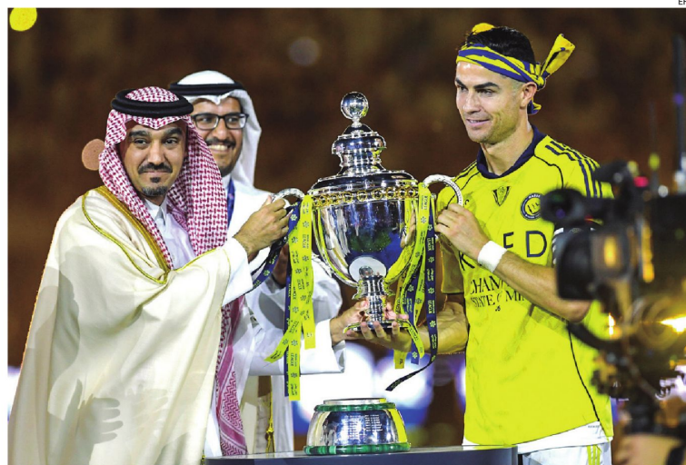
Cristiano Ronaldo consiguió su primer campeonato en Arabia Saudita y puso fin a una sequía de seis años sin ganar un título oficial.

VICTORIA DEL AL NASSR ANTE EL DAMAC (4-1)