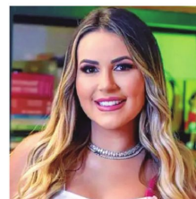
La popular influencer Deolane

También subrayó que el progreso en materia desregulatoria y adopción de reformas fiscales, comerciales y laborales “ha sido notable”.