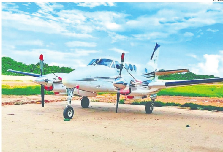
El avión privado de Sebastián Marset estaba acondicionado para transportar droga, según la Fiscalía

El documento detalla que la cocaína era trasladada desde Bolivia hacia Paraguay en aeronaves con matrícula boliviana que aterrizaraban en una pista clandestina