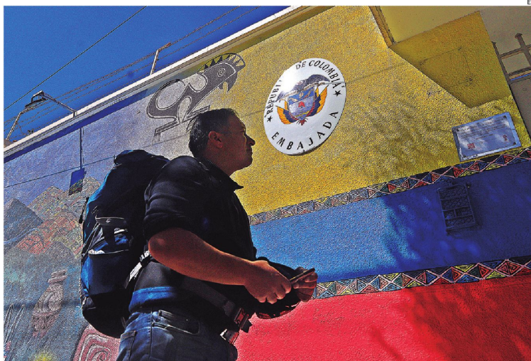
Un ciudadano recurre a los servicios consulares de la embajada de Colombia en La Paz a pesar de la crisis.

"No ha mediado por parte de ningún funcionario o miembro del Gobierno nacional el interés o el propósito de inmiscuirse en los asuntos internos de Bolivia", sostuvo la Cancillería colombiana, que además reafirmó su compromiso con los principios de soberanía, no intervención y autodeterminación de los pueblos.