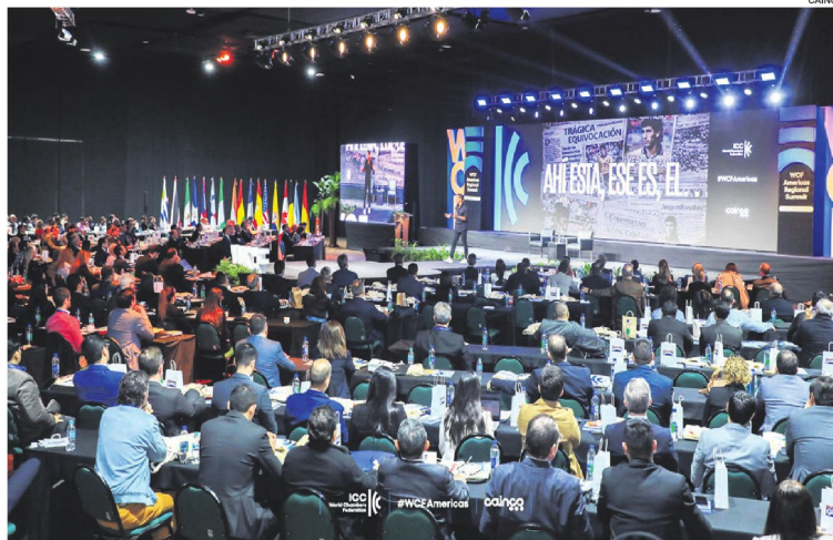
El foro contó con la participación de emprendedores y disertantes de primer nivel.

"Bolivia no puede quedarse afuera de la discusión global. He-