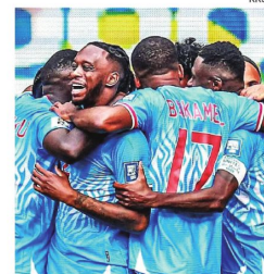
La selección de RD del Congo volverá a jugar un Mundial luego de 52 años.

Además de monitorizar la situación ante el brote y los contactos con la Federación de Congo, la FIFA también trabaja con los gobiernos de los tres países anfitriones del Mundial -el Departamento de Estado y de Seguridad Nacional de Estados Unidos, la Secretaría de Salud de Méxi-