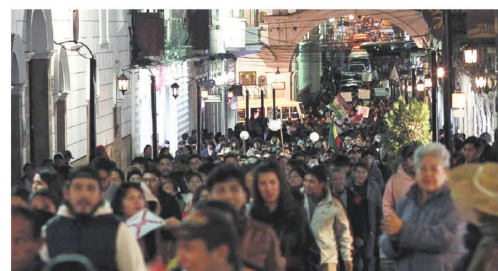
Cientos de personas en Sucre marcharon contra los bloqueos

A la convocatoria se sumaron comerciantes, representantes de la Cámara de la Pequeña Industria de