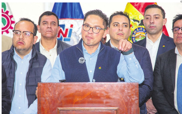
El sector industrial se pronunció ayer exigiendo la solución al conflicto y el desbloqueo de caminos.