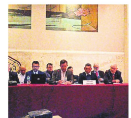
La CADEX lanza la alerta

Exportadores advierten que los problemas obligan a usar rutas alternativas por el Pacífico, opción que encarece la logística y reduce márgenes para las empresas bolivianas.