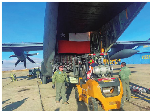
Un carguero sale de las entrañas del carguero C-130 en El Alto.