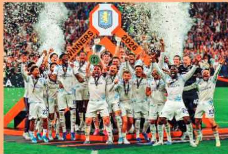
FESTEJO. Los jugadores del club inglés celebran su título en Turquía.

Friburgo por primera vez jugó la final de un torneo internacional de clubes.