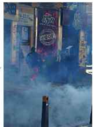
HECHO. Movilizaciones dejan destrozos en la urbe.

Esta propuesta surge en medio de un escenario de alta conflictividad social, ya que en las anteriores jornadas la ciudad de La Paz se convirtió en el epicentro de marchas masivas y cercos vinculados a demandas sectoriales y pugnas políticas. Así, la Alcaldía aboga por medidas de largo alcance contra la violencia urbana.