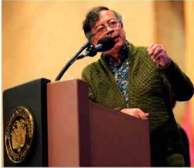
PERFIL. El presidente de Colombia, Gustavo Petro.

El Gobierno declaró ayer persona "non grata" a la embajadora de Colombia, Elizabeth García Carrillo, y ordenó su salida inmediata del territorio nacional. La medida responde de forma directa a las recientes publicaciones del presidente colombiano, Gustavo Petro, en su cuenta de la red social X acerca de la situación política y social que se vive en el país.