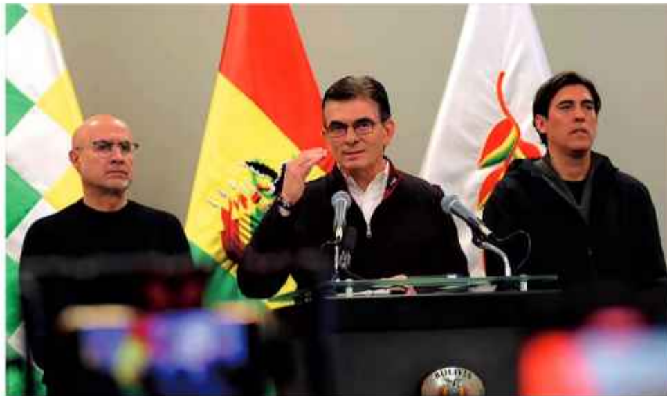
CONFERENCIA. Paz habló al país en medio de algunos de sus colaboradores cercanos.

El presidente Rodrigo Paz anunció un reordenamiento profundo de su gabinete de ministros y la formación inmediata del llamado Consejo Económico y Social para lo que convocó a los sectores y personalidades que busquen pacificar el país a encontrar soluciones a la crisis que azota la nación.