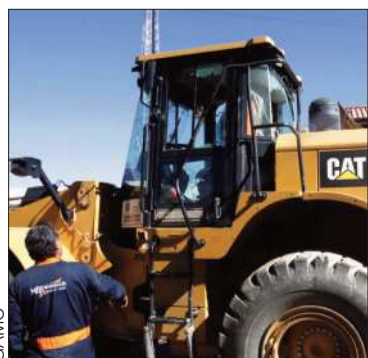
La maquinaria vandalizada.

Los pobladores de esa región piden el cierre del botadero municipal