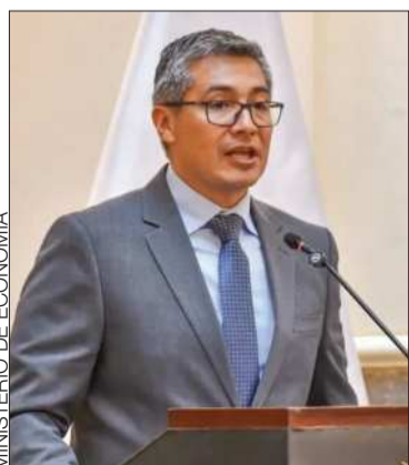
El ministro Gabriel Espinoza.

Economía exhortó a no dejarse llevar por rumores e información falsa