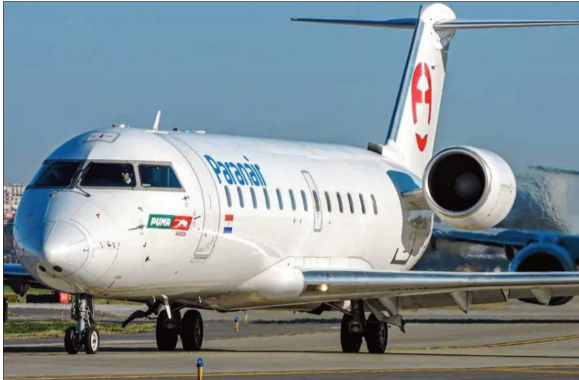
VUELOS. Una aeronave de la aerolínea paraguaya Paranair antes del despegue.

“Ya están los acuerdos dados, ahora tienen que entender que cielos abiertos se constituyen a través de inversión privada”, dijo.