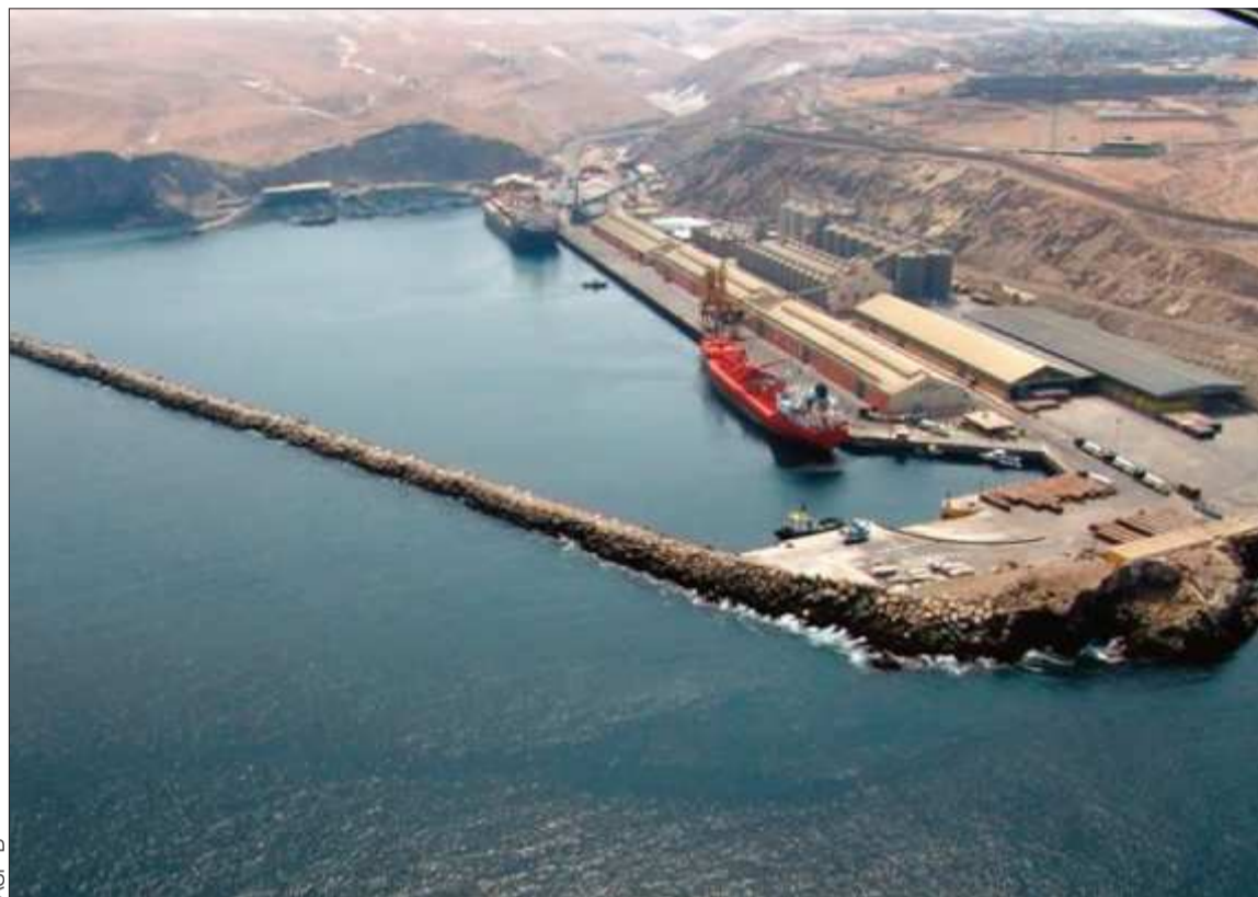
INFRAESTRUCTURA. El puerto de Matarani está ubicado en la zona sur del litoral peruano.