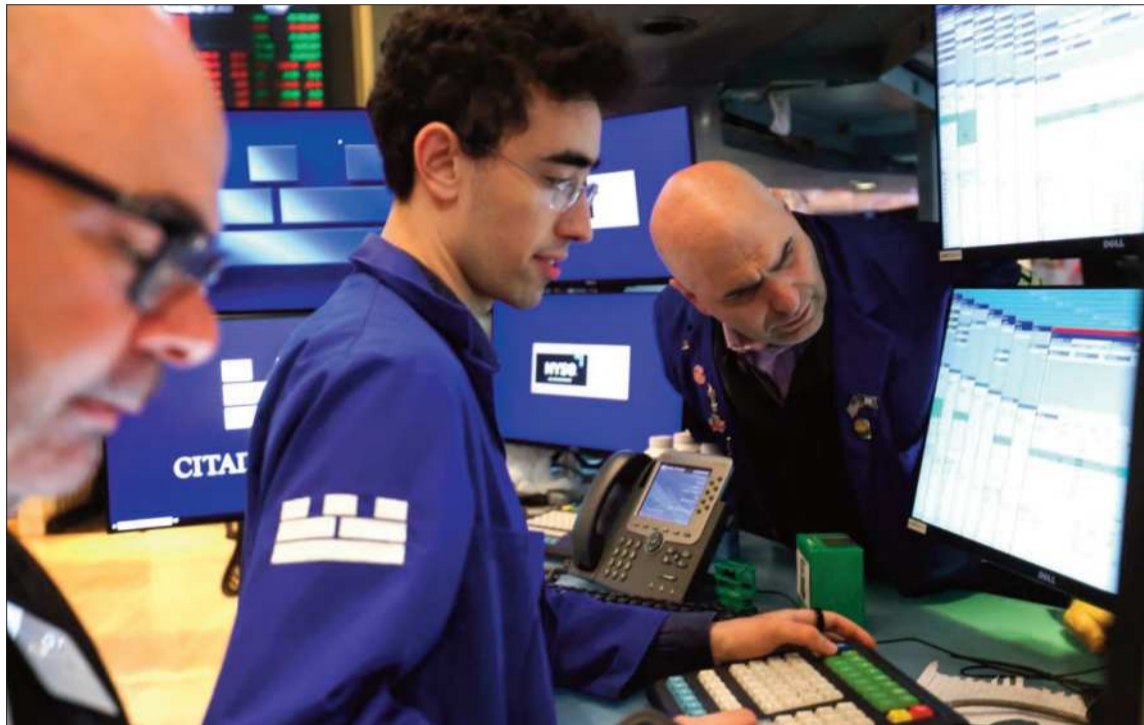
MERCADO. La esperanza de una solución en Oriente Medio influyó en los precios del crudo.

Tras una andanada de amenazas de ambas partes, el portavoz del Ministerio de Relaciones Exteriores de Irán, Esmail Bagai, dijo que están "examinando" una nueva propuesta estadounidense en el marco de la visita a Teherán del ministro del Interior de Pakistán, mediador en estas conversaciones. "Hemos recibido los puntos