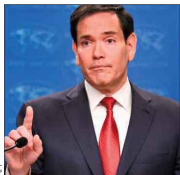
Marco Rubio, secretario de Estado.

El Secretario de Estado de EE.UU. abordó la crisis que enfrenta Bolivia