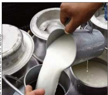
Producción de leche.

Los bloqueos en Yapacaní y San Julián impactan de manera directa al sector