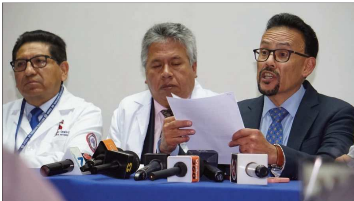
CONFERENCIA. Rueda de prensa de los representantes del Colegio Médico de La Paz.

Escasez. Los hospitales se quedan sin oxígeno, medicamentos ni alimentos