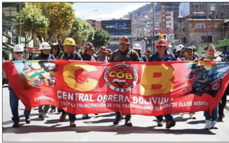
MOVILIZACIÓN. Una marcha de la COB en la ciudad de La Paz.

Desde la COB señalaron que las movilizaciones continuarán y ratificaron sus demandas contra