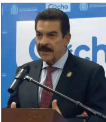
El alcalde Manfred Reyes Villa.

Reyes Villa acusó a sectores afines a Evo de financiar las protestas