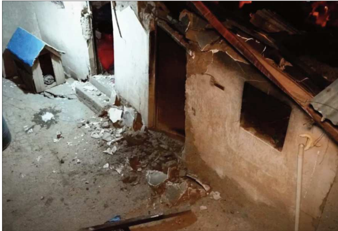
DAÑO. Una de las viviendas afectadas por el deslizamiento en la zona de Cotahuma.

Durante la inspección, el alcalde evidenció que el movimiento de tierra continuaba en la zona, por lo que se determinó la evacuación preventiva de tres familias: dos en la parte superior y una en la vivienda afectada en la parte inferior. “En este momento no recomendamos retornar a ninguna de las viviendas, porque todavía