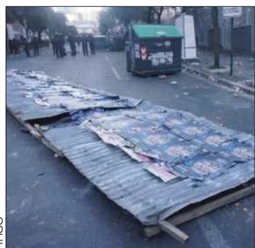
Daño el ornato público en La Paz.

El Alcalde de La Paz dijo que no está en contra del derecho a la protesta