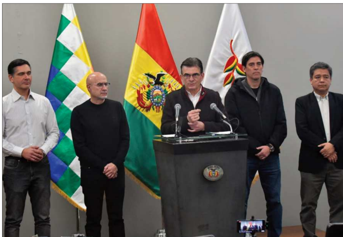
CONFERENCIA. Acompañado de sus ministros, el presidente Rodrigo Paz habló de la coyuntura.

El jefe de Estado anunció además la conformación de un Consejo Económico y Social, el cual, se-