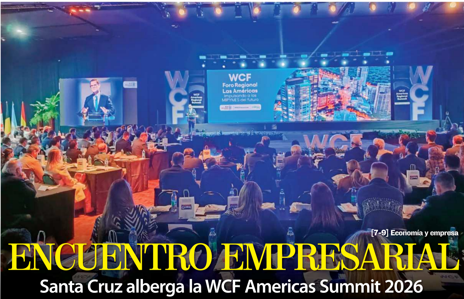
[7-9] Economía y empresa