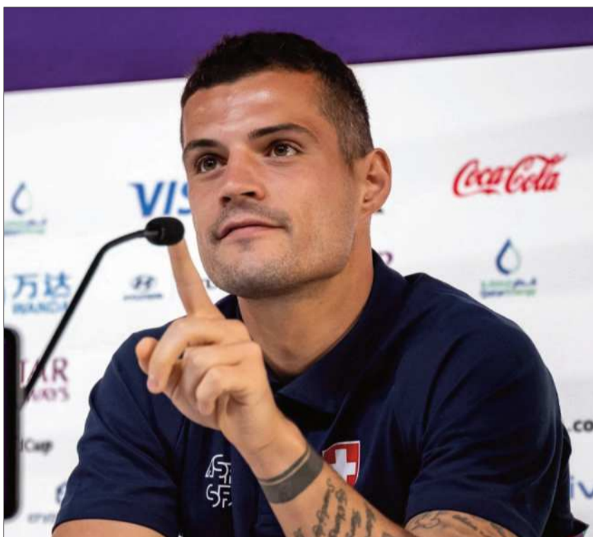
FIGURA. El emblemático líder de los suizos Granit Xhaka en una conferencia.

► Pese a que cuenta con un seleccionado modesto, los suizos son regulares