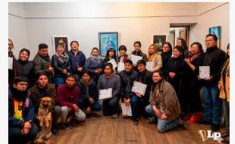
Expositores e invitados luego de la inauguración