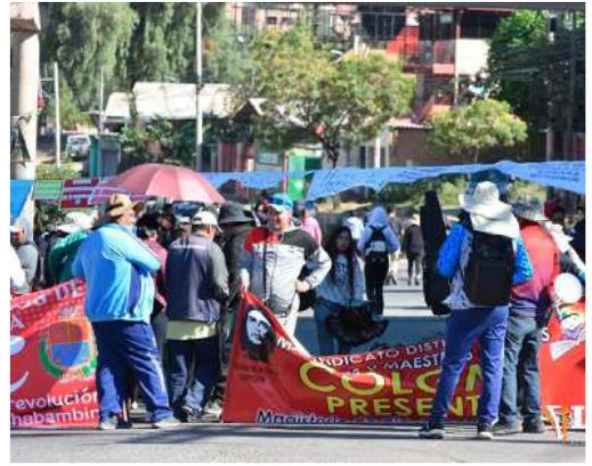
Bloqueos en el país generan pérdidas millonarias

"Lo que está aconteciendo en este momento es un desabastecimiento de materias primas e insumos en el sector productivo y esto está llevando paulatinamente a un cese de operaciones de muchas empresas", afirmó Peñaranda. Además, el ejecutivo señaló que varias industrias comenzaron a evaluar medidas de contingencia ante la incerti-