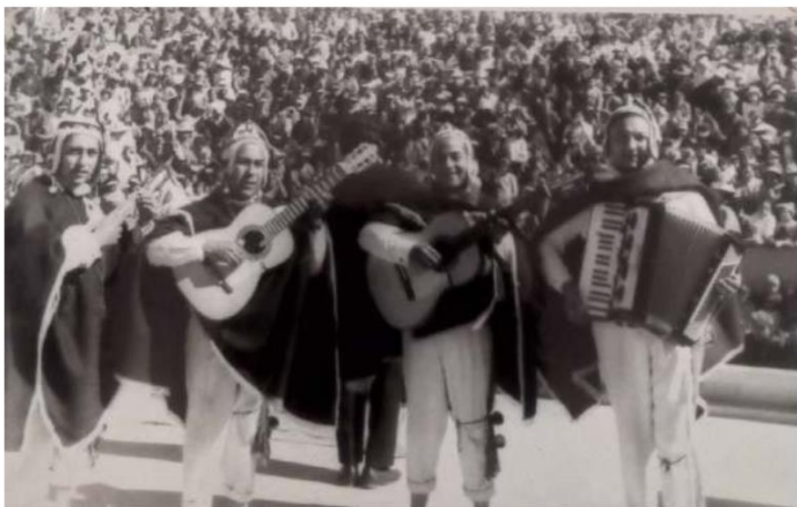
"Los Ases Andinos", formado en Oruro el año 1958.