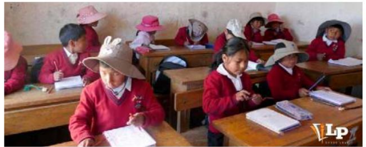
El lunes 18 de mayo, unidades educativas ingresan en horario de invierno

Cardozo remarcó que durante este periodo, los directores, maestras y maestros no deben exigir el uso obligatorio del uniforme escolar completo. Deben priorizar que los estudiantes asistan con ropa abrigada. “Si estamos implementando este horario de invierno con la única finalidad de precautelar la salud, al obligar el uso del uniforme escolar estaríamos atentando con-