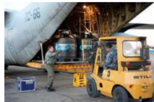
La llegada de 12 toneladas de pollo en un avión enviado por el Gobierno de Argentina