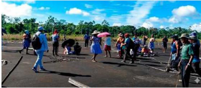
Pobladores y productores del Trópico de Cochabamba permanecen en la pista del aeropuerto de Chimoré

El exsecretario general de la Federación de Comunidades Interculturales Chimoré, Teófilo Sánchez, confirmó la toma y lanzó una advertencia al gobierno del Presidente Rodrigo Paz. "Vamos a defender a Evo Morales. Que el Gobierno no