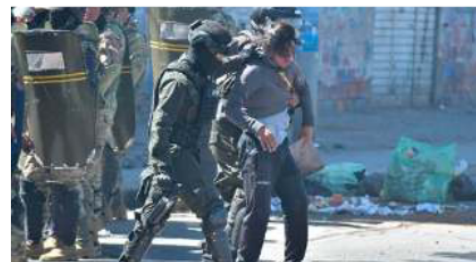
Efectivos policiales proceden a la aprehensión de un manifestante

en el sector de Río Seco, perteneciente a la urbe alteña; posteriormente, alrededor de las 08:00 horas, las fuerzas estatales intervinieron los bloqueos vehiculares y humanos en las comunidades de Huajchilla y Lipari, situadas en la zona Sur y el sector de Río Abajo de la ciudad de La Paz.