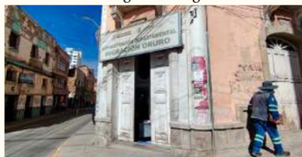
Oficina de la Dirección Departamental de Migración Oruro

Finalmente, el miércoles, las tres francesas dejaron Oruro rumbo a Cochabamba. Atrás quedaban días de angustia y un país que conocieron desde su cara más frágil: aquella donde, cuando algo sale mal, muchas veces son ciudadanos solidarios y no el sistema quienes sostienen la emergencia humana.