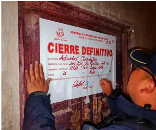
El club nocturno fue clausurado