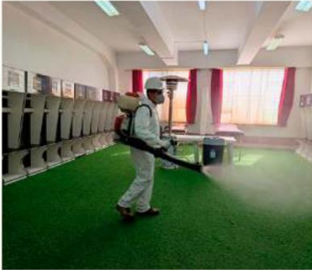
Fumigaron los predios del estadio Jesús Bermúdez/SEDES