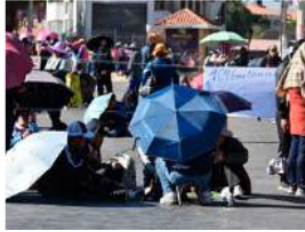
Maestros bloquean una vía en la ciudad de La Paz

La Central Obrera Boliviana (COB) y la Federación de Campesinos de La Paz “Tupac Katari” piden