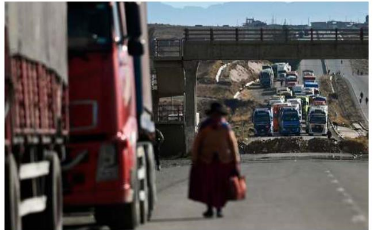
Una mujer camina cerca de un punto de bloqueo en La Paz, Bolivia

Las protestas han afectado al país desde la semana pasada, impulsadas por demandas como aumentos salariales, abastecimiento de combustibles y reformas legales. La Central Obrera Boliviana (COB) y sindicalistas de campesinos piden la renuncia de Paz, quien lleva seis meses en el poder.