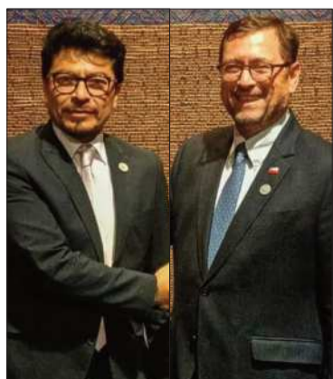
Los cancilleres de Chile y Bolivia.