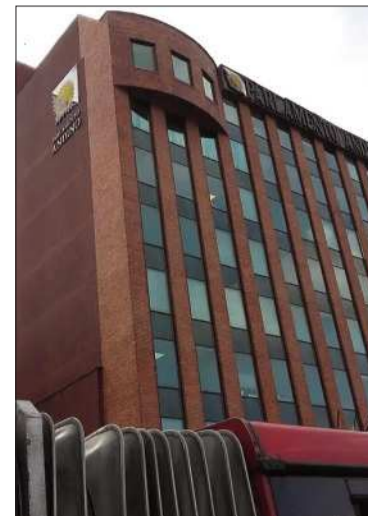
El edificio del Parlamento Andino.

La agenda también consiste en la firma de convenios de cooperación con la Organización Panamericana de la Salud (OPS) y la Fundación Konrad Adenauer Stiftung (KAS), con el objetivo de impulsar proyectos sobre gobernanza.