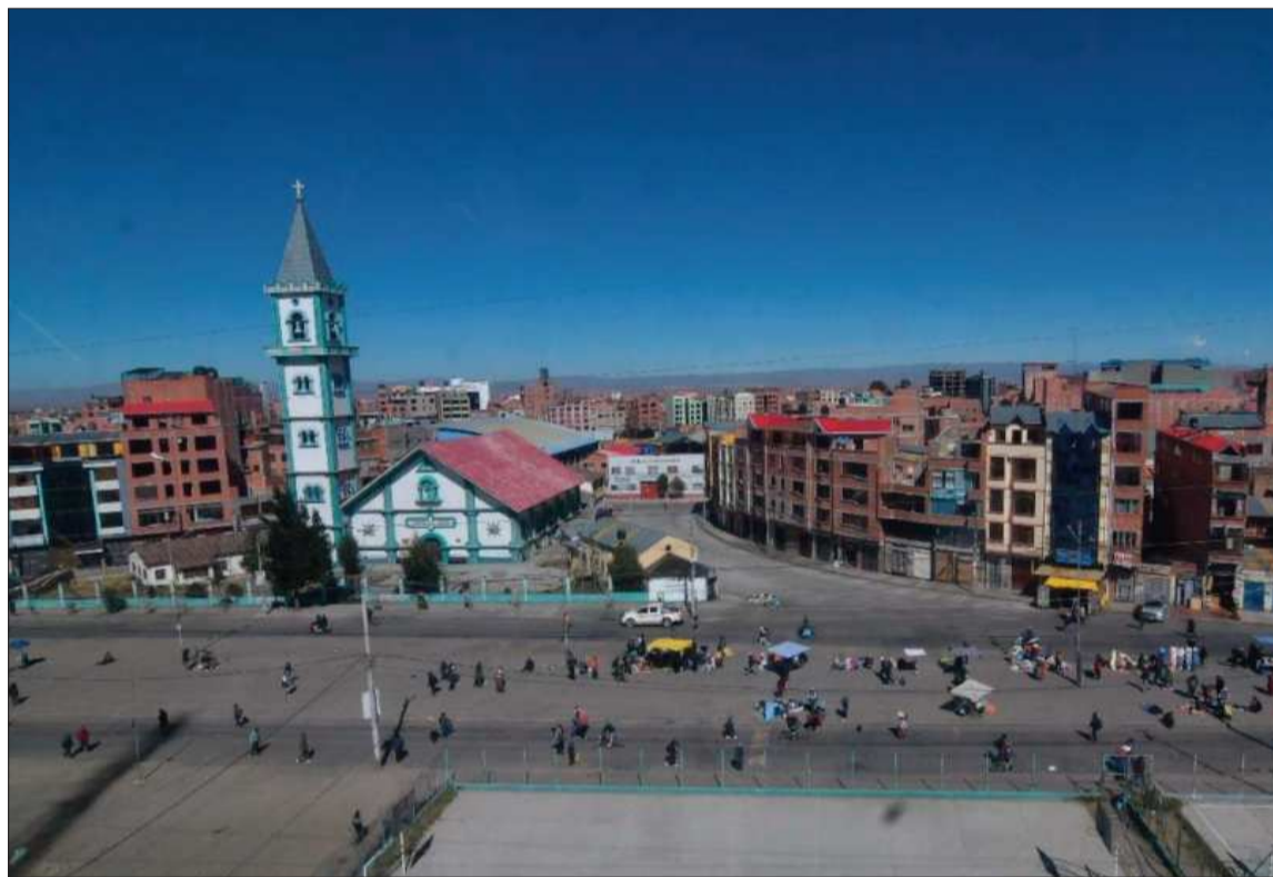
PARO. La avenida Panorámica de El Alto se vio repleta de personas que tuvieron que movilizarse a pie.

Caminata. Cientos de personas se movilizaron a pie para llegar a su destino