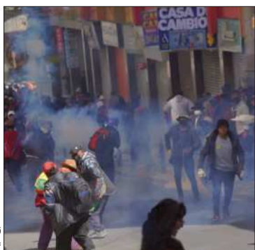
Movilizadas en la ciudad de La Paz.

La propuesta apunta al diálogo entre el Gobierno y los sectores movilizadas