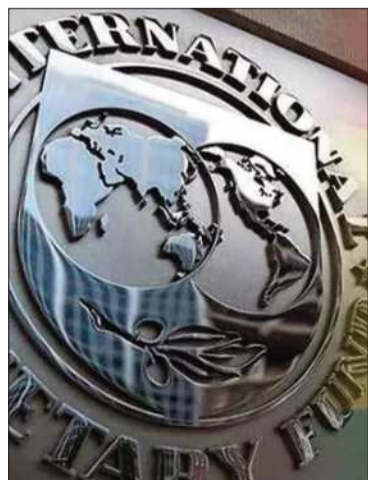
El logo del Fondo Monetario.

La delegación canceló su llegada a La Paz debido a los conflictos registrados