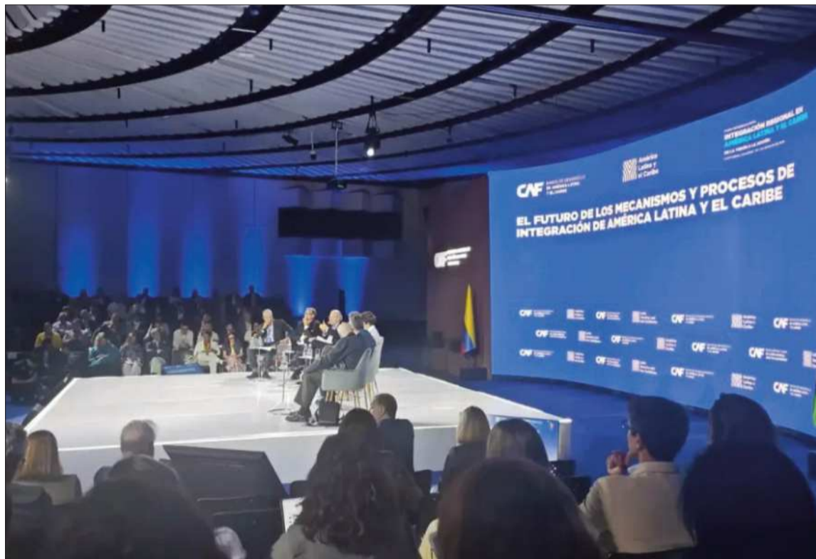
ENCUENTRO. El foro sobre integración regional que se desarrolla en Cartagena, Colombia.

El anuncio se apoya en tres décadas de trabajo. El primer proyecto de CAF fue el puente sobre