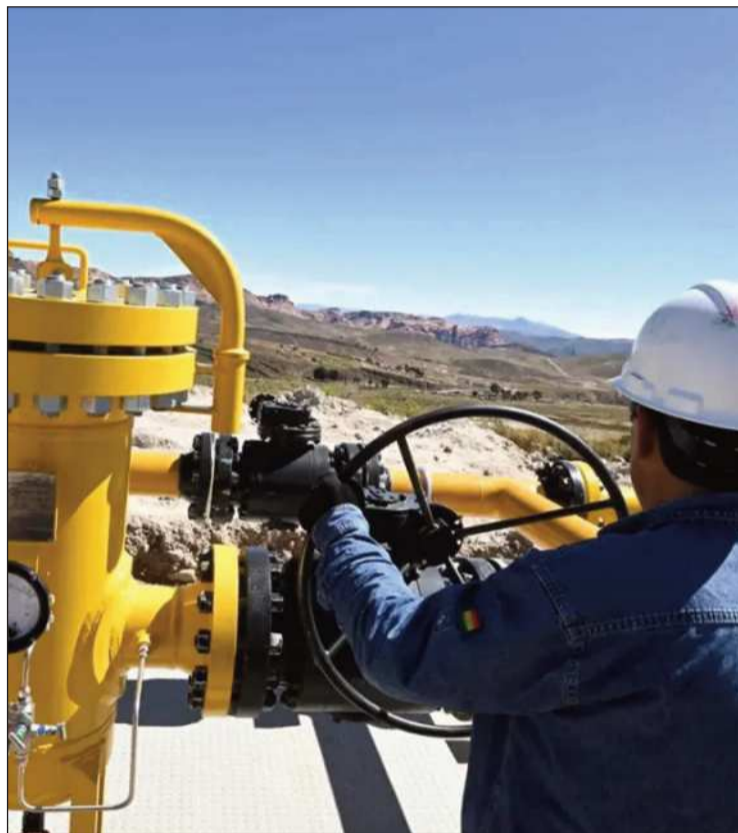
INFORME. Un funcionario de operaciones de la estatal YPFB.

Según el IBCE, en enero de 2026 el precio del gas natural aumentó un 78% respecto a diciembre de 2025, comporta-