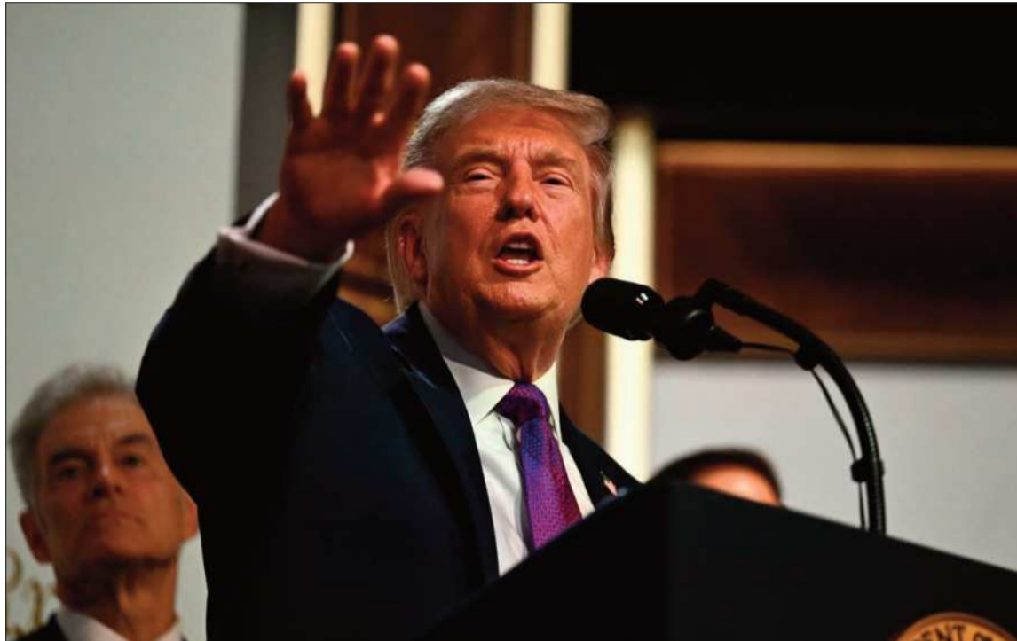
DIÁLOGO. El presidente Donald Trump dijo que no espera reiniciar las hostilidades con Irán.

El comercio mundial de hidrocarburos “depende en gran medida de un pequeño conjunto de pasos obligados, cuellos de botella marítimas” que “en condiciones normales reducen generalmente los tiempos y los costos de tránsito”, destacó Natasha Kaneva, de JPMorgan. Por Ormuz pasa habitualmente un 20% del consumo