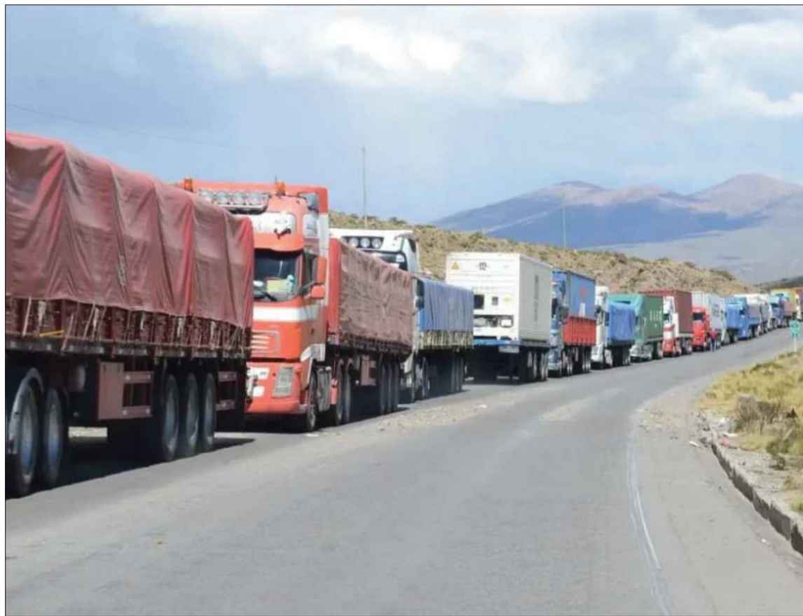
DEMANDA. Varios camiones están varados en varios puntos del país debido a los bloqueos

El sector industrial alertó que la prolongación de los conflictos afecta el abastecimiento de mate-