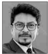
Fernando Aramayo es Ministro de Relaciones Exteriores de Bolivia

Este 18 de mayo, Bolivia y Perú conmemoran doscientos años del establecimiento de relaciones diplomáticas. Sin embargo, esta fecha trasciende ampliamente el ámbito protocolar y la evocación histórica. No celebramos únicamente el inicio formal del vínculo entre dos repúblicas soberanas; celebramos la continuidad de una comunidad histórica, cultural y geográfica que antecede a la creación misma de nuestros Estados.