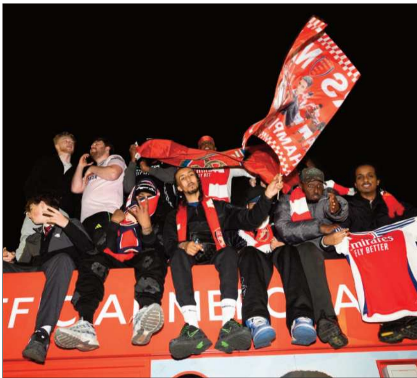
LOS MEJORES. Los jugadores de Arsenal celebran la conquista de la Premier.

Los jugadores dirigidos por Mikel Arteta, que cuentan con cuatro puntos más que los Citizens de Pep Guardiola a falta de una fecha para la final del campeonato inglés, toman el relevo del Liverpool, ganador de la anterior edición de la Premier.