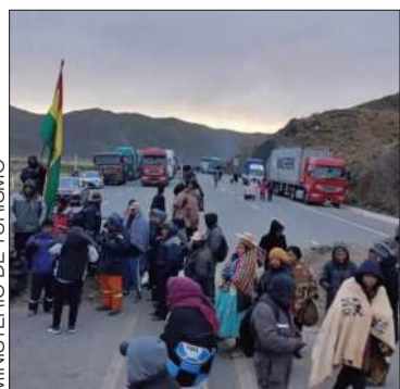
Un punto de bloqueo.

Los conflictos se concentran en La Paz, Cochabamba y Oruro