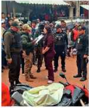
CRIMEN. La Policía en el lugar.