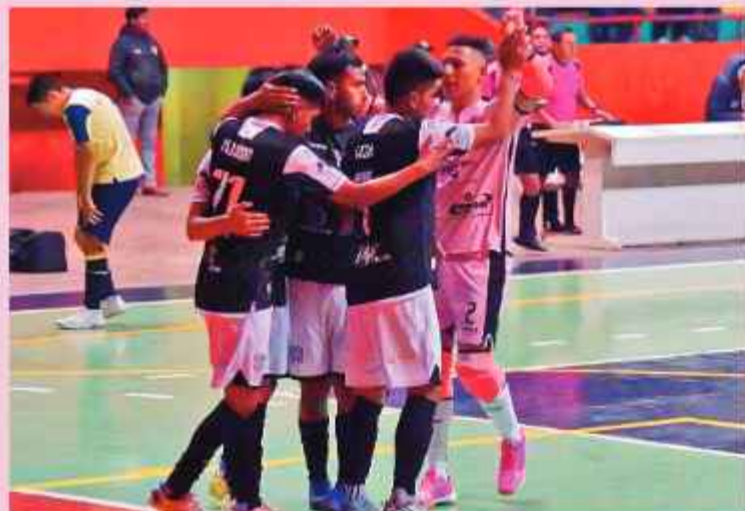
PARTIDO. Jugadores del club orureño en un partido local.

Chelsea en 2017 y otra vez Liverpool en 2020 se repartieron los otros títulos que no ganó el City bajo la conducción del técnico multicampeón con Barcelona y Bayern Múnich.