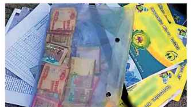
OPERATIVOS. Parte del dinero y otros objetos secuestrados.

en las manifestaciones", en tanto que luego del allanamiento de un alojamiento ubicado en el casco viejo del centro paceño, se logró la captura de otras tres personas en posesión de un poco más de 243 mil bolivianos en efectivo presuntamente con el mismo fin.