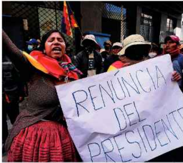
UE. La crisis en Bolivia preocupa a los actores internacionales.

La Delegación de la Unión Europea (UE) y las embajadas de cinco de sus países integrantes, a través de sus legaciones diplomáticas acreditadas en Bolivia, activaron un llamado internacional para refrenar la violencia y restablecer el orden constitucional.