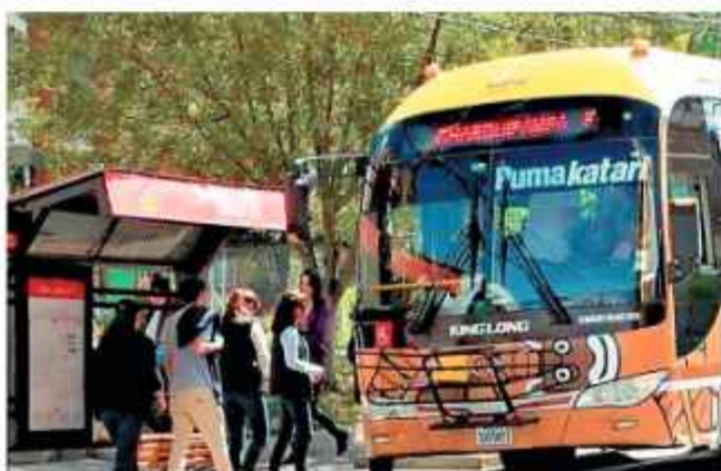
TRANSPORTE. El servicio está suspendido por el momento.