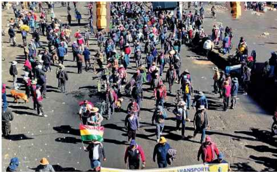
DATO. Sectores campesinos, mineros, del magisterio y evistas se reunieron en El Alto.

Se busca al dirigente por la presunta comisión de al