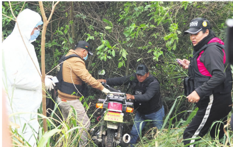
Policías cuando cerca al mediodía de ayer encontraron abandonada la motocicleta del joven de 22 años

Primero hubo un forcejeo y los delincuentes le dispararon en la pierna. Herido, el joven caminó y empezó a pedir ayuda a vecinos de la zona y gritó, "me dispararon". Uno de los individuos esta