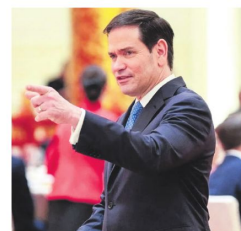
El secretario de Estado expresa su respaldo al gobierno de Paz.

El pronunciamiento se produce mientras sectores movilizados exigen la renuncia de Paz, quien asumió la presidencia el 8 de noviembre de 2025. El gobierno representa además un giro político en Bolivia, al convertirse en la primera administración ajena al MAS tras casi dos décadas de hegemonía, partido que lideraron Evo Morales y Luis Arce.