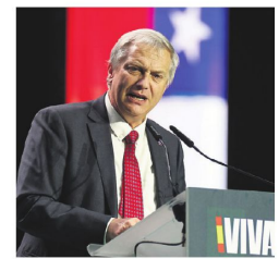
El presidente José Antonio Kast

Considerado el proyecto económico estrella de Kast, la iniciativa contó con los votos oficialistas y los sufragios del Partido de la Gente (PPG), una formación heterogénea de carácter populista que tiene un rol bisagra en el Parlamento, donde el Ejecutivo no cuenta con mayoría. (EFE)