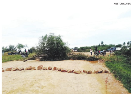
Bloqueo en la ruta entre Okinawa 1 y Los Troncos

Por otro lado, la Federación Regional de Comunidades Espontáneas Agropecuarias Interculturales Berlín - San Julián, confirmó su adhesión a las medidas de presión instaladas en San Julián y procedió a activar un nuevo punto de