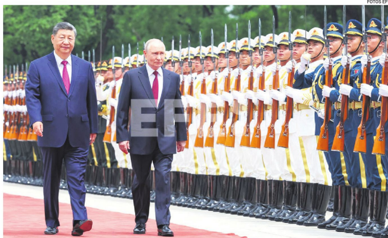
Los presidentes Vladimir Putin y Xi Jinping, a su llegada ayer al Gran Salón del Pueblo en Pekín.

Xi aseguró que los vínculos entre ambos países se encuentran en “el nivel más alto de su historia” y anunció, junto a Putin, una extensión del Tratado de Buena Vecindad, Amistad y Cooperación firmado hace 25 años, considerado uno de los pilares jurídicos de la