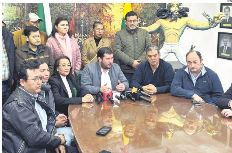
La institucionalidad cívica tiene todo listo para la gran marcha por la democracia en Santa Cruz

La concentración en Santa Cruz está prevista para las 17:30 en la plaza del Estudiante. Desde allí, la movilización recorrerá calles del centro de la capital cruceña hasta llegar a la plaza 24 de Septiembre, donde se instalará una tarima en inmediaciones de la Catedral, para la realización de discursos