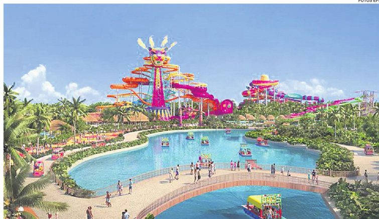
Maqueta del megaproyecto cruceñista que debía ser emplazado en el estado de Quintana Roo.