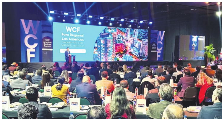
Delegaciones de 35 países se encuentran en Santa Cruz de la Sierra, en el WCF Americas Summit 2026.

efectos de la confrontación permanente sobre la producción y las inversiones. "No podemos construir futuro sobre piedras y bloqueos", señaló.