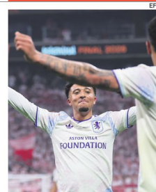
Jadon Sancho festeja la celebración del título de la Europa League.

Ahora, con la llegada del formato de 48 participantes, las 22 ediciones previas quedan blindadas en la memoria colectiva como el testamento de una época dorada, en la que brillaron figuras como el brasileño Pelé, los argentinos Diego Armando Maradona y Messi, el alemán Franz Beckenbauer o el neerlandés Johan Cruyff.