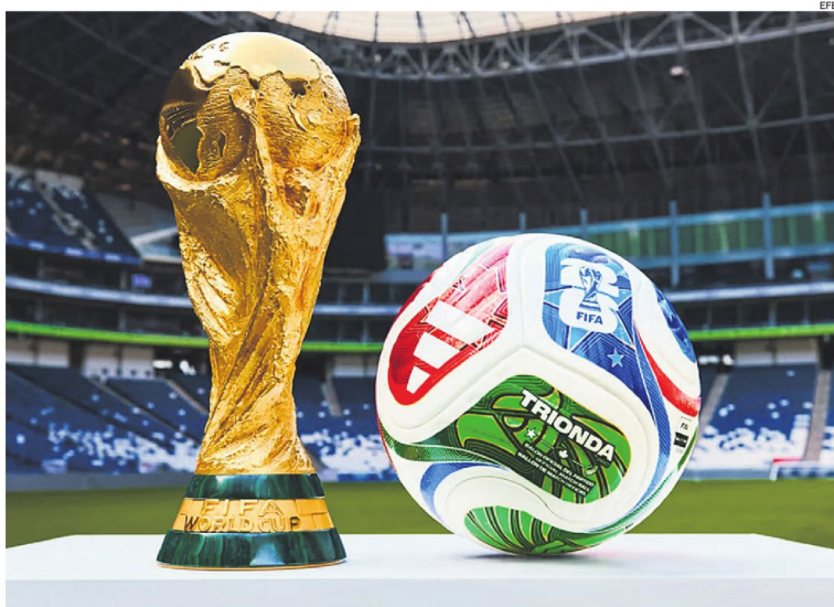
El actual trofeo fue cambiado el año 1974. Se entregará a la selección campeona del Mundial de Estados Unidos, México y Canadá.

En las 22 ediciones disputadas, el trofeo más codiciado solo ha sido levantado por ocho países