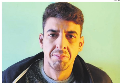
El brasileño asesinado en Santa Ana era un integrante del PCC

El reporte policial señala que se encontraba prófugo desde el 10 de junio de 2025, cuando huyó del penal de máxima seguridad de Chonchocoro.