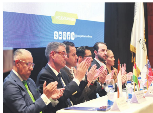
El Parlamento Andino avanza en el proceso de integración

la necesidad de fortalecer la conectividad regional y avanzar en proyectos conjuntos de infraestructura, comercio y educación. Durante el encuentro también se anunció la adhesión de universidades bolivianas a la Red Andina de Universidades, mecanismo orientado a facilitar homologación de títulos y movilidad académica.