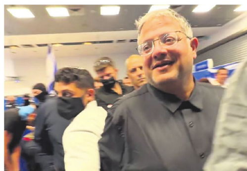
Captura del video publicado por el ministro Ben Gvir (de frente).

Las imágenes también muestran a los cientos de detenidos en esa posición hacinados bajo el sol mientras un altavoz emite el himno de Israel.