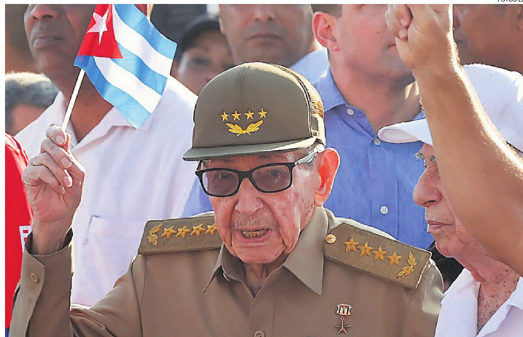
Foto del exdictador cubano, durante la celebración del primero de mayo este año en La Habana.

El hermano de Fidel Castro, de 94 años, continúa siendo una figura de máxima influencia y autoridad dentro del régimen.