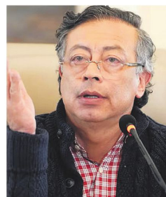
El presidente de Colombia habló sobre la crisis que enfrenta el país