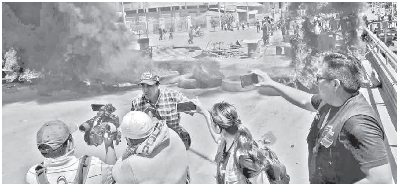
Reporteros durante una cobertura de situación de conflictos en Bolivia. LOPEZ

En lo que va del año, según Unitas, persiste un ambiente hostil para el periodismo en Bolivia. El monitoreo en tiempo real revela que los desafíos estructurales no cesan y se manifiestan a través de dinámicas específicas de agresión.