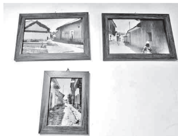
Cuadros con fotos antiguas del pasaje San Rafael.