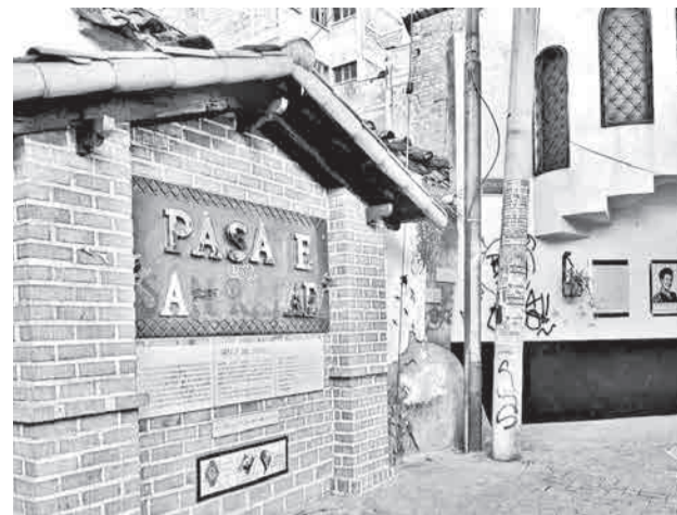
El letrero del pasaje en mal estado.