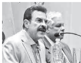
El alcalde Manfred Reyes Villa. ROCHA

El alcalde de Cochabamba, Manfred Reyes Villa, presentó la Rendición Pública de Cuentas Inicial 2026 destacando una inversión superior a Bs 1.632 millones destinada a la ejecución de obras.