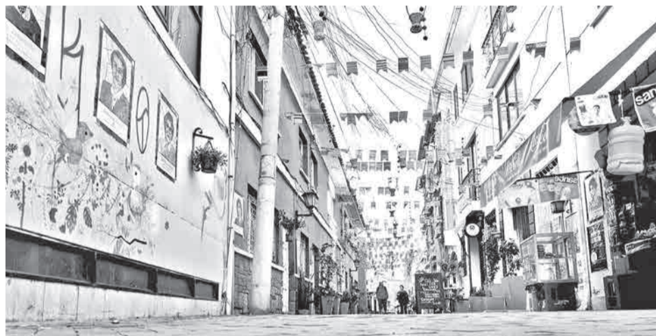
El pasaje San Rafael o "Supay Calle" (Calle del Diablo), con mosaicos.