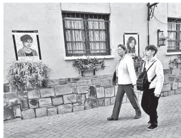
Galería urbana del pasaje San Rafael.