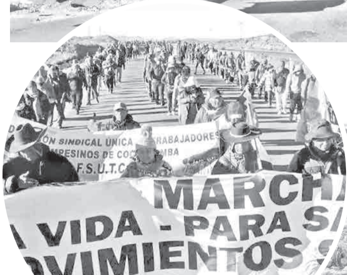
Marcha evista llega a La Paz. RKC