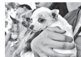
Mascotas dadas en adopción.