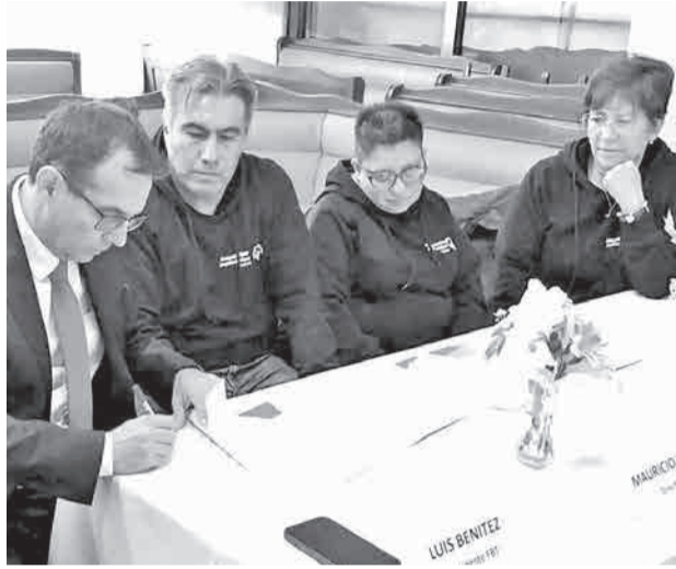
La firma del convenio para las Olimpiadas Especiales .