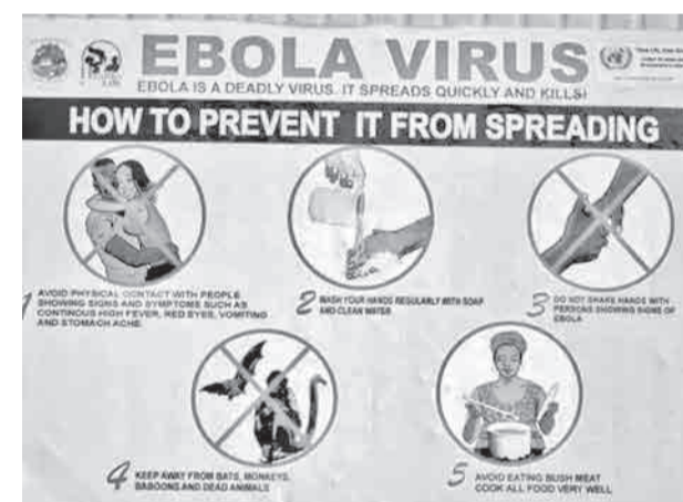
Un cartel informativo sobre el ébola.

En la declaración, la entidad sanitaria afirma que se “requiere coordinación y cooperación a nivel internacional para comprender el alcance del brote, coordinar las medidas de vigilancia.