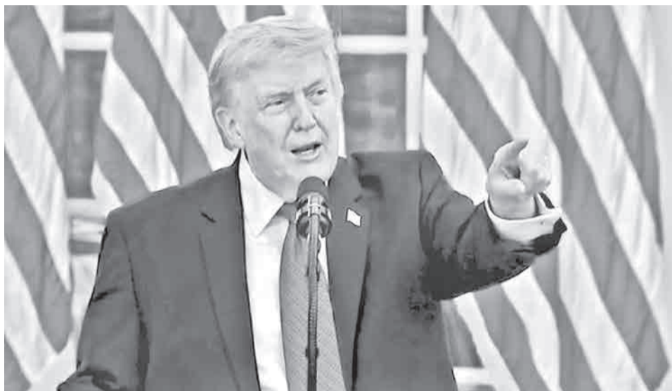
El presidente de EEUU, Donald Trump.

Aseguró que Teherán se retracta de los acuerdos alcanzados “al día siguiente”, una situación que, según dijo, se ha repetido en cinco ocasiones. “Cada vez que se dialoga ellos (Irán) aceptan todo y luego se retiran (...) nos iban a dar su polvo nuclear y todo lo que queríamos, pero cada vez que cierran un trato, al día siguiente actúan como si no hubiéramos tenido esa conversación”, dijo Trump.