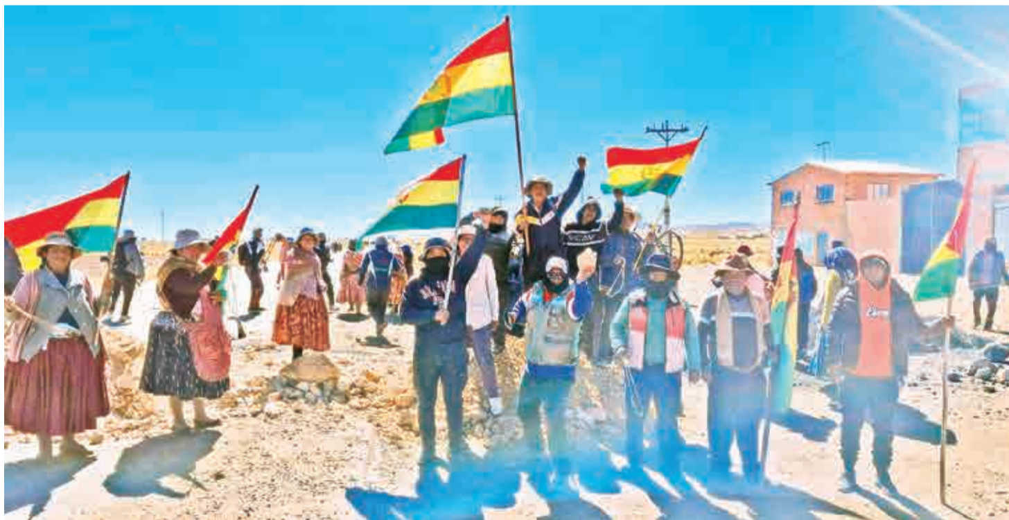
Bloqueadores en una barricada con la tricolor nacional en una carretera del departamento de La Paz, el más afectado por el conflicto.

Dramático. Cientos de choferes pasan penurias en las carreteras bloqueadas y las familias están desesperadas por la escasez de alimentos. EEUU respaldó a Paz. Pág. 3