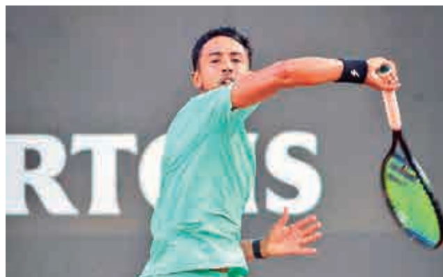
El tenista Hugo Dellien presente en Roland Garros.

La organización del segundo Grand Slam del año dio a conocer las llaves de clasificación tras el sorteo que se llevó adelante.