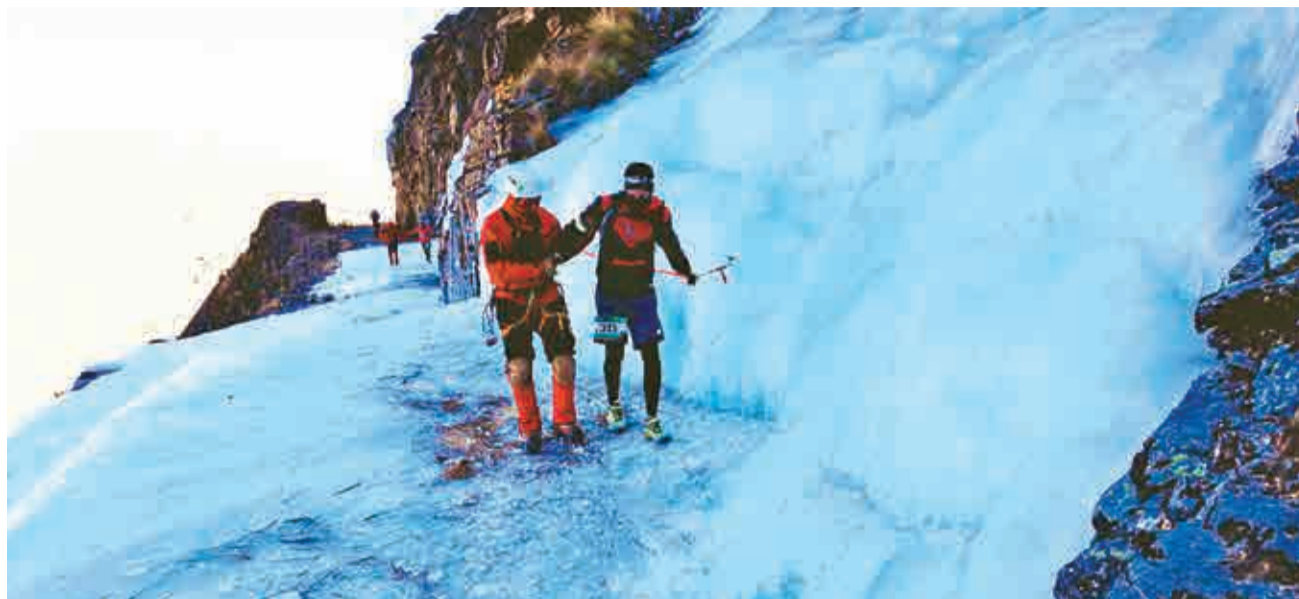
Competidores de Sky Race, una de las competencias más extremas que se realizan en Bolivia.