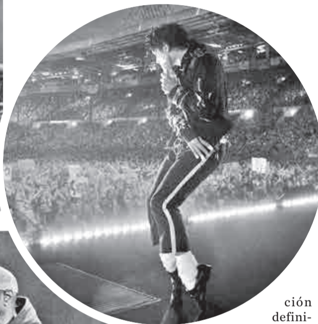
Figura. El joven artista protagoniza la biopic del Rey del Pop, una película que evoca su carrera y revela una historia familiar atravesada por música, fama y raíces latinas