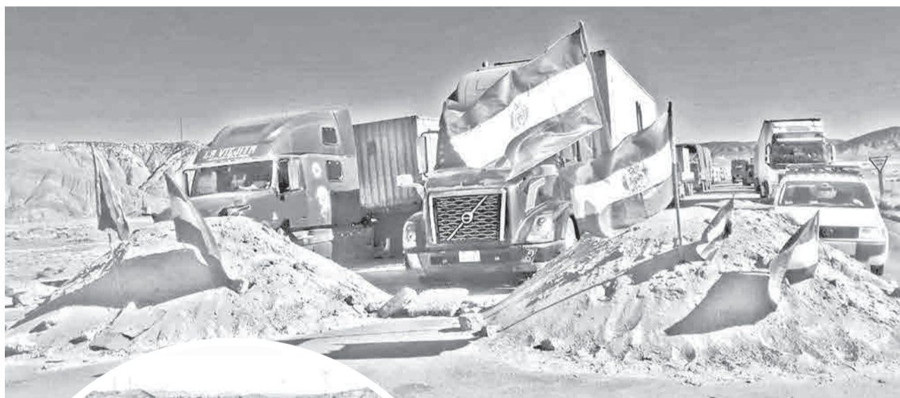
Camiones bloqueados en el puente Desaguadero. RKC

Dramático. Cientos de transportistas se han quedado sin alimentos y agua a causa de los bloqueos entre La Paz y Oruro claman por ayuda. Sin embargo, los bloqueadores rechaza declarar un cuarto intermedio