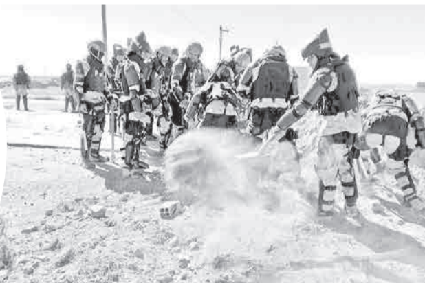
La Armada en el desbloqueo de caminos. ARMADA BOLIVIANA

El ingreso a La Paz se dará también al inicio de una tercera semana de bloqueos que se registran en el occidente del país por parte de la Central Obrera Boliviana (COB) y la Federación de Campesinos Tupac Katari, principalmente en el departamento paceño.