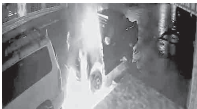
El atentado contra el vehículo del fiscal.

locado en su vehículo estacionado en la puerta de su domicilio e informó que conformó una comisión para iniciar una investigación "rigurosa, objetiva y transparente" destinada a identificar y aprehender a los autores.