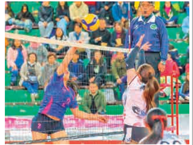
Un partido de la Liga Superior. FBV

La clasificación general se encuentra de la siguiente manera después de las fechas que se disputaron: Tres clubes cochabambinos se encuentran en la cima: Olympic (10 puntos en cinco partidos), San Simón (nueve en cinco) y San Martín (seis en tres), el paceño Olympic (seis en cinco), el paceño San Antonio Galas (seis en cinco), el valluno Albert Einstein (cuatro en tres), el tarijeño Universitario (dos en dos) y el orureño América (dos en dos), según el informe de la Federación de Voleibol a la prensa.