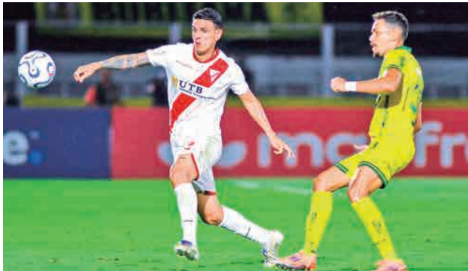
Always Ready, uno de los clubes afectados por el traslado. ALWAYS READY

“A pesar de las circunstancias, nuestro plantel y cuerpo técnico asumirán este compromiso con la máxima responsabilidad, llevando con orgullo el nombre de nuestra querida ciudad de El Alto