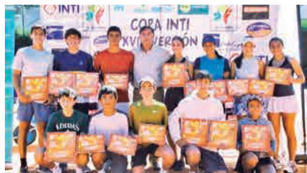
Los premiados en Chuquiago Junior Open.

El Mundial 2026 comenzará el 11 de junio en México, en la capital de ese país; y la concluirá el 19 de julio con la final en East Rutherford, Estados Unidos.