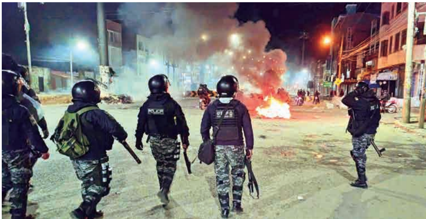
Policías gasifican a bloqueadores en la ciudad de El Alto durante el operativo ejecutado el sábado con apoyo de las FFAA.

Desbloqueo. El operativo “Corredor Humanitario” logró el paso de un convoy de cisternas con combustible, camiones varados, alimentos y medicinas. Págs. 3 y 4