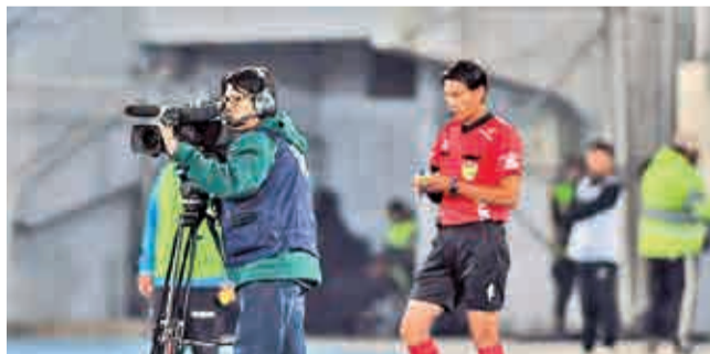
Los equipos para la transmisión de partidos. JAMES

Calendario. Ante los partidos que se paralizaron los conflictos sociales se hicieron varios ajustes en las fechas del torneo