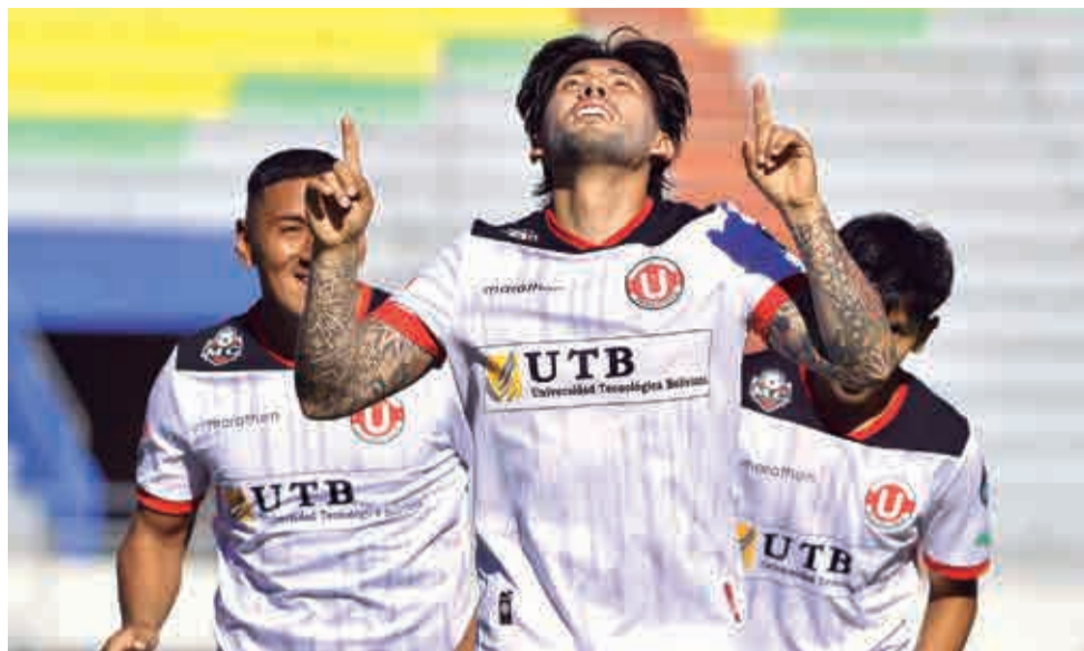
Jugadores de FC Universitario festejan. JAMES