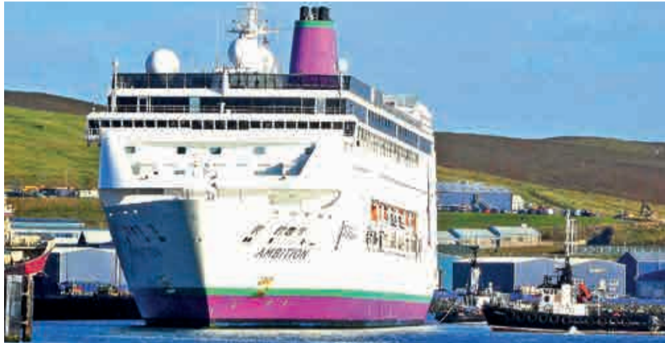
El crucero 'Ambition', atracado en Vigo hace unas semanas.

En paralelo, los armadores han reforzado sus protocolos sanitarios a bordo, con cambios operacionales como la prohibición del autoservicio en buffets, incremento de estaciones de higiene y notifica-