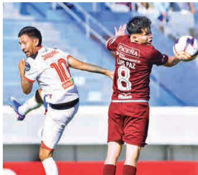
FC Universitario se impuso a la Academia. JAMES

No se rindió. El conjunto cochabambino luchó durante todo el partido y no bajó los brazos cuando el cotejo parecía encaminado al empate, sobre el final marcó el gol del triunfo