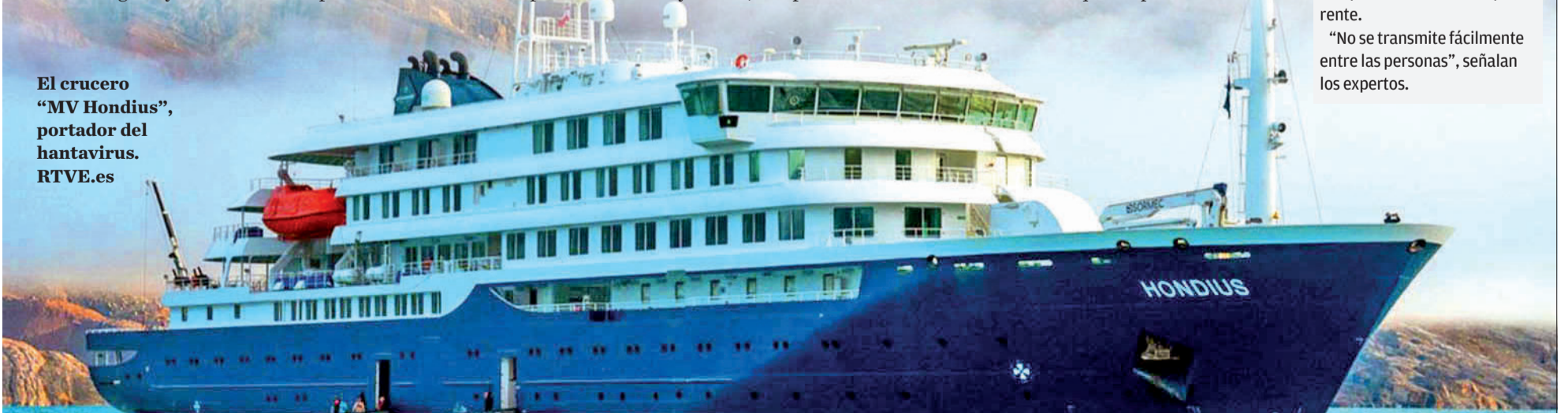
El crucero "MV Hondius", portador del hantavirus.

"No se transmite fácilmente entre las personas", señalan los expertos.