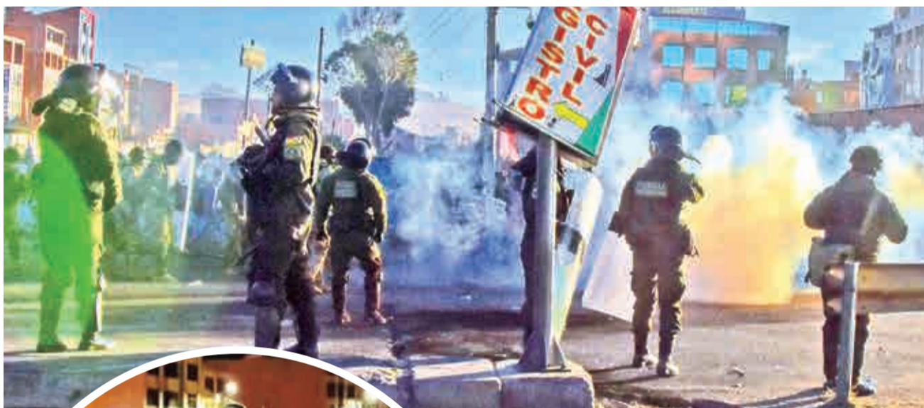
El desbloqueo en El Alto en la madrugada. MARKA REGISTRADA

Desbloqueo. Más de 3.500 efectivos de las fuerzas combinadas intervinieron los puntos de bloqueo en El Alto, Copacabana, Caracollo, Huajchilla y otras zonas para permitir un corredor humanitario