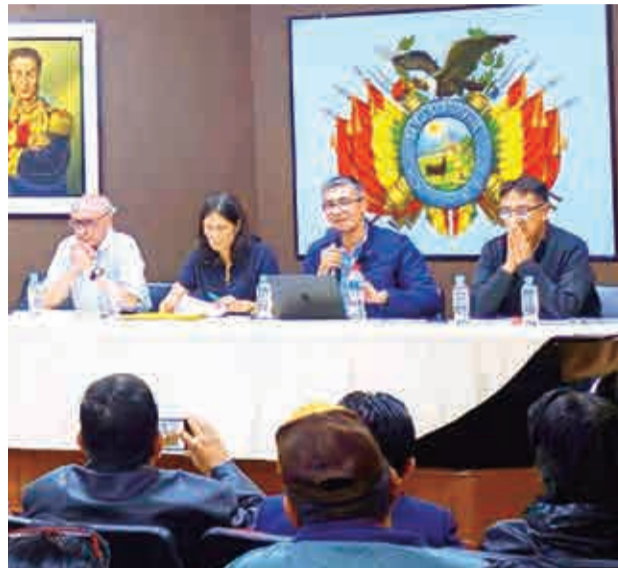
Reunión de los ministro con el Magisterio.

Sin embargo, el punto más importante del acuerdo firmado es el nuevo bono de Bs 2.400 de reconocimiento por el trabajo