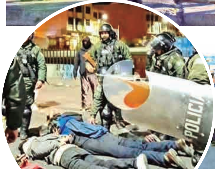
Los manifestantes detenidos en el operativo, ayer.