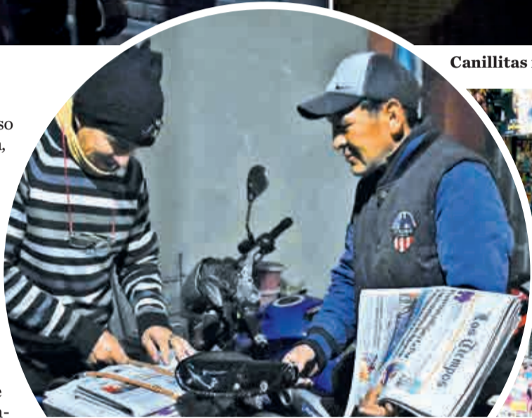
Canillitas se alistaron para distribuir desde la madrugada.

Décadas atrás, los canillitas llegaron a ser 1.600 en Cochabamba. Algunos vendían hasta 500 ejemplares por día y los domingos circulaban cerca de