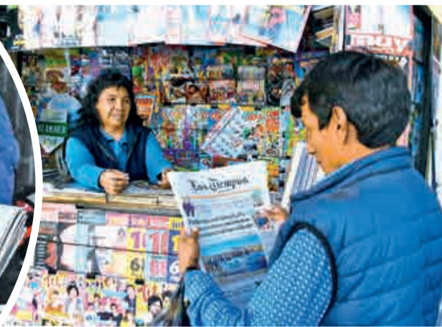
Los puestos de periódico que perduran.