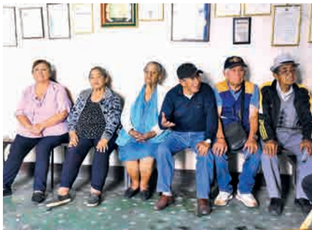
Primeros canillitas en una reunión.

Dato. De más de 1.600 canillitas que alguna vez llenaron de vida las calles cochabambinas, hoy quedan 104 que mantienen este oficio con esfuerzo y siguen acercando la información a la población de Cochabamba