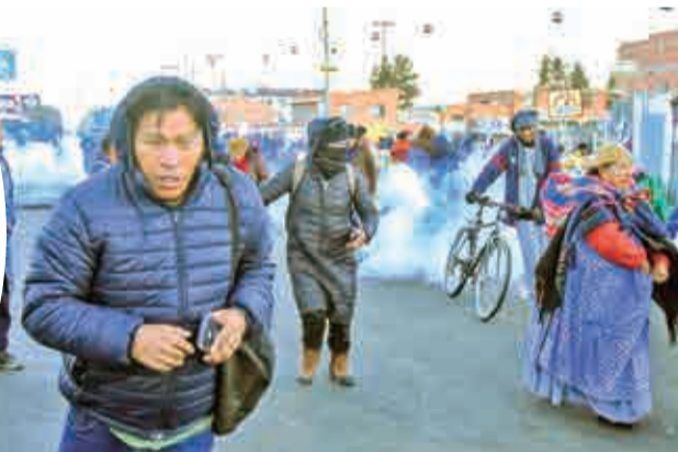
Policía gasifica a bloqueadores en El Alto. MARKA REGISTRADA

mitió que numerosos vehículos varados retomaran su recorrido y anunció que las tareas continuarán para habilitar también el tramo desde Oruro hacia La Paz.