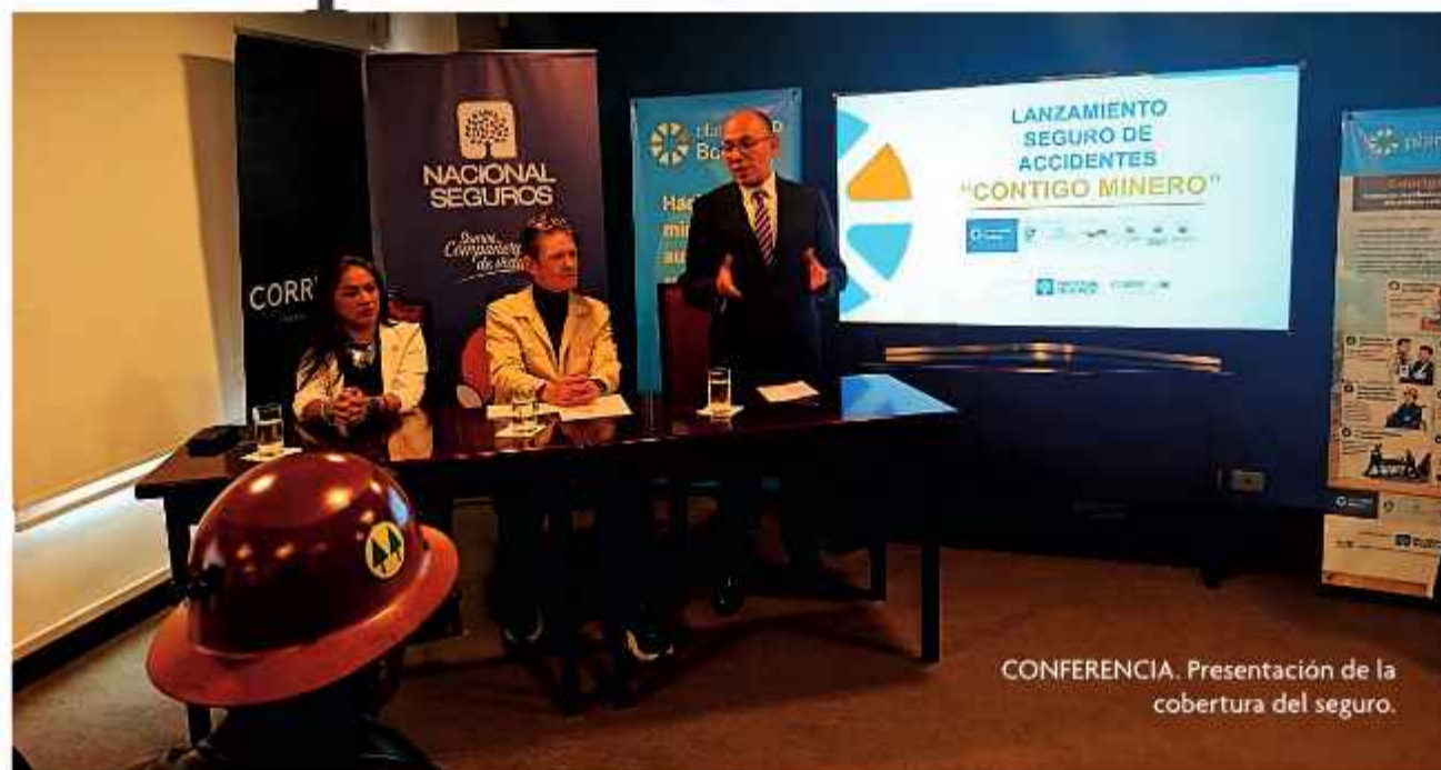
CONFERENCIA. Presentación de la cobertura del seguro.

¿CÓMO USAR EL SEGURO? Para acceder al seguro "Contigo minero" y la atención médica, no solo debe presentar su documentación, también debe solicitar facturas, recibos, recetas, órdenes médicas y estudios solicitados, entre otros. También hay otros requisitos para casos de incapacidad permanente y muerte accidental. Un accidente es algo que ocurre de repente, sin esperarlo, y que puede causar una lesión una incapacidad o el fallecimiento de una persona.