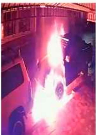
DESTROZO. El vehículo del Fiscal incendiado.

Sin embargo, algunos representantes campesinos convocaron a radicalizar las medidas de protesta, como los denominados Ponchos Rojos y la Federación de Mujeres, quienes instruyeron a las 39 centrales movilizarse hoy en la plaza Ballivián, de El Alto.