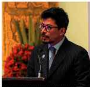
Canciller FERNANDO ARAMAYO

"La convocatoria al diálogo se ha dado ya muchos días atrás. Llamamos a todos los grupos que continúan movilizados".