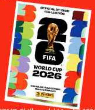
ÍCONO: El álbum del Mundial 2026.

Coleccionar el álbum de los Mundiales es también un afán de los hinchas del fútbol y en Bolivia también hay gran interés.