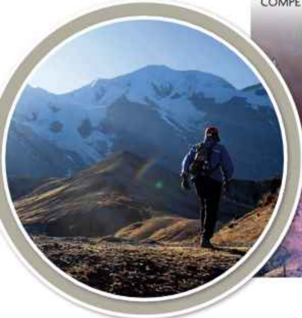
COMPETENCIA. Partida de la prueba.