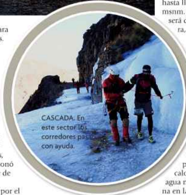
CASCADA. En este sector los corredores pasan con ayuda.

“Es un gran desafío, para quienes correrán por primera vez, además del esfuerzo, sin duda quedarán admirados por el solemne Illimani, donde en ese sector hay un lugar inolvidable,