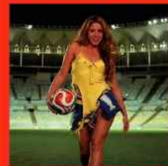
ESTRELLA. La colombiana Shakira.

Después se ubican Un'estate italiana, de Gianna Nannini y Edoardo Bennato (Italia 1990), con 5,66 puntos; Gloryland, de Daryl Hall y Sounds of Blackness (Estados Unidos 1994), con 5,48; Boom, de Anastacia (Japón-Corea del Sur 2002), con 5,10; y The Time of Our Lives, de Il Divo y Toni Braxton (Alemania 2006), con 4,47 puntos. (Agencias)