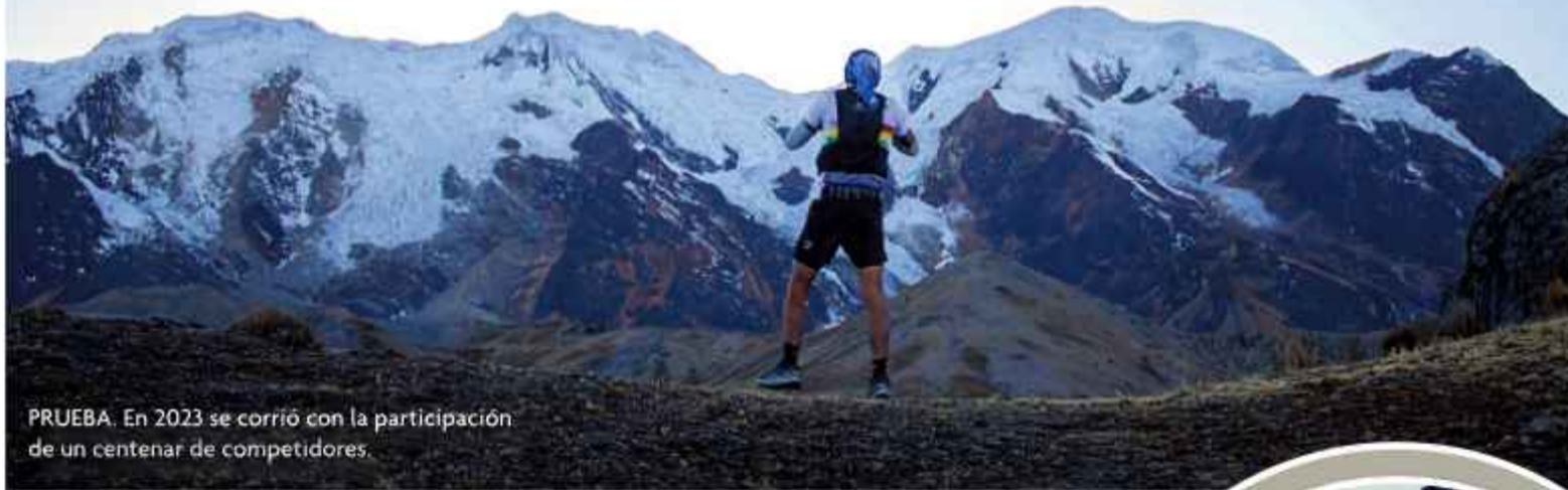
PRUEBA. En 2023 se corrió con la participación de un centenar de competidores.

Los competidores correrán 30 kilómetros, con mil metros de desnivel positivo, ascenderán a una altura máxima de 4.566 metros sobre el nivel del mar.