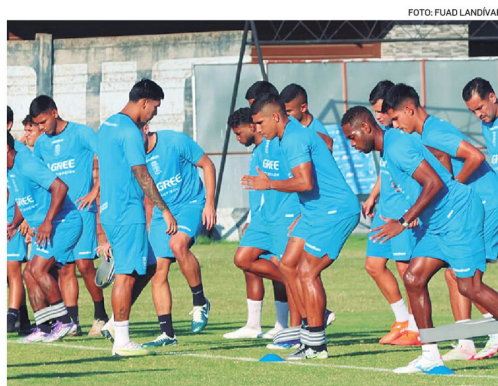
Los dirigidos por 'Platini' pretenden sacar un buen resultado ante el plantel de Carabobo.

En el partido de ida, disputado en Venezuela a fines de abril, Carabobo se impuso con un marcador de 2-0. Este encuentro es por cumplir para la escuadra celeste, que está última en el grupo con un punto, mientras que los venezolanos permanecen en el segundo puesto con