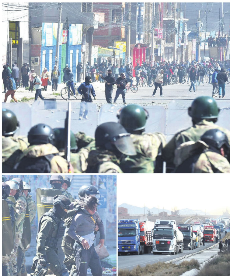
Momentos críticos durante el desbloqueo para permitir el paso de alimentos y combustibles.

Durante los disturbios, se reportaron daños a vehículos poli-