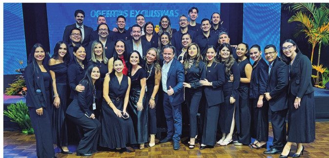
La empresa tiene 16 oficinas en 7 ciudades y cuenta con acreditación IATA