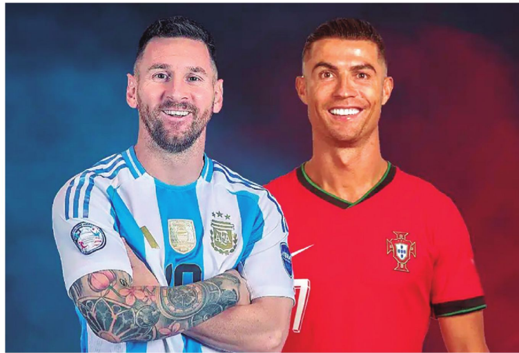
El argentino y el portugués podrían estar en el mismo Mundial por última vez, lo que marcará un capítulo difícil de olvidar en la historia.