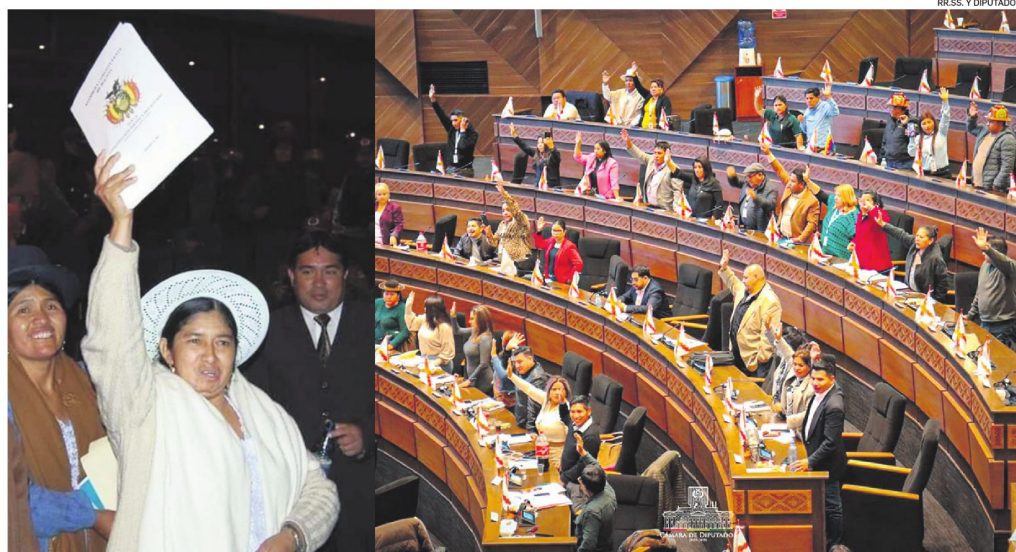
Silvia Lazarte, presidenta de la Asamblea Constituyente, levanta la Constitución boliviana promulgada en 2009

Mientras el Gobierno no solucione la crisis económica y social, no habrá un escenario adecuado para las reformas estructurales porque la población no irá a un referéndum con hambre, en medio de bloqueos y escasez, dice un exmagistrado del TCP