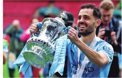
El Manchester City se llevó la Copa de Inglaterra luego de derrotar al Chelsea.

Para Argentina y Portugal, ya no se trata solo de sus goleadores históricos, sino de líderes que guían a nuevas generaciones que crecieron admirándolos y que ahora buscan acompañarlos en su despedida.