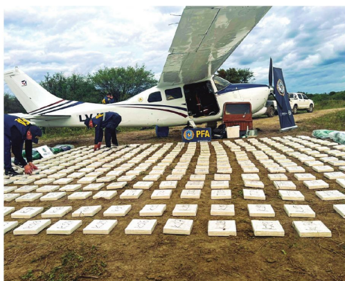
La estrategia antidrogas busca reactivar la cooperación internacional.

Rusia, aunque con menor peso económico, mantuvo una influencia política y diplomática significativa, especialmente en sectores estratégicos, según el estudio.