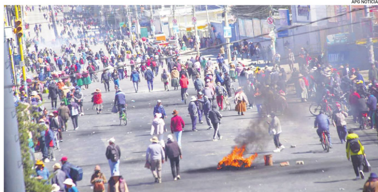
Los movilizadados cortan las vías y afectan el movimiento cotidiano en la ciudad de El Alto.

Sectores del transporte interprovincial, organizaciones sociales y grupos movilizadados mantuvieron cerradas rutas clave hacia