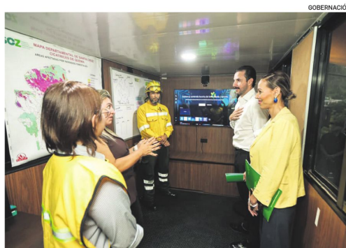
El gobernador, durante la presentación de los equipos.

"Tenemos que dejar de ser proactivos y empezar a ser proactivos", afirmó la autoridad.