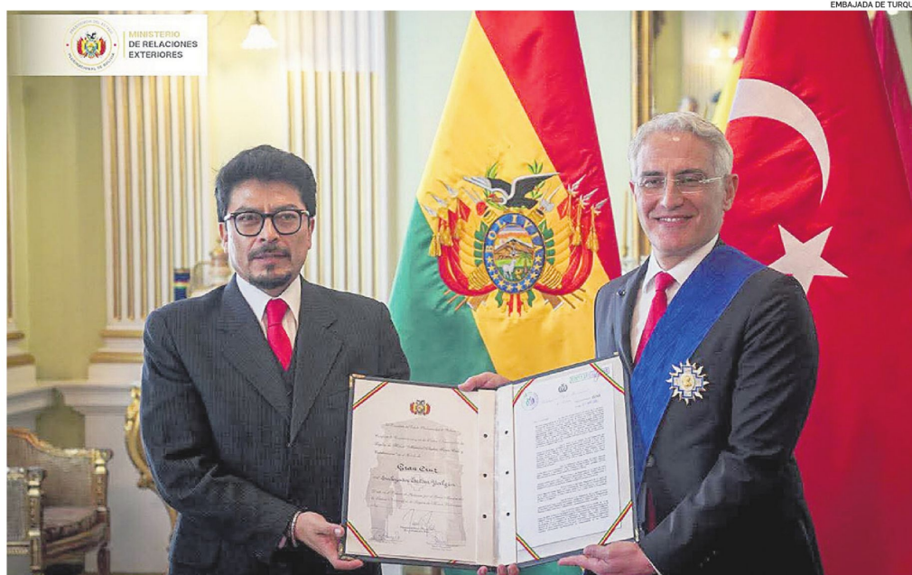
El embajador de Ertan Yalçin afirmó que su país busca fortalecer las relaciones bilaterales con Bolivia

Según el diplomático, existen importantes oportunidades de cooperación en áreas como energía, minería, agricultura e infraestructura entre Bolivia y Turquía.