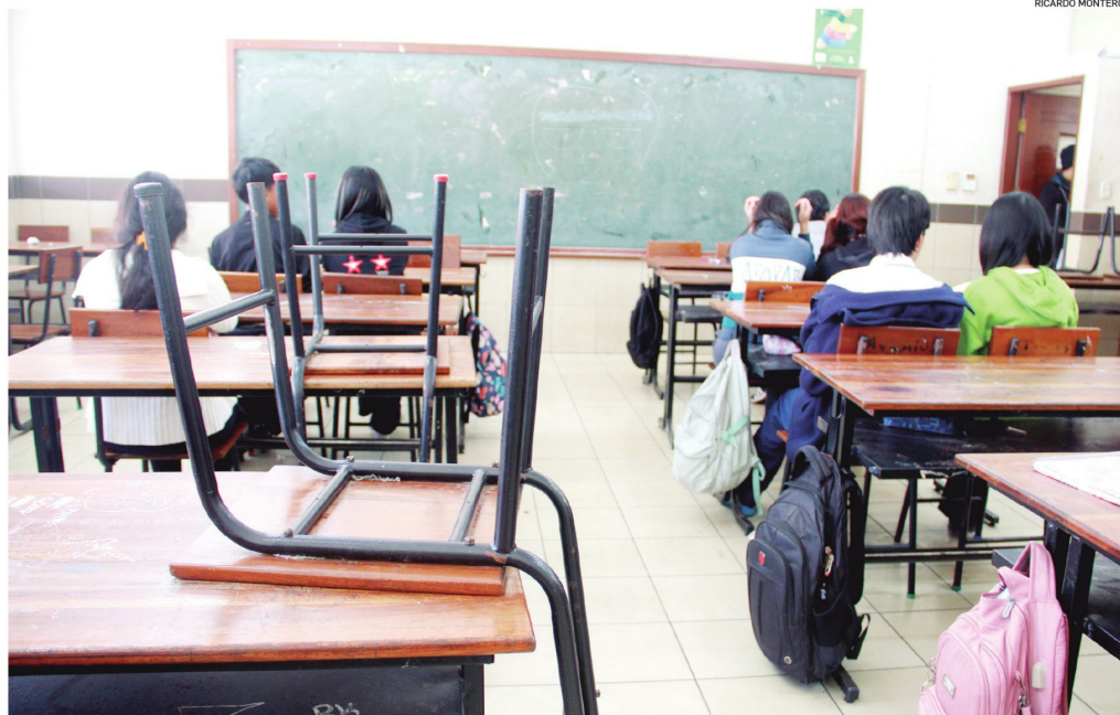
La cobertura educativa alcanza al 98%, pero los índices de calidad educativa están por debajo de los promedios regionales.