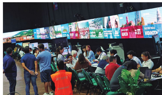
Todas las compras en el Outlet participaron por el premio "Viajero del Año"

Miles de personas accedieron a promociones, cuotas y oportunidades para viajar gracias a estropical.com, la agencia de viajes referente y de mayor trayectoria en Bolivia, que dio inicio a la 15.ª edición de su Outlet de Viajes en Santa Cruz de la Sierra, consolidando una vez más este evento como la plataforma de ofertas turísticas más importante del país. La actividad se desarrolló del 15 al 17 de mayo y reunió a miles de personas interesadas en acceder a promociones exclusivas para destinos nacionales e internacionales.