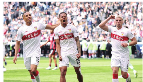
Stuttgart logró la clasificación a la Champions junto a otros tres equipos alemanes.

Depende de que el Arsenal falle y el equipo de Pep lo pase en la tabla de posiciones.