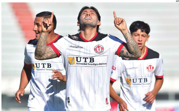
El plantel cochabambino logró imponerse en condición de local e impidió que Bolívar se apodere de la cima del campeonato local.

Cuatro minutos después, el conjunto local golpeaba al paceño con