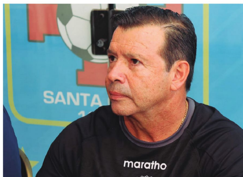
'Platiní' es el nuevo entrenador de la academia cruceña tras la salida de 'Pelechó' y Soria.

Perjuicio. Muchos de los técnicos cesados o que renunciaron no lograron sostener un proceso que, pues apenas daban sus primeros pasos en esta temporada. Bastaron algunos resultados adversos para cortar de raíz proyectos que requerían tiempo, trabajo y estabilidad.