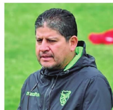
Villegas elegirá a los convocados.

Bolívar integra el grupo C donde está en la segunda posición con cinco unidades, debajo de Independiente Rivadavia (10) y por encima de Deportivo La Guaira (3) y Fluminense (2).