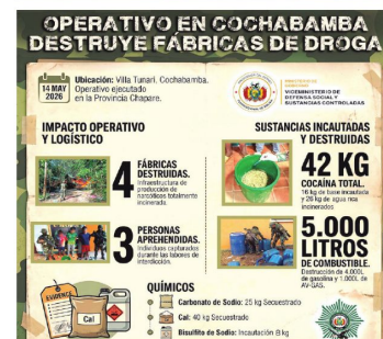
La administración de Paz Pereira muestra los resultados de su embate a los grupos narcotraficantes.