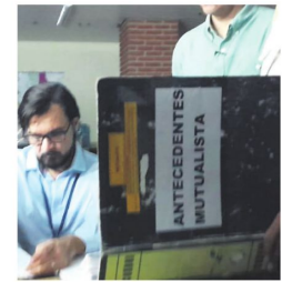
Magistratura entregó documentación histórica relacionada con los terrenos

La Alcaldía denunció la alteración de documentos y la desaparición de un informe técnico que rechazaba emitir el plano de uso de suelo para la familia Crapuzzi. El Archivo Histórico fue intervenido. SANTA CRUZ A6