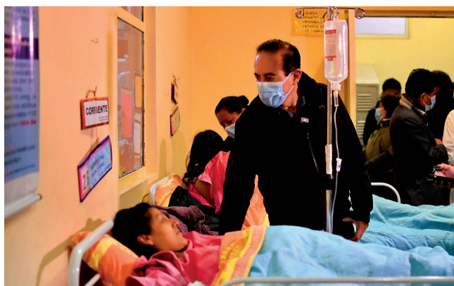
VISITA. El alcalde de La Paz estuvo en uno de los hospitales.