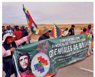
DATO. Evistas recorrerán entre 190 y 200 kilómetros.

En dicho encuentro, las bases determinaron que Caracollo, en el altiplano orureño, sería el punto de concentración para los contingentes provenientes del trópico de Cochabamba y el sur del país. Se prevé su arribo el lunes a La Paz.