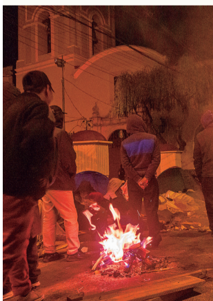
VIGILIA. Marchistas, en la Vicepresidencia.

La tensión se relajó en cierta medida, cuando se conoció que la normativa iba en camino de su derogatoria, aunque al cierre de esta edición continuaba el tratamiento del proyecto en detalle, antes de pasar al Ejecutivo.