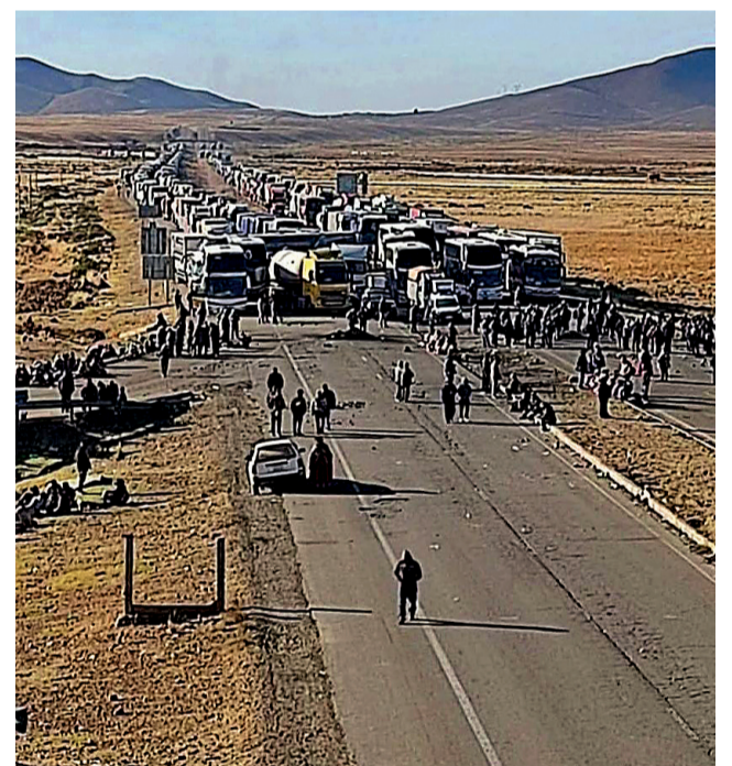
CAMPESINOS. Los bloqueos no tienen pausa en el país.