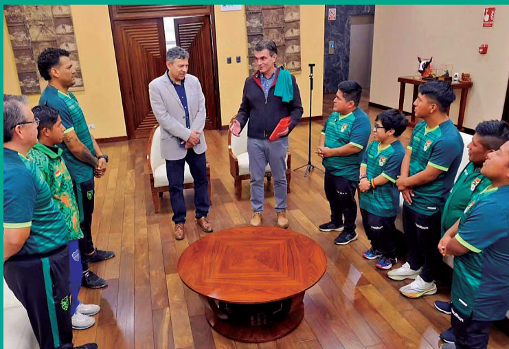
ENCUENTRO. El presidente Paz se reúne con la Selección de talla baja.