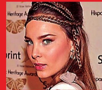
CANTANTE. La FIFA anunció que Belinda será una estrella.

Mientras que el viernes 12 de junio, Estados Unidos le dará la bienvenida al mundo a Los Ángeles, en lo que será un momento decisivo en la historia de la Copa Mundial. La celebración será encabezada por las superestrellas Katy Perry, Future, Anitta, LISA, Rema y Tyla, a las que se les sumarán otros artistas de renombre mundial que aún están por anunciarse, de acuerdo con la FIFA.