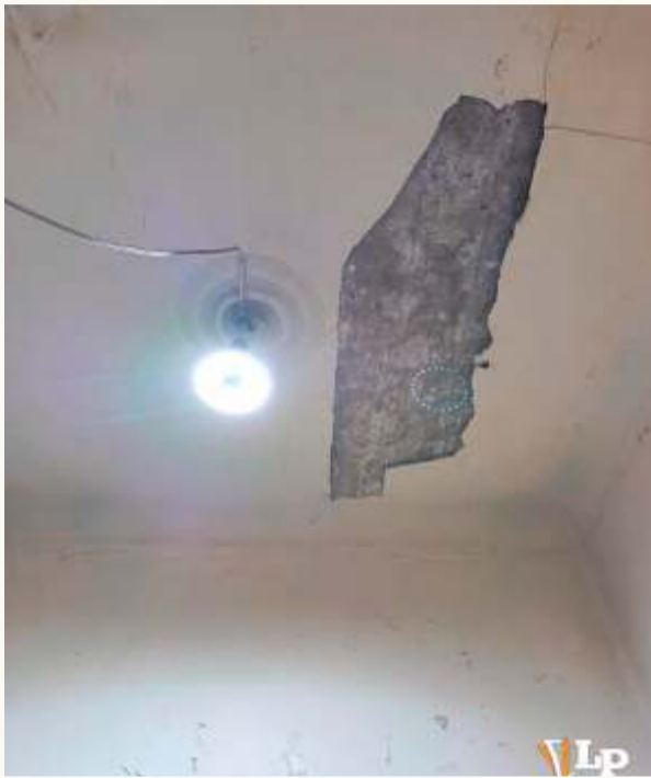
Parte del techo está muy dañado en la oficina