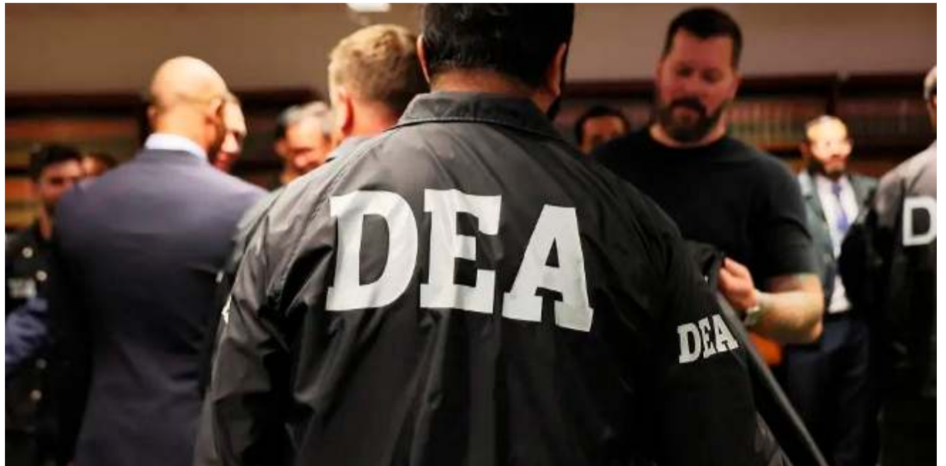
La DEA en Bolivia regresa con una oficina en La Paz

“Vendrán dos personas de la DEA, más que todo para tener una pre-