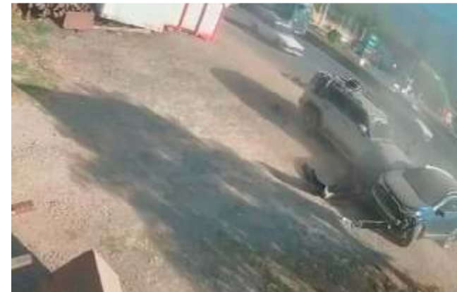
Dos vehículos colisionaron en la Av. Albina Patiño km 15 carretera a Valle Bajo, un menor de edad fue atropellado

cifras alarmantes con más de 3.000 accidentes de tránsito contabilizados por Univida S.A. hasta marzo, mostrando una alta incidencia. A raíz del accidente, el tráfico en el sentido Quillacollo - Cochabamba se interrumpió por varios minutos mientras el personal de Radio Patrullas y Tránsito realizaba el peritaje correspondiente y procedía al retiro del vehículo involucrado.