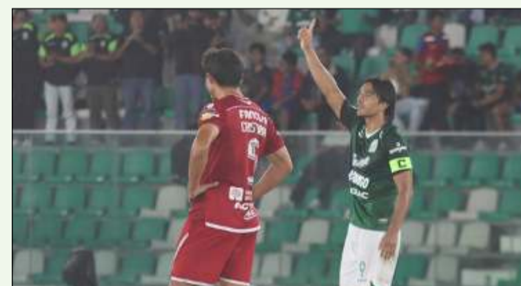
El doblete de Martins no alcanzó para que Oriente Petrolero gane a Guabirá

Martins anotó su segundo gol con un cabezazo que colocó el 2-1, anticipándose a sus marcadores y