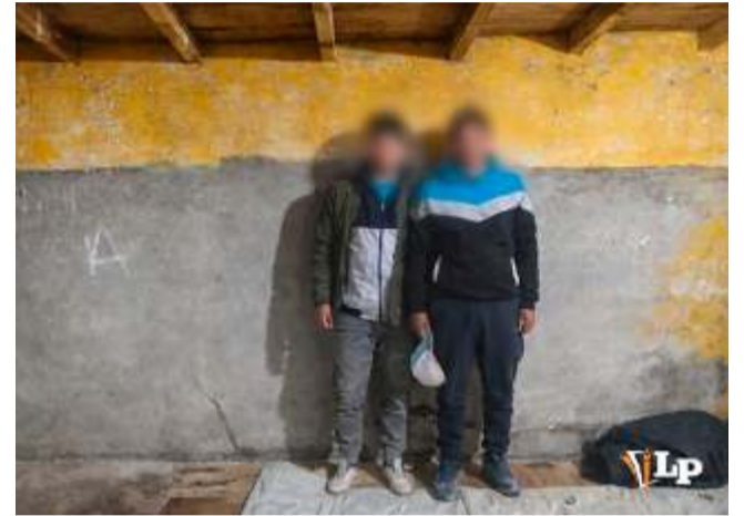
Los dos acusados transportaban fardos de ropa de segunda mano

el origen del cargamento. Además, se mantiene vigilancia sobre este tipo de casos ante la posible vinculación con otros ilícitos, como la trata de personas bajo la modalidad de falsas ofertas laborales. El camión permanece bajo custodia en dependencias de la Aduana Departamental mientras se realizan las pericias para verificar si, bajo los fardos de ropa, se oculta otro tipo de mercadería no declarada.