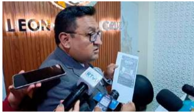
Los abogados de las víctimas piden detención preventiva para las sospechosas

2. Evidencia Tecnológica: La defensa mostró un cuaderno de investigaciones