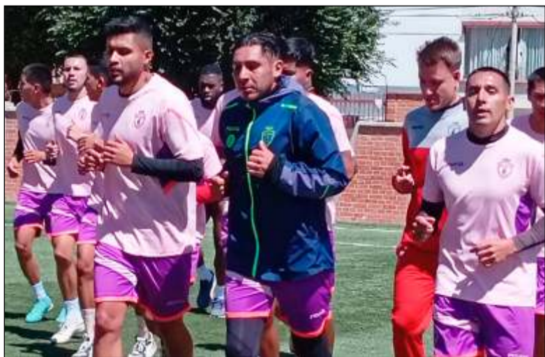
Jugadores del equipo realista no descuidan sus entrenamientos

CDT Real Oruro, luego del triunfo en la Villa Imperial contra Real Potosí (2-1) y el empate en Cochabamba contra Aurora, se ha recuperado en la parte anímica y también salió del fondo de la tabla. Ahora el objetivo es seguir sumando puntos para continuar en ascenso, el problema es que estas suspensiones, les está quitando ritmo futbolístico y la motivación que agarraron, se está "enfriando".