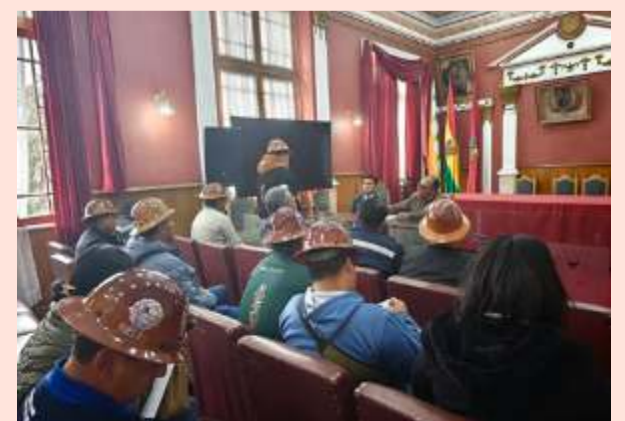
Primer acercamiento busca generar una agenda minera

En esta primera reunión oficial se sentaron las bases para futuras colaboraciones entre Fedecomín y la Alcaldía, buscando mejorar las condiciones del sector minero en Oruro.