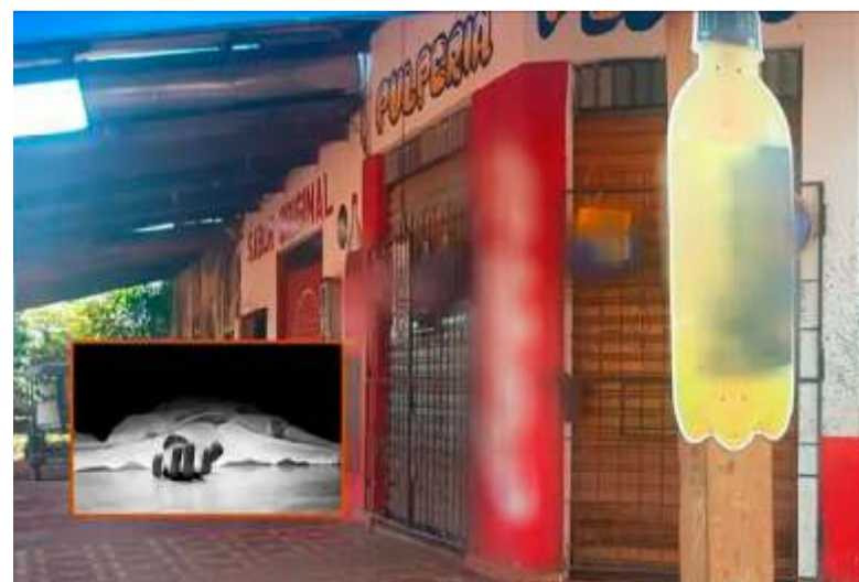
Acribillan a un hombre y dejan herida a una mujer en Guayaramerín

Este suceso resalta la violencia extrema del hecho; el dueño fue asesinado mientras descansaba en su casa y su pareja quedó gravemente herida tras el asalto perpetrado por delincuentes que irrumpieron a la fuerza.