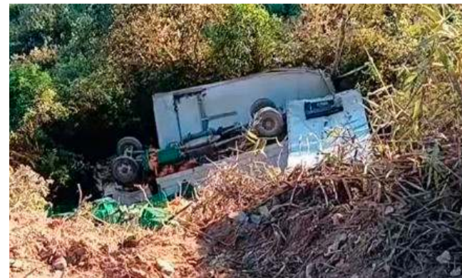
El conductor transitaba en una ruta alterna la cual estaba en mal estado

Se prevé que en las próximas horas la Direc-