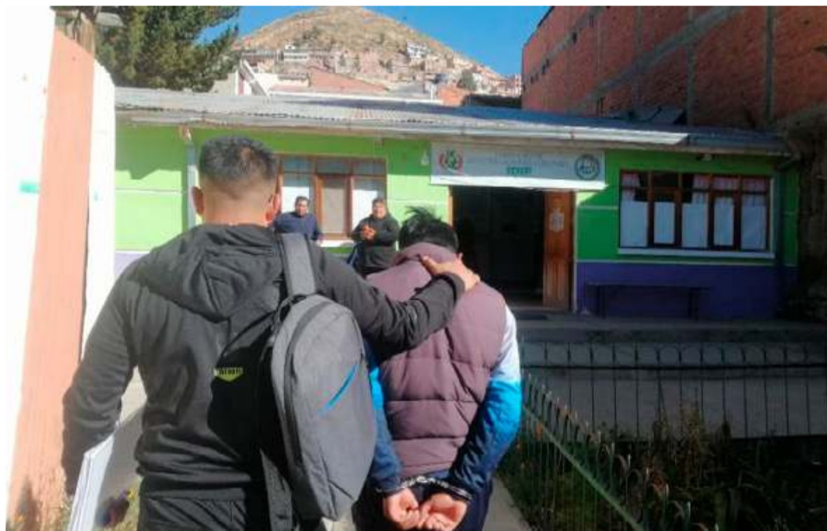
El sujeto llevo a la menor a un motel/LA PATRIA

nueva alerta entre las autoridades departamentales sobre los peligros del uso no supervisado