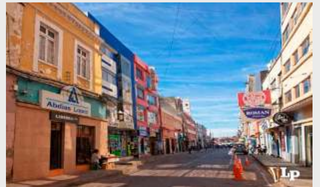
El hecho ocurrió en la calle Bolívar /LA PATRIA (IMAGEN REFERENCIAL)

Las autoridades competentes ya tienen conocimiento del hecho y se espera que en las próximas horas se brinden más detalles sobre la situación jurídica del agresor y las medidas de protección dispuestas para la afectada. Este incidente resalta la vulnerabilidad de los ciudadanos, incluso en zonas de alta concurrencia. Además, pone nuevamente en debate la necesidad de reforzar la seguridad en el casco viejo de la ciudad.