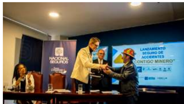
La creación de una Escuela de Formación fortalecerá el sector minero/MMM

El apoyo técnico brindado por planetGOLD estará enfocado en los siguientes