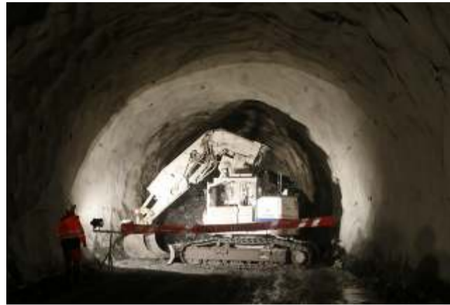
Gremios mineros abordarán en Lima el escenario de los minerales críticos

"La sesión se centrará en la respuesta de América Latina al contexto global, donde los minerales críticos, vitales para la transición energética, la electrificación y el avance tecnológico, han cobrado una im-