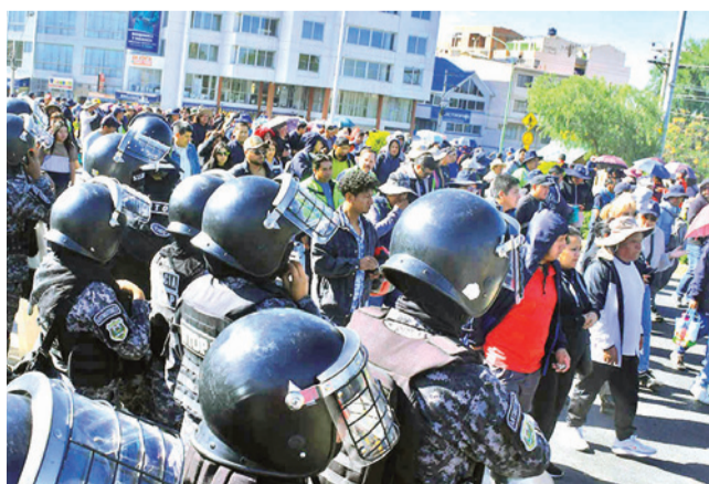
Afiliados a la COD Cochabamba bloquean en esta ciudad.

Violencia. Tras varias horas de peleas, finalmente los mineros se replegaron de las calles del centro paceño. La jornada en La Paz dejó dos policías heridos y al menos 10 manifestantes detenidos.