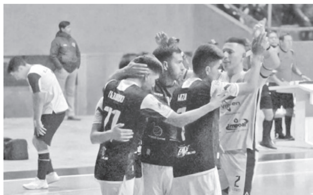
El equipo de futsal Morales Moralitos. MORALES MORALITOS