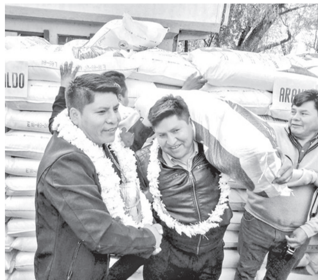
El Gobernador en la entrega de insumos.