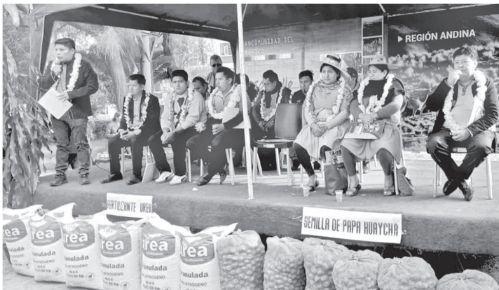
Alcaldes y Gobernador en el acto para dotar de insumos agrícolas.