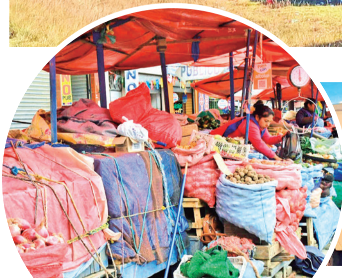
Mercados cerrados en la ciudad de La Paz. MARKA REGISTRADA