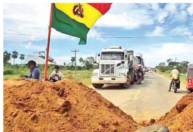
Bloqueos en el municipio de San Julián, en Santa Cruz.