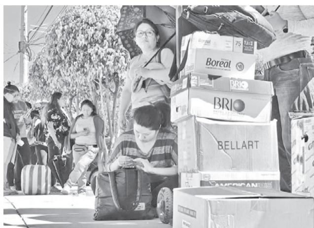
Una fila para enviar productos por vía aérea.

Hasta el miércoles 13 de mayo de 2026, Cochabamba registraba 311 conflictos y protestas sociales, 17 días efectivos de bloqueo en rutas