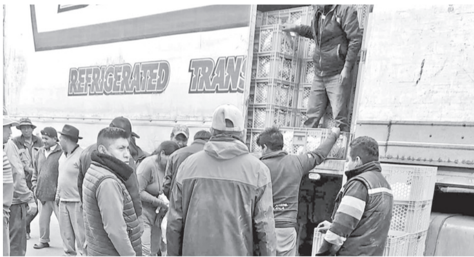
Los perjuicios que ocasionan los bloqueos en el país.

Impacto. Los sectores productivos alertan de un daño a la economía por los conflictos debido a que cientos de turistas han cancelado su visita a Bolivia y a que 5.000 conductores están varados en los caminos