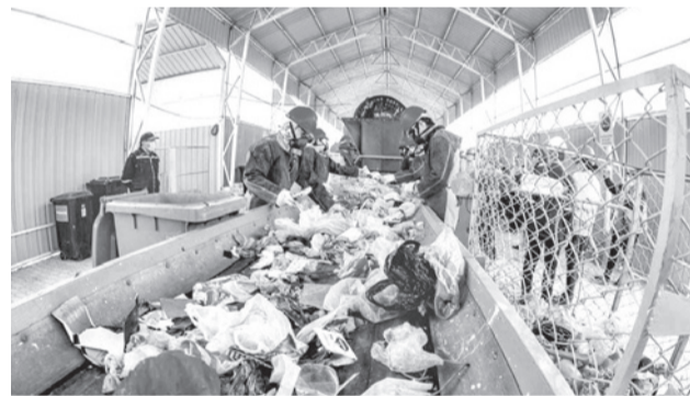
La planta separadora de Cotapachi.