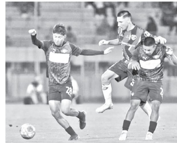
Wilstermann ante Israel University. JOSE ROCHA

El equipo disputa del torneo de la Primera A de la AFC para lograr una de las seis plazas para la Copa Simón Bolívar 2027, certamen nacional del cual deberá ser campeón, para volver a la máxima categoría del balompié nacional, o ser subcampeón, para disputar la ronda del descenso/ascenso indirecto.