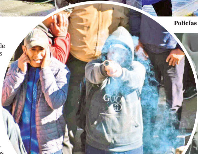
Manifestantes manipulan petardos.

Ante este panorama de convulsión, figuras políticas pidieron al Gobierno que encuentre