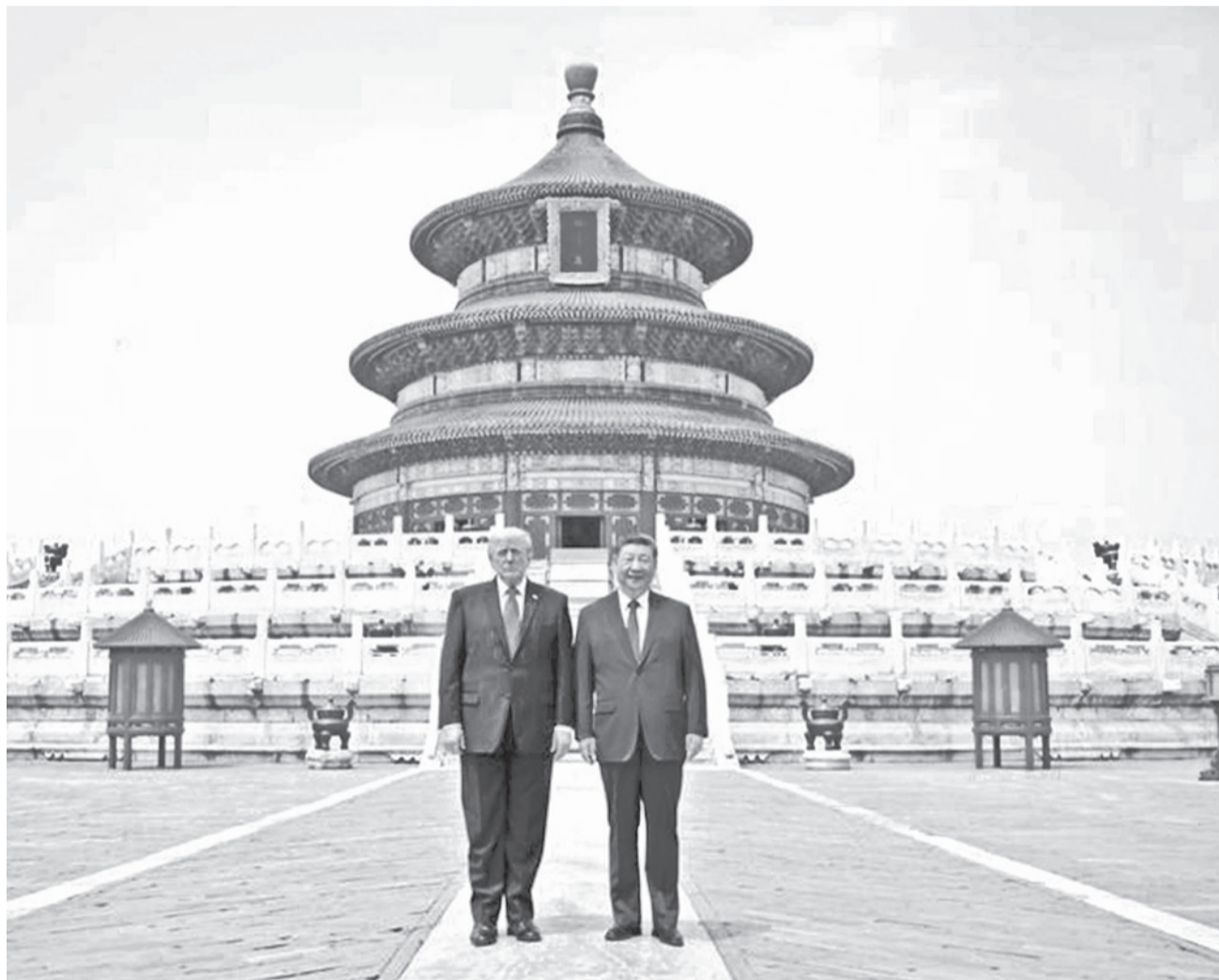
Donald Trump y Xi Jinping visitan el Templo del Cielo, ayer.

Cumbre. Xi Jinping advirtió a Donald Trump que una mala gestión de la cuestión de Taiwán podría llevar a ambos países a un “conflicto”