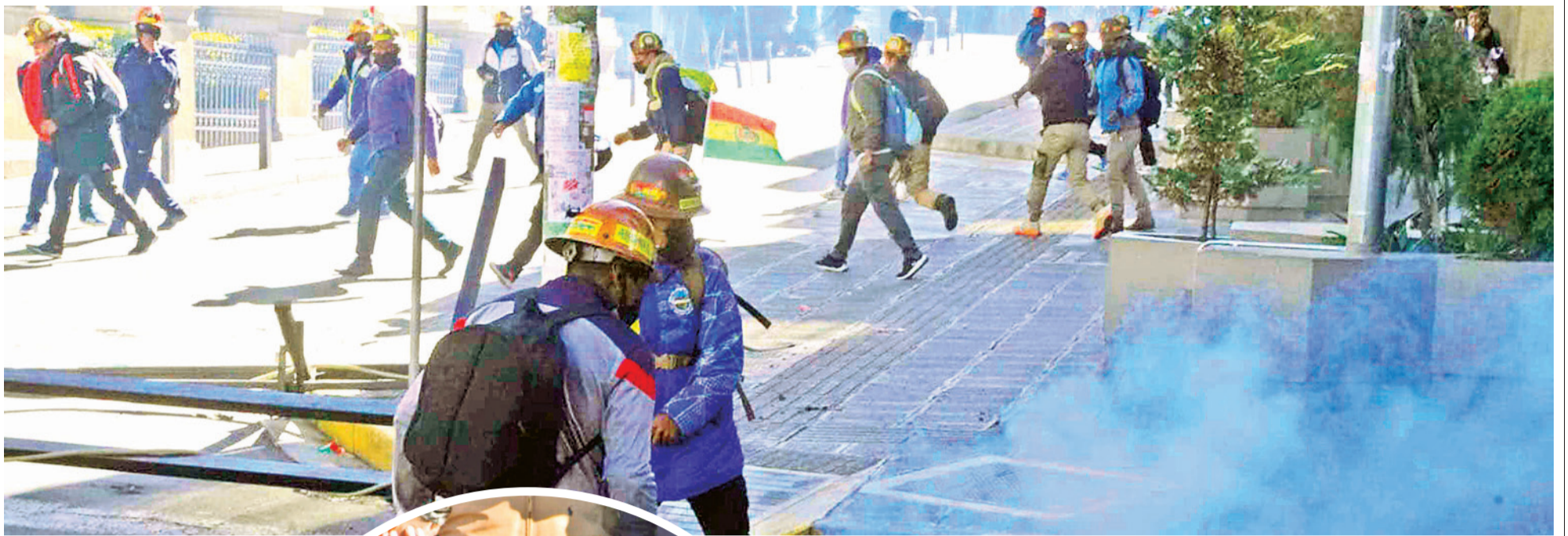
Policías antimotines y mineros cooperativistas se enfrentan en las calles de La Paz, ayer.