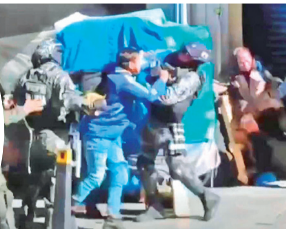
Aprehenden a un minero ayer en las calles de La Paz. ABYA YALA