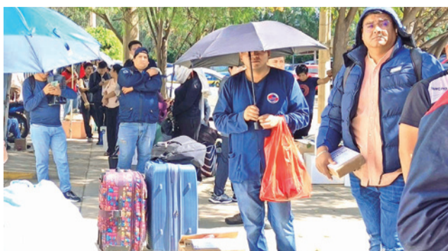
Comerciantes intentan enviar productos vía aérea. D. JAMES

Consultado sobre el desabastecimiento de alimentos y los perjuicios para los trans-