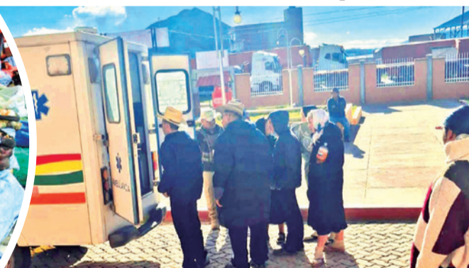
Familiares de la persona fallecida a causa del cierre de vías. DEFENSORÍA DEL PUEBLO

trados en el país. La ministra de Salud Marcela Flores confirmó previamente otros dos fallecimientos vinculados a la imposibilidad de acceder a atención médica.