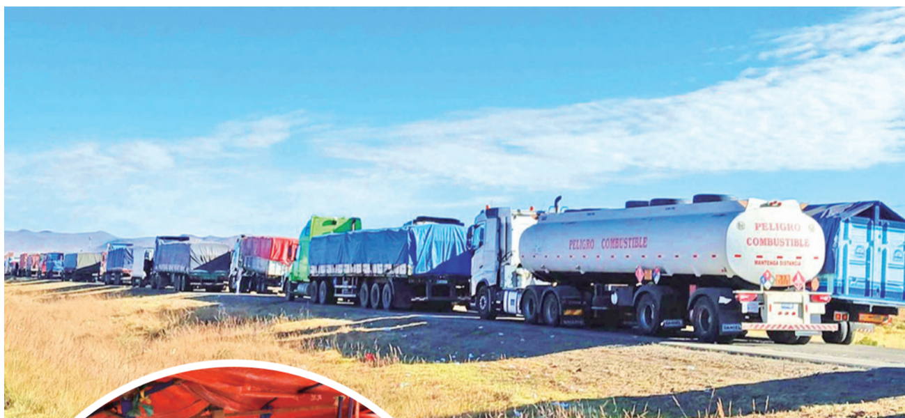
Filas de vehículos varados en La Paz a consecuencia de los bloqueos.

Denuncia. Según Derechos Humanos, en Bolivia se ha instalado una lógica en la que el sufrimiento de la población se utiliza como mecanismo de presión política