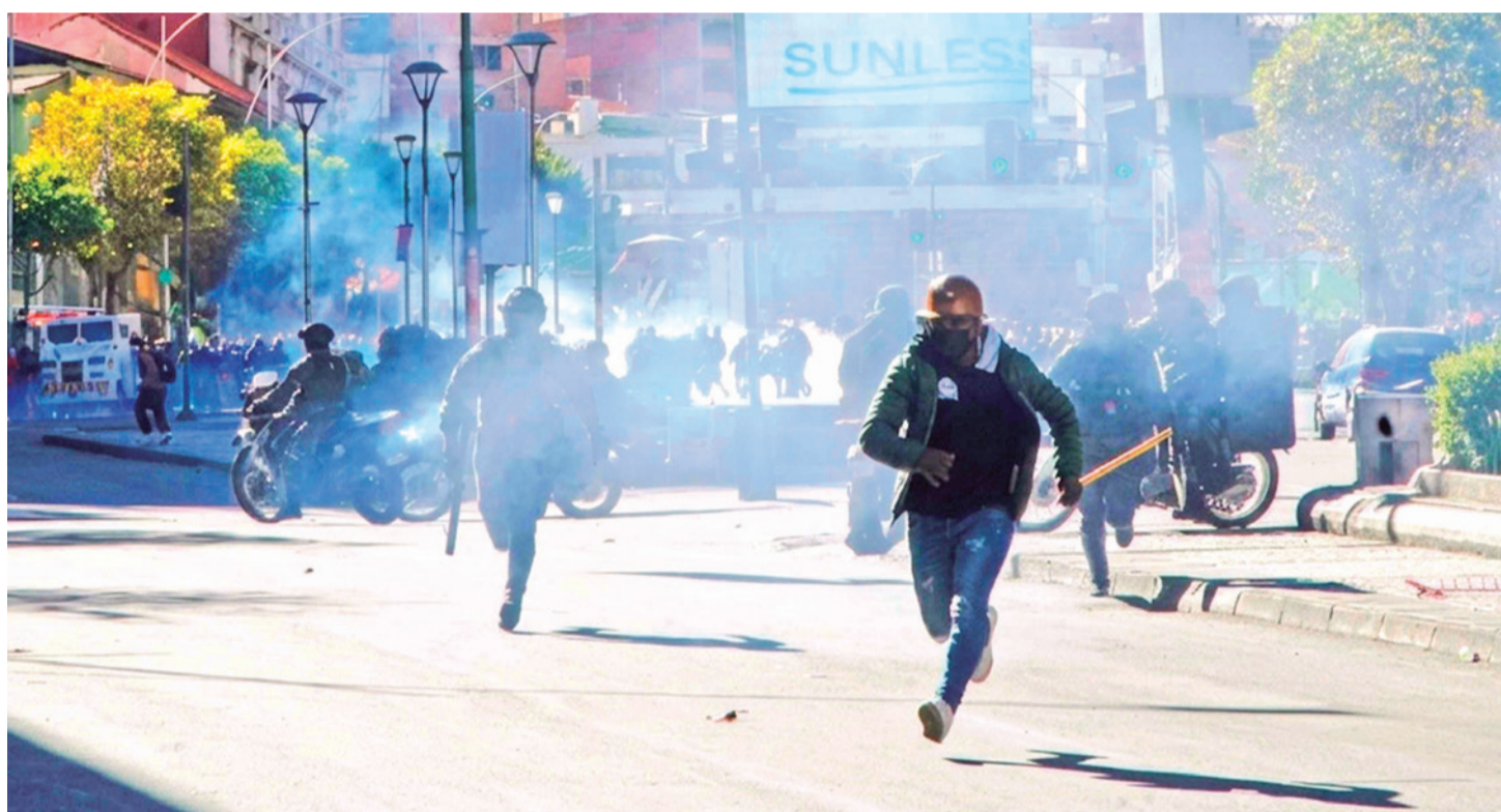
Mineros cooperativistas se enfrentan a la Policía en cercanías de la Plaza Murillo en medio de pedidos de renuncia del presidente Paz.