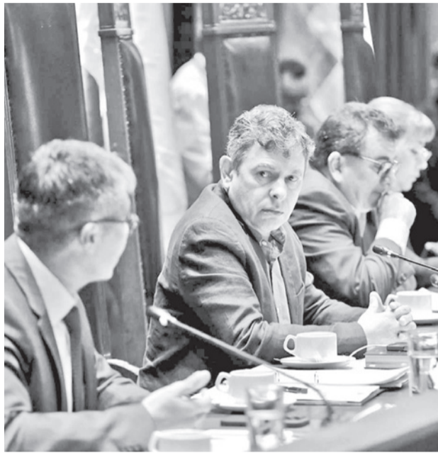
El Senado sancionó la ley de alivio tributario. SENADO BOLIVIA

La ley habilita mecanismos de regularización tributaria para deudas acumuladas entre 2018 y 2025, permitiendo