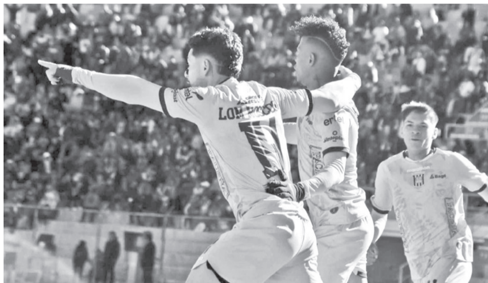
El partido de The Strongest con Always Reade, ayer, en El Alto. MARKA REGISTRADA

The Strongest abrió la cuenta a los 38 minutos en