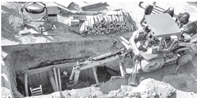
Trabajos en el colector de la av. Blanco Galindo. D. JAMES

Proyecto. La obra que se hace en la Av. Blanco Galindo es parte del proyecto de la Arquímedes y Tadeo Haenke