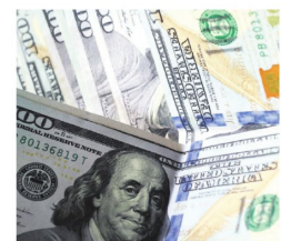
El valor referencial superó los Bs 10

coincide con semanas marcadas por bloqueos, problemas de abastecimiento y una mayor demanda de divisas. Aunque este 13 de mayo la cotización mostró una corrección, el indicador continúa muy por encima de los niveles observados hace apenas un mes.