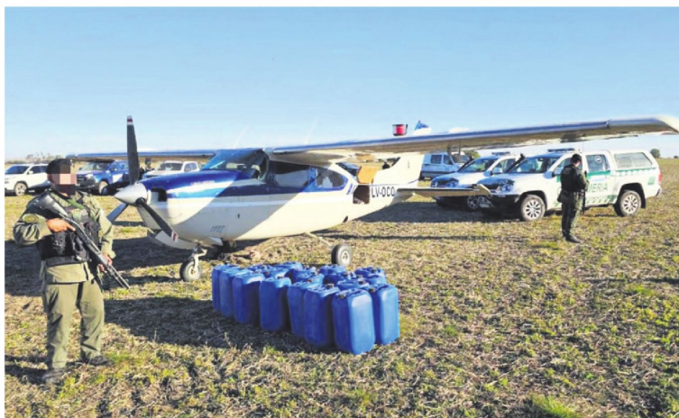
La aeronave que fue retenida en una pista clandestina en la provincia argentina de Santa Fe

El operativo se realizó en la provincia de Santa Fe. Dos bolivianos fueron capturados. En solo una semana han sido retenidos dos aparatos con cocaína en el vecino país, presuntamente vinculados al narco uruguayo, preso en EE.UU., Sebastián Marset