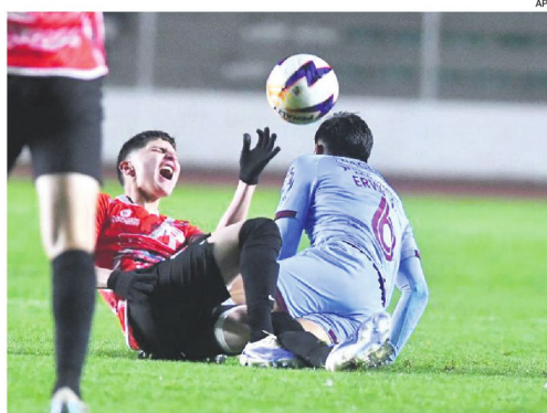
El duelo entre la academia paceña y los potosinos se vivió con intensidad en el Siles.

Mientras tanto, Nacional Potosí se queda en la novena