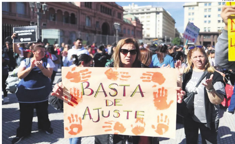
Fotografía de archivo de una marcha contra los ajustes en Argentina por la deuda y el acuerdo con el FMI

La próxima licitación de deuda en el mercado doméstico está