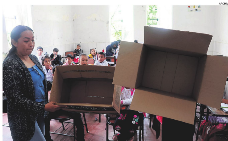
Las cajas vacías que mostraron los colegios en abril pasado, cuando comenzaron a faltar los productos