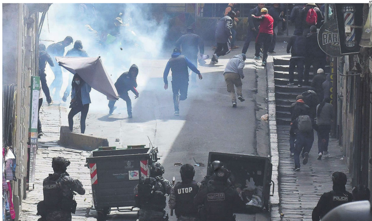
MANIFESTACIONES. La Policía y los maestros rurales se enfrentaron ayer en La Paz. Las protestas persisten, pese a que la Ley 1720 fue abrogada anoche por el presidente Paz