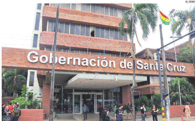
La Gobernación anuncia recorte operativo y reorganización institucional para enfrentar crisis financiera.

Las medidas de austeridad impulsadas por el gobernador cruceño Juan Pablo Velasco proyectan un ahorro estimado de Bs 13,8 millones hasta diciembre, mediante recortes operativos, revisión de contratos eventuales y reorganización del parque automotor.