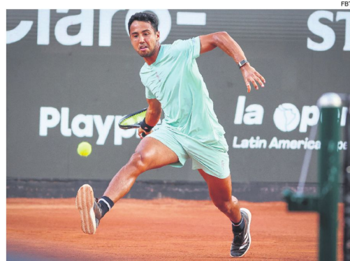
El tenista boliviano pasó a los cuartos de final del Open de Oeiras 4 en Portugal.

En el primer set Dellien comenzó con fuerza al romperle dos veces el saque a su rival, quien hizo lo propio en otros dos games para igualar el marcador, hasta que en el décimo juego el nacido en el departamento de Beni le quebró el ser-