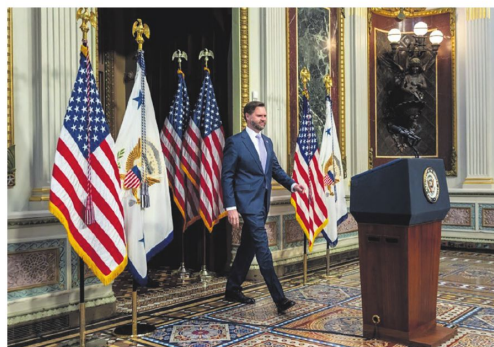
JD Vance a su llegada ayer a una conferencia en la Casa Blanca

"Miren, creo que tenemos avances. La cuestión fundamental es si estamos progresando lo suficiente como para cumplir con la línea roja del presidente (Donald Trump)", afirmó Vance, quien