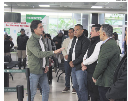
El pasado lunes, el alcalde encabezó la intervención de las oficinas

Anunció que el municipio impulsa un plan de ventanilla única y un proceso de digitalización de trámites, con el objetivo de simplificar trámites, reducir la intermediación y fortalecer la transparencia en la administración municipal. Esto pondrá fin a los intermediarios que eran el paso inicial para el desvío de recursos.