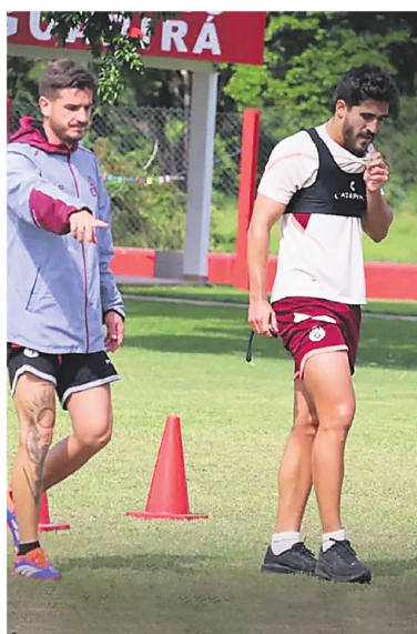
Los azucareros quieren seguir sumando para salir del fondo de la tabla, mientras que los refineros no están dispuestos a fallar en casa.

En la vereda del frente está Guabirá, que marcha en la posición 15 con 4 unidades y quiere seguir recuperando terreno a costa del albirverde. "Vamos a ir con