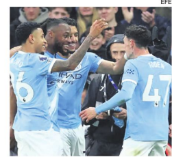
Manchester City gana y sigue en pelea.

Media hora duró el cero en el arco de Crystal Palace. Fue el tiempo que le llevó al City encontrar una jugada y dejar a su 9 mano a mano con Dean