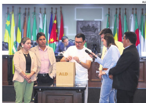
Las nuevas directivas resultaron elegidas en base al consenso.