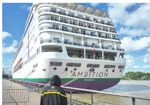
El crucero Ambition se encuentra atracado en el puerto de Burdeos

De este modo, se confirmó que este brote no tiene relación con