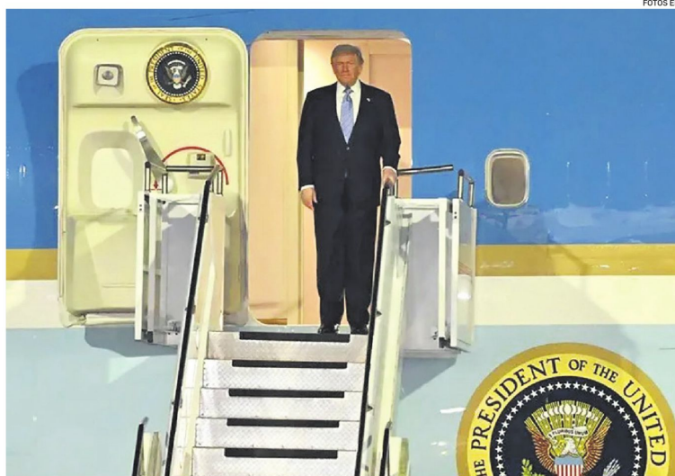
El mandatario estadounidense se prepara para bajar del Air Force One en el aeropuerto de Beijing

La visita, la segunda de Trump a China tras la realizada en 2017 durante su primer mandato, incluye hoy reuniones con Xi, una cena de Estado y una serie de actos protocolarios en una agenda