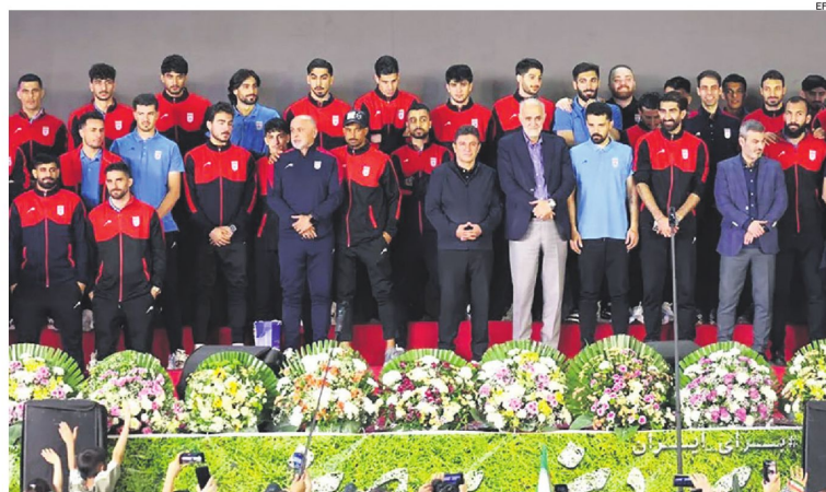
Despedida del equipo de Irán que disputará la Copa Mundial de la FIFA. El acto estuvo cargado de simbolismo político y nacionalista.

La ceremonia estuvo cargada de simbolismo en medio de la guerra con EEUU. Los jugadores llevarán un guepardo en su camiseta.