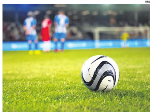
El balompié nacional se ve afectado por los conflictos sociales en el occidente del país.

Totora Real Oruro y Universitario de Vinto debían jugar el sábado 9 de mayo en Oruro, pero el club visitante comunicó que no podía realizar el viaje. Igual sucedió con Aurora que no pudo ir a la Villa Imperial para jugar con Nacional Potosí el 8 de mayo.