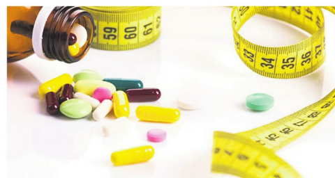
Estrategias diferentes ayudan a mantener la pérdida de peso.

Ambos estudios sugieren, que la pérdida de peso inicial puede mantenerse con ambas estrategias, si bien los dos equipos de investigadores indican como limitaciones de sus estudios el carácter a corto plazo y la escasa diversidad de las poblaciones estudiadas.