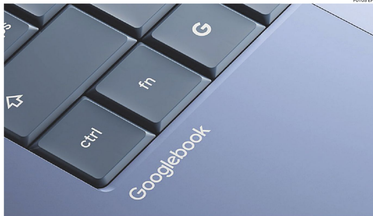
Fotografía de Google que muestra un detalle del teclado del nuevo Googlebook anunciado el martes.