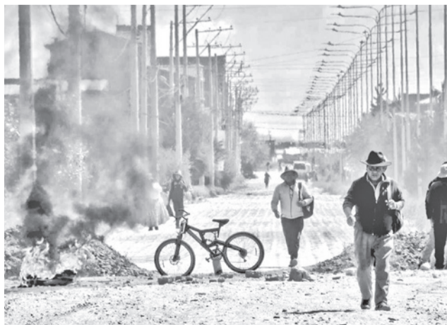
Bloqueo de vías en la ciudad de La Paz. MARKA REGISTRADA

“El orden constitucional que hemos aprobado y que define como los bolivianos ejercemos nuestro derecho democrático de expresar nuestras ideas, nuestras protestas y ninguna pasa por estas formas violentas de manifestación que posiblemente pueden encubrirse bajo el derecho de la protesta, pero en rigor están afectando otros derechos y derechos fundamentales, como lo señala la Constitución que son inviolables y que el Estado debe protegerlos”, añadió.