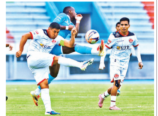
Universitario de Vinto vence a San Antonio. JOSE ROCHA

En los últimos días el desarrollo del torneo de la División Profesional del fútbol boliviano se vio afectado por los conflictos sociales que soporta el país.