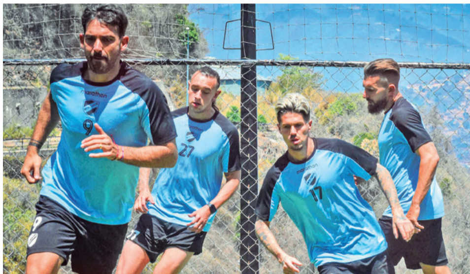
Un entrenamiento del club Bolívar con miras al partido. CLUB BOLIVAR

Según explicó el principal dirigente de Nacional Potosí “por lo general” el plantel se traslada rumbo a La Paz por vía terrestre, pero en esta oportunidad no será posible hacerlo, pues “no hay por donde transitar, además por la seguridad de los jugadores”, por lo que decidieron pagar 80 mil bolivianos para el traslado.