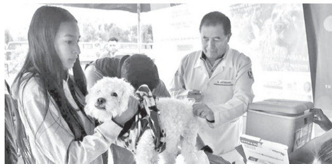
La vacunación contra la rabia canina en el sur. CARLOS LÓPEZ

Campaña. Alistan nuevas jornadas de vacunación en los focos críticos como K'ara K'ara para evitar la enfermedad