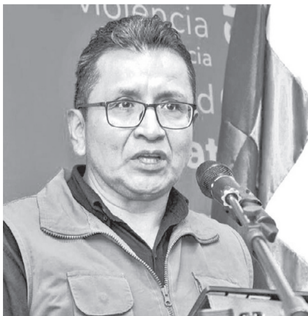
El Defensor del Pueblo, Pedro Callisaya. DEFENSORIA DEL PUEBLO

Con respecto a los combustibles, el Defensor del Pueblo informó que no se identificaron escenarios críticos de desabastecimiento de combustible ni de alimentos en hospitales ni centros de acogida; sin embargo, advirtió sobre señales de alerta relacionadas con el incremento de precios de productos de la canasta familiar debido a las dificultades que presenta el transporte.