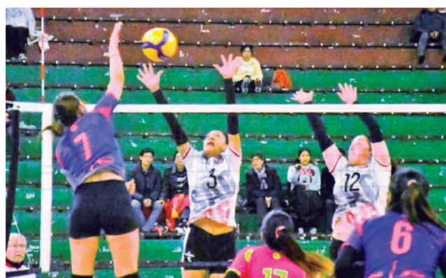
Un partido de la Liga Superior de Voleibol.

de una primera fase, en la que participan ocho clubes, que juegan todos contra todos, aunque en una sola rueda, que se desarrollará a lo largo de cuatro fines de semana.