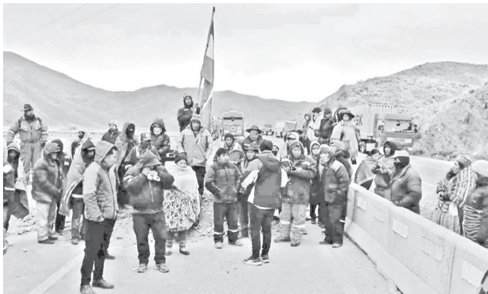
Seguidores de Evo Morales marchan rumbo a La Paz desde Caracollo, ayer.

Los campesinos exigían una solución a la dotación de combustible de mala calidad, pero ahora hay grupos que demandan la renuncia del presidente Rodrigo Paz. El bloqueo de carreteras afectas también a los municipios vecinos de La Paz: