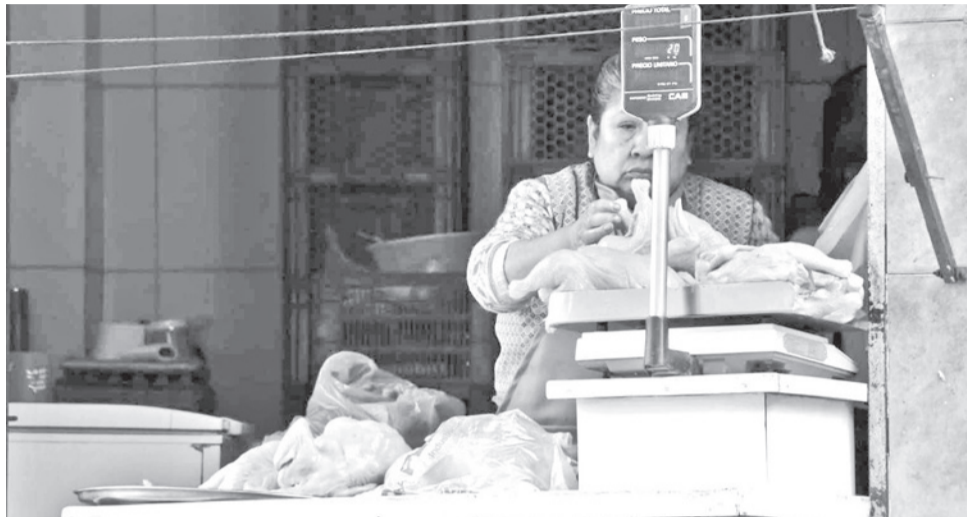
Distribución y venta de alimentos en la ciudad de La Paz. MARKA REGISTRADA

La Confederación de Empresarios Privados de Bolivia (CEPB) pidió ayer la conformación de un equipo de mediación integrado por entidades nacionales de derechos humanos y organismos internacionales para promover un diálogo entre los sectores movilizados y el Gobierno de Rodrigo Paz, con el fin de resolver los conflictos sociales que golpean al país. Los empresarios propusieron la mediación en el pronunciamiento titulado "Bolivia demanda acuerdos, institucionalidad y resultados".