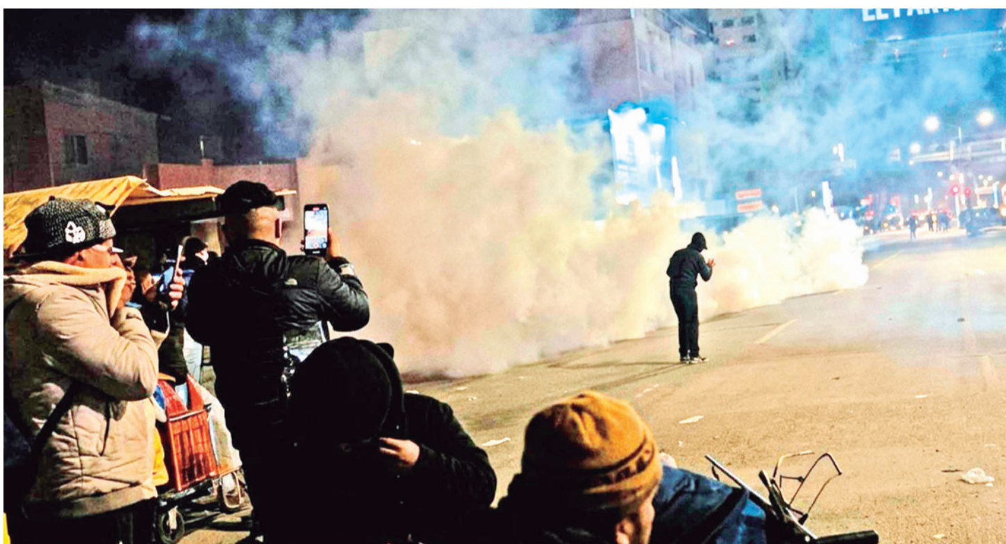
La Policía gasifica a los manifestantes que apedrearon a los minibuses y saquearon tiendas en Río Seco, en El Alto, anoche.