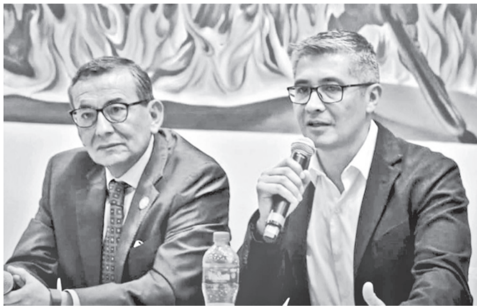
El ministro de Economía, José Gabriel Espinoza.

Mientras que, en el caso del IDH, se habilitarán cerca de Bs 280 millones que serán