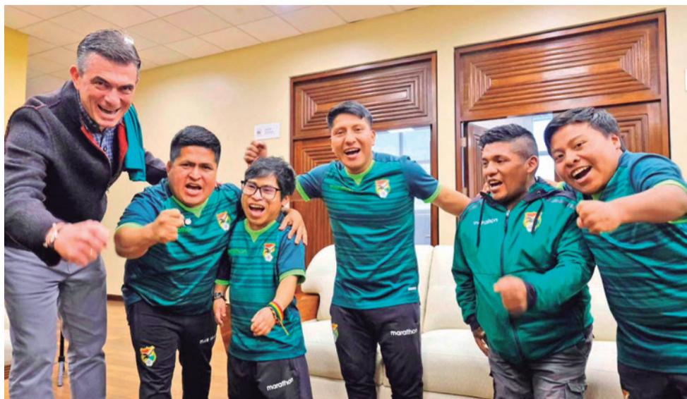
El presidente con la Selección Boliviana Talla Baja.