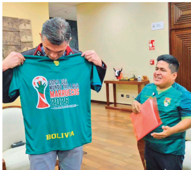
Los jugadores de la selección presentaron su plan.