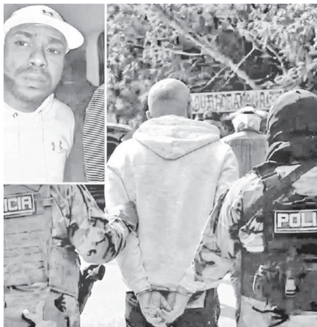
El jefe de la mafia brasileña detenido.