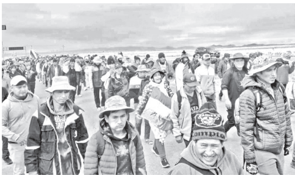
Afiliados a las juntas vecinales de El Alto bloquean vías de esa ciudad.