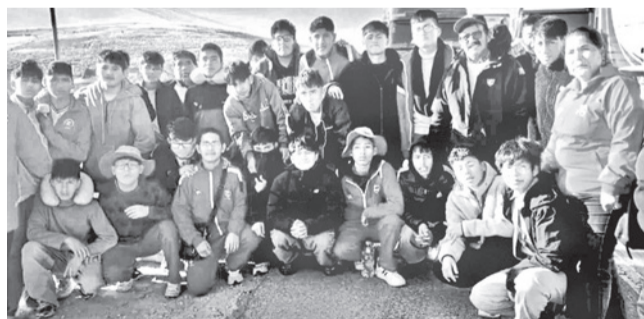
Parte de la delegación de estudiantes peruanos durante el viaje de retorno a su país.

Cuidado. La medida preventiva, ante un posible contagio de virus, regirá hasta el domingo 31 de mayo