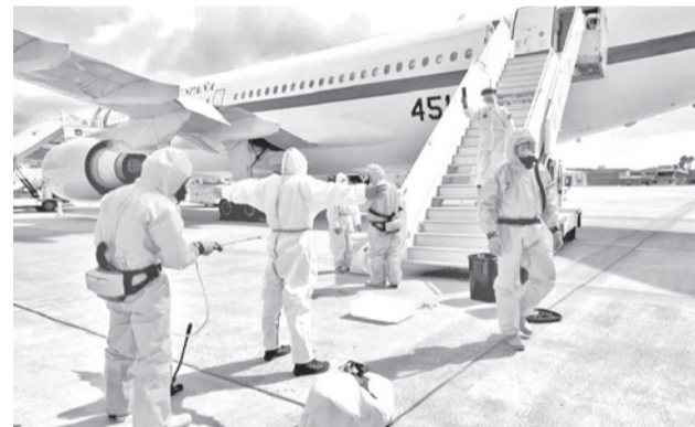
Pasajeros del crucero vuelven a sus países de origen.

El lunes por la tarde finalizaba el operativo con la llegada a Granadilla (Tenerife) de dos aviones "escoba" de Países Bajos que se encargaron de recoger a los pasajeros y los tripulantes desembarcados que todavía no habían sido evacuados. Mónica