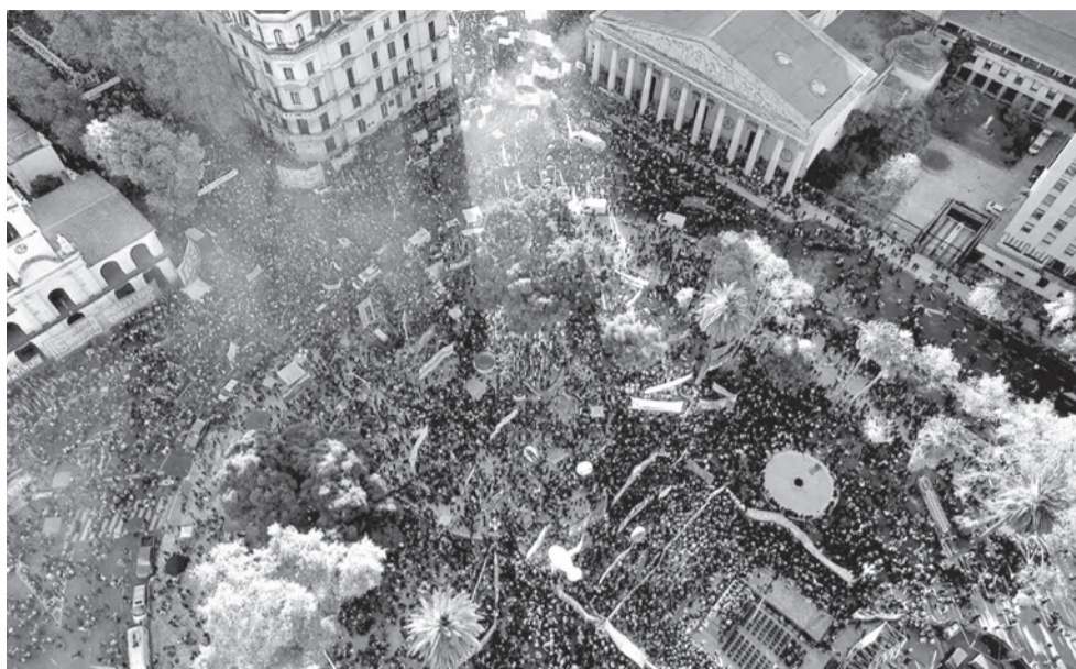
Loa manifestantes en la Plaza de Mayo, en Buenos Aires, ayer.