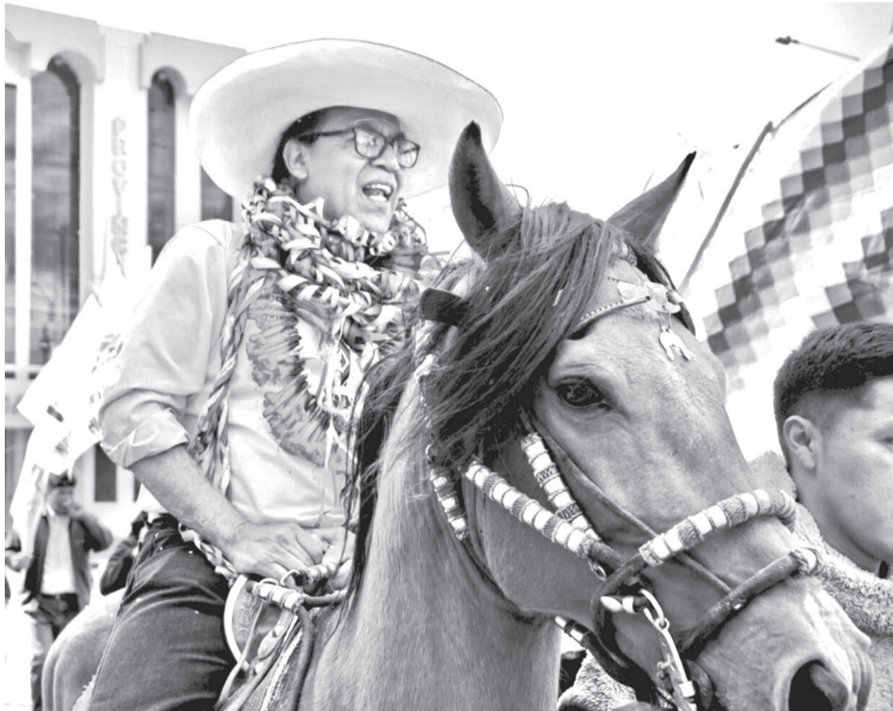
Roberto Sánchez Palomino, candidato de Juntos por el Perú. ROBERTO SÁNCHEZ PALOMINO

Elecciones. Tras un ajustado conteo, el candidato de Pedro Castillo superó a Rafael López Aliaga y va al balotaje