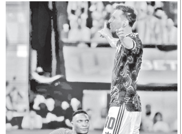
El ídolo argentino, Lionel Messi.

La lista definitiva se dará a conocer a finales de este mes.