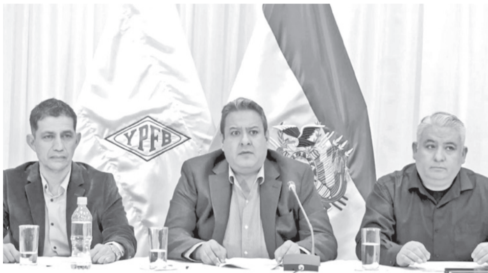
La conferencia que brindó YPFB sobre la calidad de combustible.