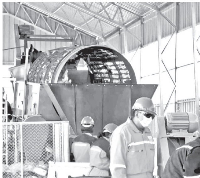
Parte de la infraestructura de la planta de residuos.