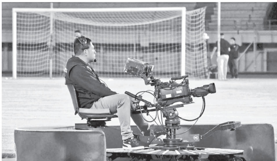
Los equipos para la transmisión de partidos. CARLOS LÓPEZ

El tercer encuentro suspendido es Gualberto Villarreal-SJ vs. Real Tomayapo, que estaba previsto para hoy en Oruro, con validez para la séptima fecha.