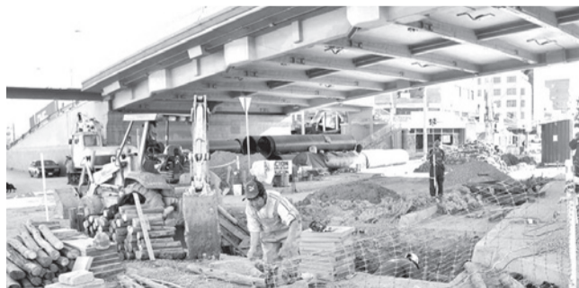
Los trabajos de Semapa en la Av. Blanco Galindo.

Perjuicio. El cierre de la vía provoca un congestionamiento en las inmediaciones, que empeora el sábado por la autoventa