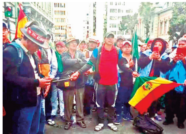
Marcha de los indígenas de Beni y Pando en La Paz. CIDOB

Desde el PDC se afirmó que se dará un voto de aprobación a dicho proyecto con el fin de que las movilizaciones cesen, sobre todo en el departamento de La Paz.