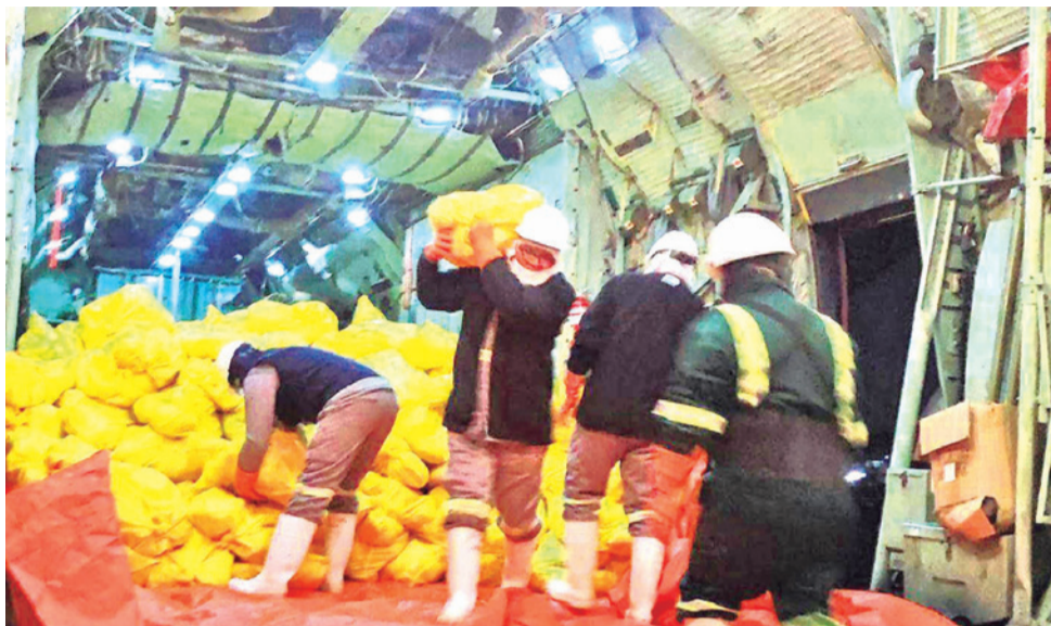
Envío de pollo a La Paz por parte del Gobierno debido a la escasez de alimentos. FAB

Sectores que se movilizan en el país tienen diferentes demandas al Gobierno, entre ellas la atención a peticiones laborales, abrogación de la Ley 1720, la reposición salarial, la distribución de combustible con parámetros de buena calidad y el rechazo a la privatización de las empresas estratégicas. Otros sectores como los Mineros de Corocoro y la marca Muropillar; los campesinos de la provincia Omasuyos y los de la localidad de Lipari se encontraban demanda de la renuncia del presidente Rodrigo Paz.