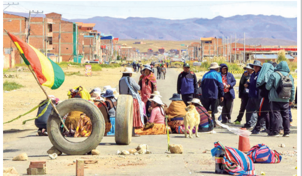
Bloqueo de carreteras por campesinos en el departamento de La Paz, ayer.

El ministro de Gobierno, Marco Antonio Oviedo, denunció que las instrucciones de estas movilizaciones llegan desde el trópico de Cochabamba, bastión del evismo. Además, la autoridad aseguró que “están moviendo con plata a la gente”.