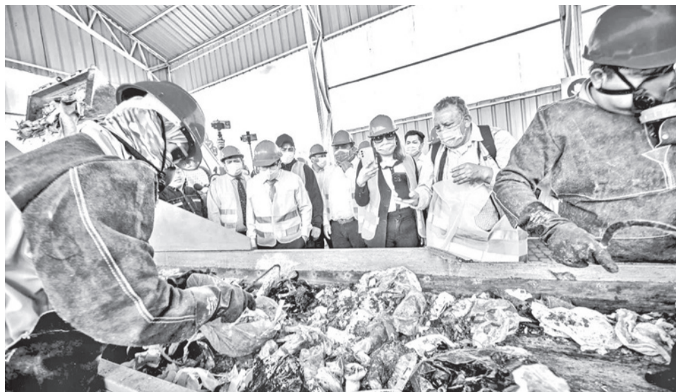
Autoridades y técnicos recorren la planta de residuos en Cotapachi.