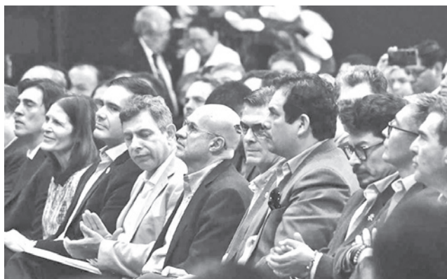
El Encuentro Nacional realizado en Cochabamba. C. LÓPEZ

La decisión se enmarca en el marco de los consensos alcanzados el sábado durante el Encuentro por el País: Acuerdo Nacional para la Estabilidad y las Reformas, se-