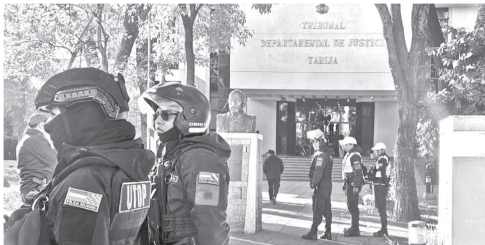
Policías resguardan el juzgado donde empezó el juicio contra Evo Morales, ayer en Tarija.

“El Ministerio Público en su momento va a solicitar la pena de presidio de 20 años que es con la agravante por el tipo de delito”, afirmó Mogro a Erbol, quien aseguró además que el Ministerio Público reunió más de 140 pruebas documentales y cerca de 50 testigos dentro de la investigación.