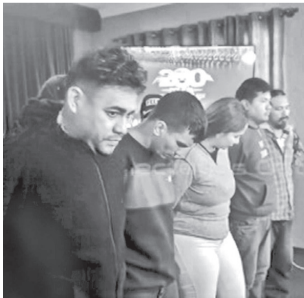
Los aprehendidos en la hacienda de Marset, ayer.

En el lugar se halló una gran cantidad de armas de fuego, cargadores, celulares, dinero, indumentaria policial, sustancias controladas y caletas ocultas con turrisles, los cuales aún no han sido cuantificados. Al respecto, se informó que este lunes se