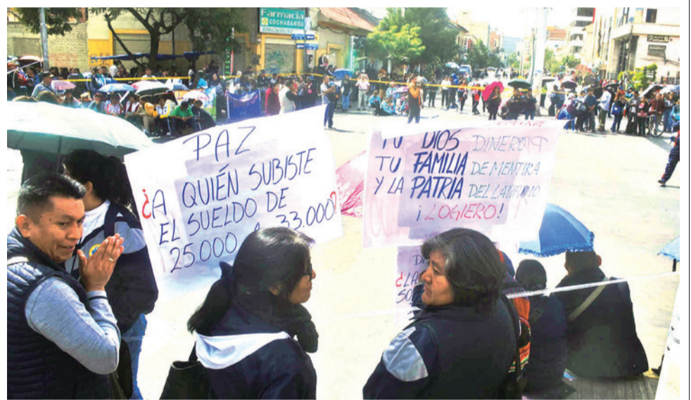
El sector de los maestros cierra las calles de la ciudad de Cochabamba, ayer. JOSE ROCHA