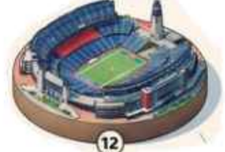
12 Estadio de Boston 63,815