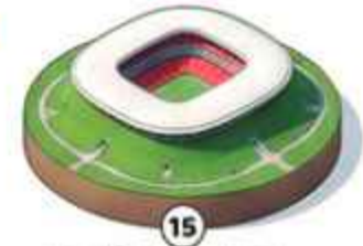
15 Estadio de Guadalajara 44,330