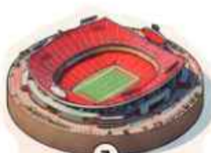
7 Estadio de Kansas City 67,513