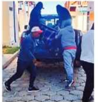
DELITO. La persona asesinada en Qaqachaqa.

Los presuntos autores del hecho, quienes al parecer estaban ebrios, recurrieron armas de fuego y efectuaron varios disparos directos en contra de las víctimas, quienes eran los ganadores. Posteriormente, se dieron a la fuga al aprovechar la confusión del momento.