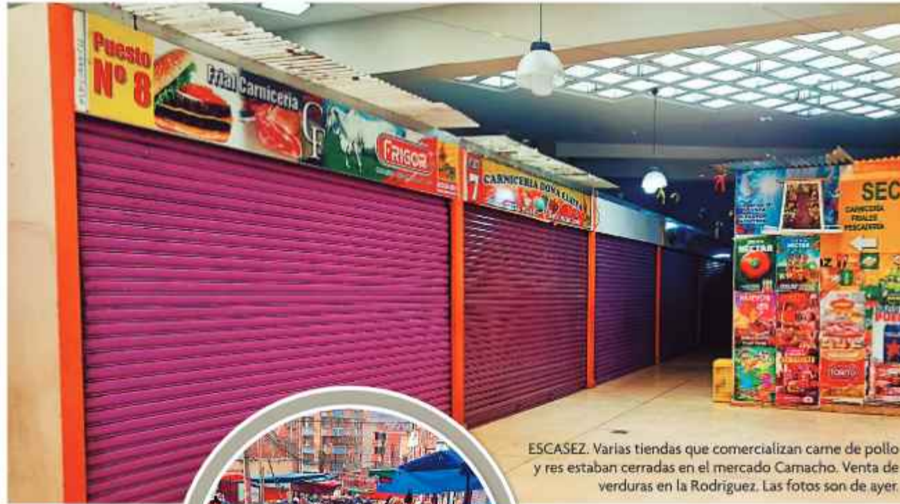
ESCASEZ. Varias tiendas que comercializan carne de pollo y res estaban cerradas en el mercado Camacho. Venta de verduras en la Rodríguez. Las fotos son de ayer.

Los comerciantes reportaron que el producto dejó de ingresar con normalidad