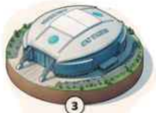
3 Estadio de Dallas 70,122