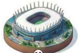
14 Estadio BC Place Vancouver 48,821