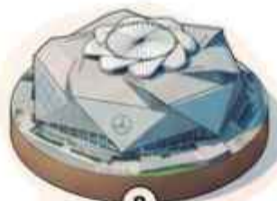
8 Estadio de Atlanta 67,382