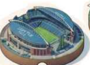
10 Estadio de Seattle 65,123