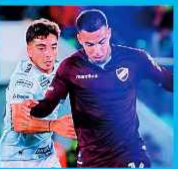
INCIDENCIA. Del partido jugado anoche en Santa Cruz.