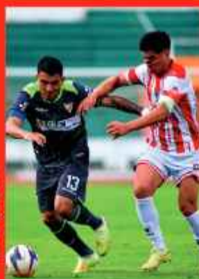
CHOQUE. Escena del partido jugado ayer en Sucre.