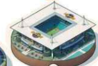
11 Estadio de Miami 64,091