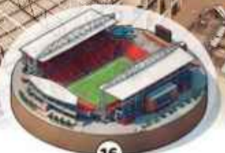
16 Estadio de Toronto 44,315