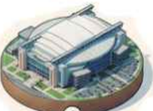
6 Estadio de Houston 68,311