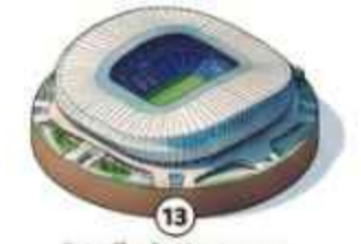
13 Estadio de Monterrey 50,113