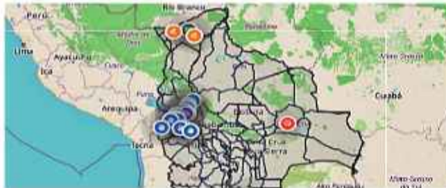
AFECTACIÓN. El mapa de transitabilidad en la web de la ABC.

El mapa de transitabilidad de la ABC muestra que la mayor concentración de piquetes interrumpe la conexión entre la sede del gobierno y el resto del país. Huayrapata, Turco Cala, San Pedro, cruce a Luribay, Botijlaca, Puente Achuma, Viacha, Tranca Sapecho, Remedios, Río Seco, Chitia, Panduro y Achiri son algunos de los sectores por los que no se puede circular.