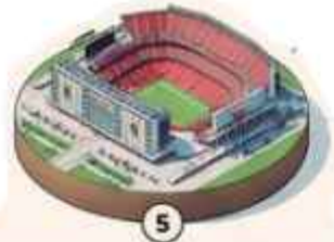
5 Estadio del Área de la Bahía de San Francisco 69,391