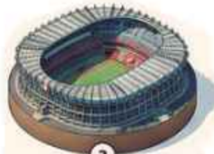
2 Estadio de Ciudad de México 72,766