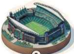
9 Estadio de Filadelfia 65,827