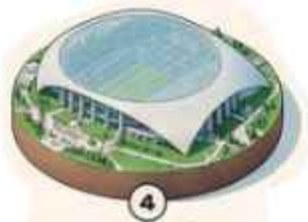
4 Estadio de Los Ángeles 69,650