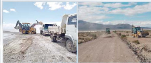
MANTENIMIENTO DE CAMINOS