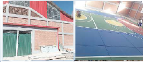
CONST. TINGLADO Y COMEDOR UNIDAD EDUCATIVA COIPASA