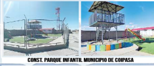
CONST. PARQUE INFANTIL MUNICIPIO DE COIPASA