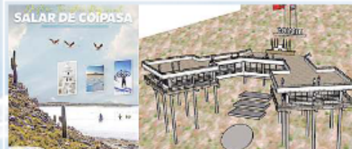
ESTUDIO DE PREINVERSIÓN IMPLEMENTACIÓN DEL MIRADOR PRINCIPAL CIRCUITO TURÍSTICO COIPASA