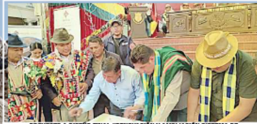
PROYECTO A DISEÑO FINAL "RENOVACIÓN Y AMPLIACIÓN SISTEMA DE ALCANTARILLADO SANITARIO COIPASA"