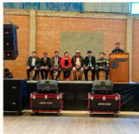
Sindicato de Trabajadores de la Prensa de Oruro celebró el Día del Periodista.