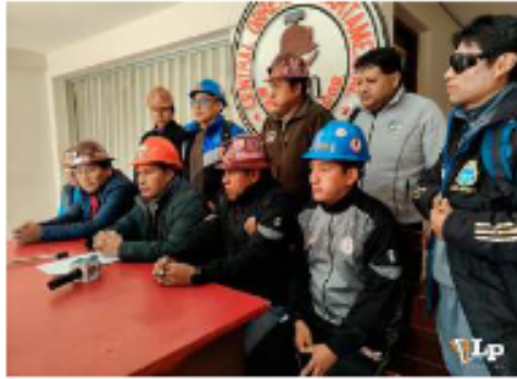
La dirigencia de la COD confirmó la medida de presión

Asimismo, hizo un llamado a los diferentes sindicatos y federaciones afiliadas a la COD para cumplir con las medidas de presión. "Justamente de manera orgánica los diferentes sindicatos y federaciones afiliadas a la Central Obrera Departamental tienen que cumplir", dijo.