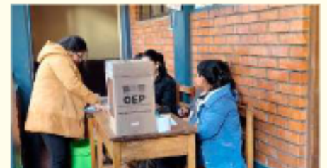
Las elecciones subnacionales se realizaron el 22 de marzo y el 19 de abril en su primera y segunda vuelta

La vicepresidente del TED añadió: "Hemos sido uno de los primeros departamentos en emitir los resultados. Ese va a ser un pri-