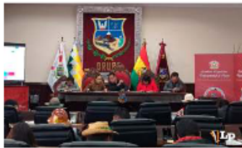
La nueva conformación de la ALDO obliga a llegar a acuerdos y ya no existen mayorías aplastantes

En la primera sesión ordinaria, celebrada el jueves 7 de mayo, se evidenció esta necesidad. La formación de las comisiones de trabajo tomó casi tres horas, cuando se esperaba que se resolviera en media hora o 45 minutos. Sin embargo, este proceso se considera una oportu-