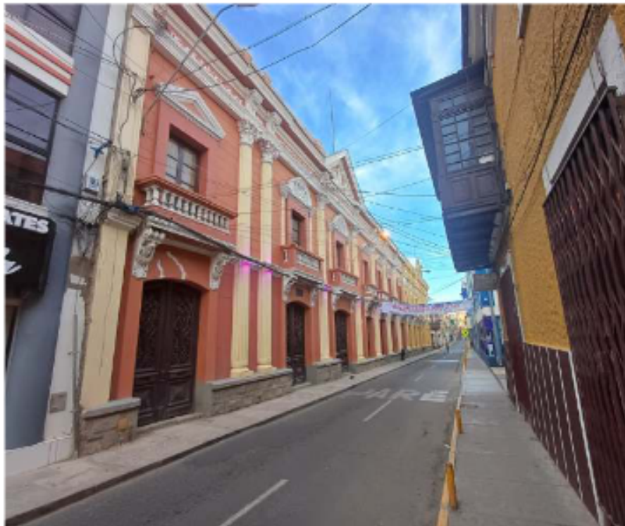
Fachada del Museo Simón I. Patiño