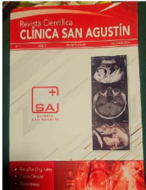
Clínica San Agustín presenta su primera revista científica