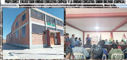
CONST. SALÓN DE REUNIONES MUNICIPIO DE COIPASA