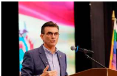
El presidente Rodrigo Paz en la Cumbre Nacional de este sábado en la ciudad de Cochabamba

El presidente reafirmó su política de "tolerancia cero" hacia la corrupción, asegurando que bajo su gestión los corruptos nacionales son enviados directamente a prisión. Esta postura ha generado fricciones con figuras de la administración anterior. En varias ocasiones, Paz ha mencionado el caso del expresidente Luis Arce, quien se encuentra recluido por irregularidades relacionadas con el Fondo Indígena.