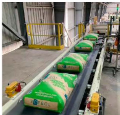
La producción disminuyó en la planta cementera estatal

El diputado subrayó que es fundamental realizar un estudio social, técnico y económico para garantizar la sostenibilidad de Ecebol a largo plazo. También anunció planes para solicitar una inspección pública donde se invite a periodistas a conocer la realidad operativa de la empresa: "Vamos a pedir que se haga una inspección