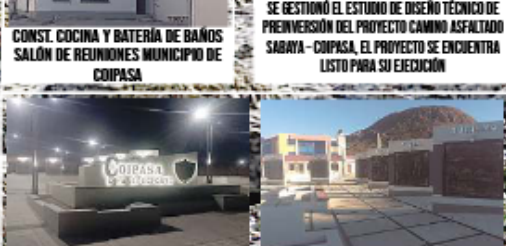
CONST. COCINA Y BATERIA DE BAÑOS SALÓN DE REUNIONES MUNICIPIO DE COIPASA