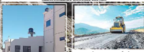
SE GESTIONÓ EL ESTUDIO DE DISEÑO TÉCNICO DE PREINVERSIÓN DEL PROYECTO CAMINO ASFALTADO SABAYA - COIPASA, EL PROYECTO SE ENCUENTRA LISTO PARA SU EJECUCIÓN