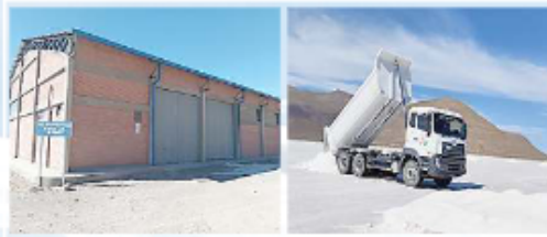
PROYECTO: IMPLEMENTACIÓN CENTRO DE ACOPIO DE SAL MUNICIPIO DE COIPASA