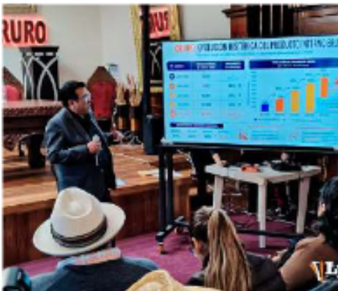
La Secretaría de Planificación del Desarrollo presentó un diagnóstico.