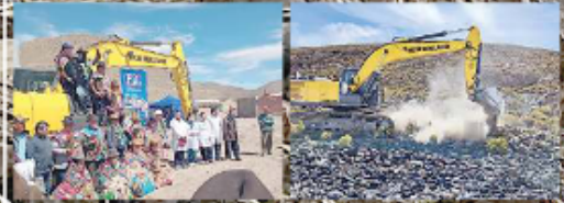
PROY. FORTALECIMIENTO AL SECTOR GANADERO PARA LA CONSTRUCCIÓN DE VIGNAS PARA LAS COMUNIDADES DEL MUNICIPIO DE COIPASA DEL DEPARTAMENTO DE ORURO