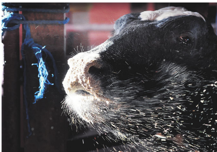
La crisis que obliga a muchos ganaderos lecheros a cerrar sus establos e incluso sacrificar a los animales