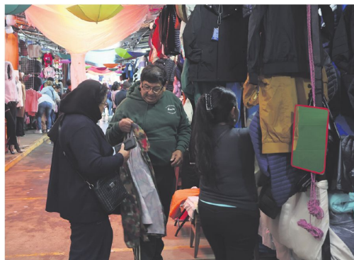
Hay variedad de prendas y precios en las ferias de ropa de invierno

Los precios varían según el modelo y la talla. Las chompas básicas pueden encontrarse desde Bs 80 y Bs 90, mientras que las chamarras oscilan entre Bs 140