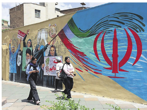
Un mural en contra de EE.UU. e Israel en una calle de la capital iraní

"Podríamos retomar Proyecto Libertad si las cosas no salen", dijo Trump, quien añadió que el