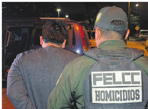
Un sospechoso del crimen del juez fue enviado a Chonchocoro

En la audiencia cautelar se declaró probable autor del crimen a uno de los cuatro imputados, además de dictar su detención por 120 días mientras continúan las investigaciones por el asesinato ocurrido en Santa Cruz y por el proceso relacionado con narco-