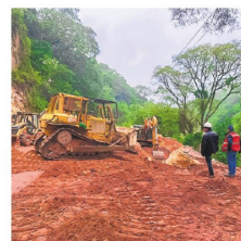
Se reabrió la ruta a los valles