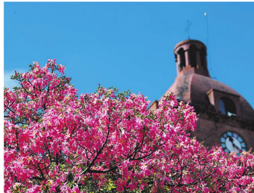
Quiénes visitan la plaza principal y la catedral disfrutan esta vista