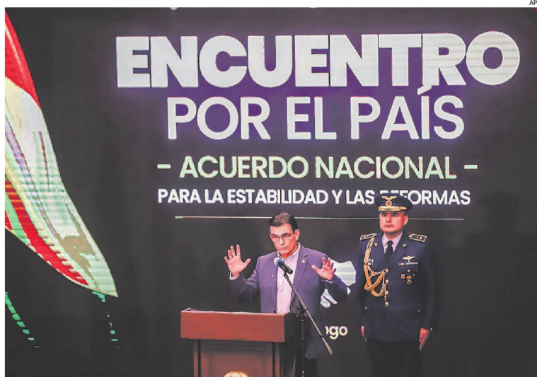
El presidente Rodrigo Paz durante su intervención en el encuentro por el país en busca de un acuerdo

El mandatario también anunció la creación de una Comisión