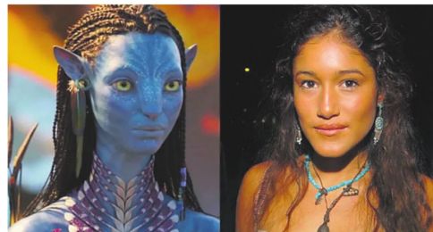
El personaje Neytiri y la actriz peruano-estadounidense Q'orianka.

Kilcher conoció a Cameron en un evento en 2009, poco después del estreno de 'Avatar', y éste la invitó a visitar su oficina. Ese día el director no estaba pero su equipo le obsequió una copia que Cameron hizo acompañado por una nota: "Tu belleza fue mi inspiración para Neytiri".