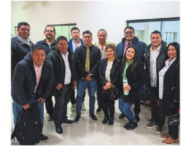
Los nuevos subalcaldes.

Las nuevas autoridades ya asumieron funciones y su primera tarea será un diagnóstico de situación.