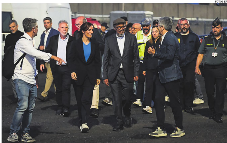
La ministra de Sanidad Mónica García y el director de la OMS en el puerto antes de la llegada del crucero

Seis casos confirmados La Organización Mundial de la Salud (OMS) elevó ayer a seis los casos confirmados de hantavirus