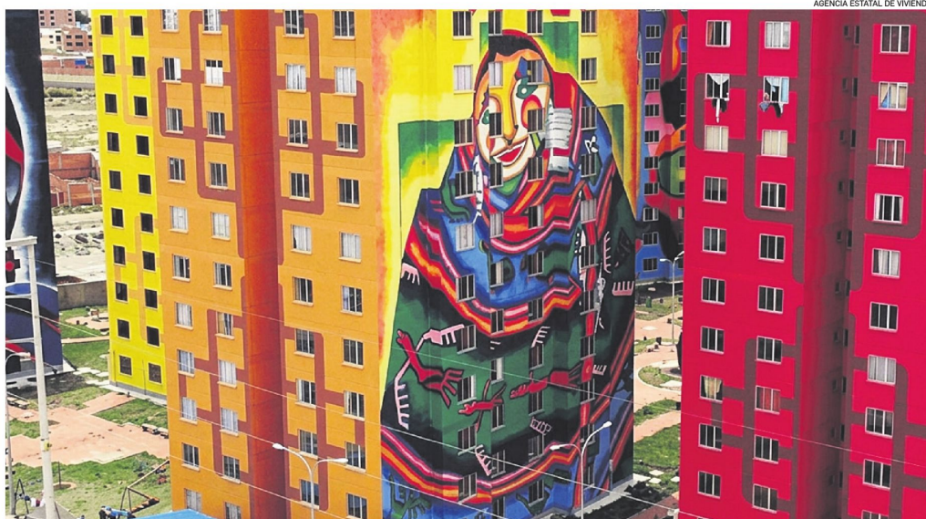
En El Alto (La Paz), el condominio Wiphala vuelve a ser ofertado por la Agencia Estatal de Vivienda

En Cochabamba, Urbanización Villa Tunari, Condominio Pirwa, en Tolata, Condominio Tambo-