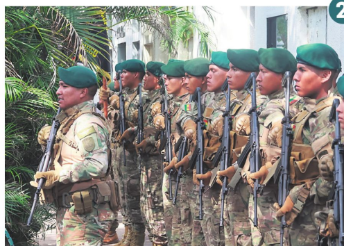
1. Homenaje en el mausoleo militar