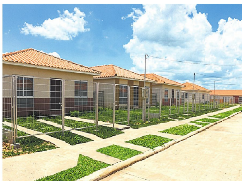
Relanzaron la venta de la urbanización Papa Francisco, en Santa Cruz

rada, en Beni, Proyectos habitacionales en Trinidad.