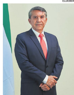
Santistevan pretende poner en debate el pago de prediarios