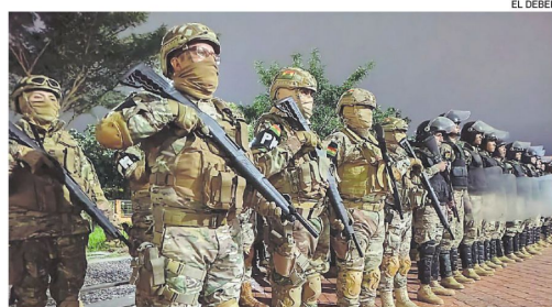
Los militares refuerzan la labor policial de patrullar la ciudad