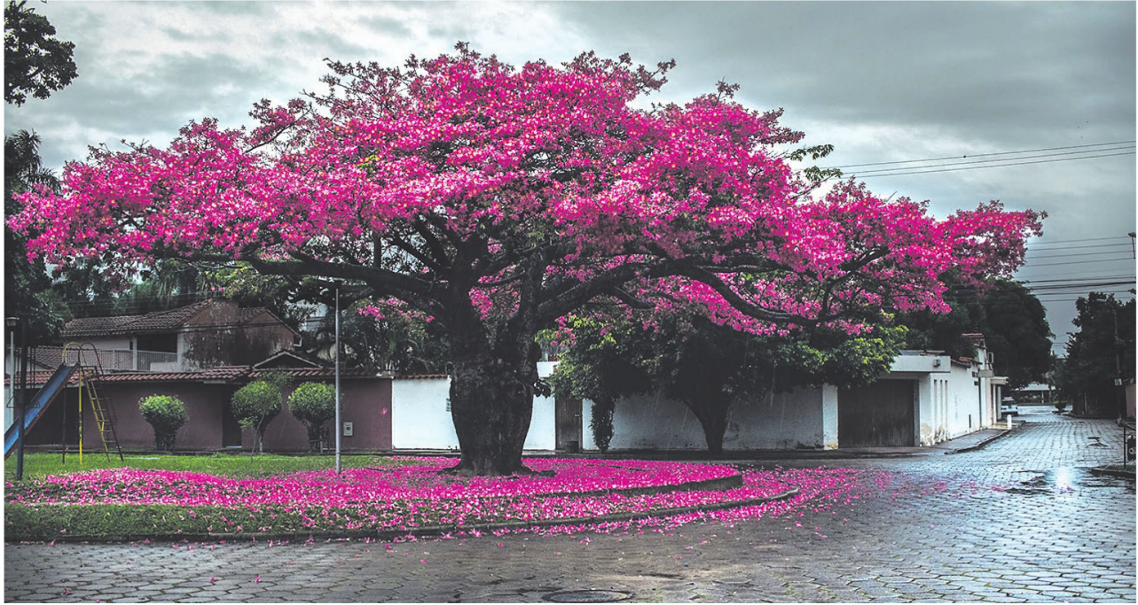
Esta es una de las postales que regala la naturaleza en estos días. Las calles y avenidas de Santa Cruz de la Sierra muestran el esplendor de esta especie nativa