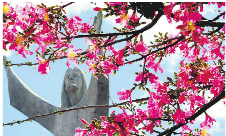
Es considerado el rey del otoño porque florece en esta época. Sus bellas flores se lucen junto a El Cristo

Embellecen las calles y avenidas. Son parte de la identidad de la ciudad