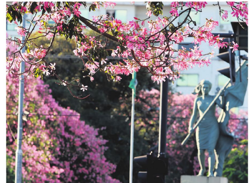
El rosado (Ceiba speciosa) es la especie más común en la ciudad