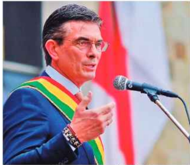
PERFIL. Paz cumplió ayer 180 días en el mando del país.

La presión social sobre el Gobierno del presidente Rodrigo Paz se intensificó drásticamente. Un bloque de al menos siete sectores sociales y económicos ha activado paros, bloqueos de carreteras y protestas callejeras por la crisis económica, la escasez y mala calidad de hidrocarburos y los conflictos laborales.