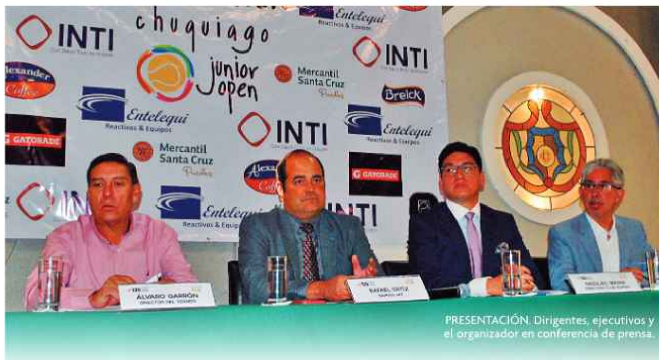
PRESENTACIÓN. Dirigentes, ejecutivos y el organizador en conferencia de prensa.

COMIENZA EL TORNEO INTERNACIONAL DE ESTE DEPORTE EN LA PAZ