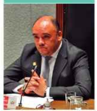
AUTORIDAD. Gustavo Ávila, presidente del TSE.

liados a la Federación Túpac Katari bloquea las rutas hacia Copacabana, Oruro y Laja, mientras los interculturales cortan el paso en el norte paceño y Caranavi. Además, los pueblos indígenas de la Amazonia instalaron una vigilia frente a la Vicepresidencia tras una caminata de 27 días. Las tres organizaciones exigen la abrogación definitiva de la Ley 1720 de reconversión de tierras. Finalmente, el transporte interprovincial desconoció el pacto entre el Ejecutivo y la confederación nacional de choferes, por lo que persiste en sus medidas y paro indefinido.