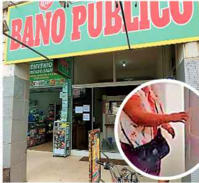
CÁMARAS. Minutos antes del hallazgo de la víctima, esta mujer utilizó el baño.

“Me agarró la mano”. Con esa expresión cargada de asombro y dolor, una trabajadora de limpieza del Mercado Agrícola del municipio de Yapacaní, Santa Cruz, resumió el momento en que el horror se transformó, por un instante, en contacto humano. Era un feto prematuro, de unos seis meses que fue dejado en un inodoro.