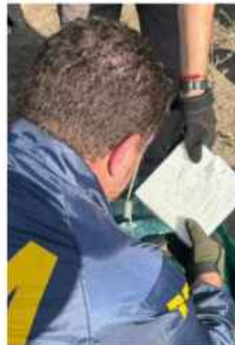
COCAÍNA. Policías argentinos, en el operativo en Santa Fe.

El operativo, bautizado como “Aterrizaje forzoso”, fue una misión que incluyó a francotiradores, drones y vigilancia con cámaras ocultas en un establecimiento rural.