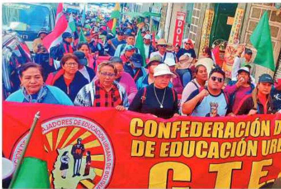
PROTESTAS. Los maestros toman las calles en protestas y en apoyo a los fabriles.

El primero busca la defensa de la educación fiscal,