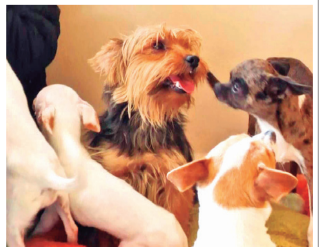
Las mascotas de raza que fueron rescatadas.

de solicitudes iniciará este viernes 8 de mayo y concluirá el 12 de mayo. Prudencio aclaró que la entrega de documentos no garantiza la adopción, debido a que Zoonosis realizará un monitoreo y evaluación exhaustiva de cada caso. Los postulantes deberán residir en el municipio de Cercado.