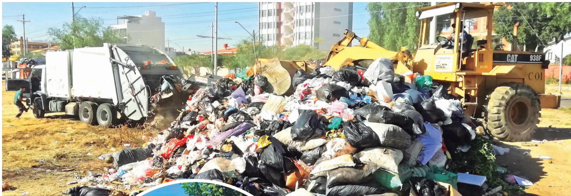
Levantan la basura acumulada en los contenedores. CARLOS LÓPEZ