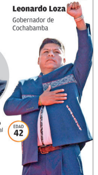
Leonardo Loza Gobernador de Cochabamba