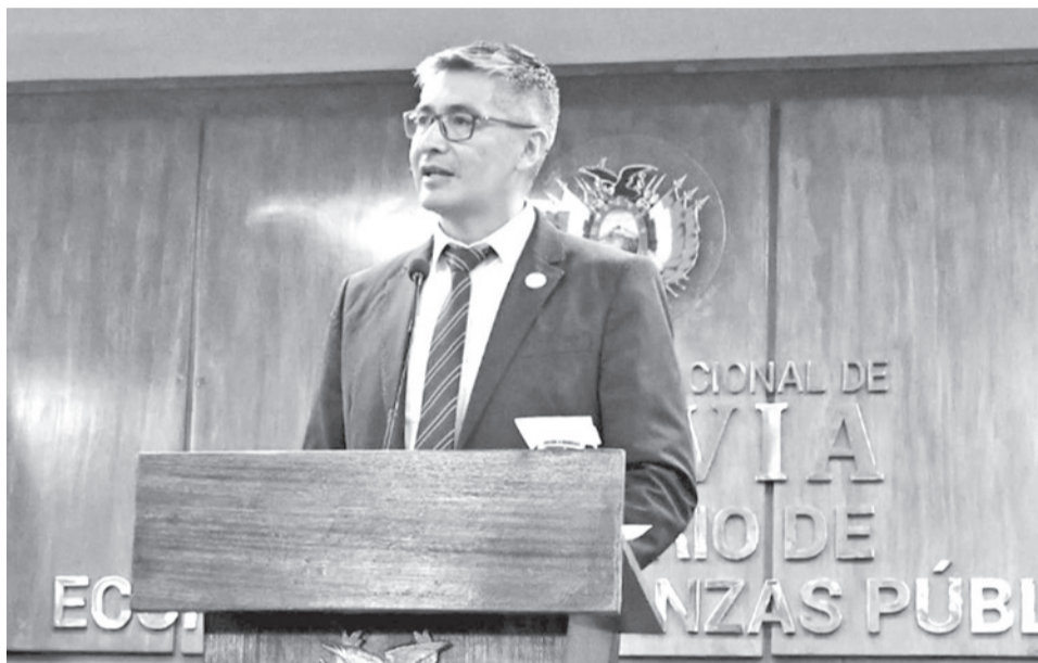
El ministro de Economía, Gabriel Espinoza.

Espinoza resaltó que se recibieron demandas de compra por cinco veces el valor de lo ofertado y resaltó el interés de los inversionistas por los bonos bolivianos, cuando considera que hace seis meses era prácticamente imposible para el país volver a ingresar a los mercados internacionales. Afirmó que la tasa de interés ofrecida por Bolivia es similar a la que emiten otros países con mejor calificación de riesgo, como Ecuador, Argentina o México. El Ministro resaltó que hubo demanda de 166 inversores calificados. Contextualizó que antes se “maquillaba” la colocación de bonos obligando a entidades como la Gestora a tomarlos.