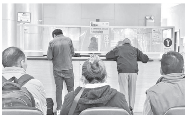
La atención para el resarcimiento de daños. YPFB

Los pagos se realizaron de dos formas: mediante depósitos directos a las cuentas bancarias de los interesados y de manera presencial en las ventanillas del Banco Unión a nivel nacional, según un reporte de la empresa estatal.