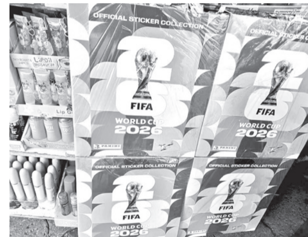
Álbum de este año, de Panini. LOS TIEMPOS

Posteriormente, señalaron que “se ofrecerán a los aficionados nuevos productos, como el programa de parches de camisetas, que incluirá los de jugadores debutantes. Estos parches se integrarán en cartas coleccionables a partir de 2031. Fanatics Collectibles se encargará del diseño y desarrollo de todos los productos, que fabricará la marca Topps”. La entrada de esta empresa supondrá la llegada de nuevos formatos, entre ellos las tarjetas autografiadas Debut Patch. Esta modalidad, consolidada en la NFL, NBA y MLB, implica que un jugador llevará un parche en su camiseta.