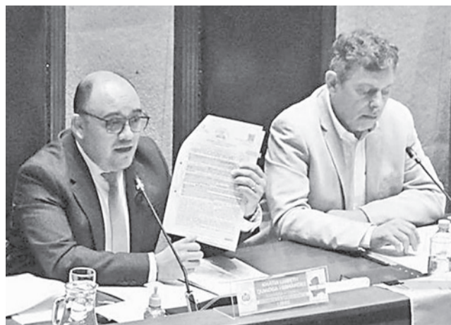
El presidente del TSE, Gustavo Ávila.

La cancelación de personerías se basa en la Ley 1096, de Organizaciones Políticas, que establece la pérdida del registro para partidos y agru-