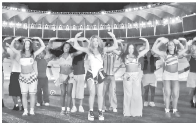
La artista barranquillera Shakira.

El anuncio fue realizado por la propia cantante a través de un video compartido en sus redes sociales. Las imágenes fueron grabadas en el estadio Maracanã de Río