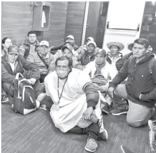
Vigilia de campesinos e indígenas que piden abrogación de la Ley 1720, ayer en la ciudad de La Paz. CENDA

“El Gobierno no se entien- de ni ellos mismos; es un nuevo presidente, pero vienen las mismas mañas del MAS. Abrogar la ley 1720 es retroceder 20 años, es querer tener sometido al productor a la voluntad del Gobierno central”, comentó Cochamanidis.