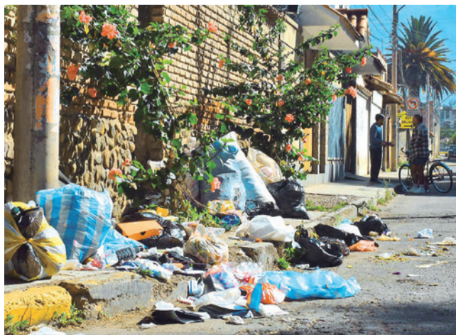
Microbasurales por la suspensión del servicio.

Conflicto. Albarrancho levantó el bloqueo para el paso de los carros de EMSA. El Ministerio de Defensa pidió un informe de la empresa Cinva a la Gobernación y Colcapirhua marcha este viernes