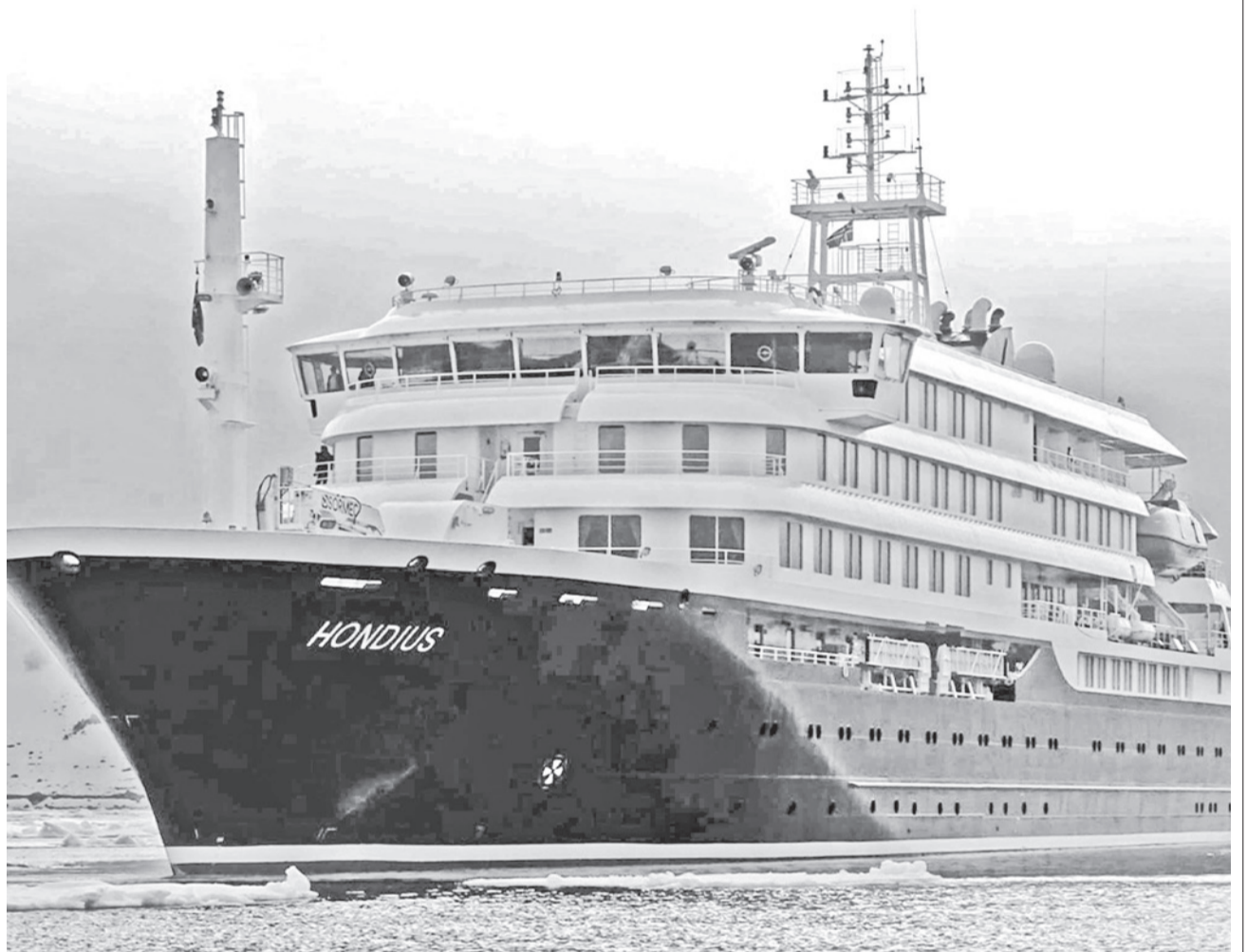
El crucero HM Hondius transporta hasta 170 pasajeros.

Preocupación. La Organización Mundial de la Salud investiga un viaje ornitológico por el Cono Sur como posible origen del brote