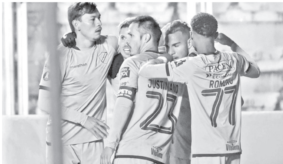
Los jugadores del club Bolívar. MARKA REGISTRADA

sumar en calidad de visitante, es un punto que nos permitirá pelear hasta el último partido. Siempre hay que soñar y corregir errores para salir adelante”, añadió el entrenador.