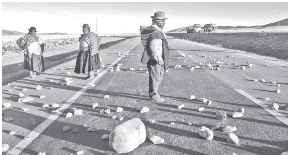
Bloqueo de campesinos en rutas provinciales del departamento de La Paz.