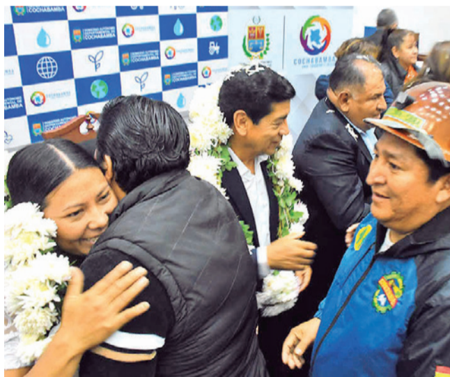
Loza pidió trabajo a su equipo.

En el marco de las medidas de austeridad, Loza informó la supresión de dos secretarías: Salud y Finanzas, con el objetivo