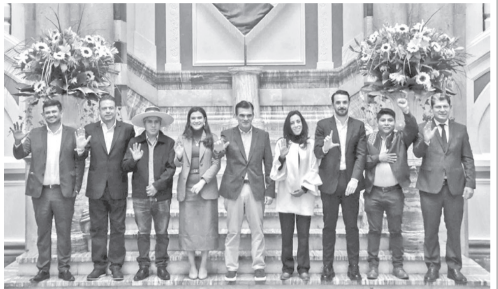
Reunión del presidente, Rodrigo Paz, con gobernadores electos, en abril.

En tanto el analista político, Marcelo Arequipa, sugirió al Gobierno postergar la reunión convocada para el fin de semana, para definir una agenda nacional, para resolver los conflictos que están alrededor, como las amenazas de iniciar protestas de los empresarios de Santa Cruz, además de los protagonizados por las organizaciones sociales y, a partir de ahí, recién convocar a ese encuentro nacional.