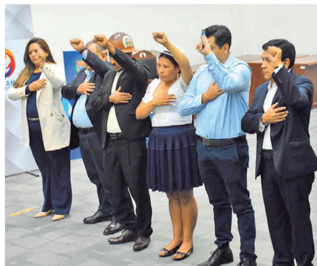
La posesión de los secretarios.