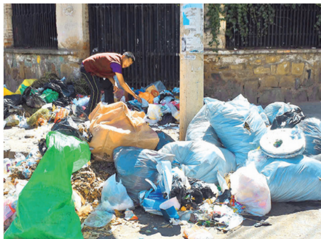
Basura arrojada en plena vía pública. DANIEL JAMES

Gobernación en tres ocasiones, pero fue rechazada; situación que calificó como “política”.