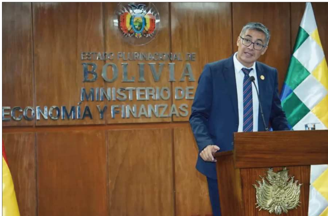
INFORME. El ministro Gabriel Espinoza brinda una conferencia de prensa en el Ministerio de Economía.