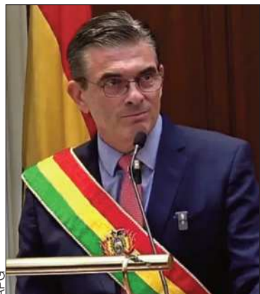
El presidente Rodrigo Paz

La autoridad acusa a los movilizados de buscar la desestabilización