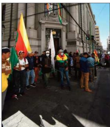
Marcha indígena en La Paz.

Exgobernador afirmó que norma garantiza derechos de pequeños propietarios