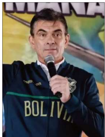
El presidente Rodrigo Paz.

El presidente Rodrigo Paz convocó a un gran encuentro nacional