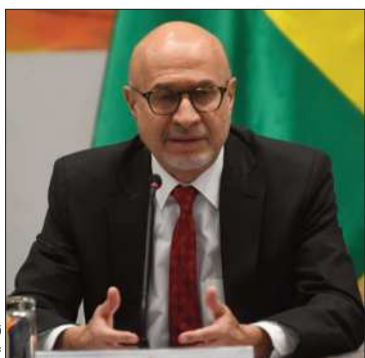
El ministro Lupo en conferencia.

El Gobierno busca ofrecer un marco de seguridad jurídica