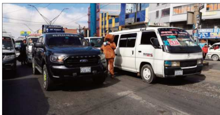
TARIFAS. Los transportistas piden incrementar las tarifas.