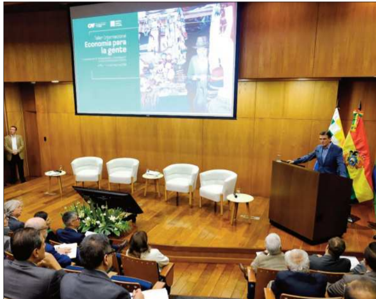
ENCUENTRO. El presidente Rodrigo Paz participa del foro de la CAF.

ridad del Gobierno es responder a los desafíos estructurales. Todo mediante el establecimiento de reglas claras que brinden certidumbre tanto a los mercados internacionales como a los sectores productivos locales.