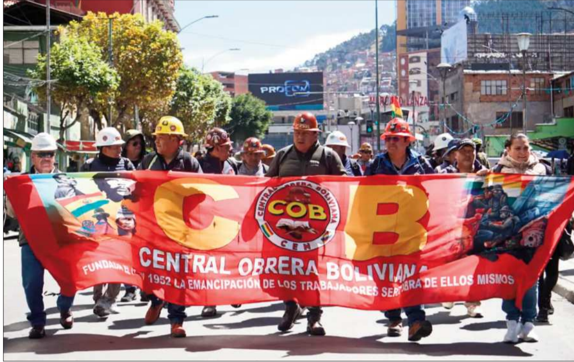
PROTESTA. La COB y sectores afiliados protestan en la sede de gobierno desde hace varios días.