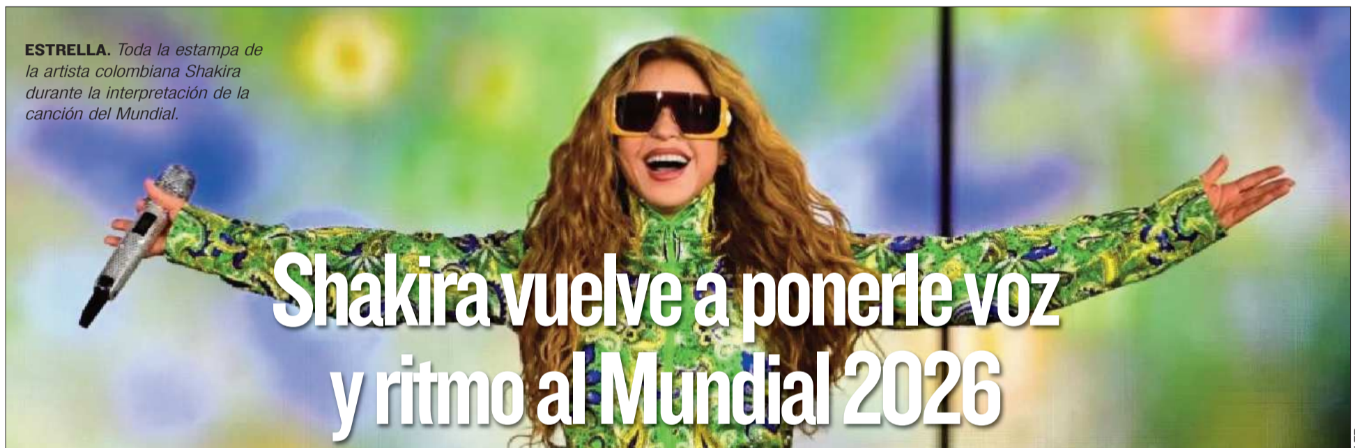
ESTRELLA. Toda la estampa de la artista colombiana Shakira durante la interpretación de la canción del Mundial.

El reclamo del jugador se suma a las críticas recurrentes sobre la infraestructura de algunos estadios utilizados cuando Bolívar actúan en condición de visitante.