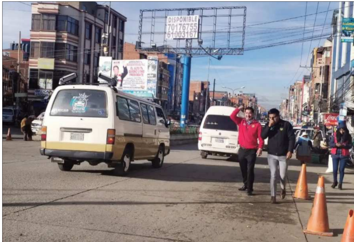
CONTROLES. Los funcionarios ediles analizarán los controles que se aplicarán en El Alto.

Uno de los puntos centrales será la eliminación del “trameaje”, práctica que persiste en la urbe y afecta directamente la economía de los usuarios.