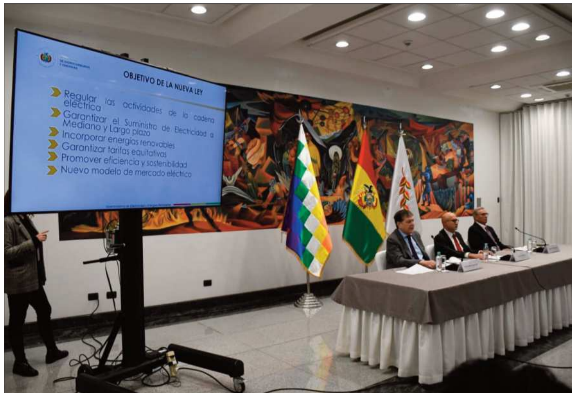
ACTO. La presentación de la Ley de Electricidad en la Casa Grande del Pueblo, en La Paz.