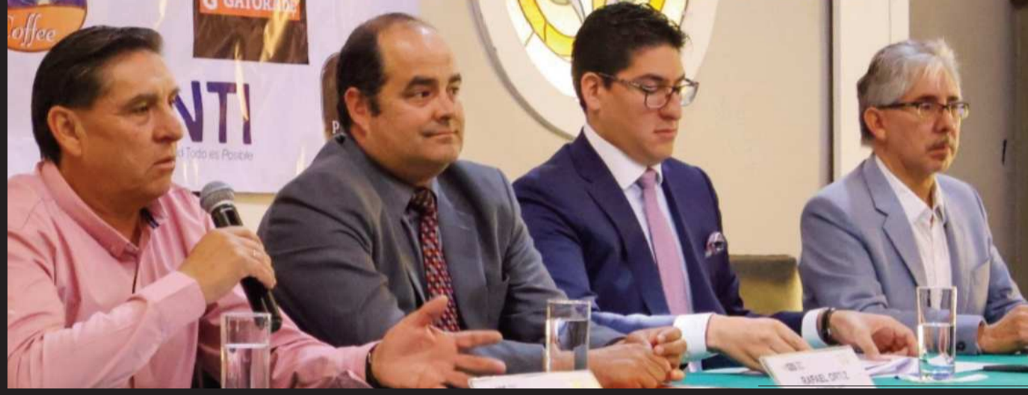
CHUQUIAGO JUNIOR OPEN

El fin de semana inicia el torneo en La Paz. El ingreso es gratuito durante todo el certamen