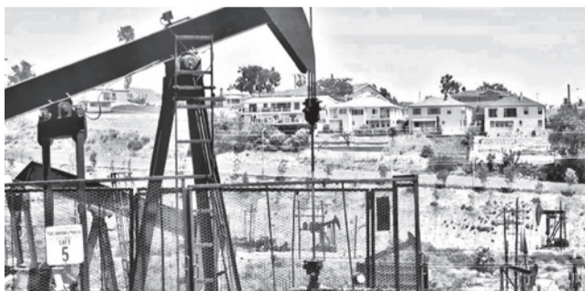
El campo petrolero de Inglewood es el mayor campo petrolero urbano de EE.UU.

Economía. Un nuevo impulso a las gestiones diplomáticas han llevado al crudo por debajo de los 100 dólares por barril