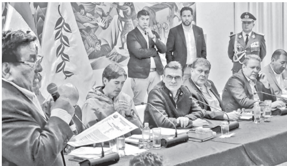
La reunión de los ministros con el transporte nacional, ayer.