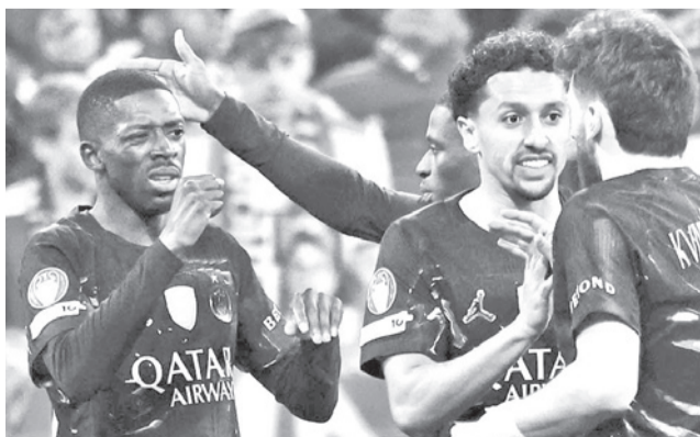
El festejo del PSG por la clasificación.

En el encuentro de ida, PSG ganó por 5-4 en París y con el empate en la revancha, el conjunto parisino obtuvo el pase a la final, por lo que sigue en la defensa de su título conquistado el año pasado.