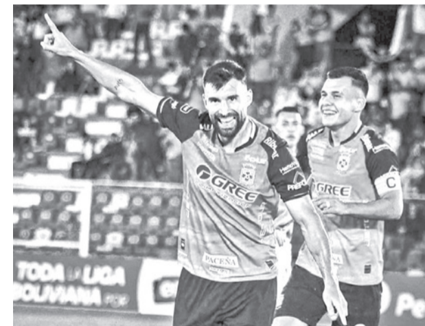
Un festejo de los jugadores de Blooming.

asco da Gama evitó la catástrofe y remontó para llevarse un 1-2 sobre Audax Italiano, una victoria brasileña como visitante que apretó todavía más el Grupo G.