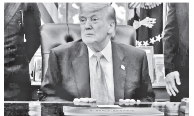
Donald Trump, presidente de EEUU.

Las autoridades de México, incluida su presidenta, Claudia Sheinbaum, han reivindicado su soberanía e