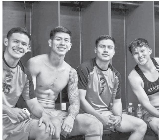
Jugadores en el camerino luego de empate.