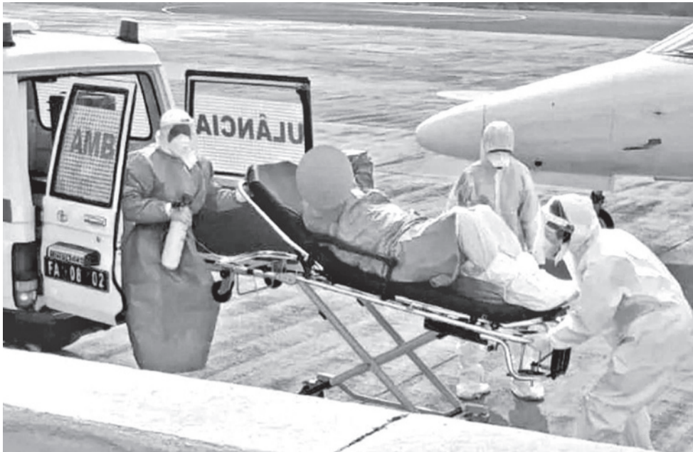
Rescate de una de las personas contagiadas en el crucero. OMS