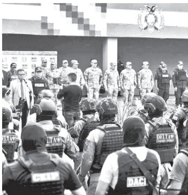
Autoridades nacionales ayer en Santa Cruz.

“Santa Cruz es el epicentro donde se están generando crímenes con mayor constancia y crueldad”, dijo el ministro