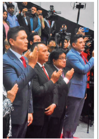
La posesión de nuevas autoridades en la Alcaldía, ayer. JOSE ROCHA