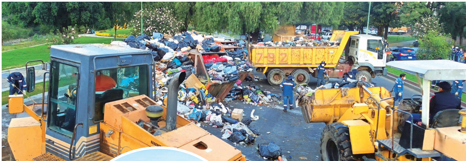
Retiran la basura acumulada en la Av. Humbolt. DANIEL JAMES