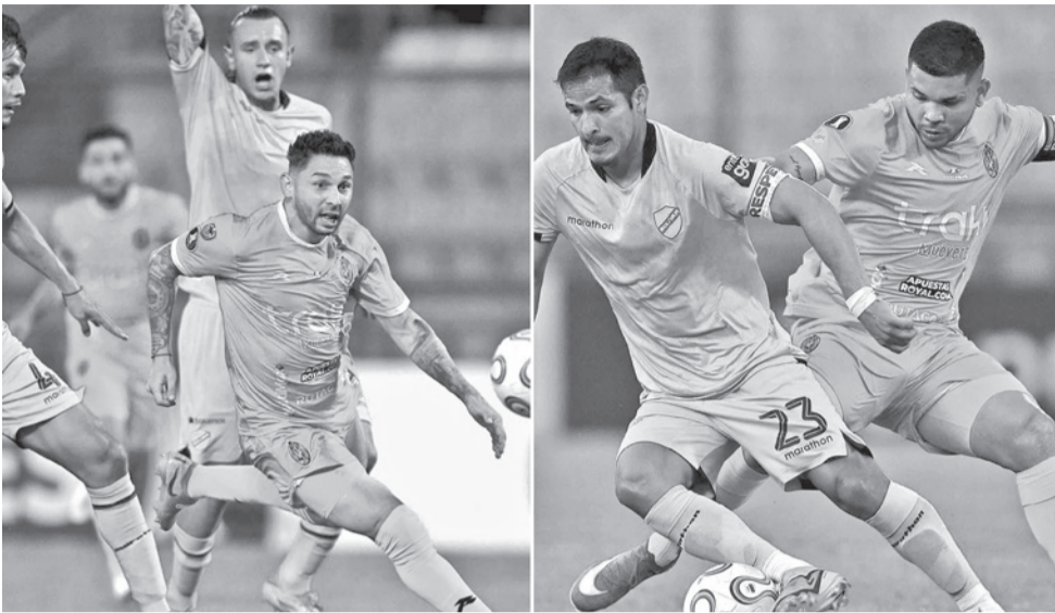
Incidentes del partido Bolívar y La Guaira, en Venezuela.