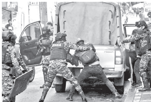
La Policía desaloja a trabajadores del Ministerio de Trabajo, ayer en La Paz.

En las imágenes se puede observar cómo los uniformados subieron a los movilizados a las dos camionetas de