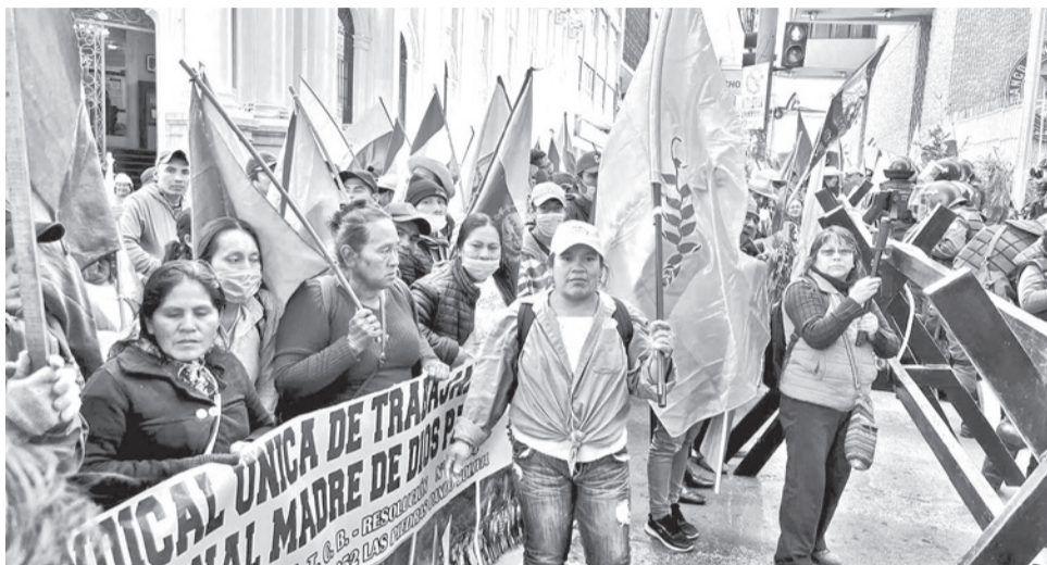
Marcha de campesinos e indígenas de Pando y Beni en la ciudad de La Paz.