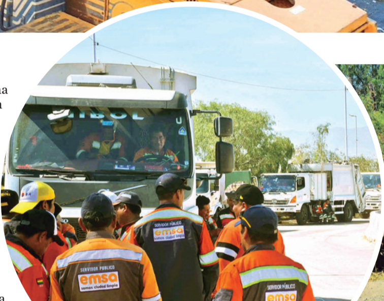
Carros con basura bloqueados en Albarrancho. D.J.

La Alcaldía de Cochabamba informó que ha convoca-