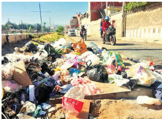
Proliferan los basurales en los barrios. CARLOS LÓPEZ

Dato. La acumulación de basura aumenta los riesgos sanitarios en Cochabamba, en medio de conflictos por su traslado y esfuerzos de las autoridades municipales para instalar el diálogo con los vecinos