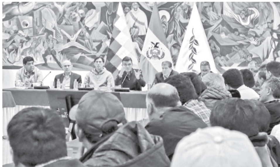
Los delegados de la COB y el Gobierno, ayer en la Casa Grande del Pueblo.

Los maestros se movilizan en busca de un incremento salarial a su sector, entre otros temas. El pliego de la COB exige el aumento del 20% al salario; sin embargo, el Gobierno descartó el incremento con el argumento de que el salario mínimo ya se subió en un 20% en enero pasado.