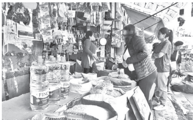
La oferta de productos en los mercados. DANIEL JAMES

En términos interanuales, la variación a 12 meses alcanzó 14,18%, mientras que el comportamiento mensual evidencia una moderación en el ritmo de va-