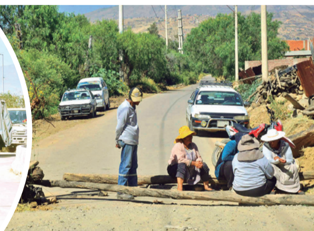
Vecinos bloquean en Albarrancho. DANIEL JAMES