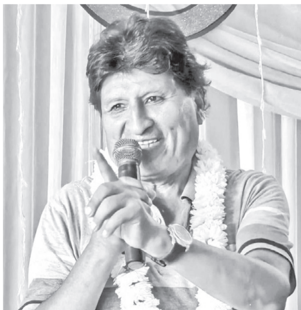
El expresidente del Estado, Evo Morales. RRSS

“No se puede asistir porque no conocemos de qué se trata. No se ha notificado al hermano Evo Morales, cumpliendo el procedimiento de una notificación personal. Debía notificarse de forma una personal la acusación y luego la apertura