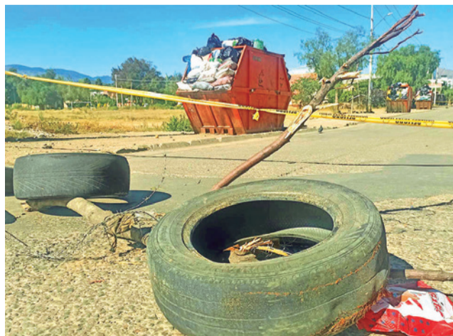
Cierran un contenedor en la Av. Sajama. CARLOS LÓPEZ

do al diálogo a los vecinos y representantes de distintos sectores con el objetivo de buscar consensos que permitan encarar la crisis de los residuos sólidos de manera coordinada. Mientras tanto, en distintos puntos de la ciudad, los vecinos denuncian contenedores colapsados, malos olores y proliferación de insectos y roedores, lo que incrementa los riesgos para la salud.