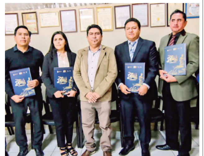
La posesión de nueve secretarios en Sacaba. GAMS

Sacaba es el segundo municipio más poblado de Cochabamba con unos 200 mil habitantes.