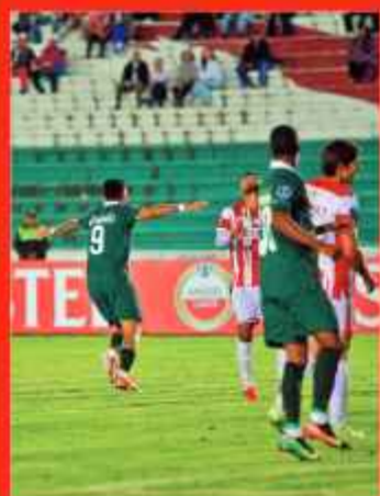
FESTEJO. Jugadores de Caracas FC celebran la victoria.