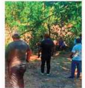
CRIMEN. Pobladores en el lugar del hecho, ayer.

Pese a las explicaciones, Libre y algunos asambleístas hasta el cierre de edición de este medio escrito, continuaba la sesión. La tendencia era favorable a la autoridad, aunque también habían votos de censura.