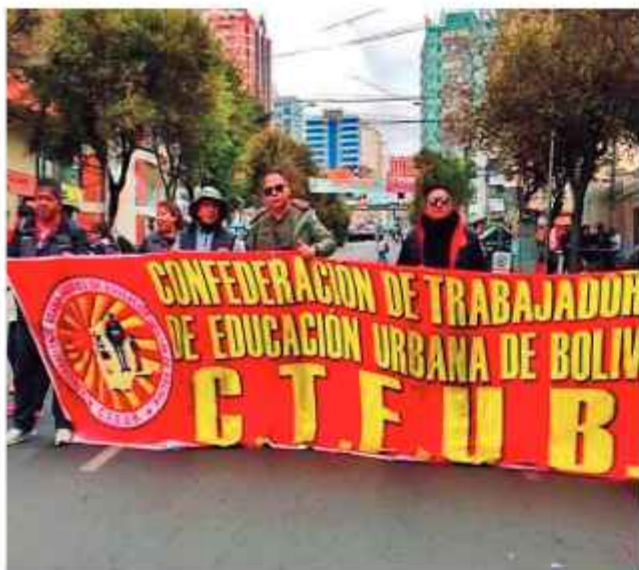
MOVILIZACIÓN. El magisterio urbano marcha en La Paz.

La tensión en el sector educativo nacional escaló a un nuevo nivel crítico. Dirigentes de la Confederación de Trabajadores de la Educación Urbana de Bolivia anunciaron la radicalización de sus medidas de presión frente a lo que consideran un silencio administrativo del Ejecutivo.