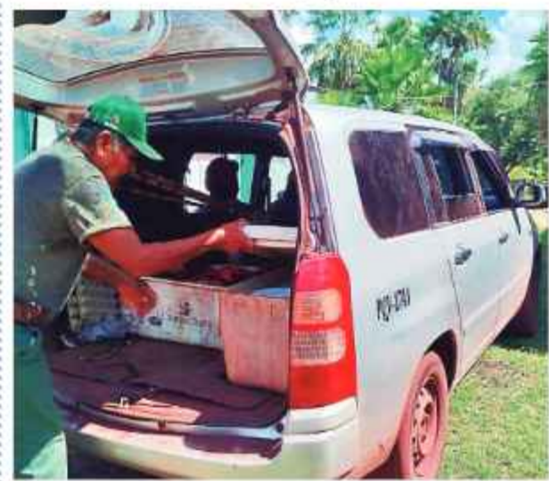
EVIDENCIA. La carne de ciervo, guardada en dos cajas.

El Sernap advirtió de que los controles serán más estrictos para sancionar todo acto que atente contra el patrimonio natural del país y animales en peligro de extinción.