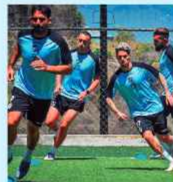
PRÁCTICA. Jugadores del celeste en su entrenamiento.

El próximo martes 19, Always recibirá la visita de Mirassol, de Brasil, encuentro que se jugará desde las 20:00, mientras que el martes 26 visitará a Liga Deportiva Universitaria de Quito, Ecuador, choque que se disputará desde las 18:00 (hora de Bolivia).