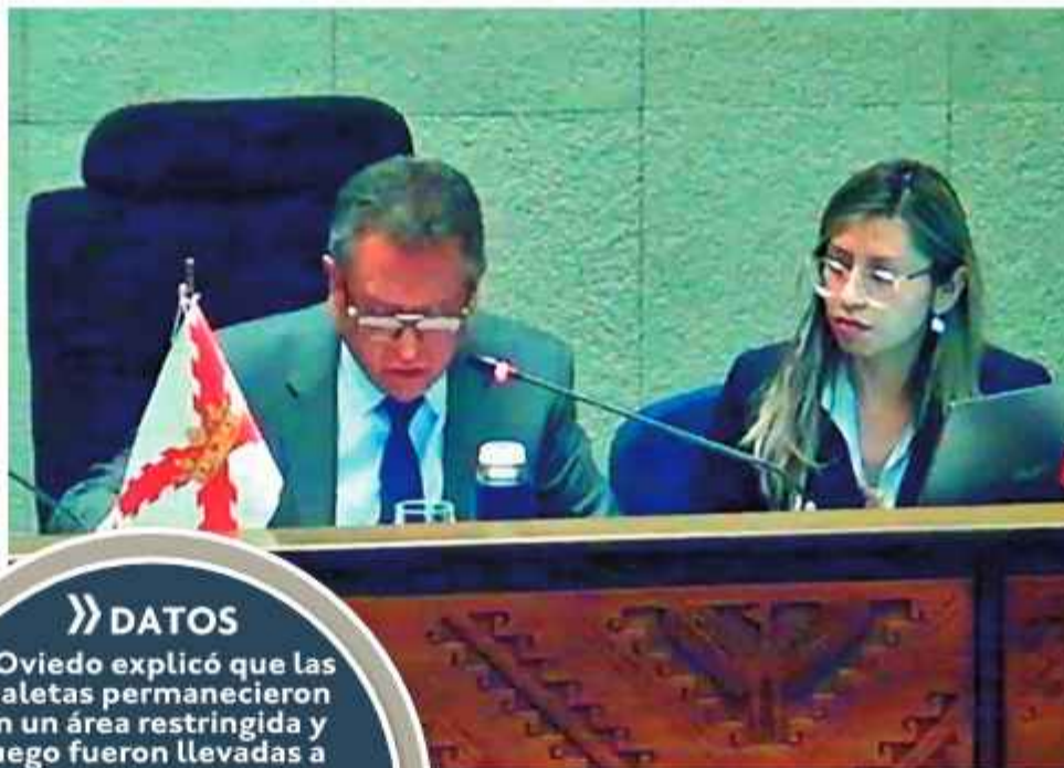
AUTORIDAD. El ministro de Gobierno, Marco Oviedo en su interpelación en la Asamblea Legislativa, ayer.

La sesión contó con la presencia de bancadas Libre y representantes del oficialismo y oposición. Otros miembros del gabinete,