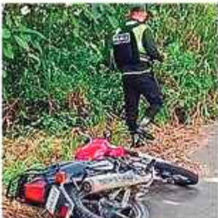
ASESINATO. La moto de la víctima. Sucedió ayer.

La Policía también activó el "Plan Z" para ubicar al o los responsables de este crimen.