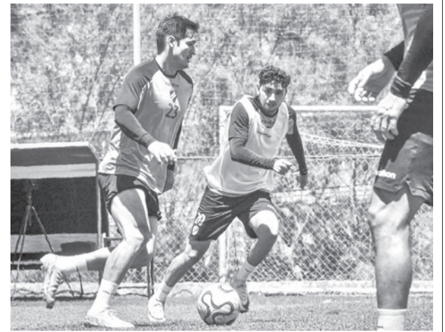
Un entrenamiento de Bolívar.