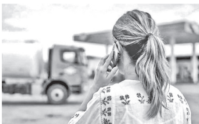
Habilitan números de información. YPFB

Los números habilitados son los siguientes: 63268800 – Distrito Comercial La Paz, 67203890 – Distrito Comercial Oruro, 71727913 – Distrito Comercial Centro, 68773855 – Distrito Comer-