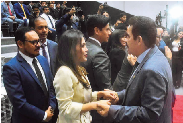
Los nuevos secretarios.