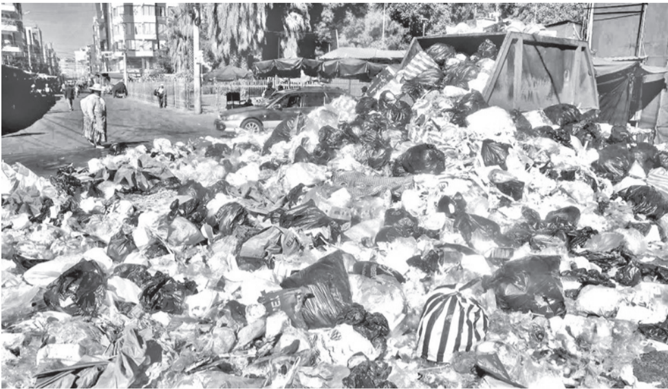
La gran cantidad de basura que se acumula en la ciudad. JOSE ROCHA