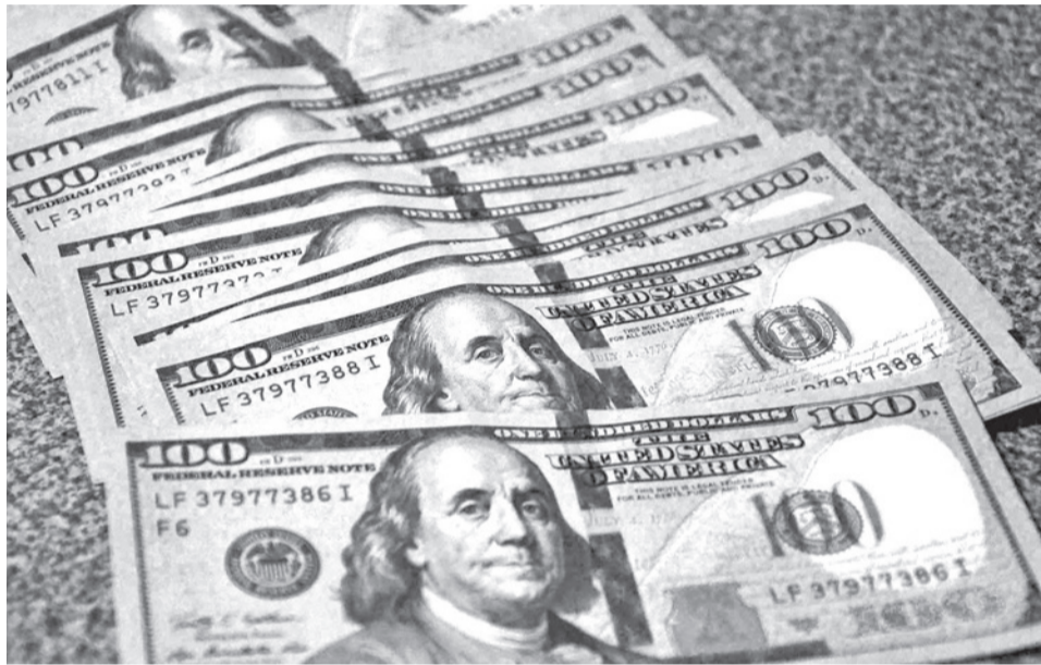
La oferta de dólares que se maneja por el tipo de cambio oficial y paralelo. CARLOS LÓPEZ

Desde su puesta en vigencia, en diciembre de 2025, las cifras del valor referencial del dólar están por encima de la cotización oficial que publica el BCB, que es de Bs 6,86