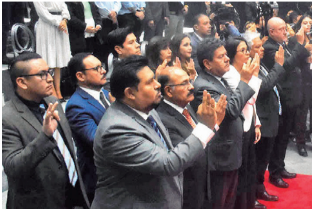
La posesión de secretarios.

Indicó que el gobierno municipal tiene tres pilares fundamentales: desarrollo humano, urbano y desarrollo económico y por ello, la creación de esta última secretaría para la cual se suprimieron cuatro direcciones y cinco jefaturas.