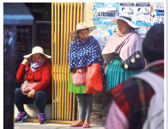
La gente se protege del frío con ropa abrigada. JOSE ROCHA

bia humana en un paciente de 58 años, que falleció con un cuadro aparente de encefalopatía con un antecedente de contacto con un animal mordedor. Se enviaron las muestras a laboratorio y el primer reporte es negativo. Sin embargo, en caso continua en investigación y se espera el reporte complementario.