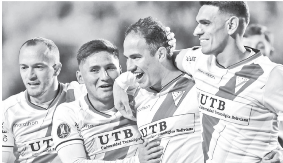
El festejo de Always Ready por su triunfo ante Lanús, en El Alto.