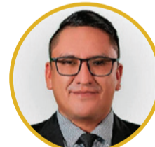
Secretaría de Gobernabilidad y Gestión Integral de Protección al Ciudadano: Walter Reynaldo Flores Uriarte (designado)