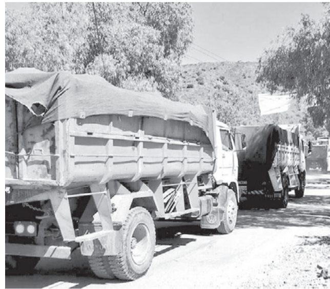
Alcaldía inicia la industrialización en Cotapachi. GAMC