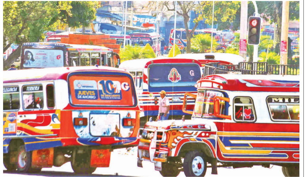
Bloqueo de los transportistas en las calles de la ciudad de Cochabamba. JOSE ROCHA

Gómez agradeció a los miembros de su Confederación por lo que calificó al paro de ayer como exitoso. La dirigencia de los choferes señaló que el sector exige que se garantice el abastecimiento del combustible, particularmente del diésel; la calidad de la gasolina; el arreglo de las carreteras; el resarcimiento inmediato por los daños ocasionados a los vehículos por los carburantes "desestabilizados"; y la reconversión de sus motorizados para que funcionen a gas.