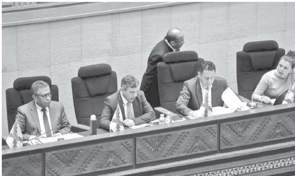
El ministro de Gobierno, Marco Antonio Oviedo, ayer en la Asamblea Legislativa.

Ante el pleno, Oviedo dijo que están procesados cinco exfuncionarios de la Aduana, una exdiputada y un exjuez. Además, señaló que por este caso se abrieron cuatro líneas de investigación, por decisión de la Fiscalía.