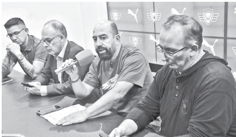
Wilstermann continuará en la Primera A tras fallo final del TAS. DANIEL JAMES

Primero el Tribunal de Disciplina (TD) determinó la quita de 33 puntos a Aurora para el campeonato 2025 de la División Profesional, fallo que fue ratificado por el Tribunal Superior de Apelaciones (TSA), pero Aurora apeló ante el TAS, que es la máxima entidad de justicia deportiva en el mundo.