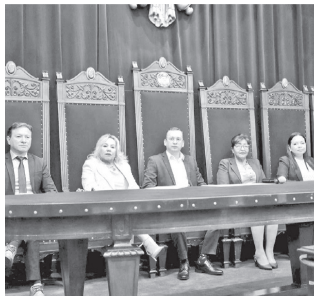
Los integrantes del Tribunal Supremo de Justicia. TSJ