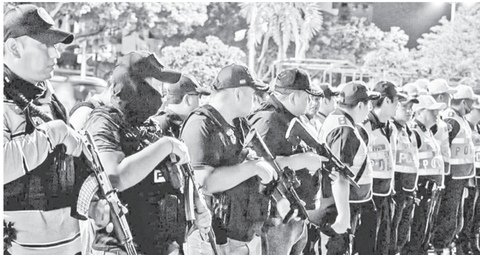
Despliegue de policías en Santa Cruz luego de la ola de asesinatos.

Durante los operativos realizados el fin de semana se logró el arresto de varios ciudadanos extranjeros.