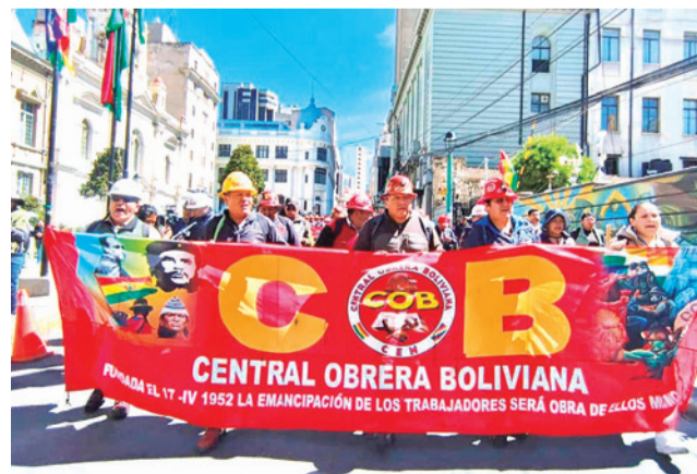
Marcha de la COB, ayer en La Paz. MARKA REGISTRADA

El dirigente cuestionó que persista el desabastecimien-