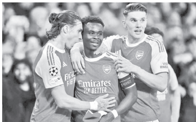
El partido del Arsenal con el Atlético de Madrid. UEFA

En el cotejo de ida hubo empate 1-1 en Madrid, por lo que al ganar en la revancha el conjunto londinense pasó a la final y definirá el título con el vencedor de la semifinal, que hoy sostendrán Bayer Múnich, de Alemania, y París Saint-Germain, de Francia.