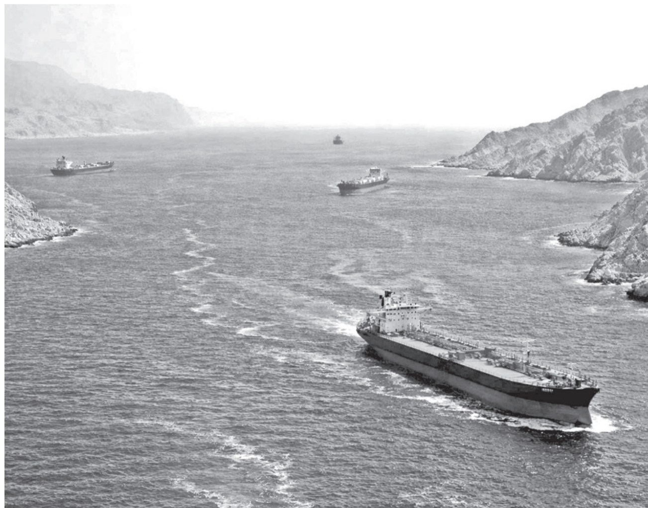
El estrecho de Ormuz tiene una longitud aproximada de 160 a 167 km y una anchura que varía entre 39 y 97 km.

Guerra. El secretario de Estado asegura que el “Proyecto Libertad” para guiar a buques mercantes por el estrecho es una medida defensiva